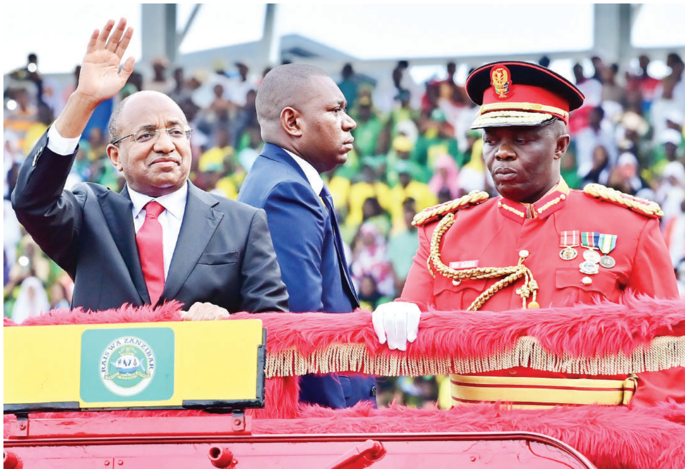
Rais wa Zanzibar, Dk. Hussein Ali Mwinyi, akiwapungia mkono wananchi wakati akiwasili katika Uwanja wa Amani, jijini Zanzibar jana, wakati wa maadhimisho ya miaka 60 ya Mapinduzi ya Zanzibar.

• Viongozi kimataifa, wastaafu washiriki, gwaride, zana za kivita vyanogesha... Endelea ukurasa 2