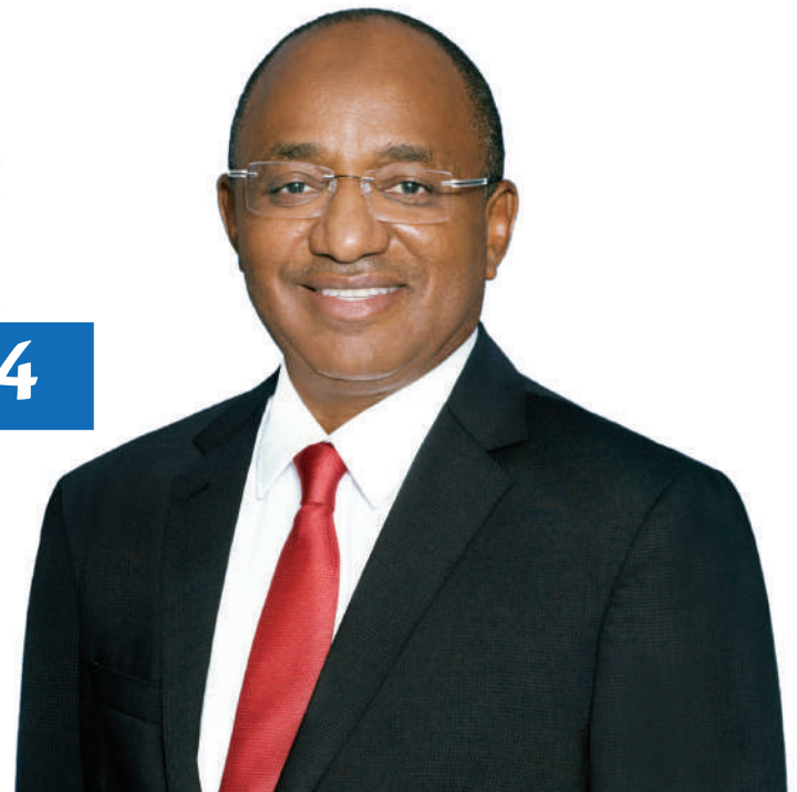
Mh. Dr. Hussein Ali Mwinyi Rais wa Serikali ya Mapinduzi Zanzibar

WAZIRI, BODI, MENEJIMENT NA WAFANYAKAZI WA WIZARA YA AFYA ZANZIBAR, WANAMPONGEZA DKT HUSSEIN ALI MWINYI RAIS WA ZANZIBAR NA MWENYEKITI WA BARAZA LA MAPINDUZI PAMOJA NA WANANCHI WOTE WA ZANZIBAR KATIKA KUADHIMISHA MIAKA 60 YA MAPINDUZI MATUKUFU YA MWAKA 1964