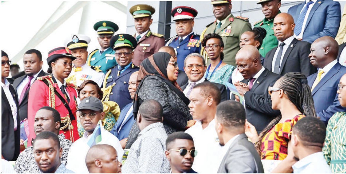
Rais Samia Suluhu Hassan akisalimiana na viongozi mbalimbali wali-ohudhuria sherehe za maadhimisho ya miaka 60 ya Mapinduzi ya Zanzibar katika Uwanja wa Amani jana.