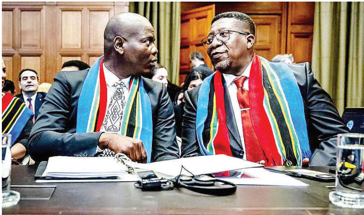
Waziri wa Sheria wa Afrika Kusini, Ronald Lamola na balozi wa nchi hiyo Uholanzi, Vusimuzi Madonsela wakiteta jambo ndani ya Mahakama ya Haki ya Kimataifa wakati wakifuatilia kesi waliyofungua dhidi ya Israel jana.