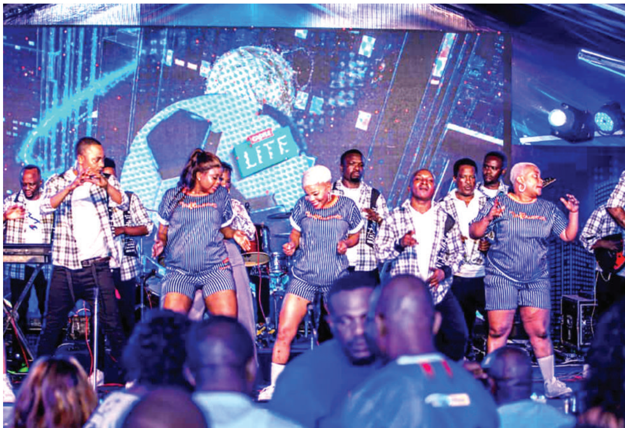
Wanamuziki wa bendi ya Twanga Pepeta wakifanya vitu vyao kwenye uzinduzi wa albamu ya 15 ya 'Chombo ya Fundi', jijini Dar es Salaam hivi karibuni.

kuhakikisha mashabiki wetu wanapata kile wanachotaka," alisema. Bendi hiyo ilianzishwa mwaka 1998 na imetoa albamu 14 zilizochangia kupa umaarufu, na sasa imezindua ya 15. Baadhi ya albamu hizo ni "Jirani" iliyotoka mwaka 2000, "Chuki Binafsi" 2002, "Password" mwaka 2006, "Mtaa wa Kwanza" mwaka 2008, "Usiyaogope Maisha" 2015 na sasa Chombo ya Fundi" mwaka 2022.