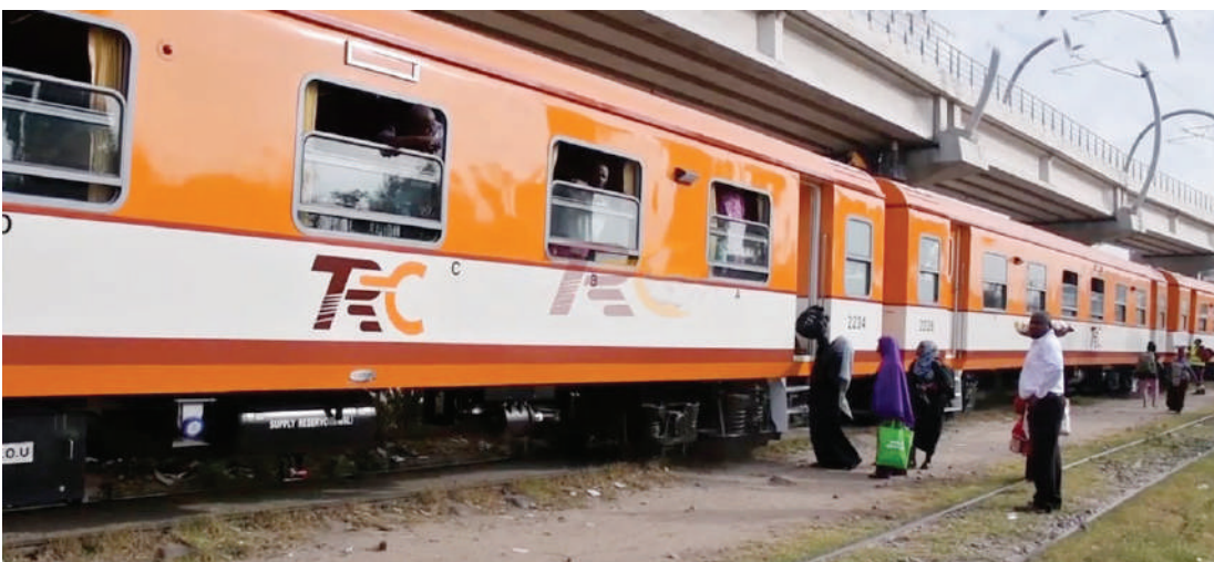
Ndivyo yalivyo mabehewa mapya yaliyoingia nchini mwezi huu, yakiwa na huduma zote zenye stadi za kisasa.