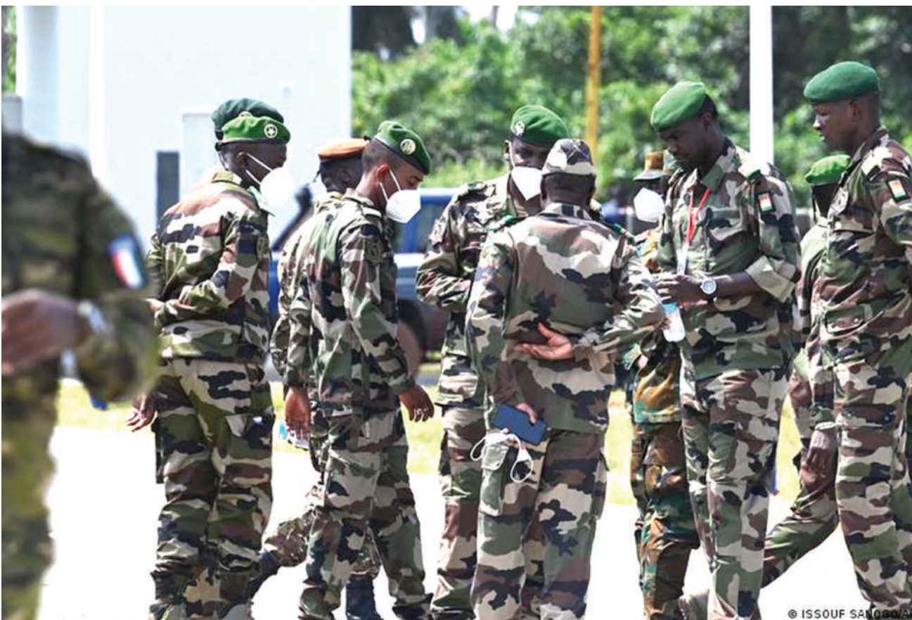
Wanajeshi wa Mali katika picha.

Rwanda pia ilisema mauaji ya hivi karibuni ya Kishishe dhidi ya raia, katika eneo linalodhibitiwa na M23, “yalitiwa hisia” na “uzushi wa serikali ya DRC” na kuongeza kuwa kuna dalili kuwa ni “makabiliano kati ya M23 na makundi haramu yenye silaha yanayoshirikiana na FARDC”.