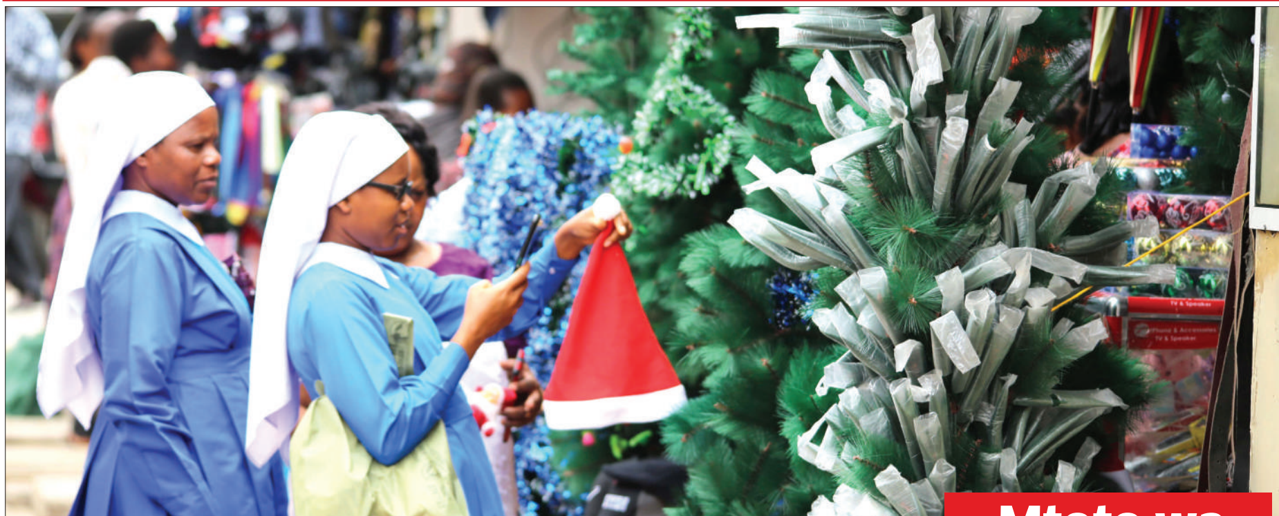
Watawa wa Kanisa Katoliki ambao majina yao hayakupatikana, wakichagua miti ya Krismasi ikiwa ni maandalizi ya sikukuu hiyo ambayo huadhimishwa Desemba 25, kila mwaka, kama walivyokutwa mtaa wa One Way, jijini Dodoma jana.

WAZIRI abaini tatizo lilipo, atoa angalizo... Endelea Uk. 2