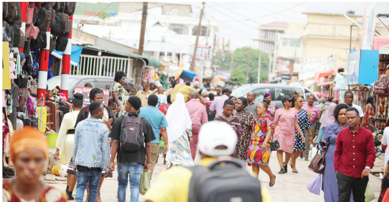
Baadhi ya wananchi wakipita kwenye mtaa wa One way Jijini Dodoma jana kwenye maduka mengi ya biashara mbalimbali wakiwa na pilika-pilika za kutafuta mahitaji ya Sikukuu za Krismasi.

Ardhi SACCOS ni Chama cha Ushirika wa Akiba na Mikopo cha Wizara ya Ardhi ambacho kilianzishwa rasmi mwaka 2020 na kina usajili na leseni kutoka Benki Kuu ya Tanzania na kina wanachama takribani 331 nchi nzima.