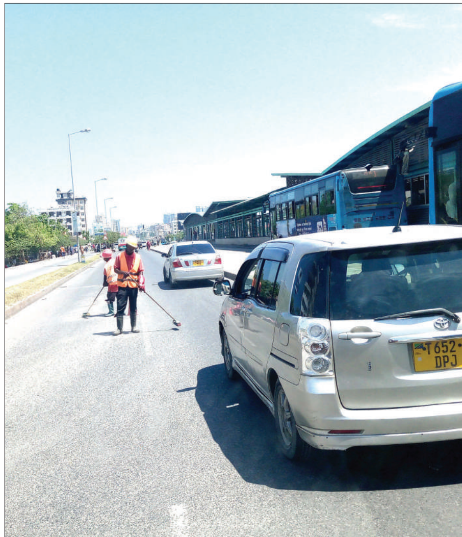
Wafagiaji wa barabara wakiwa kazini kwenye Barabara ya Morogoro, eneo la Mago-meni Mapipa, Dar es Salaam juzi, bila kuweka alama inayoashiria kuwa wako kazini, kitendo ambacho kinaweza kusababisha ajali.