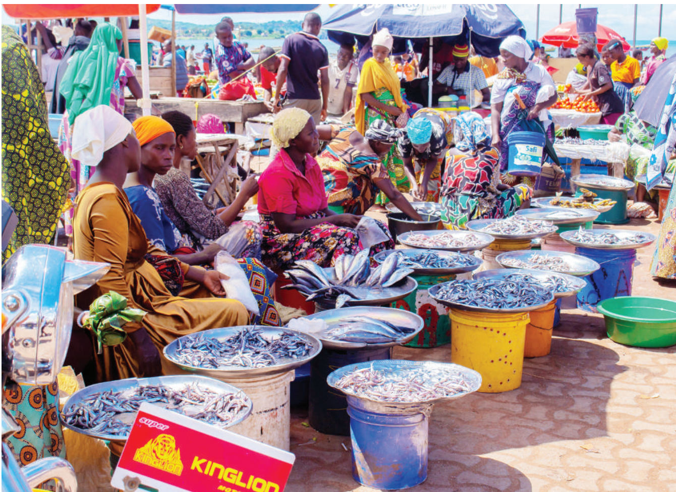
Baadhi ya wafanyabiashara kutoka Mwalo wa Kibirizi mkoani Kigoma wakiendelea na biashara zao.

Pamoja na mambo mengine, sheria hiyo inaelekeza kuwa yeyote anayewafanyisha kazi watoto kupita kiasi, au asiye-walipa ujira unaostahili, basi anavunja sheria hiyo.