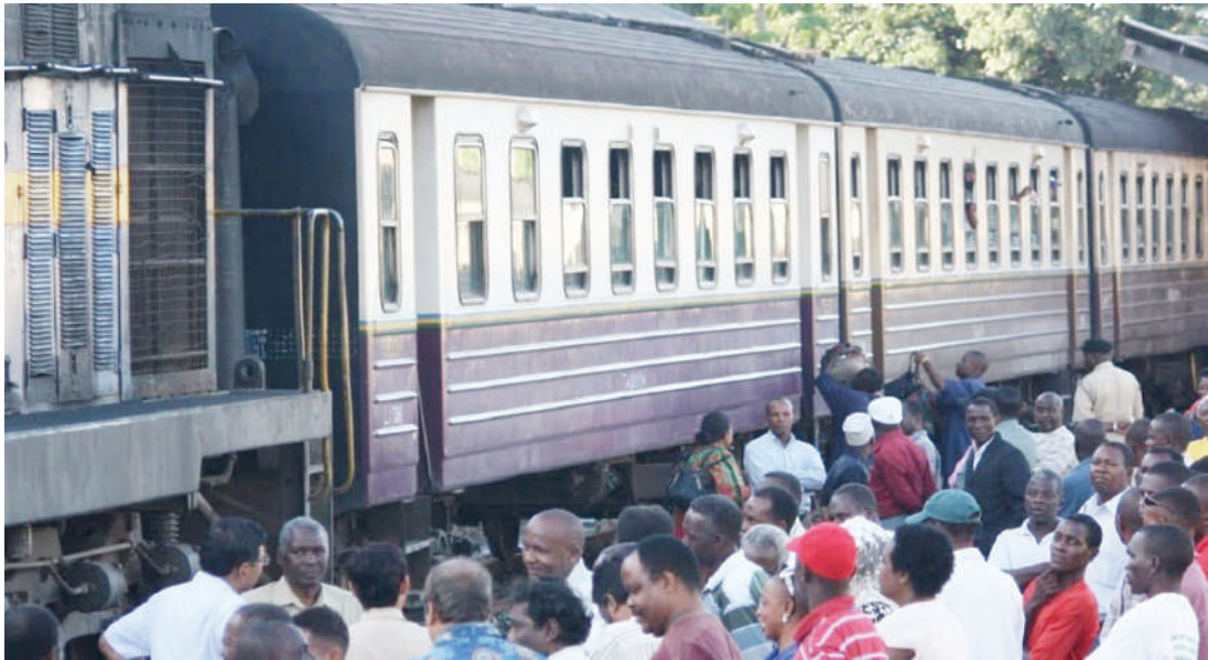
Abiria wa treni yenye mabehewa ya zamani, wakisubiri kupanda.

Hebu niwape mchapo kidogo kwa kionjo cha safari ya Kusini zama hizo. Ukitoka Dar es Salaam, na ukafika kwenye kivuko cha Mto Rufiji, uvukaji wake unapata salaam kamili, mara pantoni