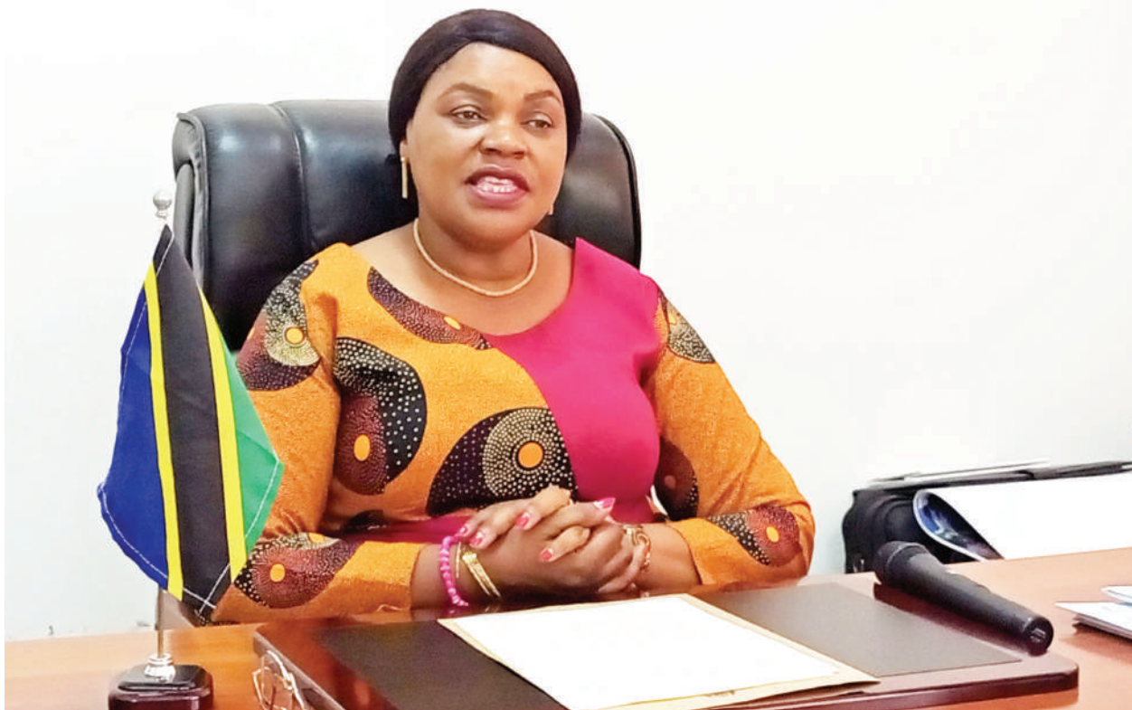
Waziri wa Nchi, Ofisi ya Rais, Menejimenti ya Utumishi wa Umma na Utawala Bora, Jenista Mhagama akihimiza utekelezaji wa agizo la kuwarejeshea michango waliyochangia katika mifuko ya hifadhi ya jamii watumishi walioondolewa katika utumishi wa umma kwa kughushi vyeti.