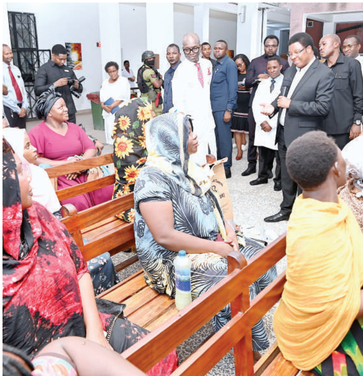
Waziri Mkuu Kassim Majaliwa akizungumza na wagonjwa wakati alipotembelea Hospitali ya Taifa Muhimbili jijini Dar es Salaam jana.