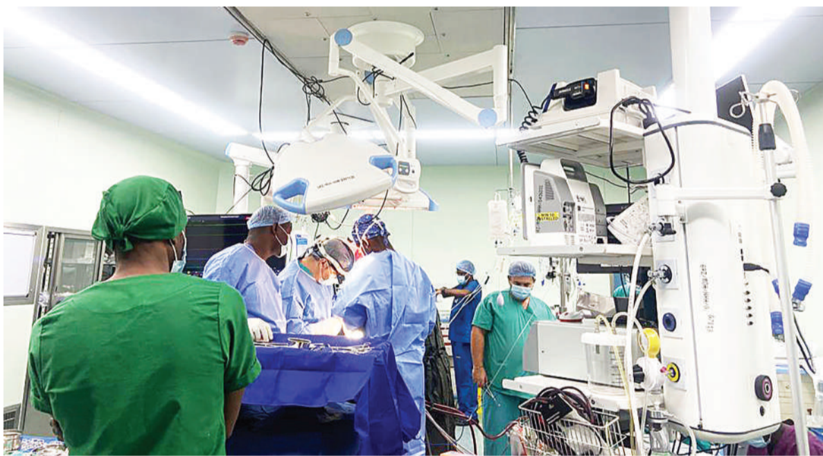
Madaktari Bingwa wa Taasisi ya Moyo ya Jakaya Kikwete (JKCI), wakifanya upasuaji wa moyo katika Hospitali ya Taifa ya Moyo ya Zambia jana, kwa kushirikiana na wataalamu wa hospitali hiyo.

"Ikumbukwe kwamba vifungu vinavyolalamikiwa vya sheria hiyo ya ndoa ambavyo mahakama hiyo iliamuru vibadilishwe, ni vya 13 na 17 vinyoruhusu mtoto wa miaka 14 na 15 kuolewa kwa ridhaa ya wazazi na amri ya mahakama.