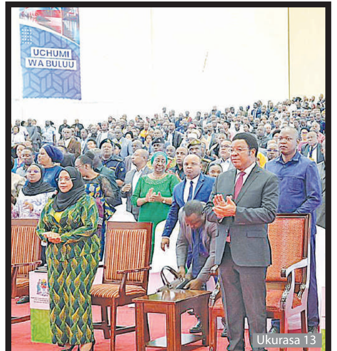
Majaliwa asafiri na ajenda Mazingira ya Rais; Kijaji anuia Azimio Dodoma