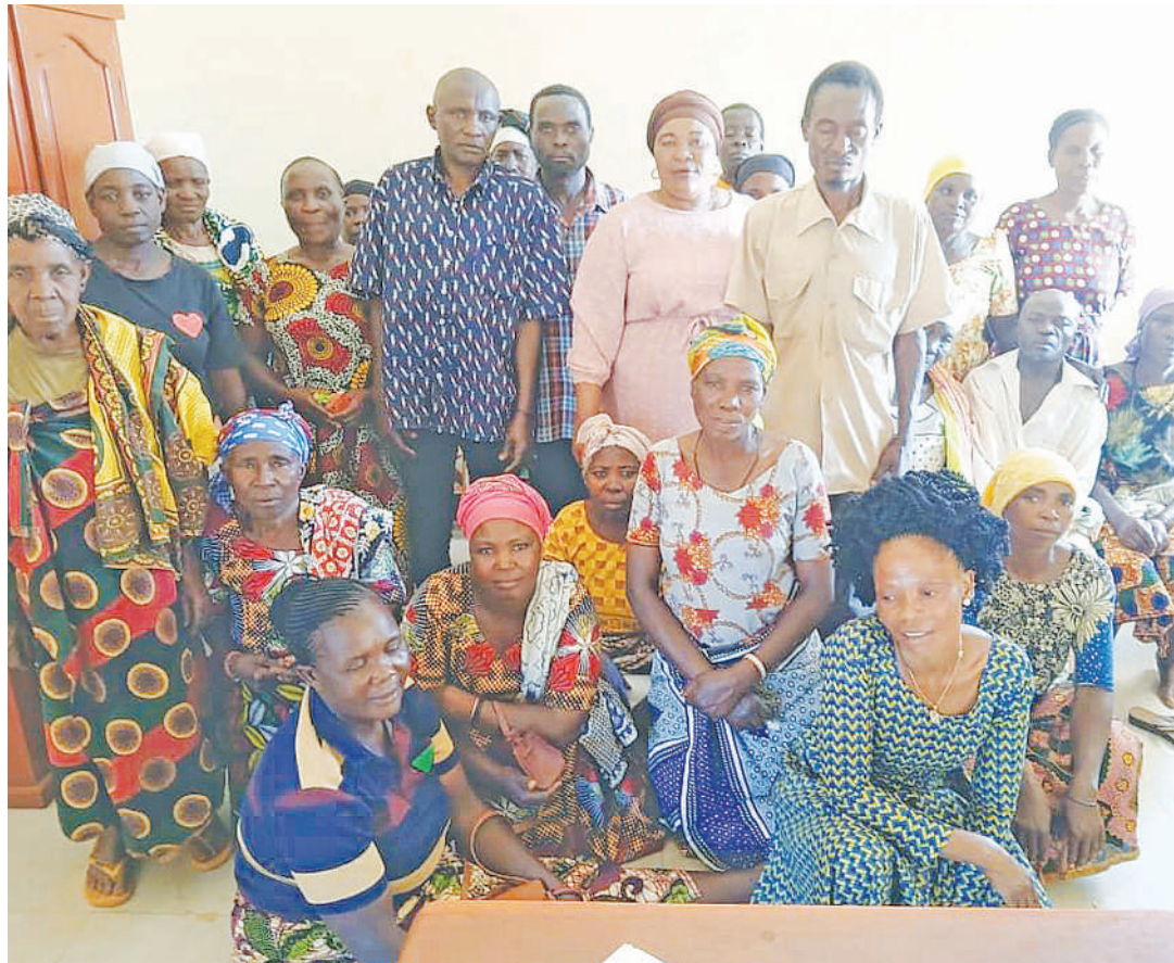
Shimila (katikati waliosimama), akiwa na baadhi ya wanachama wa Chama cha Wagumba Tanzania.

Shamila anaeleza kuona faraja baada ya Hospitali ya Taifa Muhimbili kuanzisha kituo maalum cha kuwahudumia, serikali na wadau wengine wa afya, kuwasadia kuchangia gharama za upatikanaji huduma hiyo,