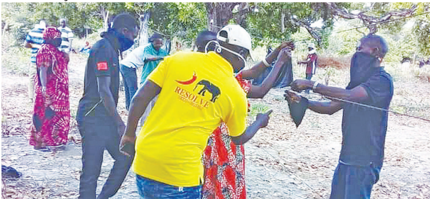
Shughuli za upandikizaji pilipili kudhibiti tembo kutoka hifadhini Mikumi, kuingia katika mashamba ya watu.

• Makali yake 'wamekoma' mwaka mzima wanabaki hifadhini