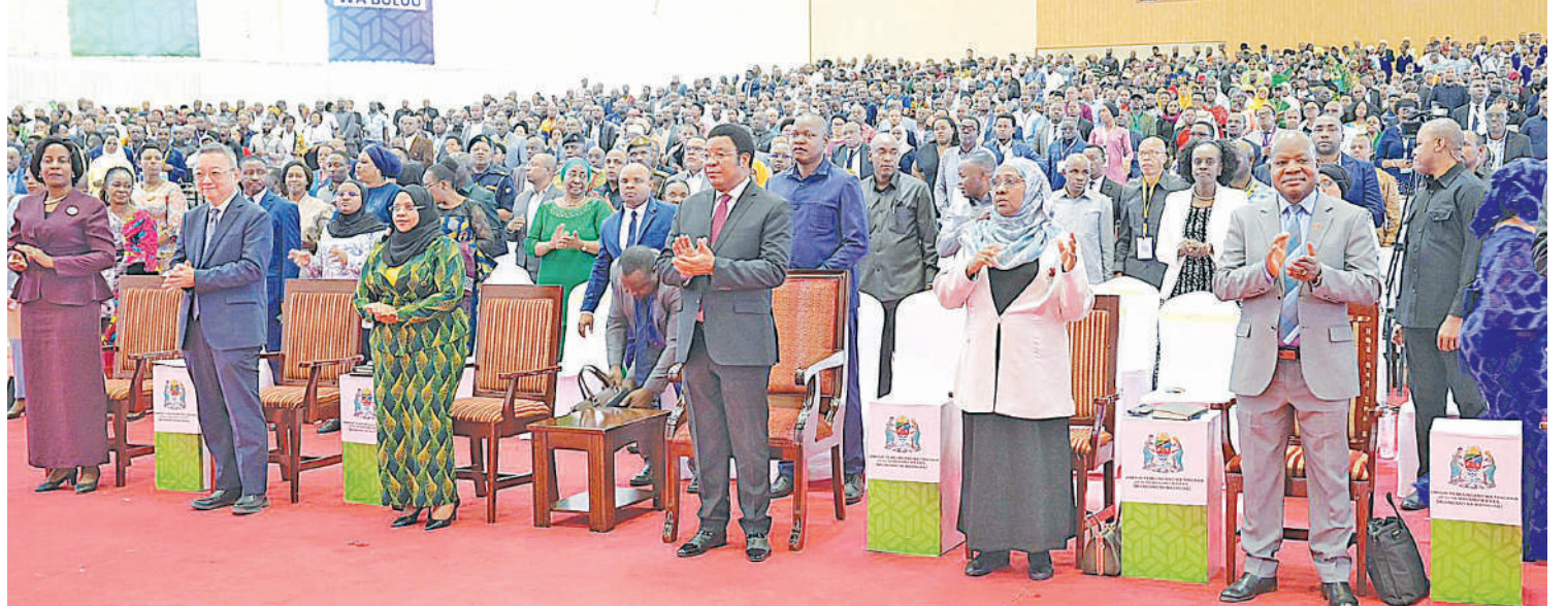
Waziri Mkuu, Kassim Majaliwa, akiwa katika kikao cha mazingira nchini, mwezi huu.