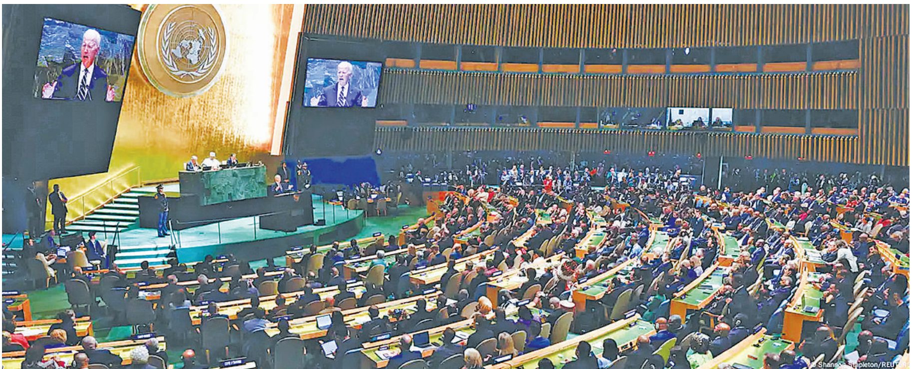
Mkutano wa 79 wa Hadhara Kuu ya Umoja wa Mataifa (UN) unaoendelea kufanyika huko New York, Marekani.

Guterres alisema dunia haiwezi kwenda kama ilivyo sasa, ambako changamoto za vita vya Mashariki ya Kati, Sudan, Ukraine na maeneo mengine hazipatiwi majibu wala kutatuliwa. DW