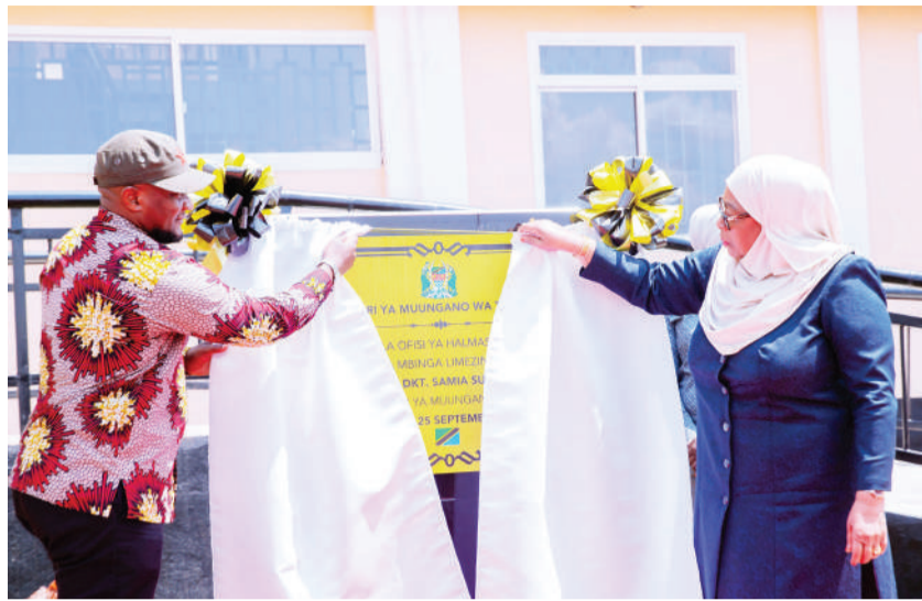
Rais Dk. Samia Suluhu Hassan akivuta kitamba kuushiria ufunguzi wa jengo la Ofisi ya Mkurugenzi Mtendaji wa Halmashauri ya Wilaya Mbinga, mkoani Ruvuma jana. Kushoto ni Waziri wa Nchi, Ofisi ya Rais, Tawala za Mikoa na Serikali za Mitaa (TAMISEMI), Mohamed Mchengerwa.

Waziri wa Kilimo, Hussein Bashe aliwaahidi wakulima wa eneo hilo kuwa kuanzia mwakani, vituo vyote vya NFRA vitakuwa na mashine za kisasa za kusafisha mahindi, hivyo wakulima hawatosafisha kwa mikono kama wafanyavyo sasa.