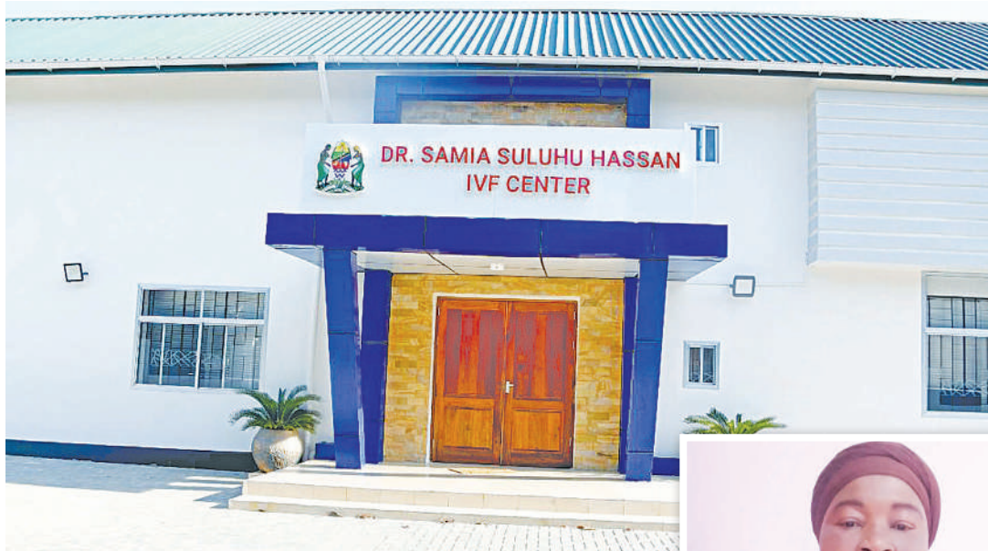
Kituo cha Upandikizaji Mimba, kilichofunguliwa hivi karibuni katika Hospitali ya Taifa Muhimbili, Dar es Salaam.

tena na kudumu katika ndoa miaka 11 hadi mwaka 2006, akaachika tena.