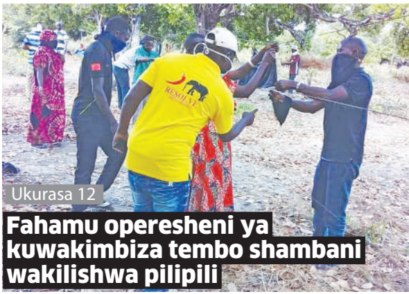
Fahamu operesheni ya kuwakimbiza tembo shambani wakilishwa pilipili