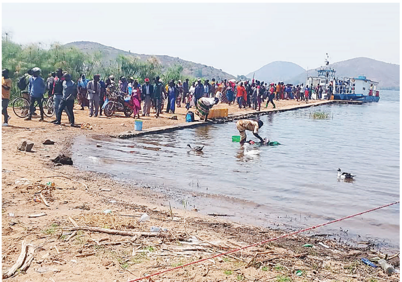
Abiria wakishuka katika kivuko cha MV Mara, eneo la Kurugee, kinachounganisha Musoma Vijijini na Mwibara, mkoani Mara, juzi. Kwa mijibu wa abiria, gati la kivuko hicho, linaonekana kujengwa chini ya kiwango na kusababisha lifunikwe na maji.

Baadhi ya wananchi wa Kata ya Bubiki walisema kukosekana na huduma za afya wamekuwa wakipata shida ya kupata matibabu hali inayowalazimu kwenda kwenye kata za jirani ikiwamo Busangwa.