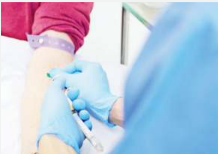
Uchunguzi wa saratani kupitia vipimo vya damu umependekezwa kwa muda mrefu na wanasayansi.

Dk. Crosby anasema ushirikiano huu "Utachangia kuleta mabadiliko katika mifumo ya afya na kuondokana na hali ya kukabiliana na saratani ikiwa katika kiwango ambacho gharama ya tiba iko juu na badala yake kubuni mbinu ya ugunduzi wa mapema ambayo pia gharama ya matibabu ni bei nafuu." BBC