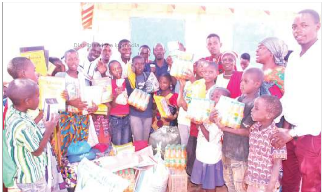
Watoto wa kituo Shime cha wanaoishi katika mazingira magumu, eneo la Makulu, jijini Dodoma, wakifurahia misaada mbalimbali baada ya kukabidhiwa na Shirika lisilo la kiserikali la Thamani ya Vijana Ujasiriamali na Ukuaji wa Kiuchumi (VYEEG), kituoni hapo, juzi.

Aliomba kuongezewa wataalamu zaidi wa kilimo cha zao hili ili kuwahudumia wakulima wengi hasa msimu wa kilimo unapoanza hadi mavuno ili kuongeza tija.