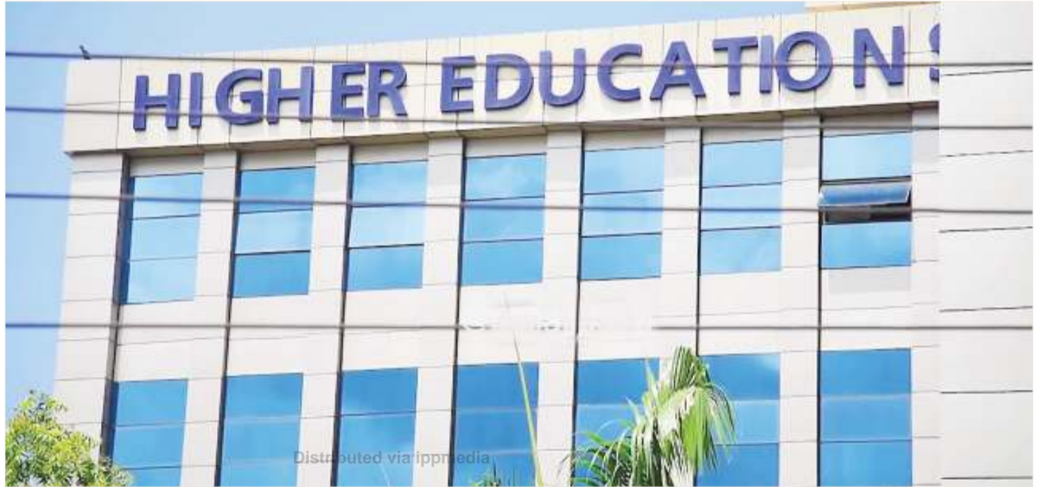
Ofisi za Bodi ya Mikopo ya Elimu ya Juu Nchini (HESLB).

Kwa upande mwingine kuna suala la kina cha vizuizi vya kuingia katika viunganishi taarifa,