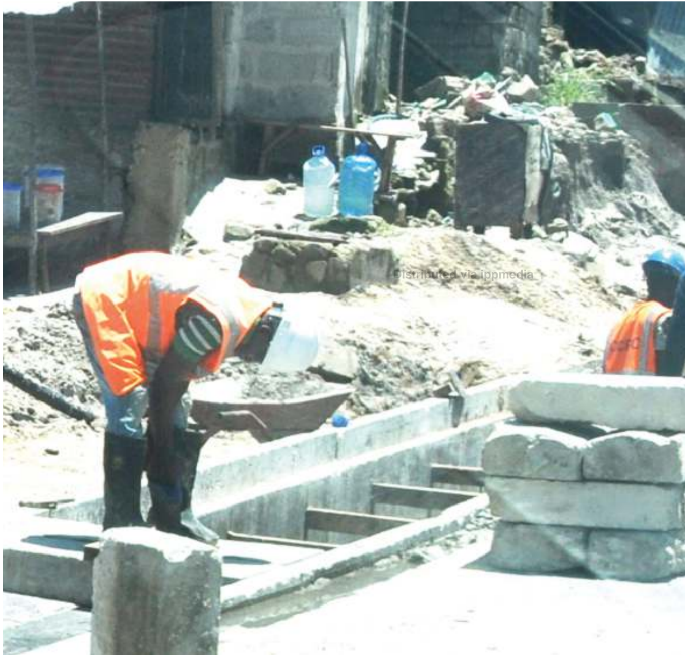
Mafundi wakijenga miundombinu ya maji kwenye barabara mpya ya kiwango cha lami, inayounganisha eneo la Tandale na Mwananyamala kwa Manjunju, jijini Dar es Salaam jana.

Kwa upande wao, wafanyabiashara wa matairi wameomba watumiaji kupatiwa elimu ili kuepusha kasoro ambazo zinajitokeza wakati wakiwa safarini kwa kusababisha athari zaidi na kuahidi kufuata sheria za uingizaji wa bidhaa zenye kiwango.