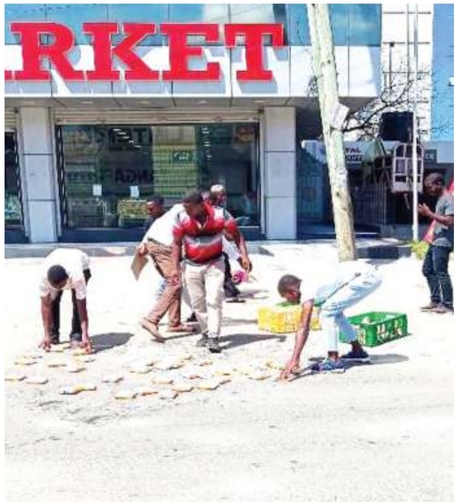
Wananchi wakisaidia kukusanya maziwa yaliyomwagika barabarani kutoka kwenye gari ndogo la kubebea bidhaa hiyo, katika Barabara ya Chang'ombe, jijini Dar es Salaam jana.

Mkuu wa wilaya Mwaipopo aliwataka wafanyabiashara wenye tabia ya kukwepa kulipa mapato ya serikali kuacha mara moja na badala yake wawe wazalendo wa kupenda nchi yao kwani fedha wanazolipa ndizo zinafanya maendeleo ya nchi ikiwamo ujenzi wa miundombinu ya barabara, hospitali, huduma za maji na mambo mengine mengi.