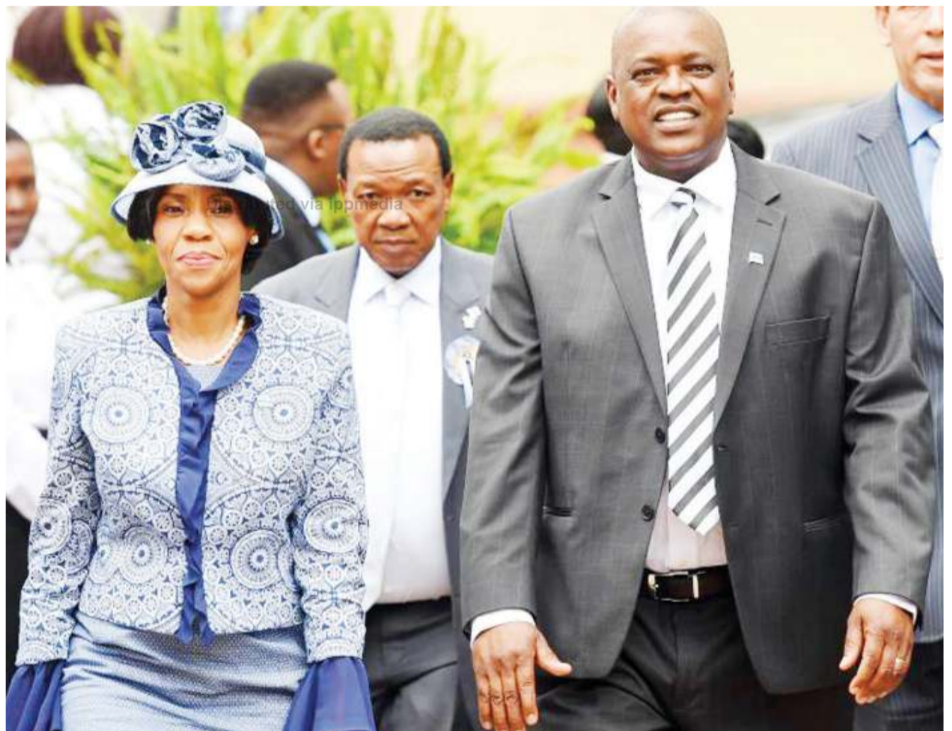
Rais wa Botswana, Mokgweetsi Masisi (kulia) akiwa na mke wake, Neo Masisi, baada ya kutangazwa kuwa rais wa nchi hiyo.

Mataifa 27 ya EU yamekubaliana jana kuchelewesha Brexit hadi Januari 31, pamoja na uwezekano wa Uingereza kujitoka mapema iwapo bunge la Uingereza litaidhinisha makubaliano ya kujitoka. DW