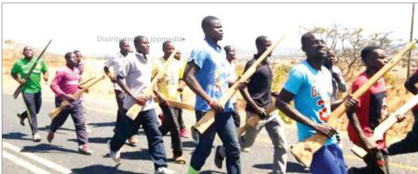
Vijana wa Wilaya ya Chunya, mkoani Mbeya, wakifanya mazoezi ya mgambo katika eneo la Kiwanja wilayani humo, mwishoni mwa wiki, huku wakiwa wameshika mituzo ya mfano. Mafunzo hayo, yalinzinduliwa na Mkuu wa Wilaya hiyo, Maryprisca Mahundi (hayupo pichani), mwanzoni mwa mwezi Oktoba.

Alisema katika wilaya ya Mbarali, waliutekeleza katika vijiji viwili ambavyo ni Kopyo na Mabadaga na kwamba katika Kijiji hicho cha Kopyo mashamba 636 yalipimwa na kutolewa hati.