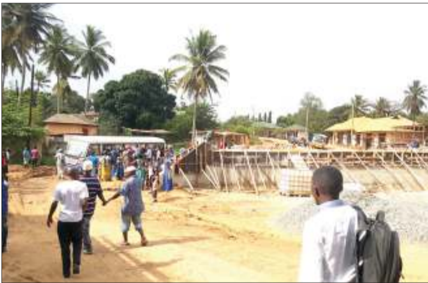
Wakazi wa Mbezi Msumi wakihangaika kutafuta usafiri wa kuwafikisha Mbezi kituoni. Mkwamo huu unaotokea mara kwa mara eneo la kwa Pesa Pesa.