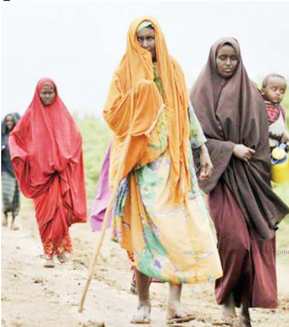
Baadhi ya raia wa Somalia.

U CHUNGUZI mpya uliofanywa na Taasisi ya utafiti wa masuala ya amani duniani (SIPRI), umeonyesha mabadiliko ya tabianchi yanatishia kuleta changamoto kubwa kwa walinda amani wa sasa na baadaye nchini Somalia.