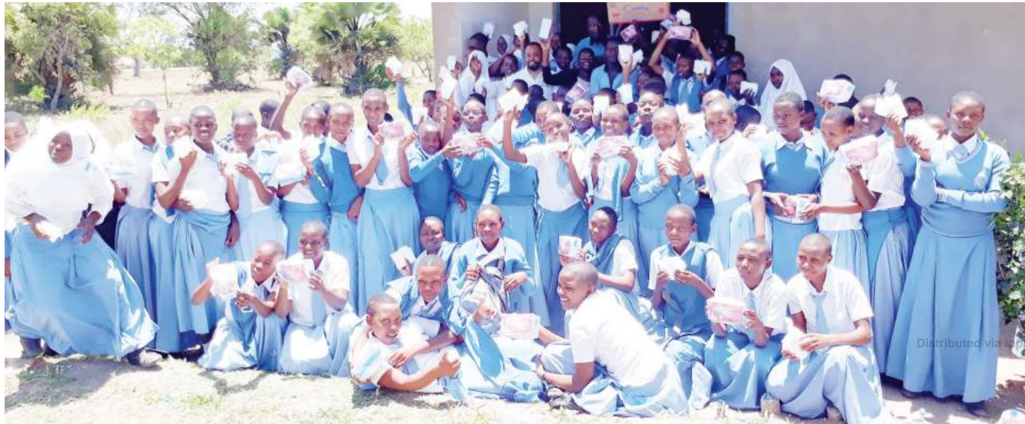
Wanafunzi wa kike, kidato cha nne, Shule ya Sekondari Masumbwe, wakiwa wameshikilia taulo za kike.

K UNA changamoto mbalimbali zinazowakabili watoto wa kike katika jamii, hasa za wafugaji katika dhima nzima ya kupata elimu.