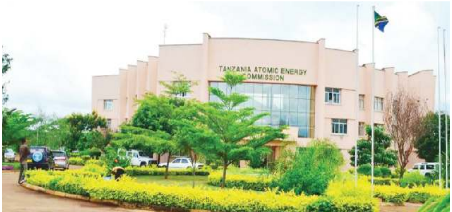
Ofisi za Makao Makuu ya TAEC, Njiro, jijini Arusha.

Vile vile, TAEC kupitia wizara hiyo katika kipindi cha miaka minne imefanikisha upatikanaji wa mashine za tiba ya saratani kwa njia ya mionzi zenye thamani ya