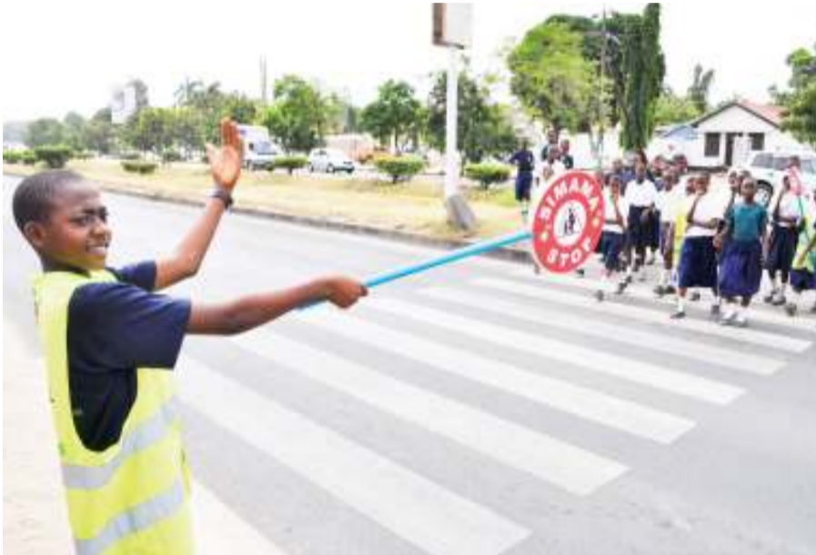
Mwanafunzi akiongoza wanafunzi wenzake kuvuka barabara kwenye alama ya pundamilia.

K UMEKUWAPO na tabia kwa baadhi ya madereva wa vyombo vya usafiri kutoheshimu uwepo wa matumizi ya alama za pundamilia (zebra crossing) na kutosimama kama sheria inavyoelekeza jambo linalosababisha kutokea kwa ajali zinazoweza kuepukika.