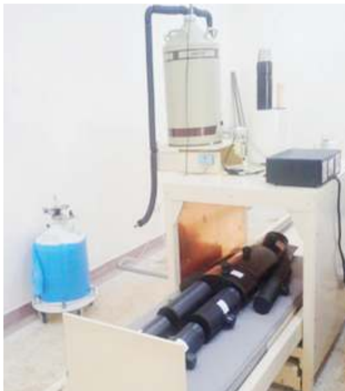
Baadhi ya mitambo katika maabara ya kisasa ya Tume iliyofungwa kwa ajili kusimamia na kudhibiti matumizi salama ya mionzi ambayo iliyokamilika mwaka huu.