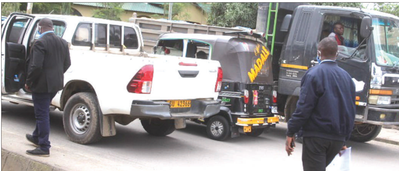
Moja kati ya pikipiki za magurudumu matatu (Bajaji) ikiwa imebanwa na magari mawili likiwamo lenye namba za usajili za serikali baada ya dereva wa bajaji hiyo, kuendesha bila kuzingatia usalama.

Naibu Waziri wa Mawasiliano na Teknolojia ya Habari, aliagiza mitandao yote ya simu kuwashughulikia mawakala wao wanaokwenda kinyume na sheria za nchi kabla hajachukua hatua dhidi ya kampuni hizo za simu.