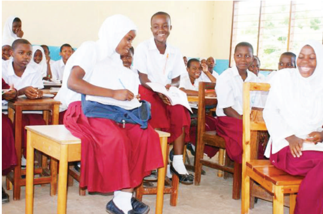
Wanafunzi katika shule mojawapo ya sekondari iliyoko wilayani Kilwa, mkoani Lindi, ilipokabiliwa na uhaba wa madawati.

Kayombo anatoa mgawanyiko kiwilaya, Halmashauri za Nach-