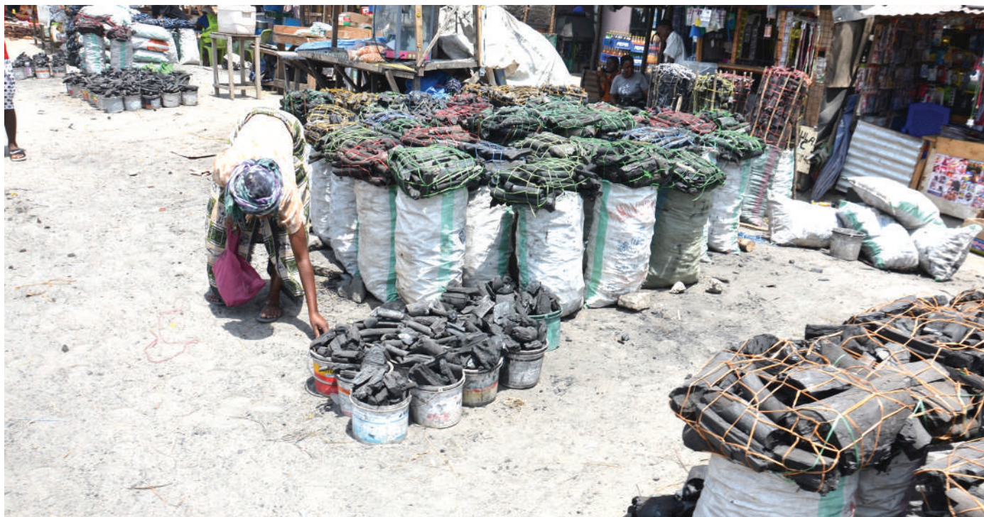
Mkazi wa Pugu jijini Dar es Salaam, akiokota mkaa katika kituo cha mabasi ya Kisarawe Mkoa wa Pwani jana.