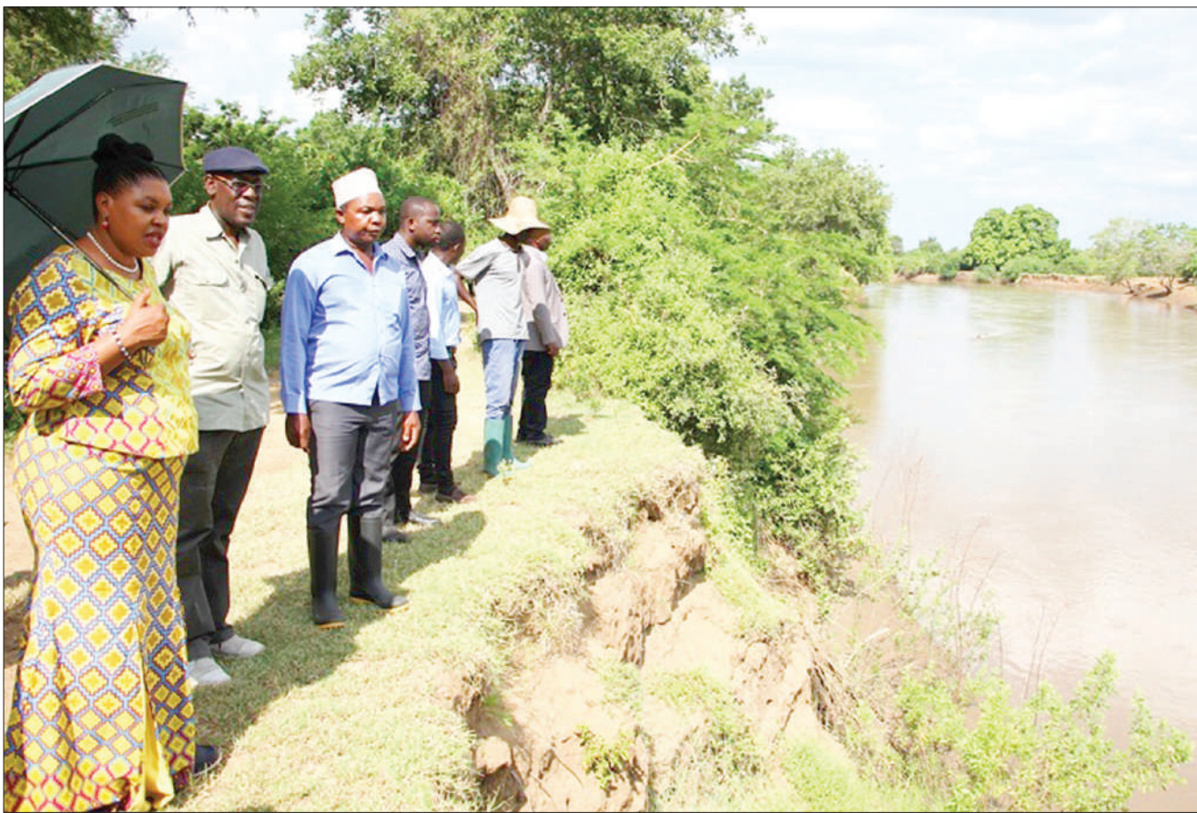
Waziri wa Nchi Ofisi ya Waziri Mkuu (Sera, Uratibu, Bunge, Kazi, Vijana, Ajira na Wenye Ulemavu), Jenista Mhagama, akikagua eneo la Mto Ruvu litakalotumika kama chanzo cha maji kwa shamba la Mkulazi lililoko Mkulazi, Morogoro Vijijini.