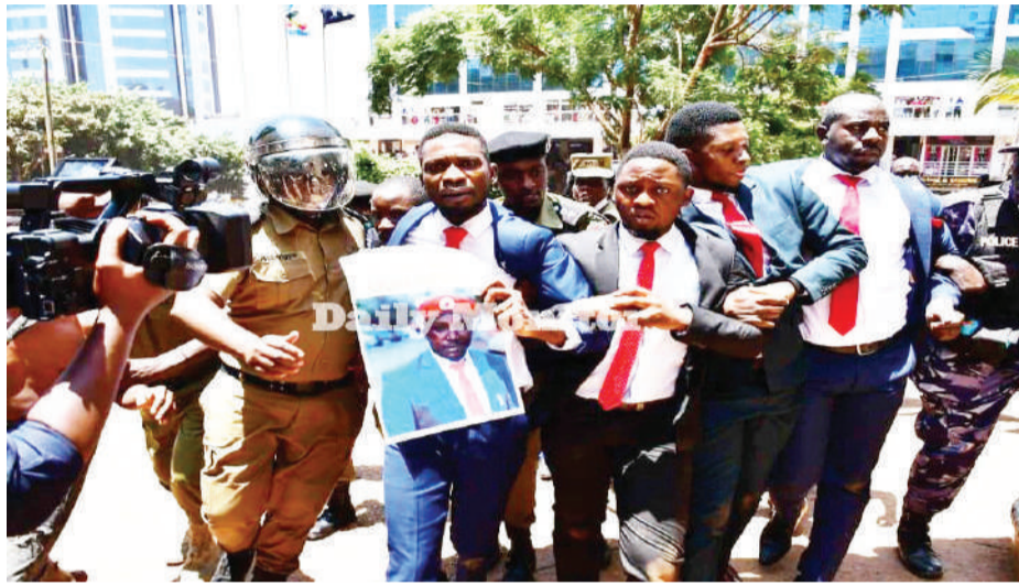
Bobi Wine na wanachama wengine wa chama hicho wakiwa wamekamatwa jana na polisi mjini Kampala, baada ya kufanya maandamano kupinga watu waliopotea kabla na baada ya uchaguzi.

Katika mkutano uliofanyika kupitia njia ya video, Bobi Wine alitoa wito kwa wafuasi