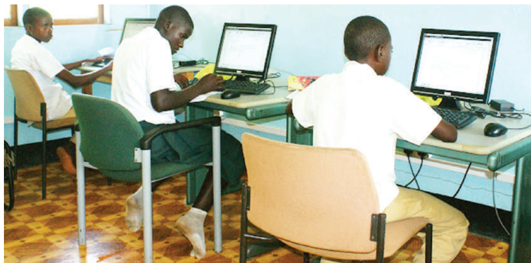
Wanafunzi wakitumia huduma za mtandao. PICHA: MTANADAO

yakazi wa ndani yaani vijakazi," anaeleza Lusajo.