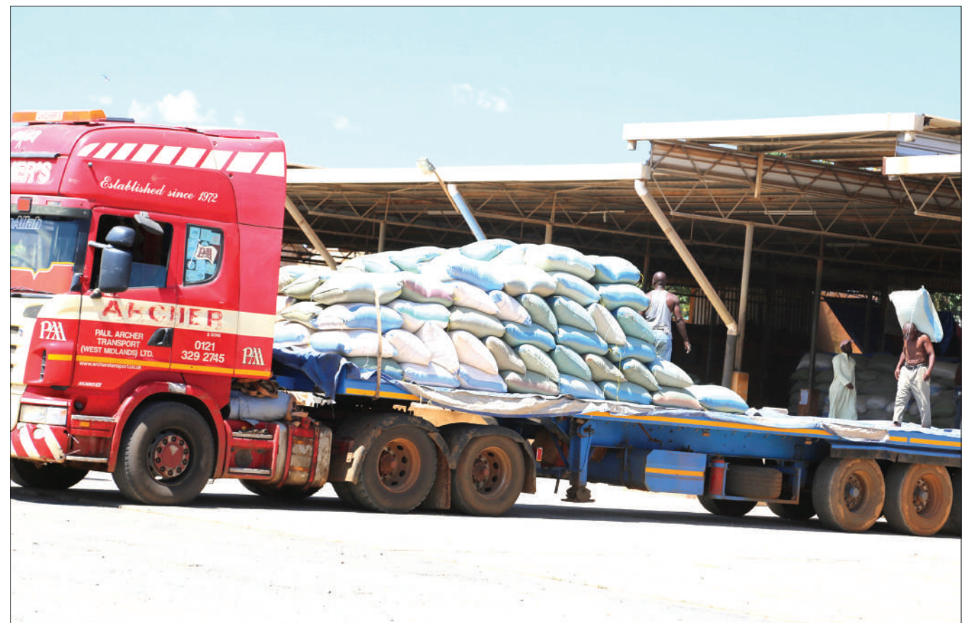
Wanunuzi wa mahindi wakiyapakia kwenye gari katika soko la kimataifa la mahindi Kibaigwa Wilaya ya Kongwa, mkoani Dodoma juzi, wauzaji wa mahindi kwenye soko hilo wamekuwa na malalamiko ya kukosa soko la mazao yao.

“Hata kwenye shule zetu tunatakiwa kuzingatia maslahi mapana ya mtoto kujenga miundombinu sahihi, vyoo rafiki hayo ndiyo maslahi mapana kwa mtoto kwa mfano pale wilayani Bahi tunatengeneza chumba kimoja kwa ajili ya wasichana kujisitiri ili wanapofika kwenye kipindi cha hedhi wapate sehemu ya kujihifadhi ndiyo maslahi ninayosemea hapa,” alisema.