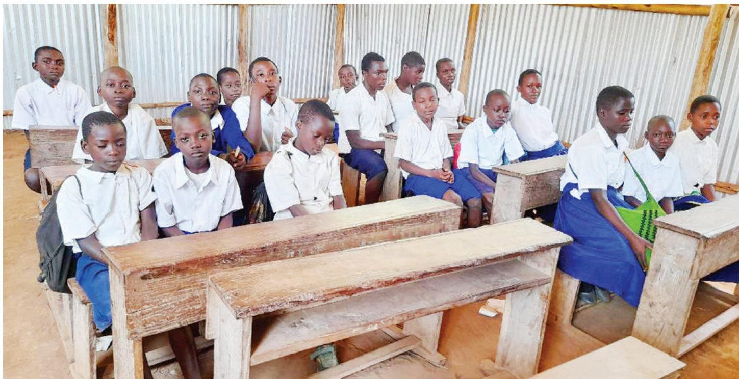
Wanafunzi wa darasa la sita katika Shule ya Msingi Mgumile, Kata ya Kagera, Manispaa ya Kigoma Ujiji, wakiwa katika madarasa ya muda, baada ya shule yao kuzingirwa na maji kutoka Ziwa Tanganyika.

• Miaka 3 mfululizo hakuna mabadiliko • Walimu wafunguka siri, REO ajipanga