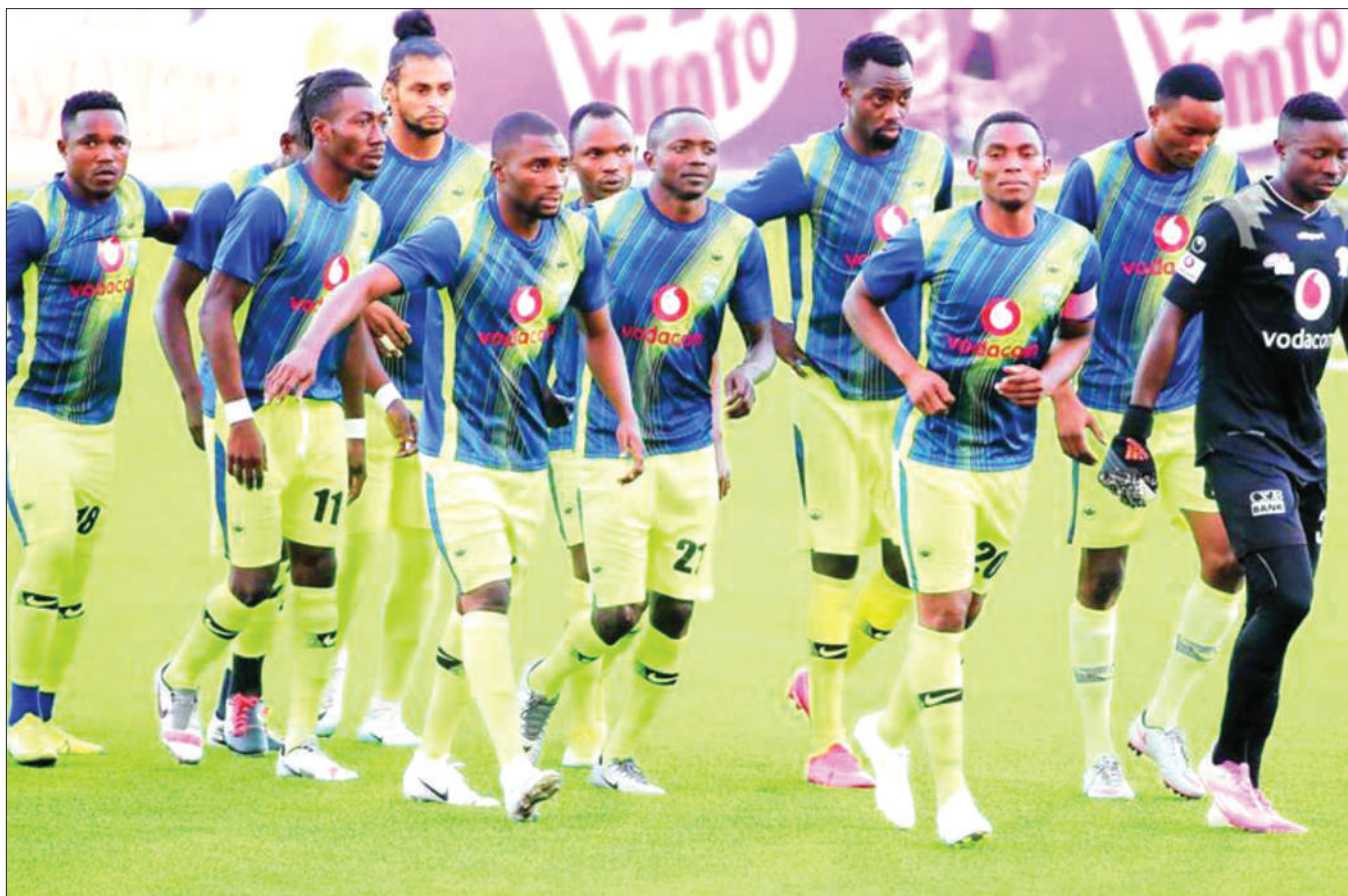
Kikosi cha Namungo FC kinachoshiriki michuano ya CAF, ambacho kesho kitakuwa na kibarua kigumu Uwanja wa Benjamin Mkapa kitakapoikaribisha Pyramids ya Misri.

Namungo ambayo ipo Kundi D katika michuano hiyo pamoja na Nkana FC ya Zambia, katika mchezo wa awali ilipoteza kwa penalti iliyofungwa na Soufiane Rahimi dakika 54 kwa mkwaju wa penalti.