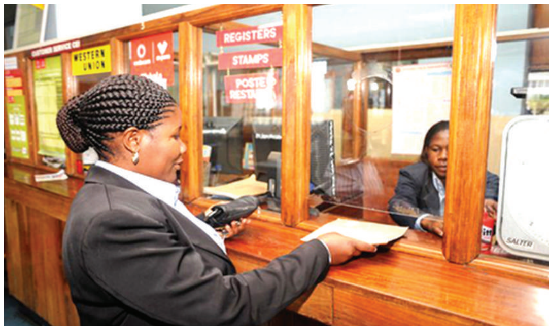
Huduma zikiendelea katika ofisi ya Posta, jijini Arusha.

"Pia, magari matano ya kusafirishia mizigo mizito yamenunuliwa na yanafanya kazi ya