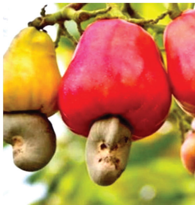
Korosho ikiwa tayari mtini.

Pia, anarejea kwamba mwaka uliopita aliwachukulia hatua za kisheria wafanyakazi 12, wak-