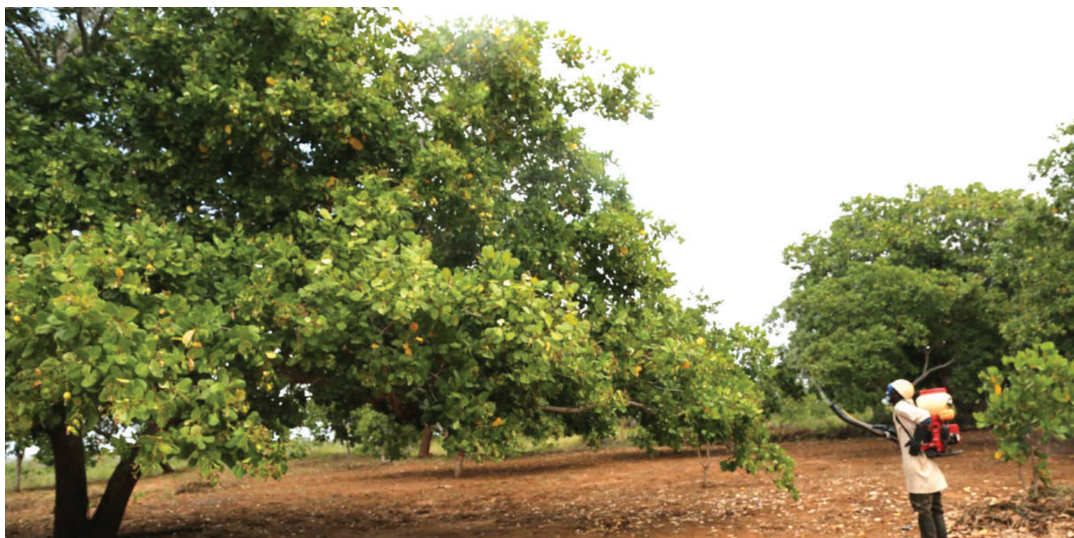
Shamba la korosho likiwa tayari limesafishwa, kwa mujibu wa kanuni za kilimo, mmiliki akilihudumua.