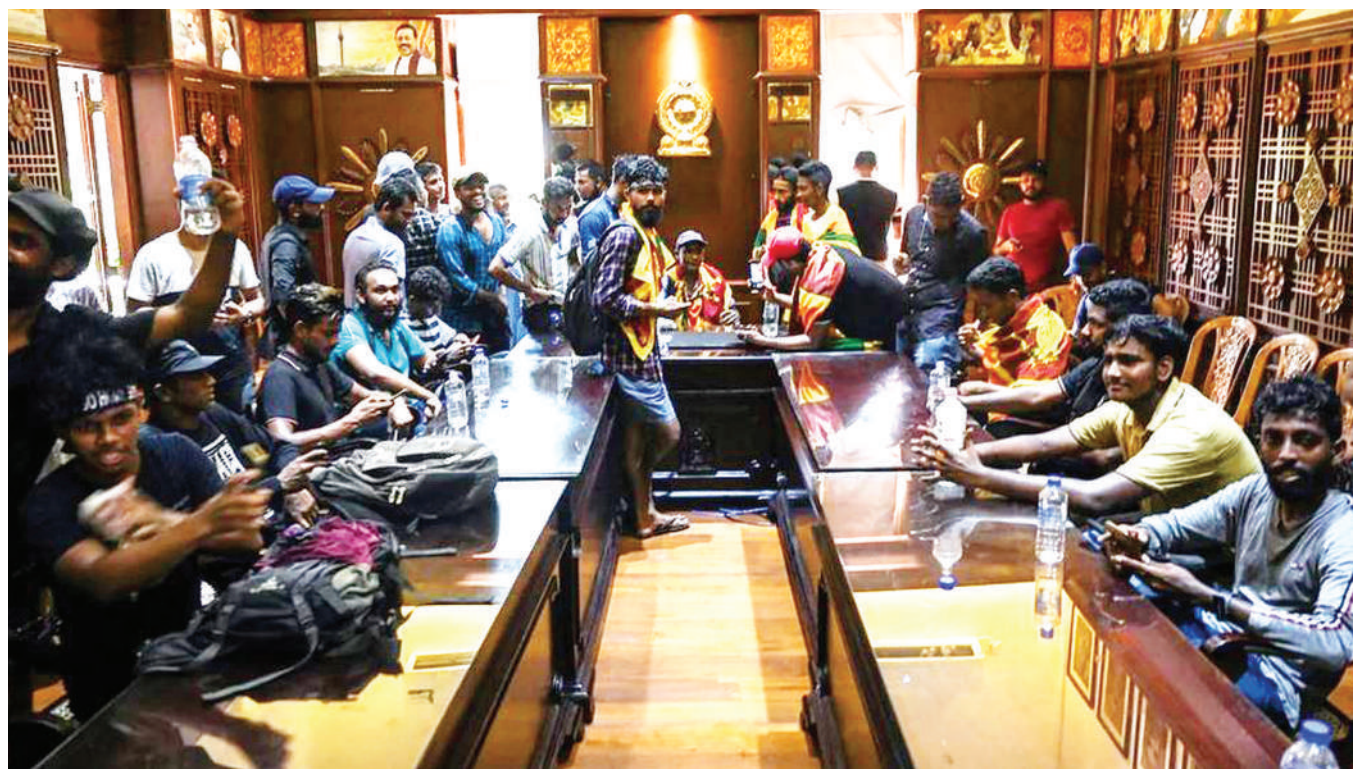
Waandamanaji wakiwa wamekaa katika chumba cha mkutano ndani ya ofisi ya Waziri Mkuu wa Sri Lanka mjini Colombo jana, baada ya kulikalia jengo la kiongozi huyo kwa siku kadhaa wakishinikiza ajiuzulu.