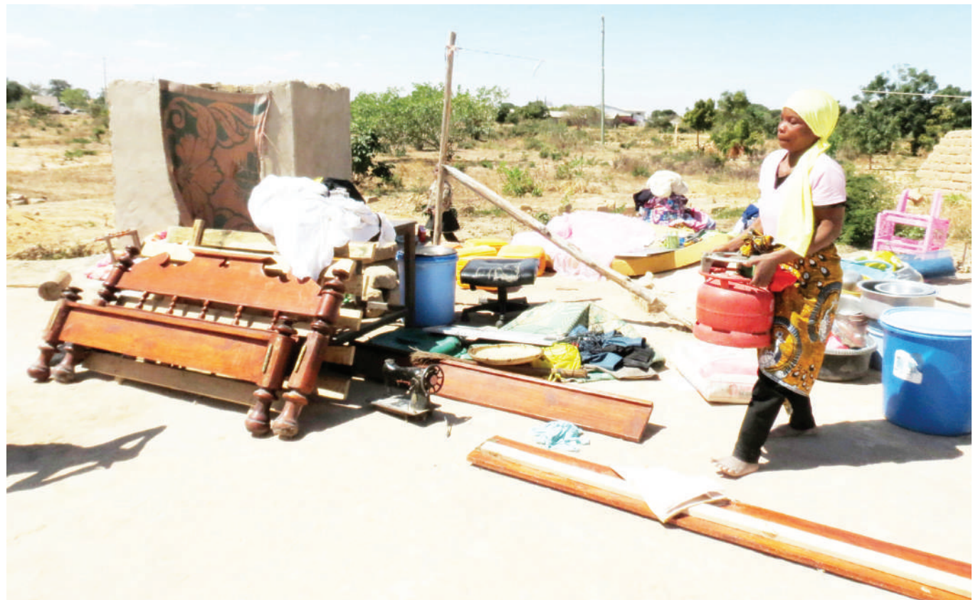
Mkazi wa Mtaa wa Relini, eneo la Mujuji, kata ya Kizota, jijini Dodoma, akihamisha vyombo vyake baada ya nyumba yake kubomolewa na wanaodaiwa mgambo wa Jiji hilo juzi, kwa madai kuwa wamejenga kwenye eneo lililolengwa kwa ajili ya uwekezaji.

Pamoja na OCS kuwaomba, wakazi hao hawakuwa tayari gari hilo kuondoka ndipo polisi walipoamua kutumia mabomu ya machozi kuwatawanya.