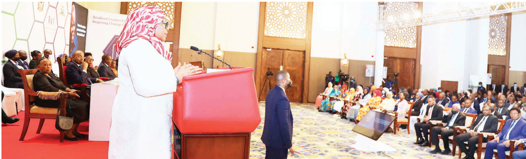
Rais Samia Suluhu Hassan, akizungumza na viongozi mbalimbali pamoja na wageni waalikwa kwenye maadhimisho ya pili ya Kumbukizi ya Rais wa Awamu ya Tatu Hayati Benjamin William Mkapa, Zanzibar jana.