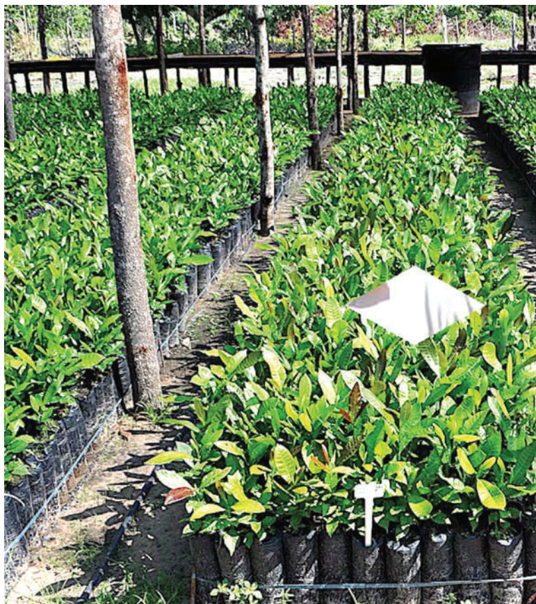
Miche bora ya korosho, kwa ajili ya kuwapatia wakulima.

• Mwandishi anapatikana kupitia simu:+255 787879707