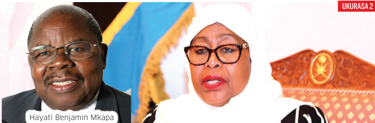
Hayati Benjamin Mkapa

Malori ya mizigo kuzuiwa kuingia D'Salaam