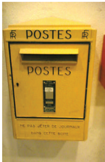
Pa kutumbukiza barua.

kusafirisha mizigo mizito sehemu mbalimbali nchini" anasema na kufafanua, shirika limenunua huduma ya kidigitali 'Posta Kiganjani' inayompa mteja uwezo zaidi kupata huduma hizo.