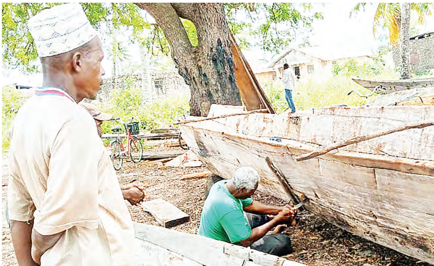
Baadhi ya wavuvi wa Kijiji cha Chwaka, Mkoa wa Kusini Unguja, wakifanya ukarabati wa zana za uvuvi kijijini hapo mapema wiki hii, kwa ajili ya maandalizi ya kwenda baharini kuvua.

Alisema bado kuna changamoto kubwa katika kuwatambua na ushirikishwaji wao katika vyombo vya serikali wakati umefika sasa kuona wanashirikishwa katika miradi ya majengo kwa kuokoa fedha za umma.