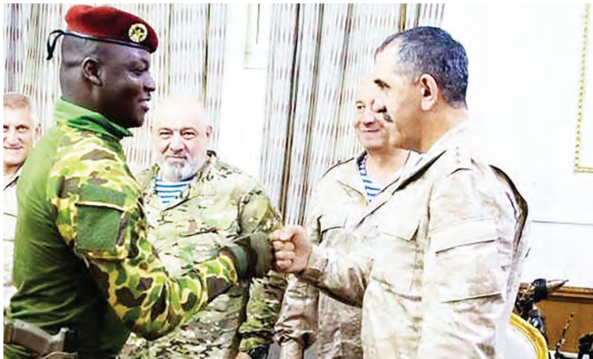
Rais wa Burkina faso, Ibrahim Traore, akisalimiana na Naibu Waziri wa Ulinzi wa Russia Yunus-bek Yevkurov, katika Ikulu ya nchi hiyo jana.