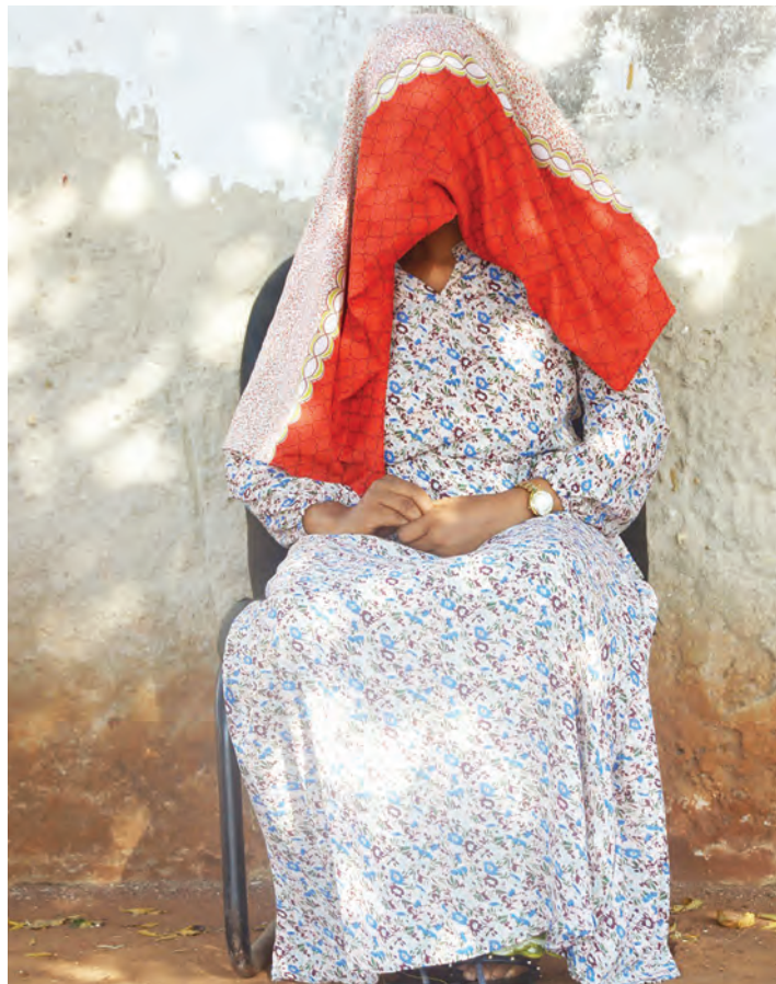
Mama wa mtoto akisimulia mkasa wa mwanawe.

“Nilizaa naye mtoto mmoja, ambaye ndiye huyo aliyembaka