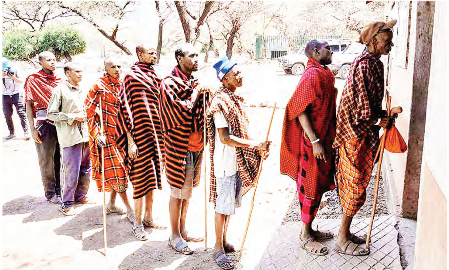
Baadhi ya wakazi wa Kijiji cha Olpiro wa jamii ya Wadatooga wanaoishi ndani ya eneo la Mamlaka ya Hifadhi ya Ngorongoro (NCAA), wakawa wamepanga foleni katika ofisi ya Kata ya Eyasi jana, kwa ajili ya kujiandikisha ili kuhama kwa hiari kwenye eneo la hifadhi.

Kutokana na utoroshaji huo, hali hiyo imesababisha kiwanda chao kukosa soko la nje walipokuwa wameingia mkataba kwa ajili ya kuwapeleka nyama.