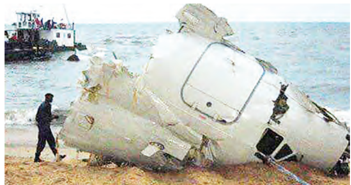
Mabaki ya ndege ya Zambian Air Force de Havilland Canada DHC-5D Buffalo yenye na usajili namba AF-319 ikiwa Pwani ya Gabon baada ya kuanguka na kuua watu 30 wakiwemo wachezaji 18 wa timu ya taifa ya Zambia.