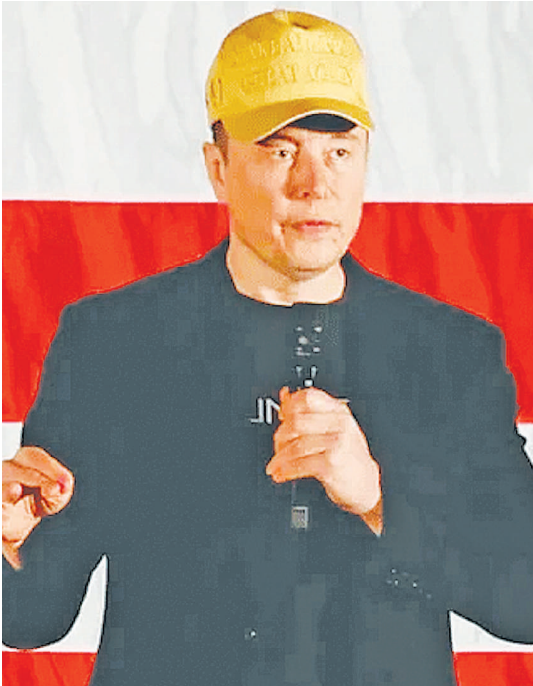
Elon Musk akizungumza jijini Pennsylvania.