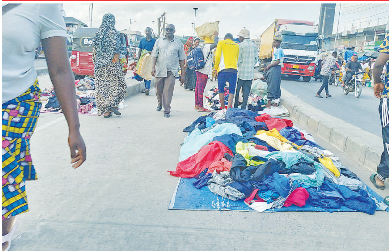
Wamachinga wakiendelea na biashara zao kwenye barabara ya mabasi ya mwendokasi, Mbagala Dar es Salaam jana, eneo ambalo lilizuiwa kufanywa biashara.

Luneula, alizifananiisha taarifa hizo na propaganda ambazo zimekuwa zikiibuliwa na baadhi ya watu wenye lengo la kupata umaarufu kwa wafugaji na kusababisha migogoro kati yao na serikali.