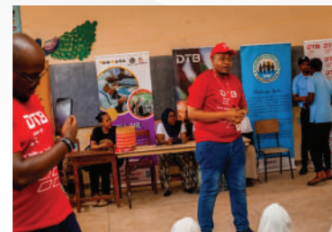
Wafanyakazi wa Diamond Trust Bank Tanzania wakitoa elimu ya fedha kwa wanafunzi wa Shule ya Sekondari ya Mwera, Shule ya Sekondari ya Mwera Pongwe na Shule ya Msingi ya Moachi iliwa ni sehemu ya mpango wake wa uwajibikaji kwa jamii

Mpango huu unaangazia ari ya Diamond Trust Bank katika kuleta mabadiliko chanya kupitia mipango mbalimbali ya uwajibikaji kwa Jamii kwa kuzingatia uendelevu, uwezeshaji na ushirikishwaji wa kifedha huku ikichangia kikamilifu ustawi na mafanikio ya vijana hapa nchini.