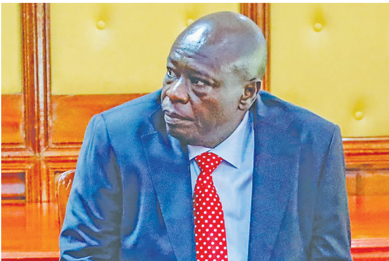
Naibu Rais Rigathi Gachagua.

Alisema mradi huo wenye thamani ya Sh. milioni 272 unatumia teknolojia ya 2G ambao unawezesha wananchi kupiga na kupokea simu za sauti huku wakitumia ujumbe mfupi kwa wakati mmoja (sms). Mwakymbe alisema TTCL imeanzisha mtandao wa mawakala wanaotoa huduma za kifedha kupitia T-PESA pamoja na mawakala wenye jukumu la kuuza vocha za muda wa maongezi na kusajili laini za simu.