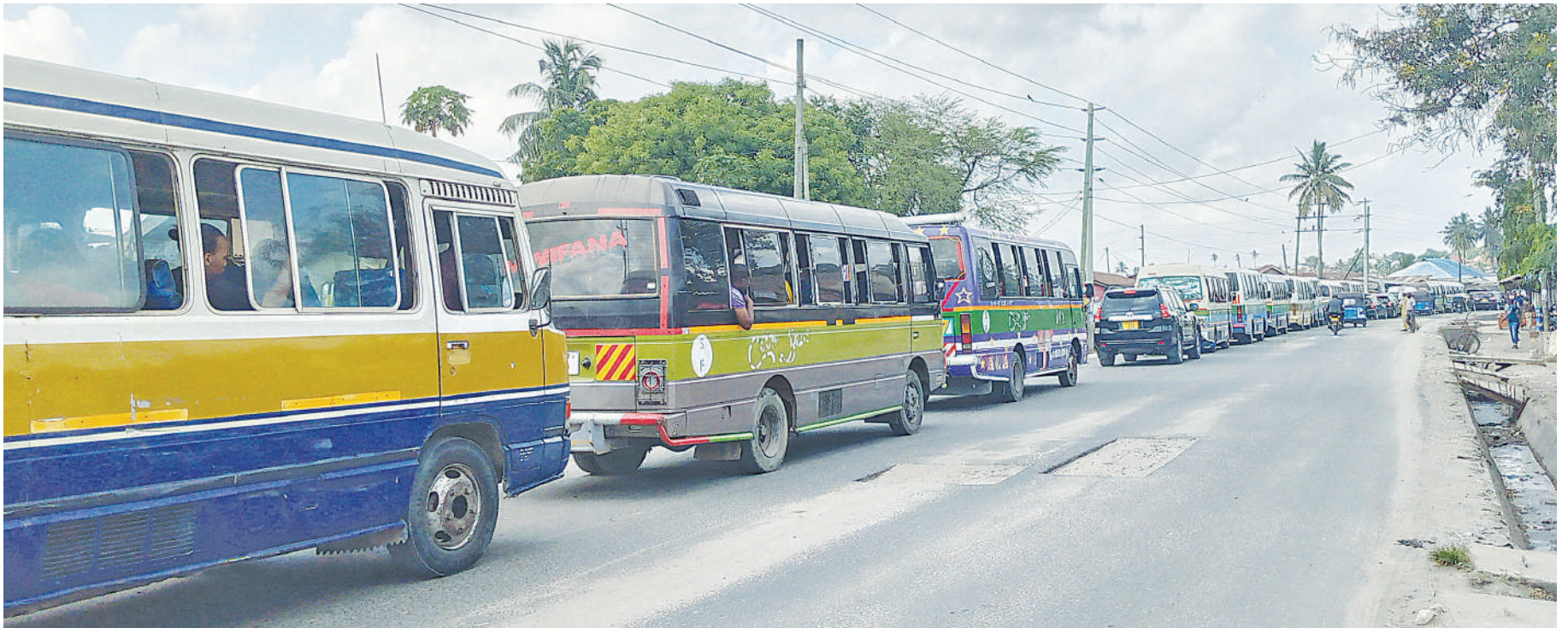
Magari yakiwa kwenye foleni katika barabara ya kuelekea Chamazi Dar es Salaam jana, mashuhuda walisema ilisababishwa na baadhi ya madereva wa daladala kushusha na kupakia abiria barabaranani.