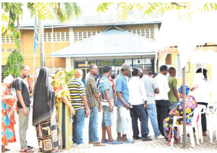
Wakazi wa jijini Dar es Salaam wakiwa kwenye foleni ya kupiga kura katika uchaguzi mkuu uliofanyika wiki iliyopita.

Wakati mwingine ildhaniwa kuwa huenda kutenga siku ya Jumapili kuwa