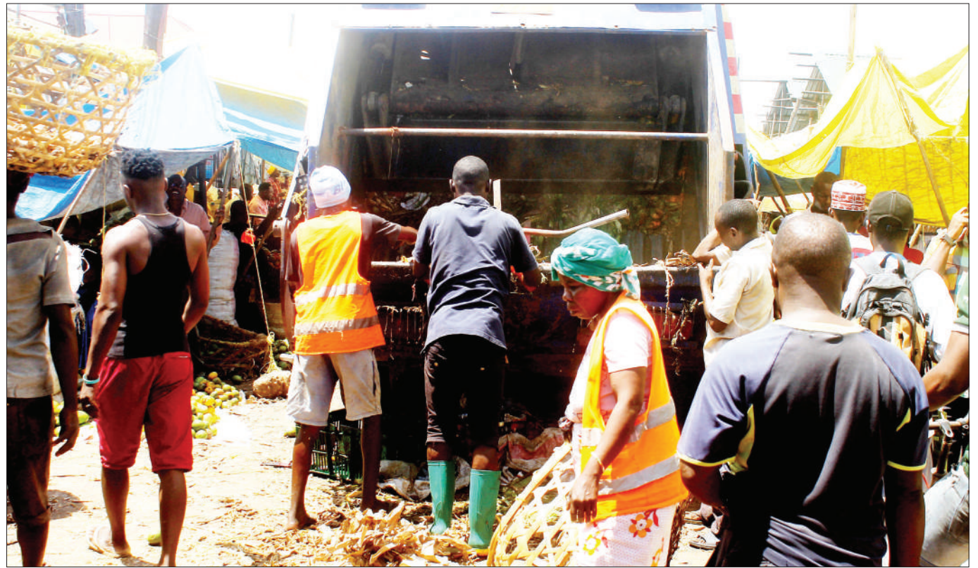
Wafanyakazi wa usafi wakizoa takataka zilizokuwa zimezagaa na kuhatarisha usalama wa afya za wafanyabiashara na wateja katika Soko la Buguruni, jijini Dar es Salaam jana.

“Sisi wana CCM na Watanzania wote tunatembea kifua mbele na tuna kila sababu ya kufanya hivyo kwasababu