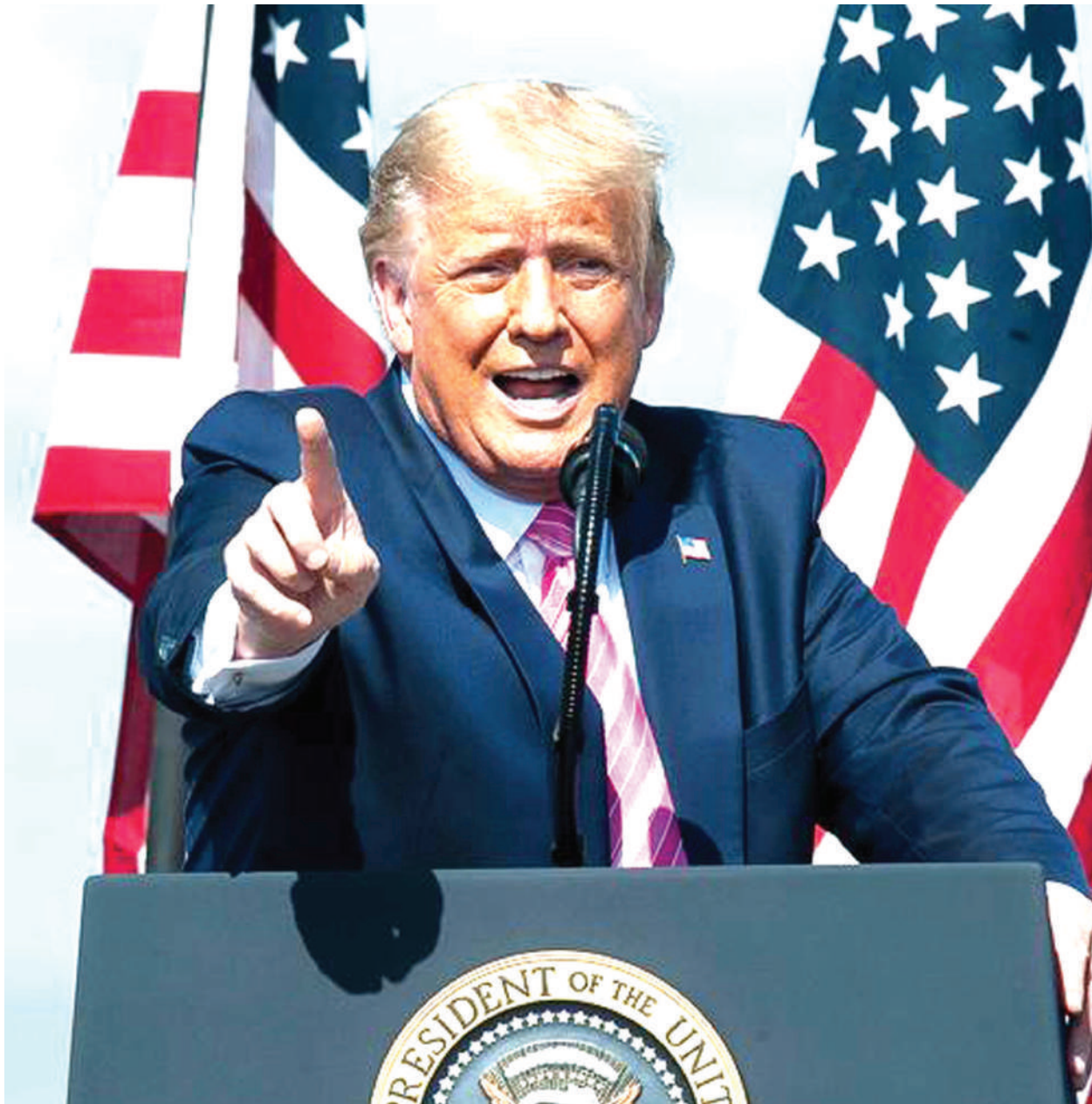
Donald Trump anatafuta muhula wa pili urais Marekani.