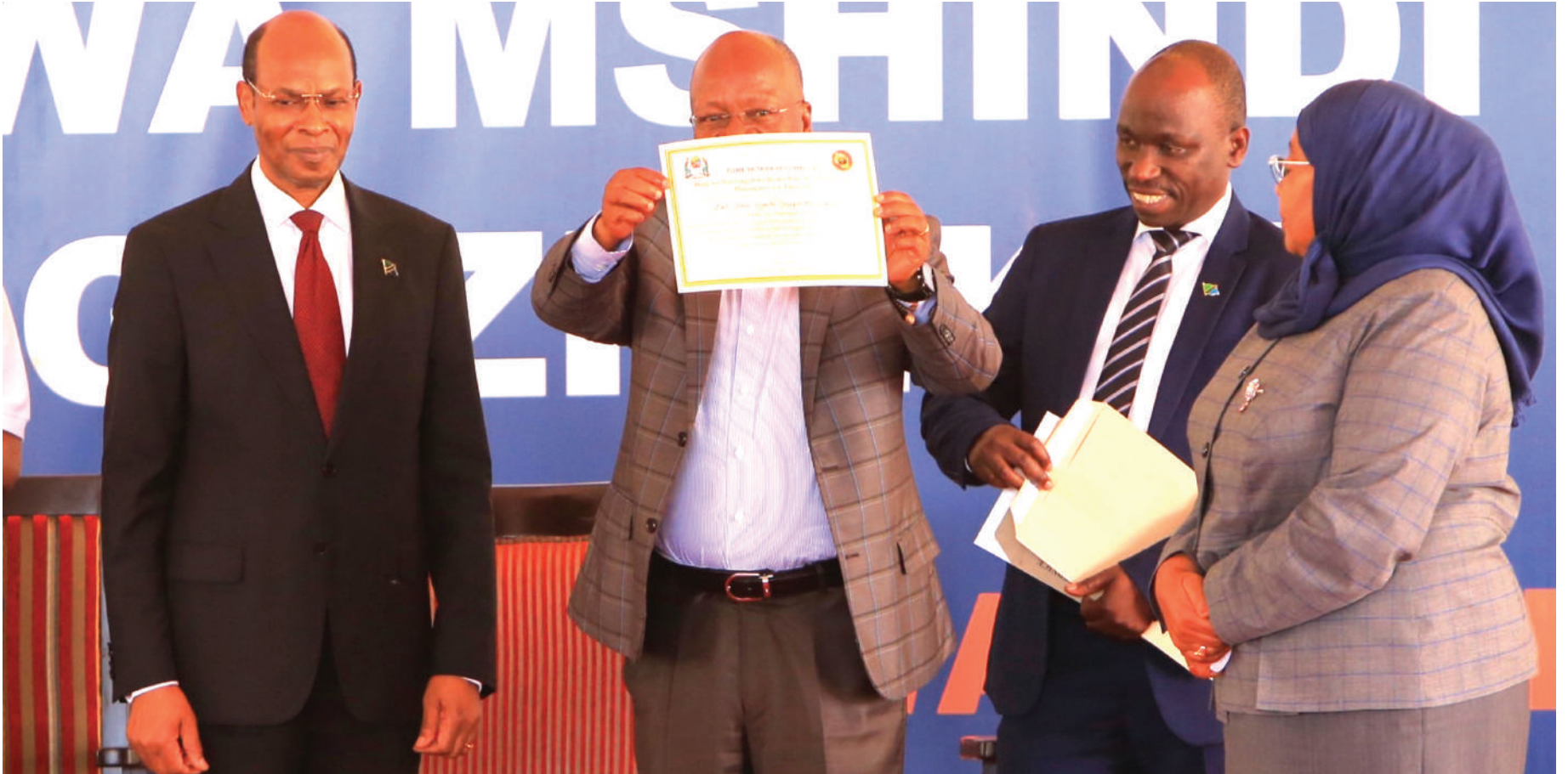
Rais Mteule John Magufuli, baada ya kukabidhiwa cheti cha ushindi wa uchaguzi wa urais 2020 na Tume ya Taifa ya Uchaguzi. Alipata ushindi wa asilimia 84.4.