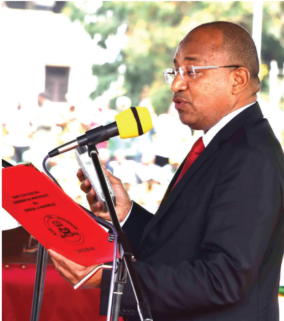
Rais wa Zanzibar, Dk. Hussein Ali Mwinyi, akijiandaa kuanza kazi kwa kula kiapo cha utii, uaminifu na utumishi kwa wananchi.

Mwelekeo wa serikali atakayoongoza baada ya kula kiapo mbele ya Wazanzibari na viongozi mbalimbali wa Serikali ya Zanzibar na Jamuhuri ya Muungano wa Tanzania, Dk Mwinyi