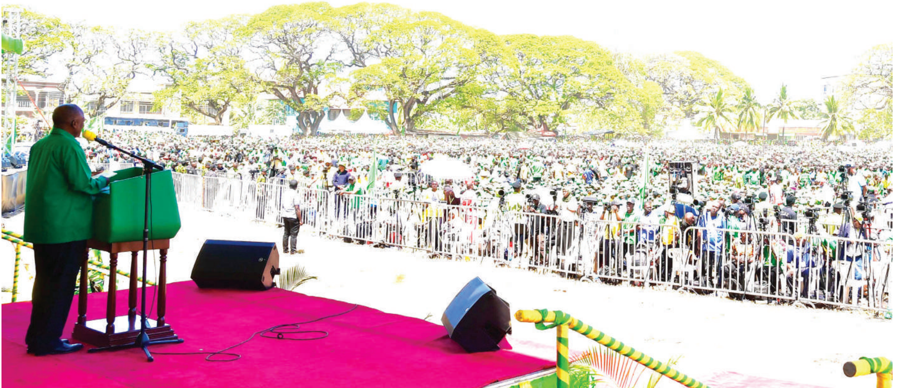
Rais John Magufuli, akipiga kampeni za kutangaza makubwa yaliyofanywa na awamu ya tano.