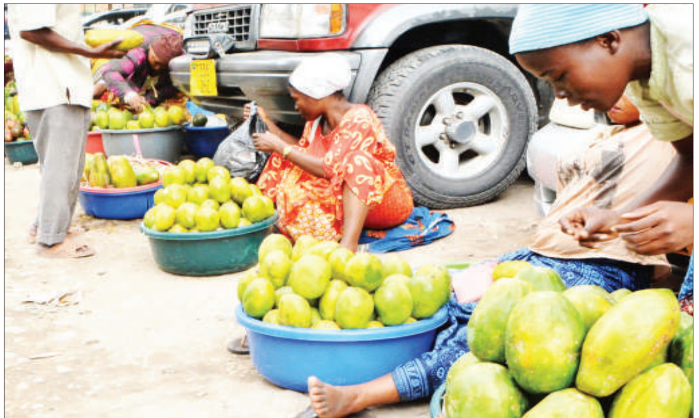
Wachuuzi wa matunda wakisubiri wateja katika eneo la Kariakoo, jijini Dar es Salaam jana. Papai moja liliuzwa kwa 2,000/-, wakati embe moja ni 1,000