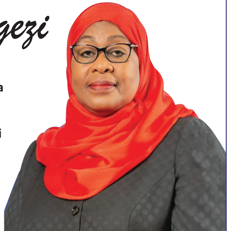
MH. SAMIA SULUHU HASSAN RAIS WA JAMHURI YA MUUNGANO WA TANZANIA

Tunakuomba afya njema na tuko pamoja katika kuhakikisha agenda ya maendeleo ya Watanzania inafanikiwa.