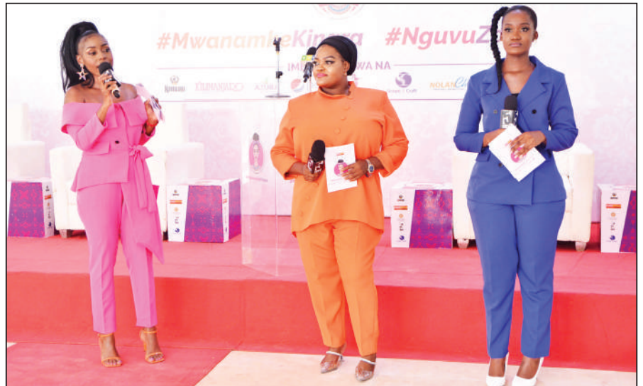
Watangazaji wa kipindi cha Dadaz kinachorushwa na EATV wakiieleza utaratibu ulivyo wa watoto kwenye sherehe za Mwanamke Kinara iliyoandaliwa na EATV, jana.