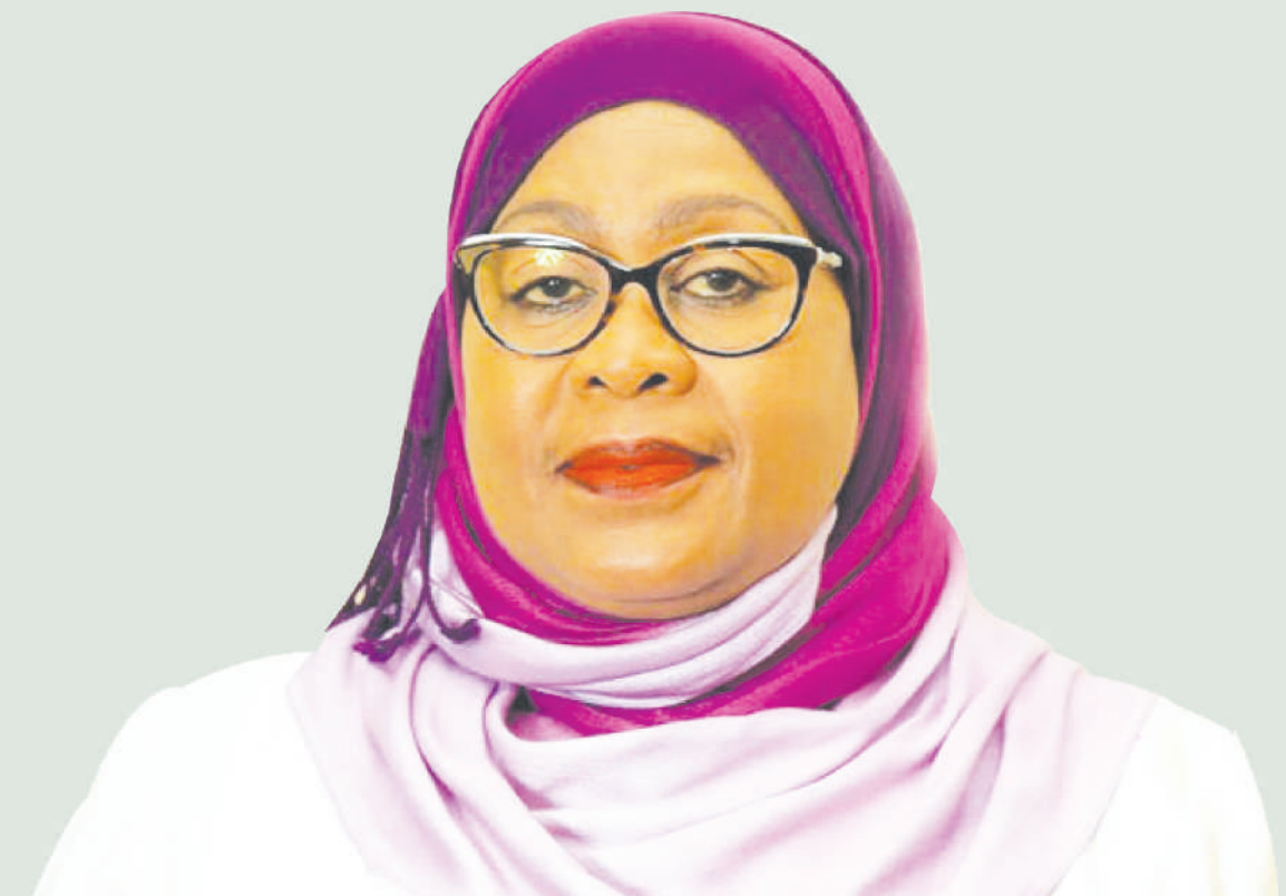
Mhe. Samia Suluhu Hassan Rais wa Jamhuri ya Muungano wa Tanzania

Shirika linaendelea na utekelezaji wa miradi ya kipaumbele ya kuzalisha,