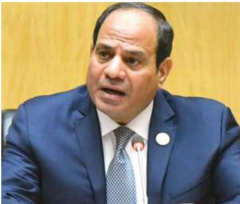
Mwenyekiti wa AU, Al Sisi, ana kazi ya kusimamia utekelezaji wa mikataba inayolinda demokrasia na kudumisha amani.

Uchaguzi ni tatizo linalosababisha uvunjifu wa amani na mauaji ya raia wengi barani Afrika, ndiyo maana ACDEG imeelekeza kuwa ni lazima kuwa na tume huru za uchaguzi Afrika,”