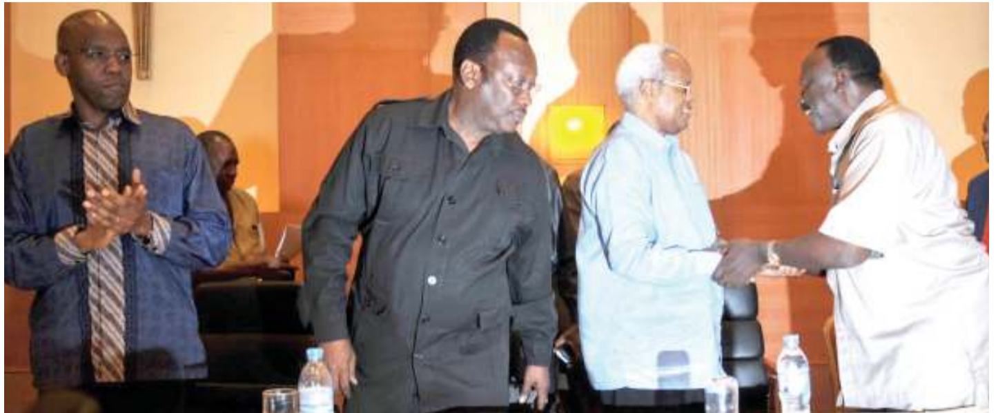
Aliyekuwa Mwenyekiti Mwenza wa Ukawa, Profesa Lipumba (kulia), akimkaribisha Edward Lowassa, upinzani baada ya kujiunga na Chadema. Wanaoshuhudia ni Mwenyekiti wa NCCR-Mageuzi, James Mbatia (kushoto) na Mwenyekiti wa Chadema, Freeman Mbowe.

Aidha, alishiriki shughuli mbalimbali za kichama na kiserikali ambazo hazina bughudha wala kashkash kama ilivyo kwa upinzani kitu ambacho alionekana kuanza kukirudia akiwa upinzani mathalani, hivi karibuni wakati