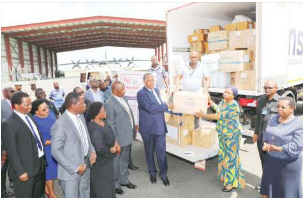
Waziri wa Mambo ya Nje na Ushirikiano wa Afrika Mashariki, Prof. Palamagamba Kabudi (wa tano kulia) na Waziri wa Afya, Ustawi wa Jamii, Wazee na Watoto, Umyy Mwalimu, wakibabidhi misaada ya dawa na vyakula, jijini Dar es Salaam jana, ambavyo serikali ya Tanzania imetoa kwa nchi za Malawi, Msumbiji na Zimbabwe, ambazo zimekumbwa na maafa ya mafuriko kufuatia tufani kali iliyolikumba eneo hilo la kusini mwa Afrika.