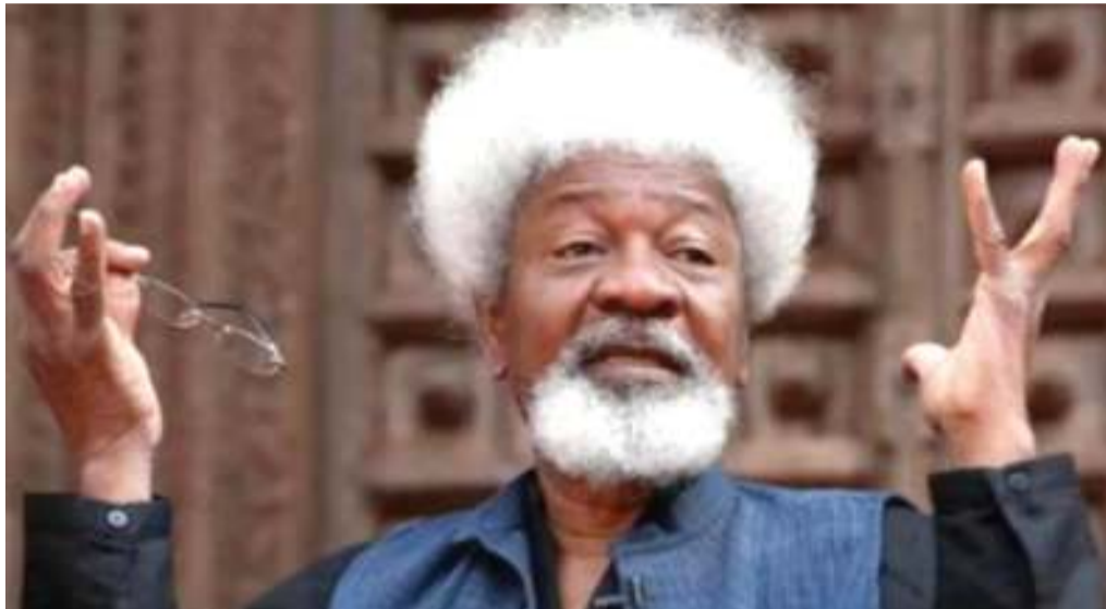
Profesa Wole Soyinka, mshindi wa Tuzo ya Nobel, anayefundisha Marekani baada ya kutishiwa maisha Nigeria.