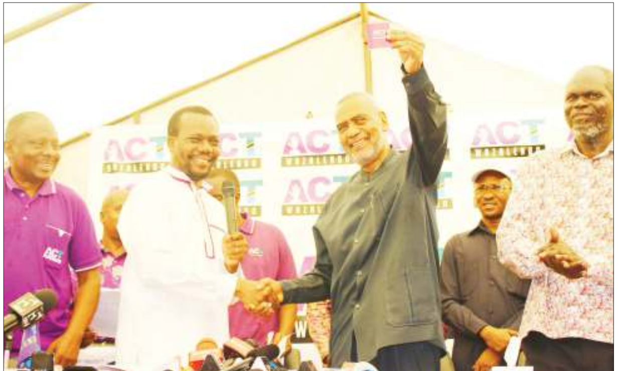
Aliyekuwa Katibu Mkuu wa Chama cha Wananchi (CUF), Maalim Seif Sharif Hamad, akionyesha kadi namba moja ya Chama cha ACT - Wazalendo, baada ya kukabidhiwa rasmi na kiongozi wa chama hicho, Zitto Kabwe (wa pili kushoto), jijini Dar es Salaam jana.

• Ni baada ya kupewa kadi Na. 1 ACT- Wazalendo, atoa ya moyoni kuhusu Lipumba, awataka wabunge CUF kusuka au kunyoa... Endelea uk. 2