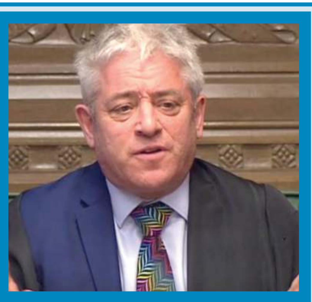
John Bercow, Spika wa Bunge la Uingereza.

“Sera ya kuhakikisha tunatumia rasilimali za nchi kama madini kwa manufaa ya nchi ni yetu tangu mwaka 1995 lengo letu sasa ni kuhakikisha haki sawa kwa vyama vya upinzani. Anasema kama wangukuwa na mkakati wenyewe umaja ingesaidia kufikia yale malengo ambayo walikubaliana kuanzisha Ukawa, lakini matokeo yake