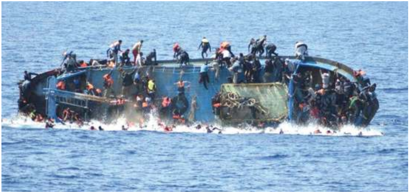
Wakimbizi na wahamiaji kutoka sehemu mbalimbali za Afrika wakipambana kuokoa maisha yao.