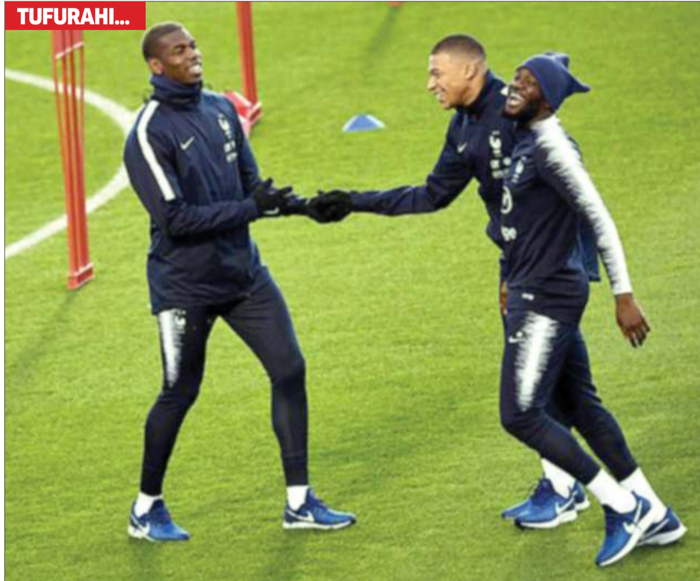
Wachezaji wa Timu ya Taifa ya Ufaransa, Paul Pogba (kushoto), Kylian Mbappe na kiungo Tanguy Ndombele (kulia) wakiwa katika utani wakati wa mazoezi ya kujiandaa na kuwania kufuzu Euro 2020 dhidi ya Moldova Ijumaa na baadaye Iceland.