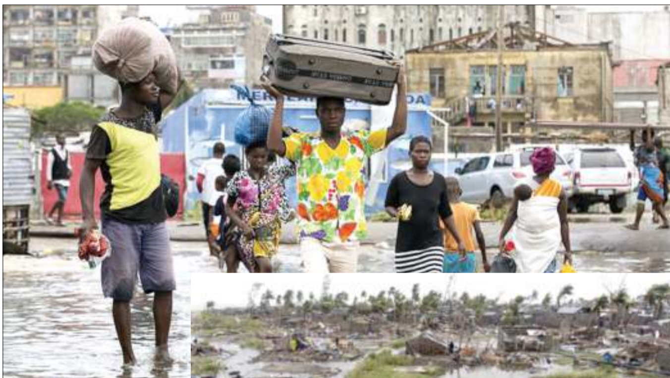
Wakazi wa mjini Maputo Msumbiji wakihamisha vitu vyao baada ya nyumba zao kujaa maji kutokana na mvua kubwa iliyoambatana na kimbunga kupiga nchini humo. Kulia ni nyumba nchini Msumbiji zikiwa zimeanguka baada ya kukumbwa na kimbunga I dai.

Ruto alisema kuwa nchi inachakula cha kutosha na kuongeza kuwa hakuna haja ya kuwa na hofu. BBC