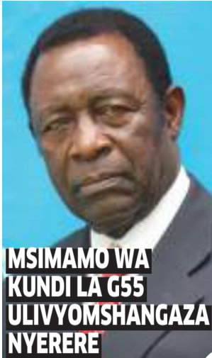
MSIMAMO WA KUNDI LA G55 ULIVYOMSHANGAZA NYERERE