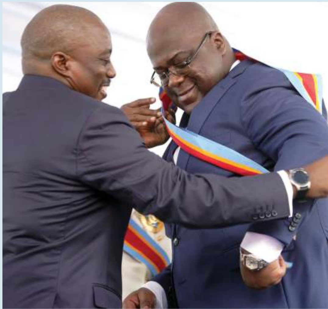
Rais mstaafu Kabila, pamoja na Felix Tshisekedi, baada ya kuapishwa kuongoza DRC.

Oktoba 2016, Kabila alifanya ziara ya kikazi nchini na kusaini mikataba kadhaa na mwenyeji wake, Rais John Magufuli, hatua hiyo inakuja wakati ujazo wa biashara