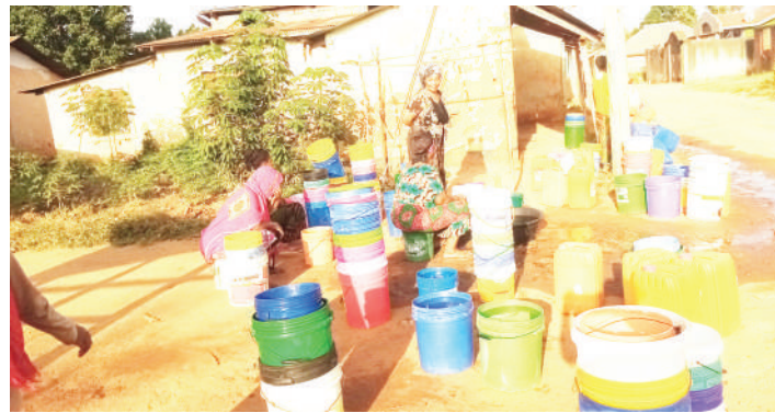
Wanawake wakiwa kwenye foleni ya kuchota maji katika Mtaa wa Mdote, Kata ya Majengo, wilayani Muheza mkoani Tanga jana, baada maji kuwa adimu.

Kwaresma ni kipindi ambacho Wakristo wanakumbuka mateso, kifo na ufuko wa Yesu Kristo kwa ajili ya kuukomboa ulimwengu.