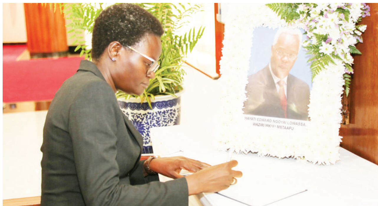
Spika wa Bunge, Dk. Tulia Ackson akitia saina kitabu cha maombolezo ya kifo cha Waziri Mkuu mstaafu, Edward Ngoyai Lowasa, bungeni jijini Dodoma jana.

Alitaja misaada iliyotolewa kwenye kituo hicho ni pamoja na sukari, sabuni, mafuta ya kupakaa na ya kula, dawa za miswaki, madaftari, peni na penseli, mchele, pipi na biskuti.