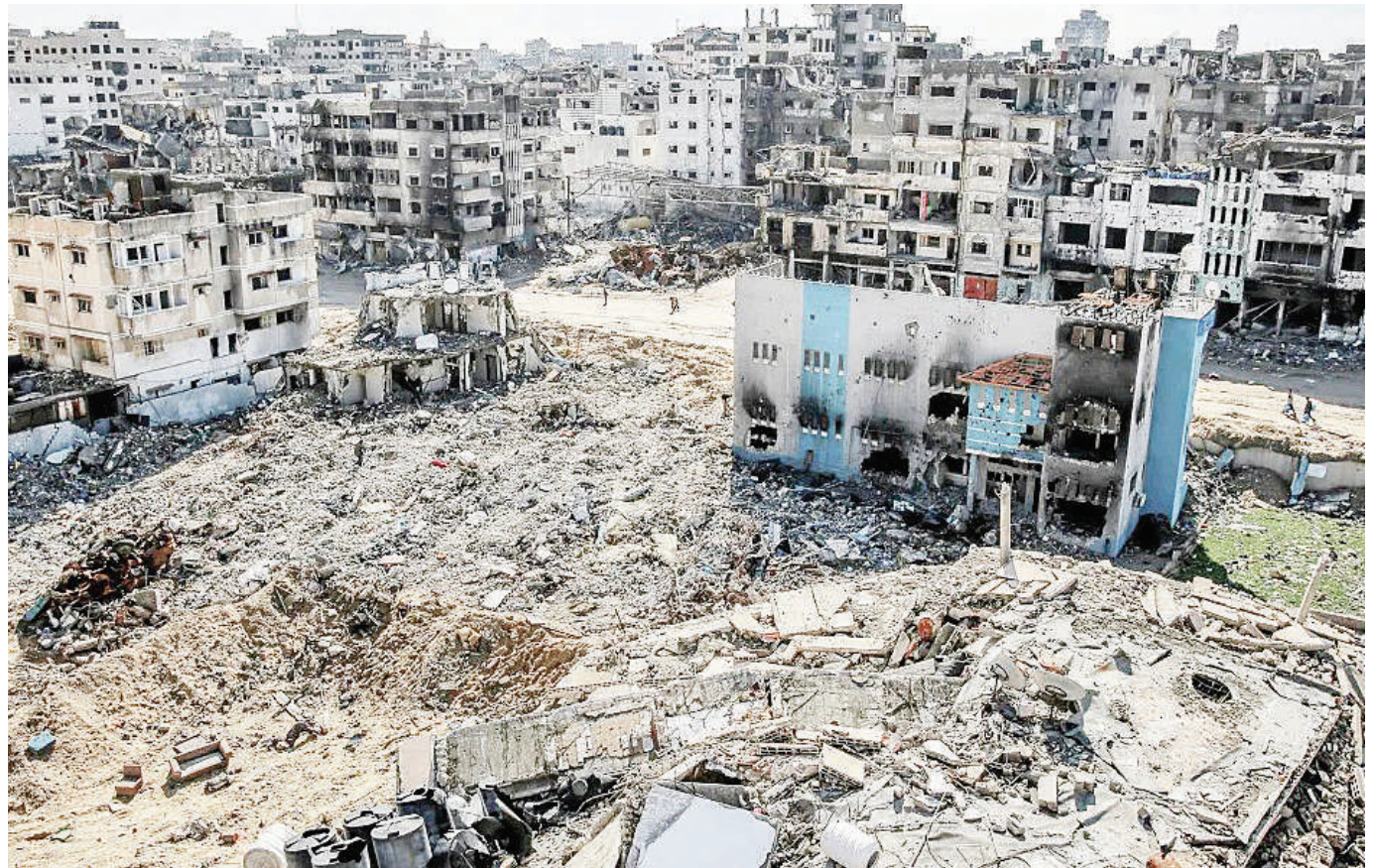
Muonekano wa makazi ya wananchi wa Gaza baada ya kushambuliwa na makombora ya Jeshi la Israel.

Rais Boakai ambaye maandamano hayo ni changamoto ya kwanza iliyomkuta tangu aingie madarakani, alitoa wito kwa wananchi kuwa watulivu huku akiahidi kuwa serikali yake itashughulikia matatizo yao. DW