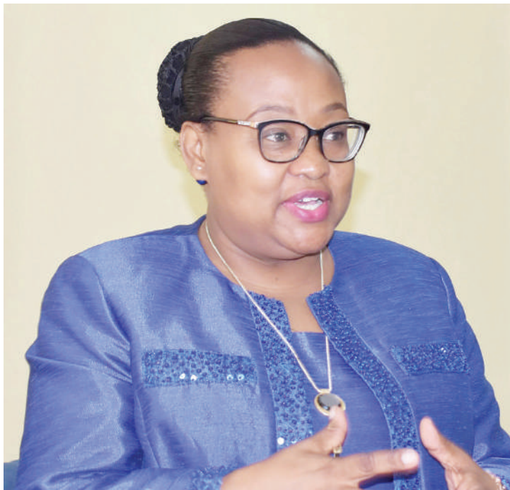
Waziri wa Katiba na Sheria, Dk. Pindi Chana.

Wanataka iwepo tume huru ya kusimamia uchaguzi ili uwe huru na haki, ili mshindi na mshindwa aridhike bila kinyongo.