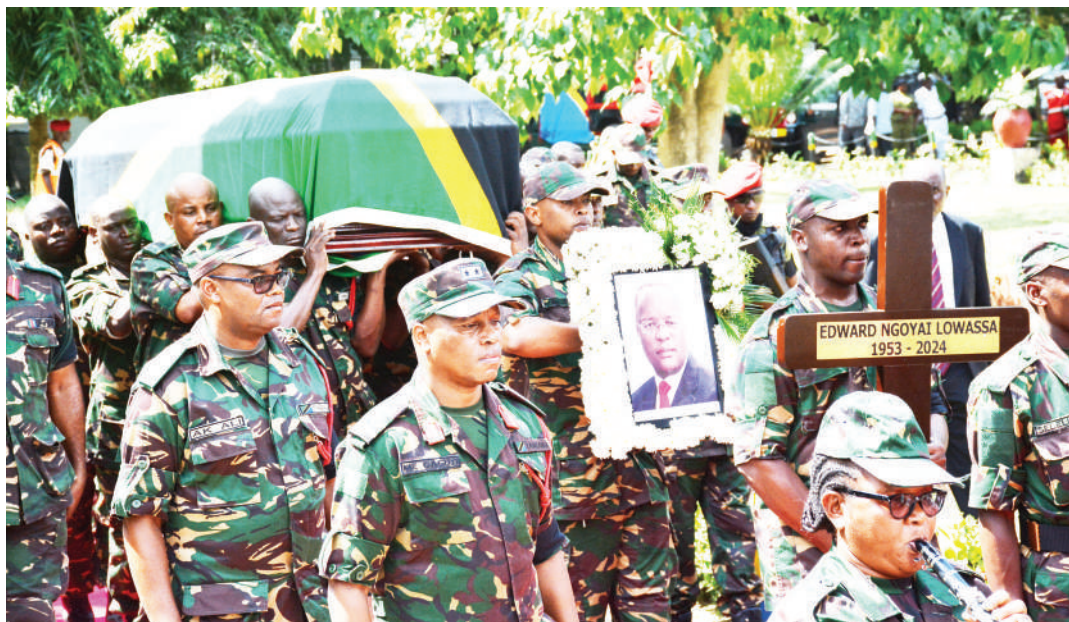
Askari wa Jeshi la Ulinzi la Wananchi wa Tanzania (JWTZ), wakiwa wamebeba jenze lenye mwili wa Hayati Edward Lowassa, baada ya kuwasili katika viwanja vya Karimjee, jijini Dar es Salaam jana.