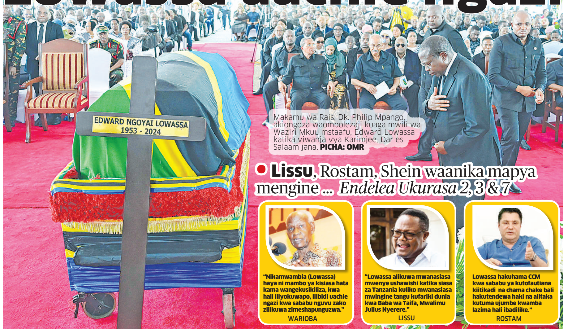
Makamu wa Rais, Dk. Philip Mpango, akiongoza waombolezaji kuaga mwili wa Waziri Mkuu mstaafu, Edward Lowassa katika viwanja vya Karimjee, Dar es Salaam jana.

● Lissu , Rostam, Shein waanika mapya mengine... Endelea Ukurasa 2, 3 & 7