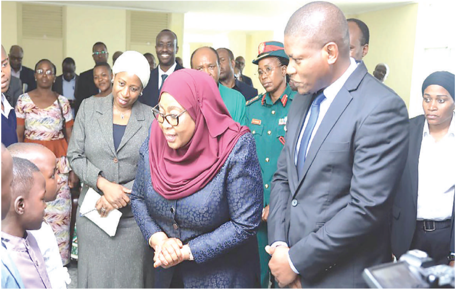
Rais Dk. Samia Suluhu Hassan, akiwa na Waziri wa Afya, Ummu Mwalimu, wakisalimiam watoto katika ziara zao za kikazi.

Waziri Ummu anasema, mfumo huo mwaka 2022 hadi 2023, umeendelea kufanya kazi katika mikoa yote