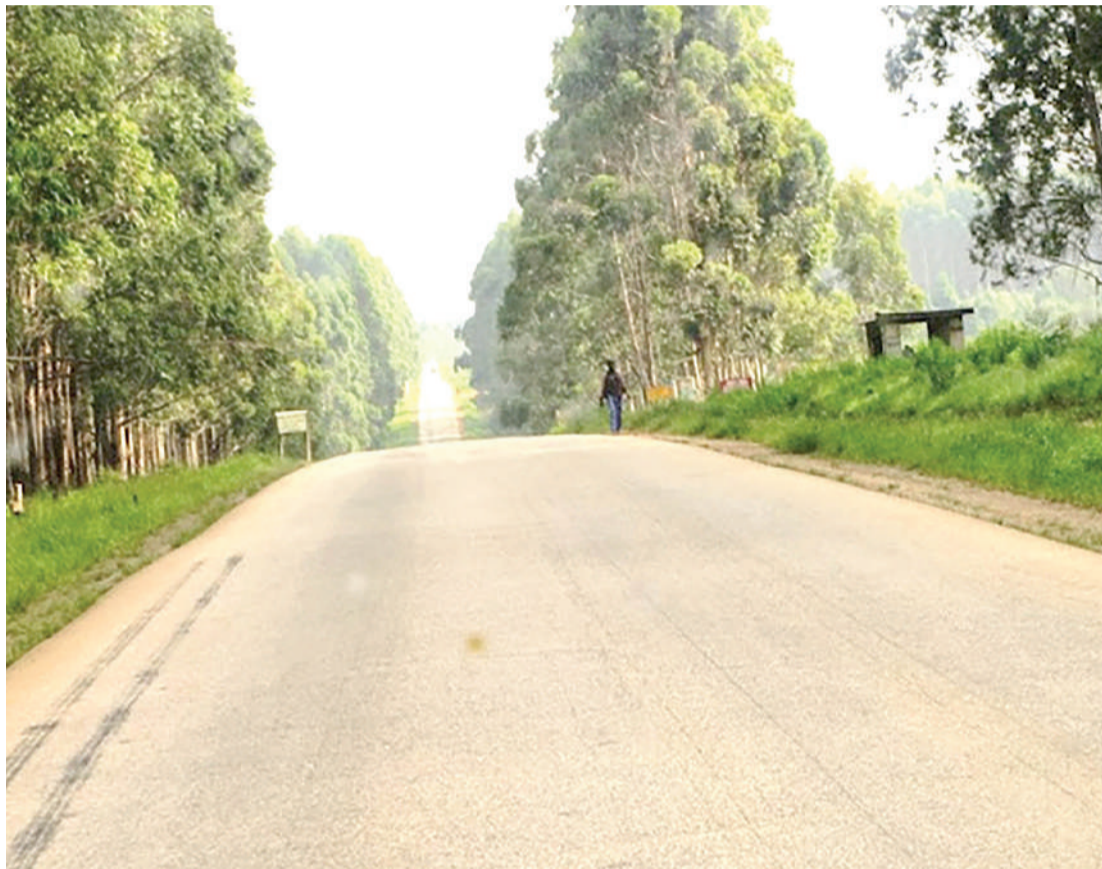
Sehemu ya Misitu ya Sao Hill, mkoani Iringa.

umepanda miti eneo la mashamba lenye ukubwa wa hekta 18,292 kwa ajili ya kuzalisha rasilimali za viwanda vya misitu na kuanzisha shamba jipya katika hekta 37,000 wilayani Tunduru.