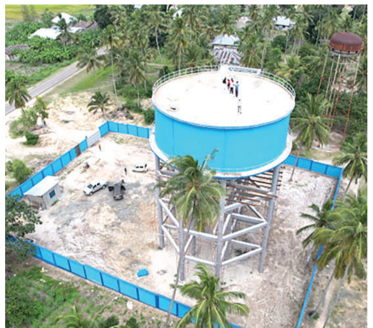
Mradi wa maji wenye ufanisi ulioko Pemba.

Hadi sasa Global Water Partnership Tanzania inashirikiana na Wizara ya Maji SMZ kuratibu uwekezaji Tanzania.