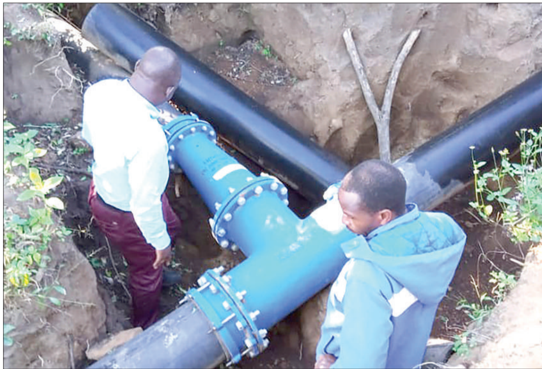
Mafundi wa maji wakiwa kazini, Mbalizi, Mbeya.

Mikakati hiyo inaweka misingi ya kuanzishwa kwa mifumo ya muhimu katika usimamizi wa rasilimali za maji kama vile Bodi ya