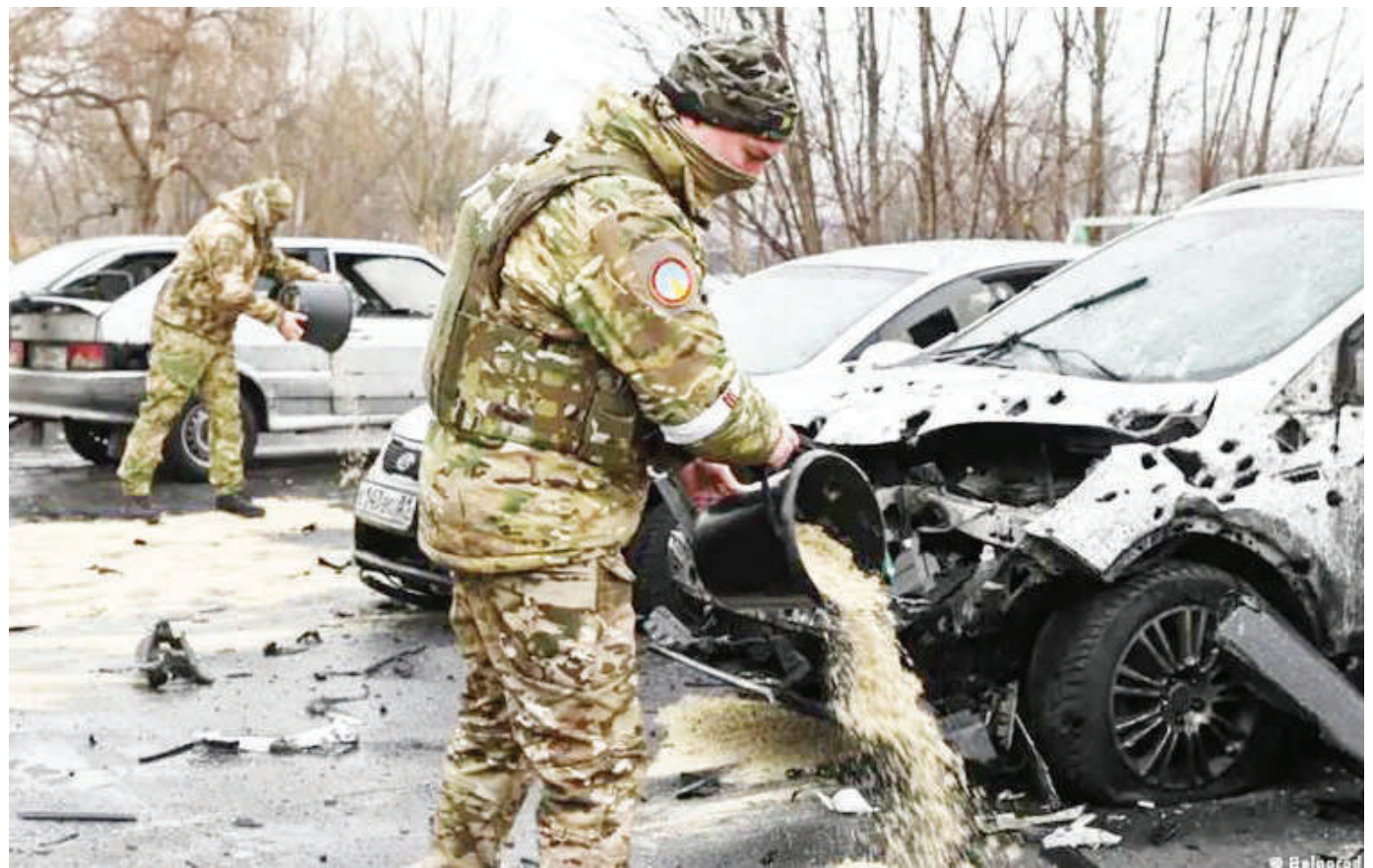
Askari jeshi wa Russia akitumia mchanga kuzima moto uliotokana na shambulio katika mji wa Belgorod.