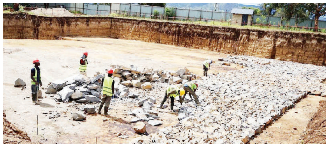
Mafundi wa Mamlaka ya Majisafi na Usafi wa Mazingira Mbeya (Mbeya-WSSA), wakipanga mawe, ili kuanza ujenzi wa tangi la kuhifadhi maji katika eneo la Forest Mpya jijini Mbeya juzi, ambalo ni sehemu ya utekelezaji wa Mradi wa Maji wa Chanzo cha Mto Kiwira.

Alisema mradi huo kwa sasa tayari umeshaanza kuwahudumia wananchi wa Kata ya Iwambi jijini Mbeya na vijiji vya Idugumbi na Itimba vilivyoko katika Mamlaka ya Mji Mdogo wa Mbalizi.