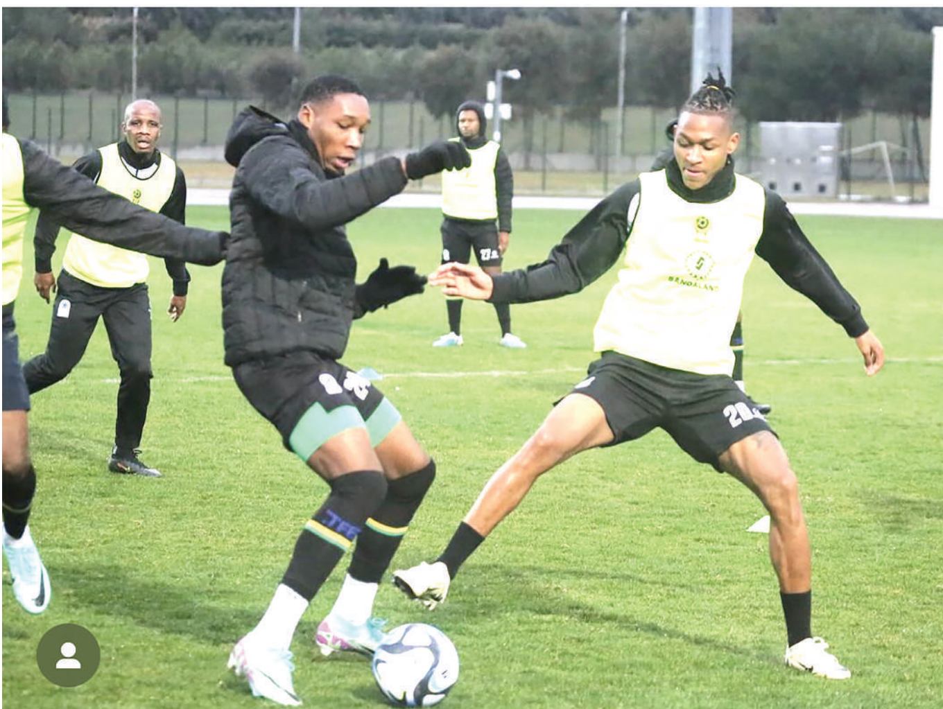
Wachezaji wa Timu ya Soka ya Taifa (Taifa Stars), wakifanya mazoezi kwenye Uwanja wa Olimpiki Baku kwa ajili ya kujiandaa kuivaa Bulgaria katika mechi ya kirafiki ya kimataifa itakayochezwa kesho nchini Azerbaijan.

Alisema ligi ya msimu huu itahusisha timu 20 kutoka Unguja (wanaume timu 16 na wanawake timu nane), huku upande wa Pemba utawakilishwa na klabu 11 za wanaume zikiwa nane zilizobakia ni za wanawake.