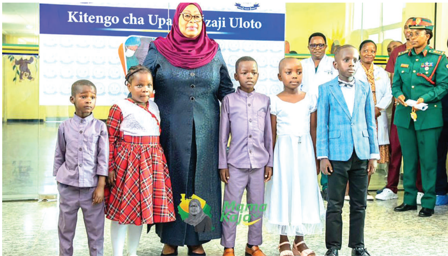
Katika staili yake ya urafiki na watoto kwenye ukaguzi wa shughuli za afya kitaifa.

Rais anafanua kuwa utafiti mbalimbali uliofanyika barani Afrika mwaka uliopita, umebaini kuwapo tatizo la uwekezaji katika malezi na makuzi ya watoto wadogo.