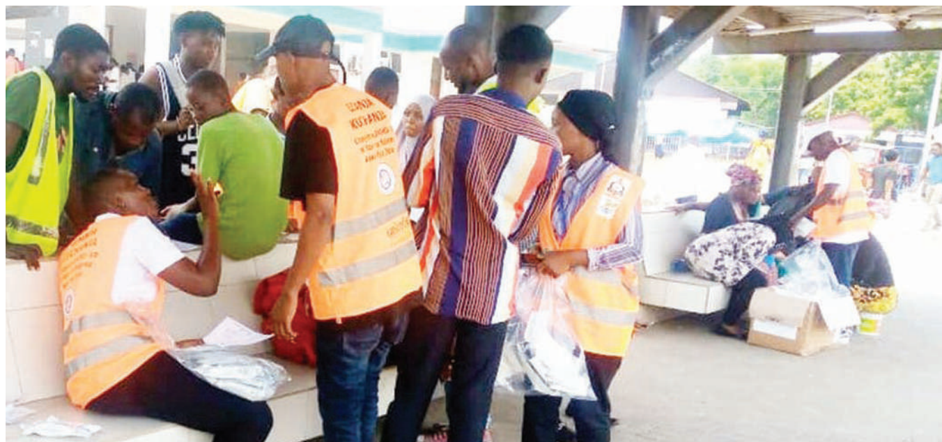
Wafanyakazi wa Chama cha Kutetea Abiria Tanzania (CHAKUA), wakiorodhesha majina ya watu ambao wako tayari kupata chanjo ya kujikinga na corona, katika kituo cha daladala cha Feri jijini Dar es Salaam juzi. Mbali na kutetea abiria, chama hicho kwa sasa kinafanya kampeni ya chanjo ya ugonjwa huo katika maeneo mbalimbali nchini.

Alisema Ufaransa ina mchango mkubwa katika uwekezaji, ushirikiano wa kiusalama na maendeleo ya kiuchumi kwa juhudi na miradi mikubwa nchini Tanzania.