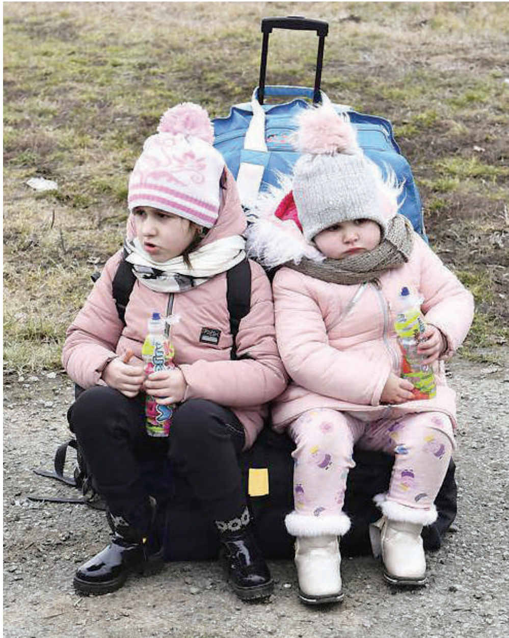
Watoto wakiwa eneo la ukaguzi baada ya kuokolewa na msamaria mwema kutoka nchini Ukraine, na kuvuka mpaka wa Beregsurany ili kuingia nchini Hungary, jana.

“Jiji lingine lolote litatufaa, katika nchi, ambayo makombora yake hayarushwi dhidi yetu. Hii ndiyo njia pekee ya mazungumzo yanaweza kuwa ya ukweli na yanaweza kumaliza vita,” anasema