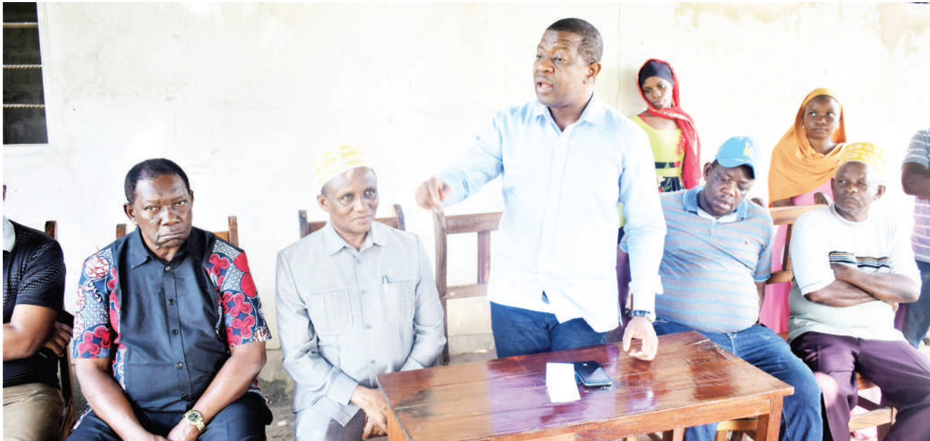
Naibu Waziri wa Mifugo na Uvuvi, Abdallah Ulega, akiongea na wanakikundi wa kilimo cha mwani kilichoko Kijiji cha Mlingotini wilayani Bagamoyo mkoani Pwani, alipotembelea kikundi hicho katika ziara yake ya kikazi ya siku mbili mkoani Pwani, ili kuimarisha uchumi wa buluu.