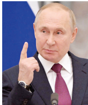
Rais wa Russia, Vladimir Putin.

Rais Zelensky jana kwenye taarifa yake iliyorushwa na kituo cha televisheni Sky News.