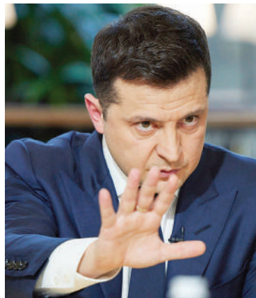
Rais wa Ukraine, Volodymyr Zelensky.

Russia vitendo hivi vina kila ishara ya uhalifu wa kimbari. Inaangamiza maeneo ya miundombinu ya kirai.