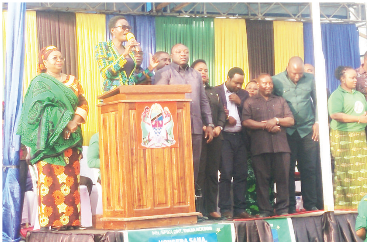
Spika wa Bunge, Dk. Tulia Ackson, akiwahutubia wananchi wa Jiji la Mbeya waliojitokeza kumpokea juzi kwenye Uwanja wa Ruanda Nzovwe ikiwa ni mara ya kwanza kuwasili mkoani Mbeya tangu alipochaguliwa kushika wadhifa huo, wengine ni wabunge wa majimbo mbalimbali nchini.

Alisema mkoa huo haujawahi kupata mjumbe kwenye kamati hiyo kwa kipindi cha miaka 30, hivyo wamepata heshima kubwa ya kuwa na mjumbe wa kamati hiyo.