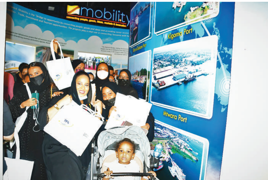
Matukio mbalimbali ya Wageni na Wadau waliotembelea Banda la TPA lililoko katika Banda la Tanzania katika Maonesho ya Expo Dubai 2020.