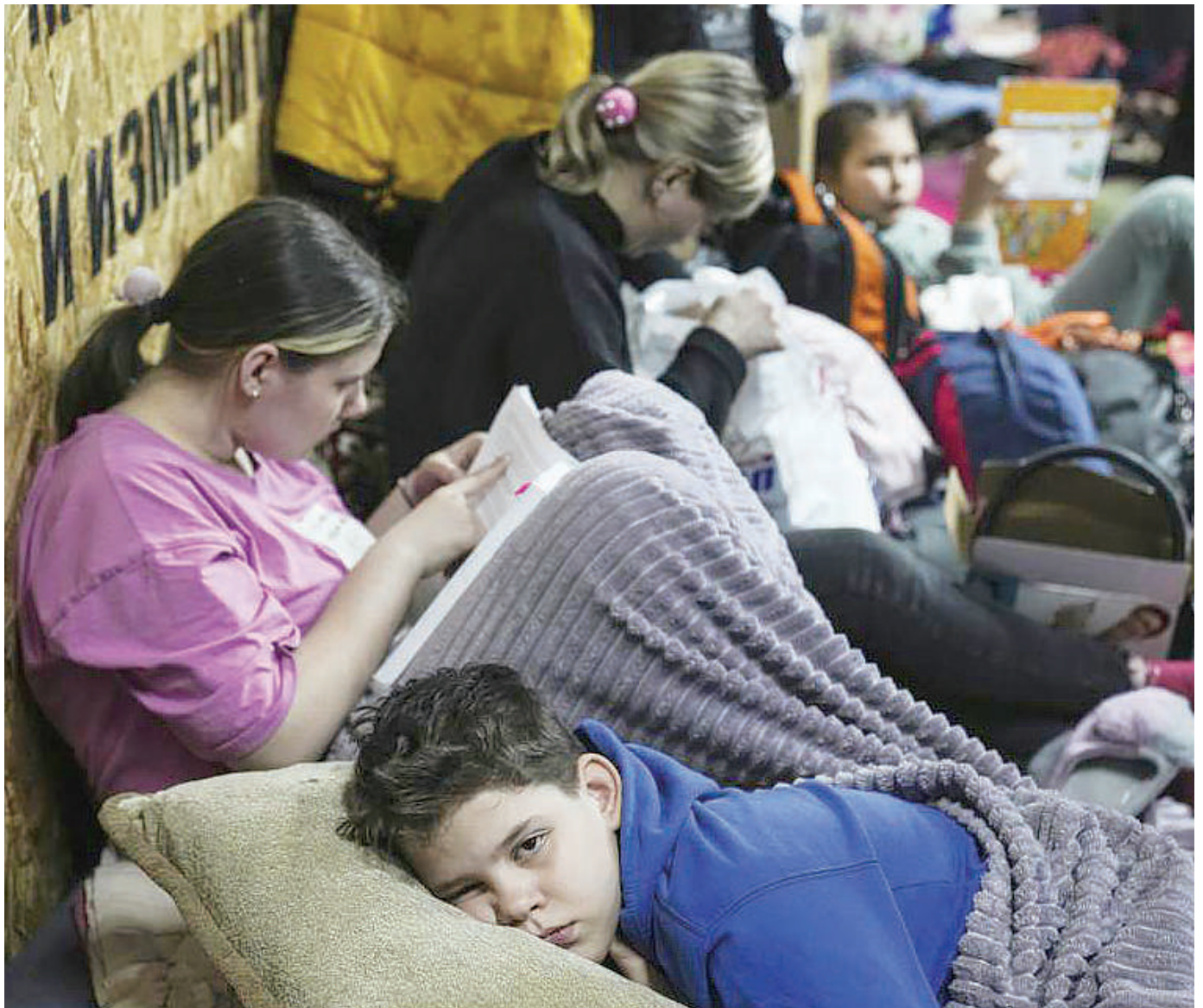
Baadhi ya wakazi wa Ukraine wakiwa katika makazi maalum ya kujilinda katika eneo la kituo cha michezo mjini Mariupol, nchini humo. Makazi hayo yana uwezo wa kutoa malazi kwa watu 2,000.

Kuongeze-ka kwa operesheni za kijeshi ya Russia nchini Ukraine kunasababisha kuongezeka kwa ukiukwaji wa haki za binadamu.