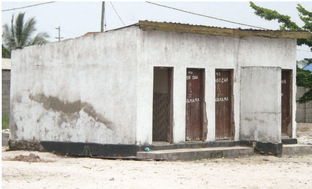
Choo cha wahitaji kama kinavyoonekana.