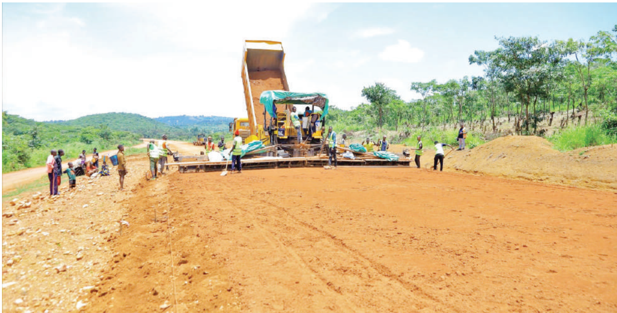
Kazi za ujenzi wa barabara sehemu ya njiapanda ya Nduta - Kibondo Mjini yenye urefu wa KM 25.9 zikiendelea, mkoani Kigoma.

Alisema barabara hiyo na zingine za Kyela Mjini zipo kwenye mipango ya serikali kujengwa, hivyo aliwataka wananchi kuwa wavumilivu wakati harakati za ujenzi zikiendelea.