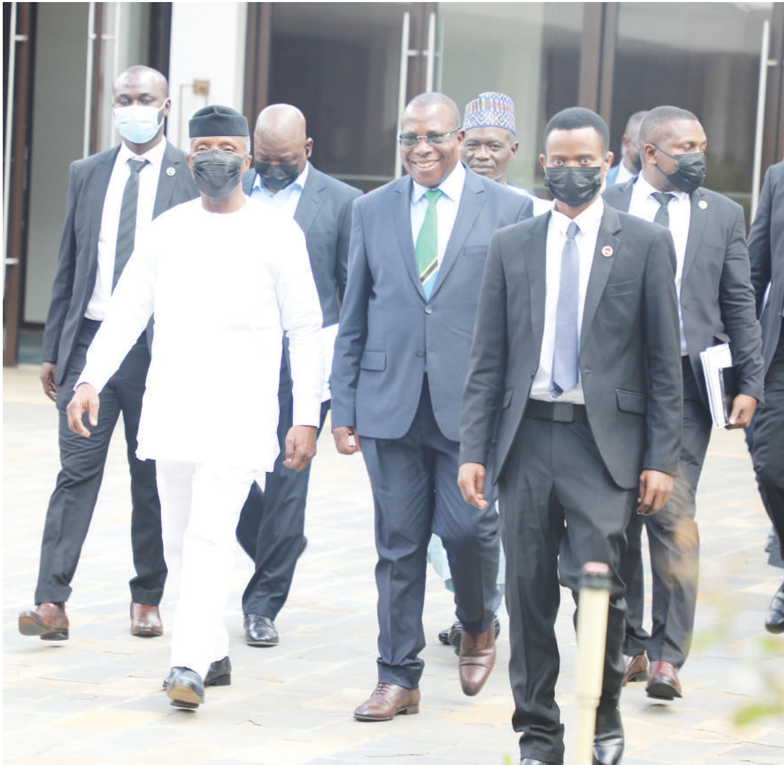
Makamu wa Rais, Dk. Philip Mpango, akiwa na Makamu wa Rais wa Nigeria, Prof. Yemi Osinbajo (kushoto), baada ya mazungumzo yao yaliyofanyika jijini Arusha, jana.