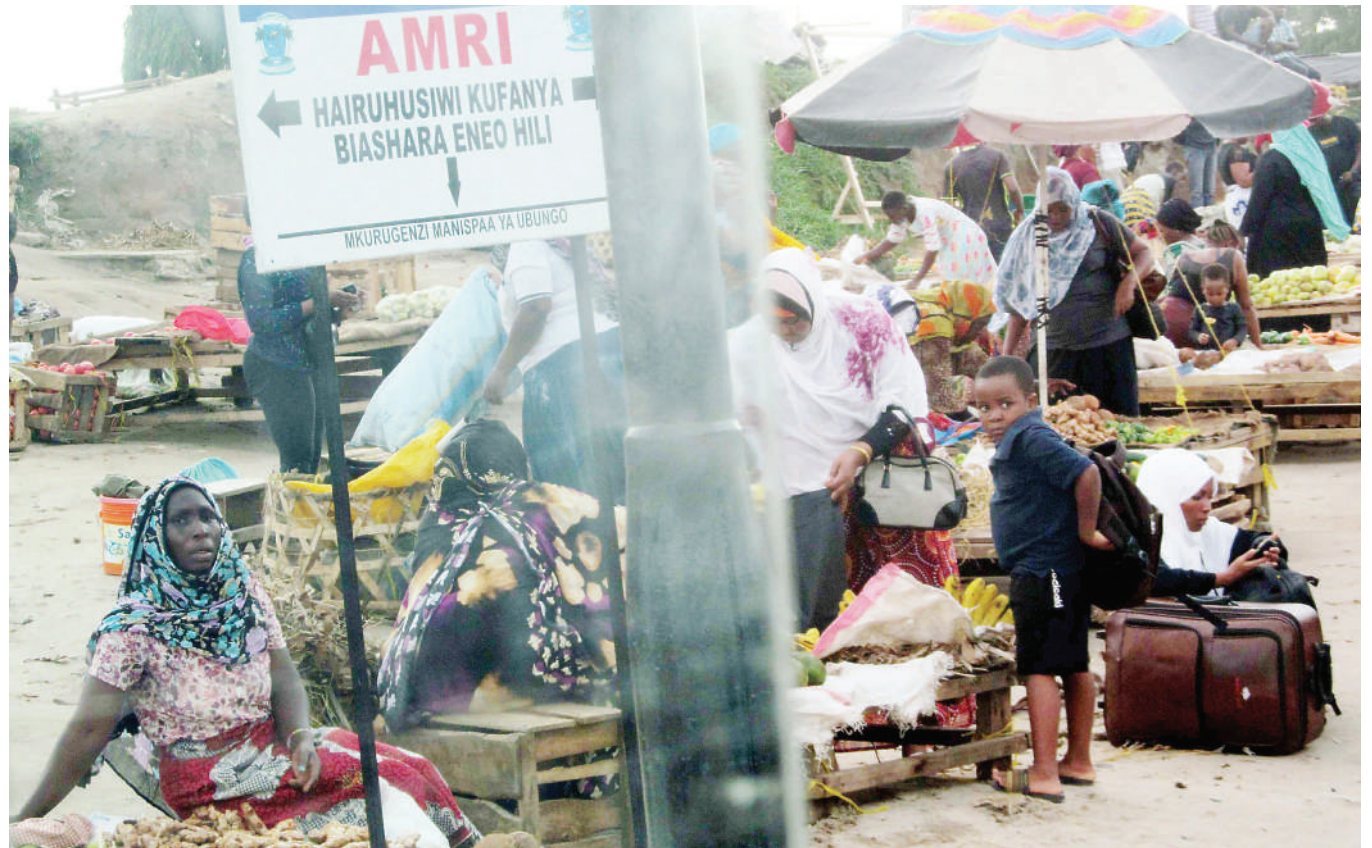
Baadhi ya wafanyabiashara wadogo wakiendesha shughuli zao chini ya bango linalowazuia kufanya biashara kando ya barabara ya Morogoro Mbezi Mwisho jijini Dar es Salaam jana.