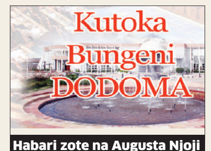
Habari zote na Augusta Njoji