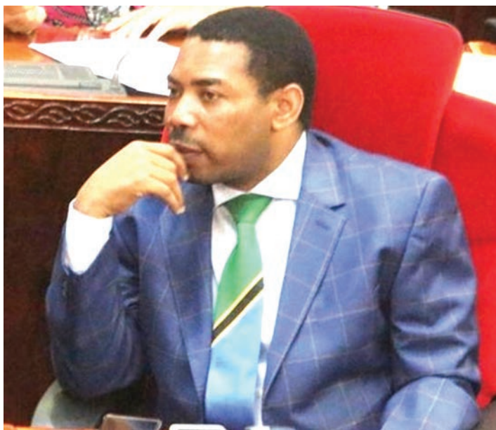
Waziri wa Fedha na Mipango, Dk. Mwigulu Nchemba.

Ripoti zinazijikita kwenye masuala ya haki za binadamu, ikiwamo kuu ya kuishi kiuchumi, kielimu,