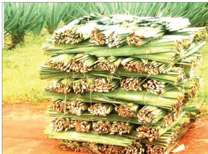
Mkongwe ulioyunwa tayari kupelekwa kiwandani kuchakatwa.