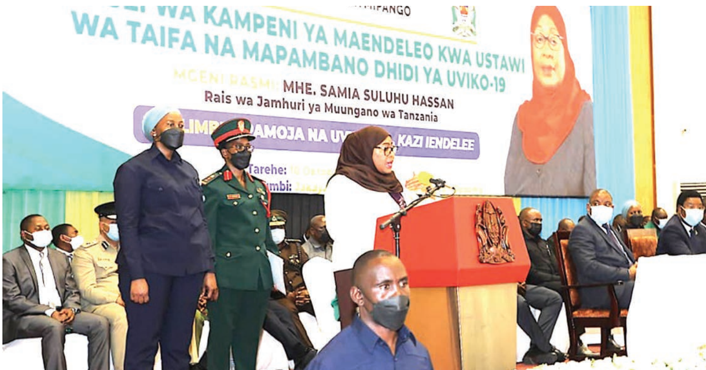
Rais Samia Suluhu Hassan, mwaka jana alipozindua kampeni kuikabili Uviko - 19 kitaifa.

• Kasi ya ukuaji wake ulibadilika ghafla