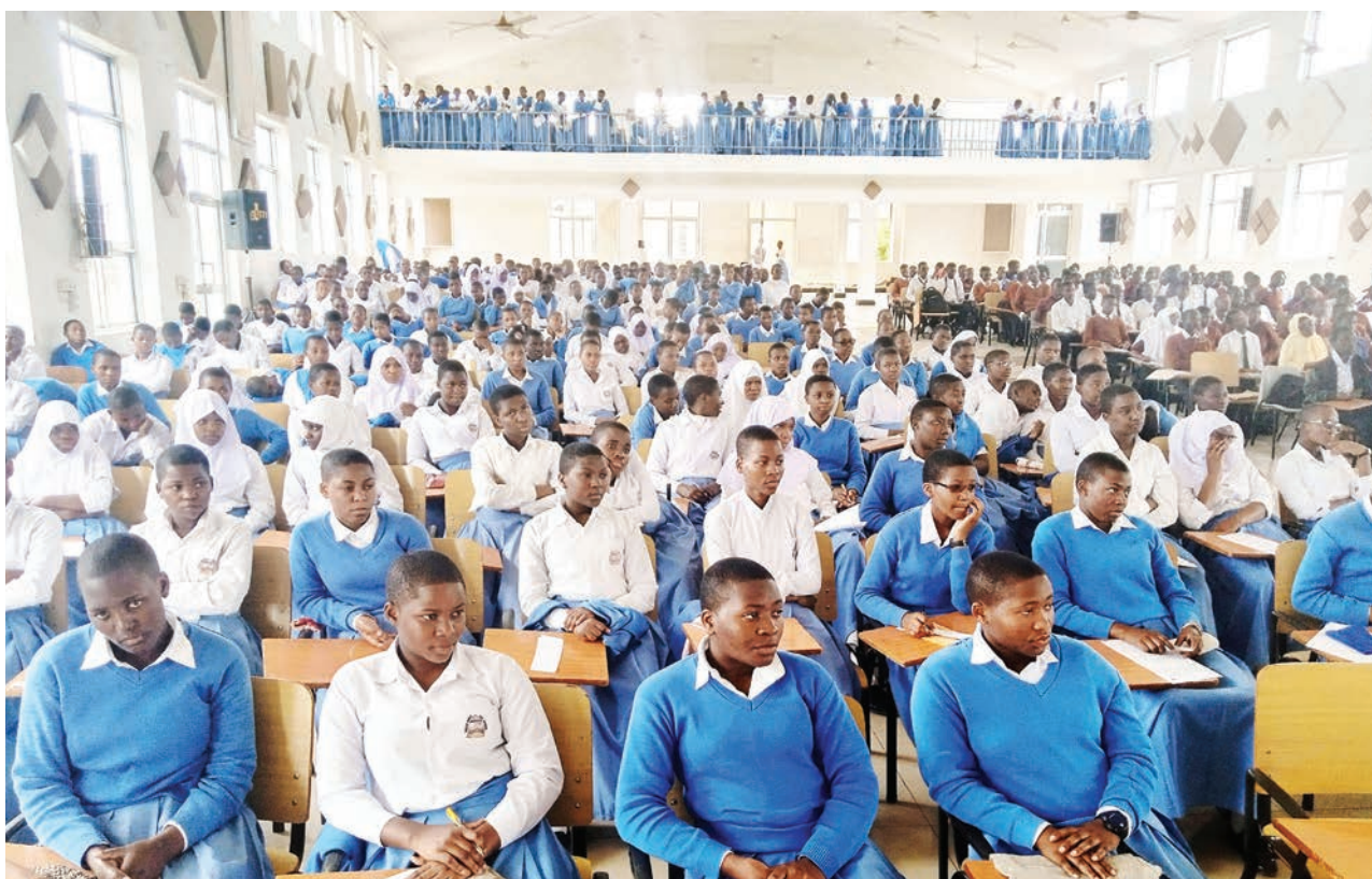
Wanafunzi wa Shule ya Sekondari ya Loleza, waki-fuatilia mafunzo ya elimu kwa makuzi wa wasichana, yaliyoandaliwa na moja ya taasisi zinazohusika na masuala ya makuzi ya vijana, jijini Mbeya, hivi karibuni.

Mwangamno alisema baada ya kikao cha kwanza cha mchakato wa makabidhiano kufanyika Mwanza, pia timu ya wataalamu wa TPA, MSCL na wizara, wanakusudia kufanya ukaguzi wa meli hizo Aprili 25, mwaka huu.