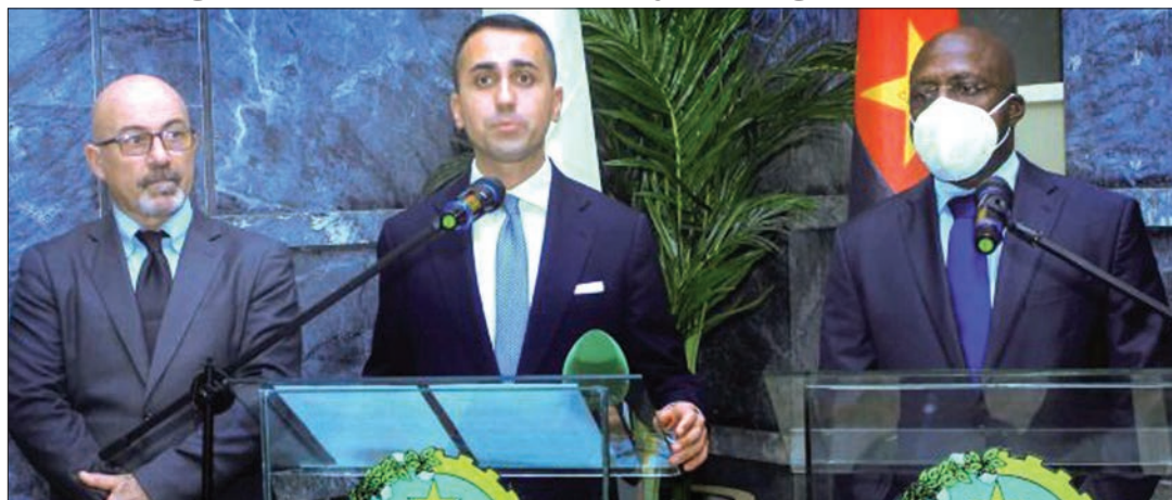
Viongozi wa nchi mbili, Italia na Angola, wakizungumza mara baada ya kuingia makubaliano kuhusu kuuziana gesi.

Barani Afrika kuna maeneo yenye vyanzo vya nishati hiyo, petroli na dizeli, lakini teknolo-