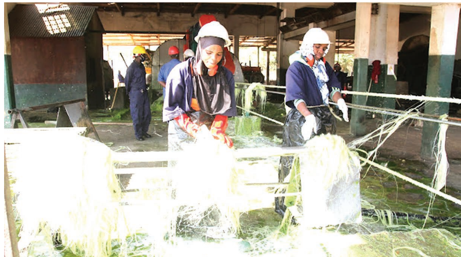
Shughuli zikiendelea ndani ya kiwanda cha uchakataji mkongwe.