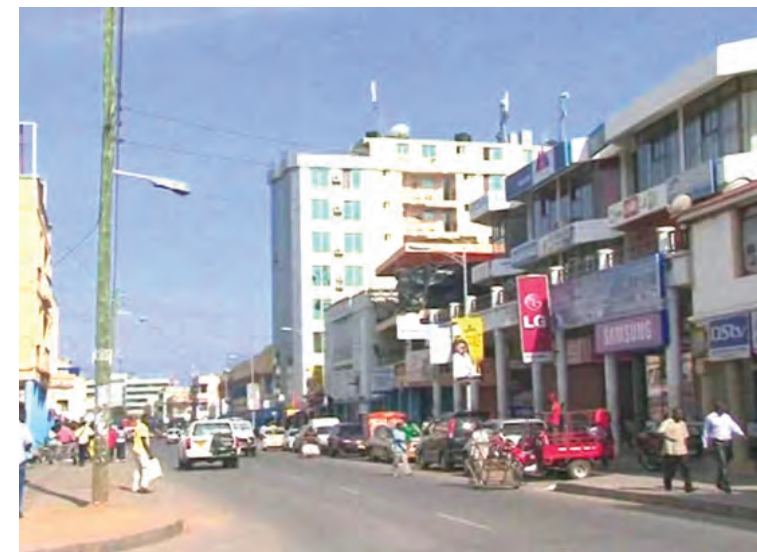
Mitaa ya kibishara jijini Mwanza.

chukua, ni kutathmini kampuni binafsi za ulinzi, akidai baadhi ya walinzi wamekuwa wakijihusisha na matukio ya kihalifu, wanatumia silaha walizopeva lindoni wanaenda nazo kwenye vituo vya mafuta na kuwapora fedha wenzao, kisha wanakimbia. Mutafungwa anasema, walinzi wengi walibainiwa wameajiriwa bila kuwa na kumbukumbu za kutosha ulinzi wao, hivyo aliweka Dawati la Uhakiki kupitia Idara ya Upelelezi Polisi, wakihakikiwa walinzi kwenye kampuni binafsi za ulinzi, kuhusu uhalali wao. Anasema, kwa sasa walinzi wote wameshahakikiwa kama wamepitia mafunzo ya mgambo, ili kue-