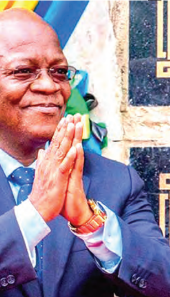
Mkuu wa nchi wa awamu ya tano, marehemu Dk. John Magufui.

Dhamira mojawapo katika matendo inajitokeza Rais Dk. Samia, akiwa ziarani mkoani Kagera, anapowataka viongozi wa mkoa kutenga maeneo makubwa ya kilimo hekta 70 kwa ajili ya kuzalisha