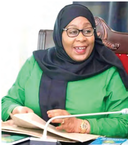
Rais Dk. Samia Suluhu Hassan.

Ni dhana pana inayoangukia nadharia ya uchumi wa maendeleo, unaonena tafsiri pana ya ku-