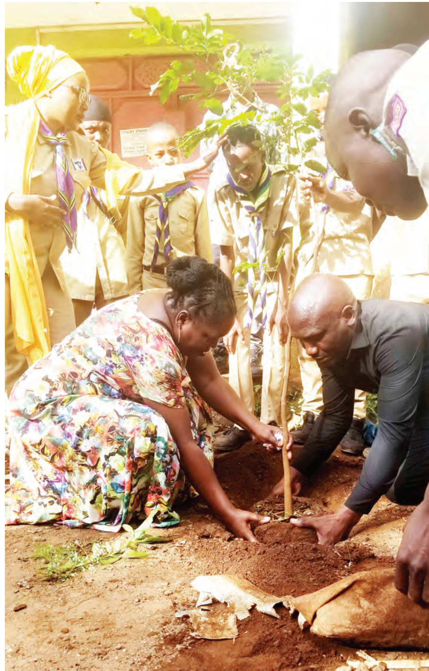
Ofisa Mtendaji wa Mtaa wa Sokoni, Kata ya Majengo, Manispaa ya Moshi, Daima Kapongo (kushoto), akipanda mti pamoja na Mkurugenzi wa shirika lisilo la kiserikali la Mongola Environment and Conservation Group (MECG) katika kata hiyo ikiwa ni sehemu ya shughuli za shirika hilo kuadhimisha Siku ya Mazingira Duniani mapema wiki hii.

Kabla ya Jaji Tiganga kuridhia hoja hiyo ya kisheria, Wakili Mpoki alidai kuwa kutokana na hoja ya muda, wanaomba shauri hilo lisikilizwe kwa njia ya maandishi kwa muda wa wiki tatu.