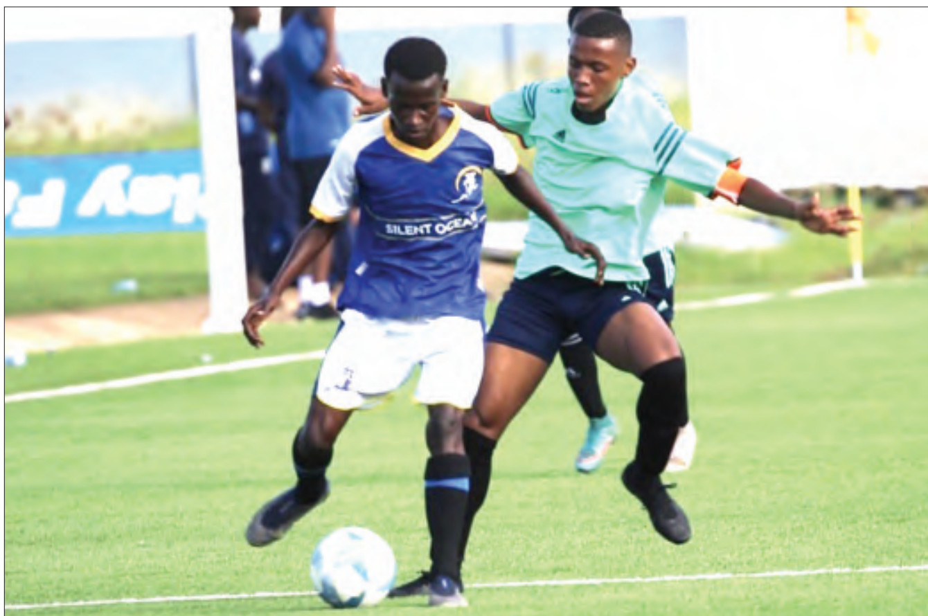
Wachezaji wa timu za vijana za umri chini ya miaka 17 wakichuana katika mechi ya Ligi ya TFF (U-17), iliyochezwa mapema wiki hii kwenye uwanja wa shirikisho hilo ulioko Kigamboni, Dar es Salaam. Pan African ilishinda mabao 3-1.