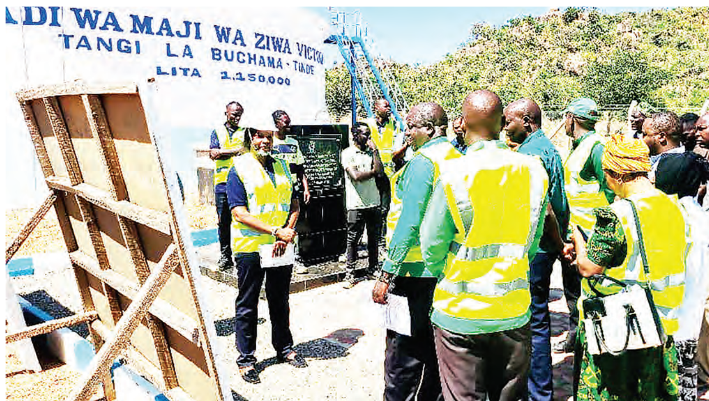
Wajumbe wa Kamati ya Siasa ya Chama Cha Mapinduzi (CCM), Wilaya ya Shinyanga Vijijini, wakitembelea kuangalia utekelezaji wa miradi ya maji inayotekelezwa na Mamlaka ya Maji Shinyanga (SHUWASA), katika kijiji cha Dida wilayani humo juzi.