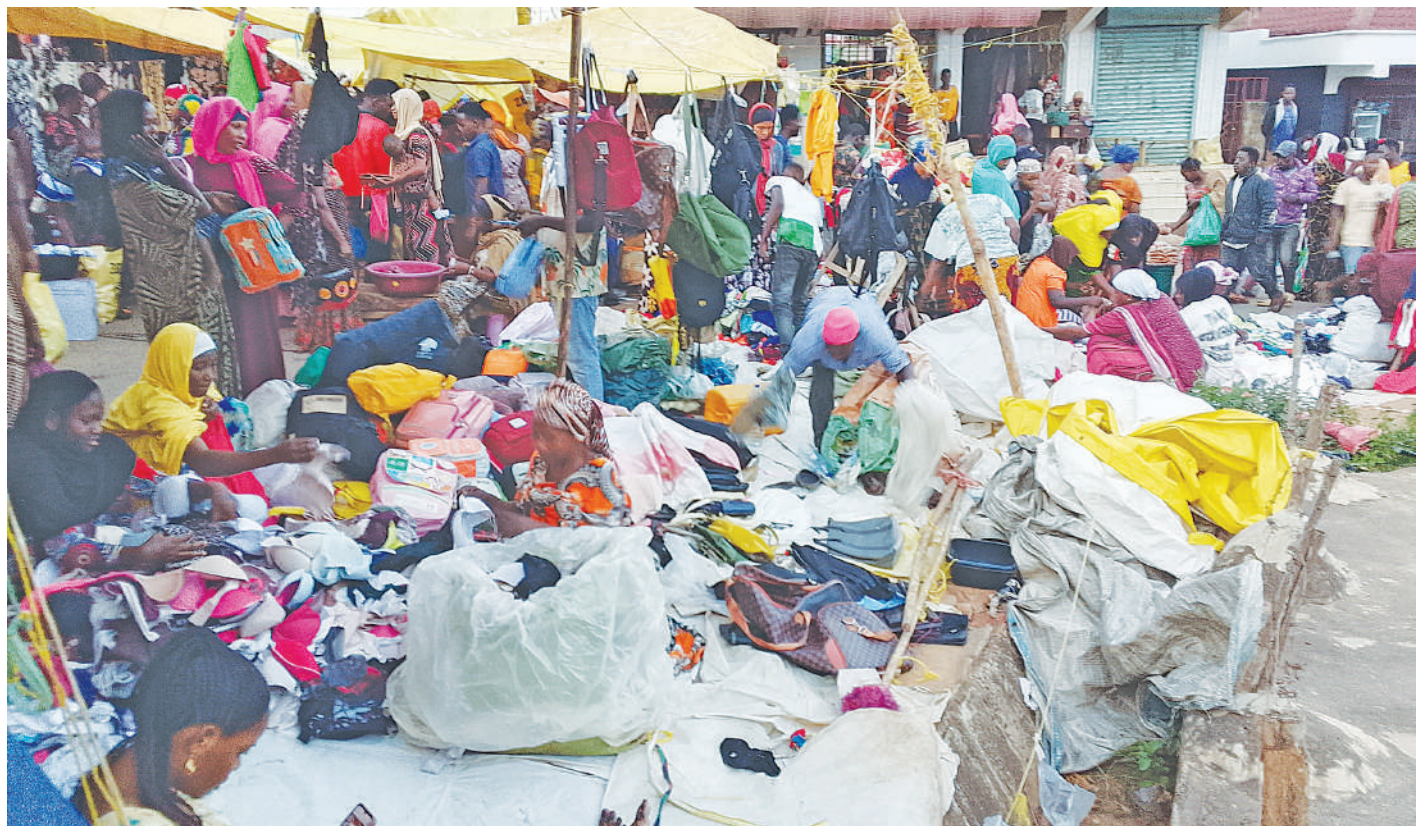
Wakazi wa Wilaya ya Muheza mkoani Tanga wakichagua nguo juzi katika gulio la Jumatatu kwa ajili ya sikukuu ya Krimas na Mwaka Mpya.

Dk. Abbasi, aliwataka watumishi wa NCAA kutoa ushirikiano wa kutosha katika utekelezaji wa majukumu ya taasisi.