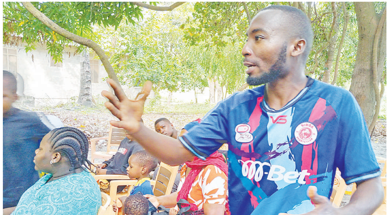
Ikeam Mnyani mkazi wa Kipunguni jijini Dar es Salaam akiuliza swali katika mafunzo ya kujua sheria mbalimbali yaliyofanyika kwenye viwanja vya Kituo cha Sauti ya Jamii Kipunguni yakitolewa na watumishi wa Dawati la Msaada wa Kisheria Dar es Salaam jana.

Katika hatua nyingine; Profesa Makubi amewapongeza watumishi hao kwa utendaji kazi na kuwahimiza kuongeza bidii zaidi ili kufikia malengo.