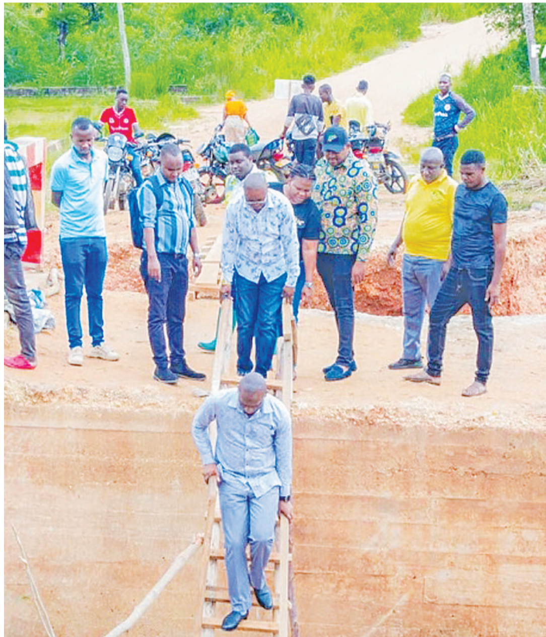
Ni msoto kwa wakazi wa Msumi na Madale Dar es Salaam, kusafiri kutokana na kukosa daraja kwa mwaka sasa.

•Kama ni pesa na mipango zipo zilizorudishwa Hazina