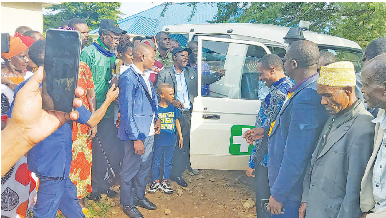
Mbunge wa Musoma Vijijini mkoani Mara, Prof. Sospeter Muhongo (katikati aliyenyoosha mkono), akiwa na wakazi wa Kata ya Bugwema jimboni humo wakati akikabidhi gari ya kubebea wagonjwa lililotolewa na serikali kwa kituo cha afya cha kata hiyo jana.