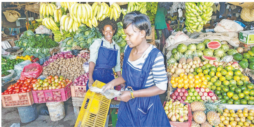
Furaha ya 'shopping' ya sikukuu, ilingane na mfuko.

Kumbukeni kuwa sherehe zinapomalizika unianza kilio, msongo wa mawazo, maradhi ya afya ya akili baada ya kuwa na wakati mgumu kutokana na kushindwa kulipa madeni makubwa ulioyisababishia kuanzia kukodi magari na