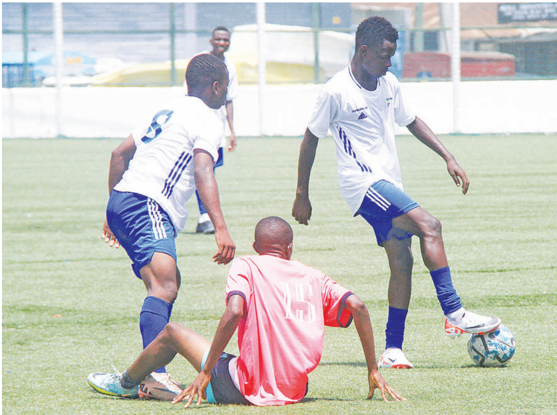
Vijana wa kituo cha michezo cha Jakaya Kikwete, wakiwania mpira wakati walipokuwa wakifanya mazoezi katika Uwanja wa Kituo hicho jijini Dar es Salaam jana.

Inacheza na Namungo ambayo inakamata nafasi ya 12 kwenye msimamo wa ligi, ikiwa na pointi 14 kibindoni.