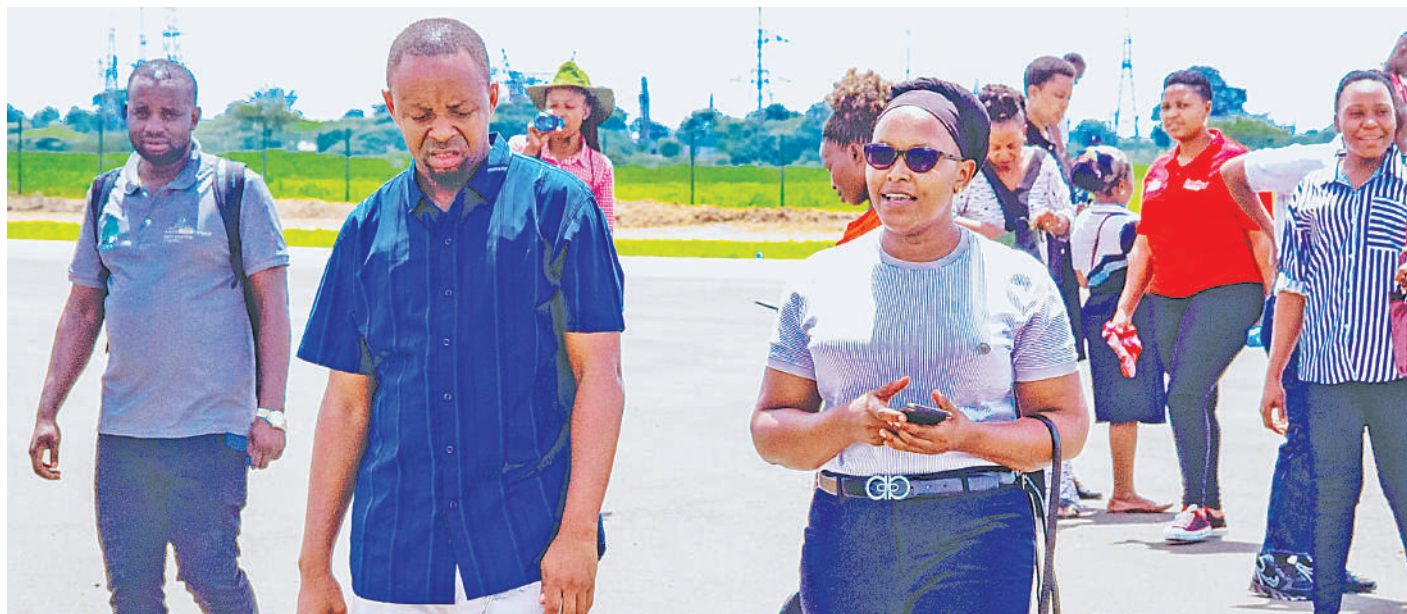
Waandishi wa habari mkoani Shinyanga wakitembelea maendeleo ya ujenzi wa uwanja wa ndege uliopo Ibadakuli Manispaa ya Shinyanga juzi, ambao kwa sasa umefikia asilimia 80 na unatarajiwa kukamilika Aprili mwakani kwa gharama za Sh. bilioni 44.8.

“Wamiliki wa kumbi za starehe wachukue tahadhari kwa kuhakikisha kunakuwa na hewa ya kutosha, kuchukua watu kwa idadi isiyozidi uwezo wao na kuwa makini wakati wote kwa kuwafuatilia watoto wote waliomo ndani ya kumbi na muda wa kumaliza na kutoka ni saa 12:00 jioni ili wawahi majumbani,” aliagiza.