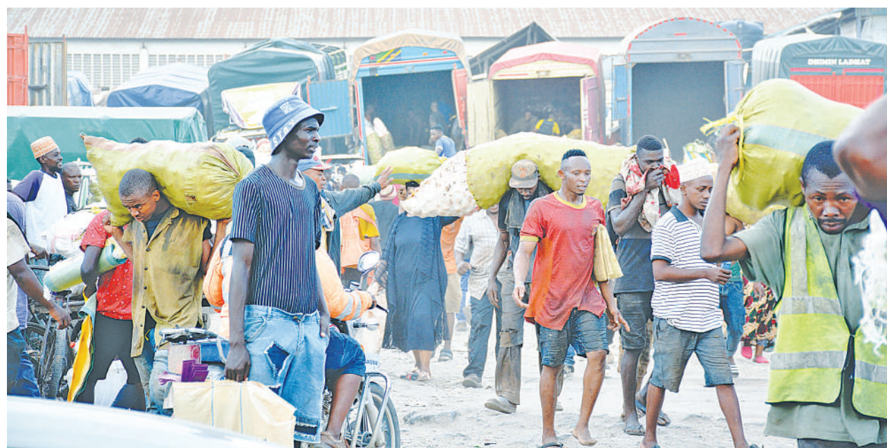
Vijana wakibeba mizigo ya wateja kuwapelekea nje kutokana na magari ya kushusha bidhaa kuongezeka kuelekea sikukuu ya Krismasi katika soko la Mabibo, Dar es Salaam jana.

Mbarouk, alisema ujenzi wa jengo hilo umefikia asilimia 85 na litakuwa na huduma zote za mahakama.