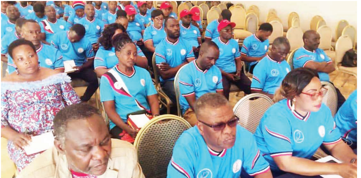
Wajumbe wa Mkutano Mkuu wa Chama cha Demokrasia na Maendeleo (CHADEMA), Kanda ya Nyasa, wakishiriki mkutano mkuu wa uongozi wa kujadili mikakati ya kukijenga chama hicho, jijini Mbeya juzi.

Tuzo hizo, alisema zitakabidhiwa na Spika wa Bunge, Dk. Tulia Ackson, kwa kushirikiana na taasisi mbalimbali za kihabari na kwamba washindi watapewa zawadi mbalimbali.