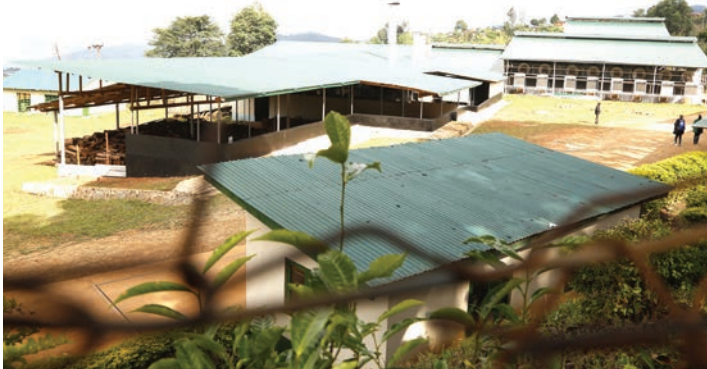
Sehemu ya nje ya mandhari ya Kiwanda cha Chai Mponde, Lushoto.

Kimsingi, Kiwanda cha Chai cha Mponde kinafanya kazi ya uzal-