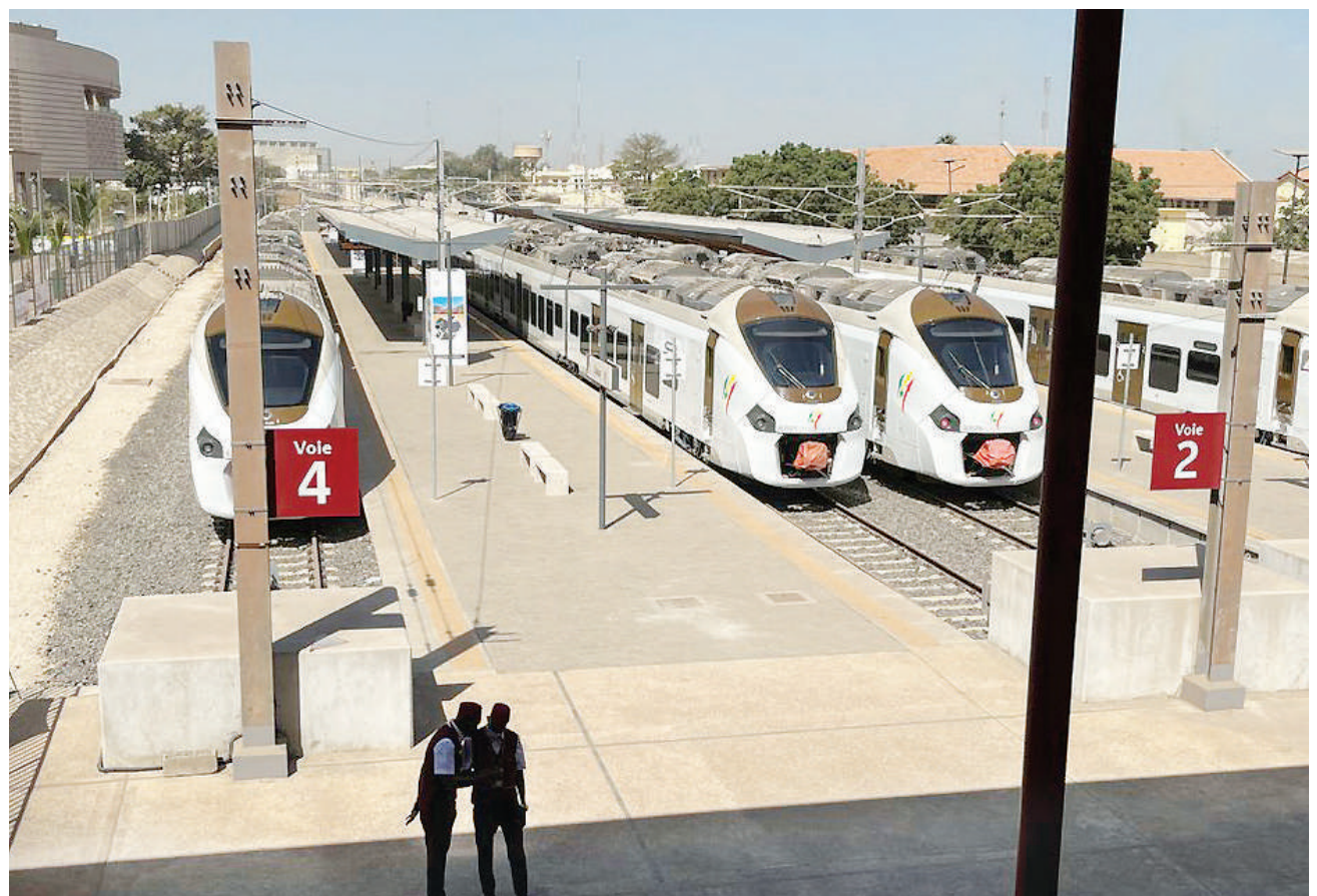
Wafanyakazi wakiwa kwenye stendi mpya ya usafiri wa umma wa treni wakati ikizindua kuanza kwa safari zake, jijini Dakar, nchini Senegal, juzi. Mradi huo wa treni una kilomita 40, utasafirisha abiria 115,000 kwa siku kutoka Dakar hadi Diamniadio, umegharimu dola bilioni 1.3.

Indu alituma picha kwa BBC za kundi la wanafunzi wakiwa na sare zao mpya, wakipiga selfie wakicheka na kuruka kwa furaha. BBC