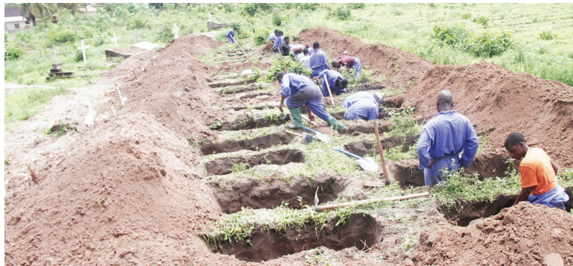
Wafanyakazi wa Jiji la Dar es Salaam, wakichimba makaburi katika eneo la Kitunda Mwanagati kwa ajili ya kuzika miili inayohamishwa kutoka Vingunguti jana.

“Ukitaka kujua maana ya intelijensia utamaliza miaka mitano ukuelezea uweze kuelewa. Ukizungumzia taarifa za intelijensia, ina vitu vingi sana na sina sababu za kueleza hapa, hivi unajua kuna vitu naweza kukwambia (mtangazaji) na vingine nisikwambie?”