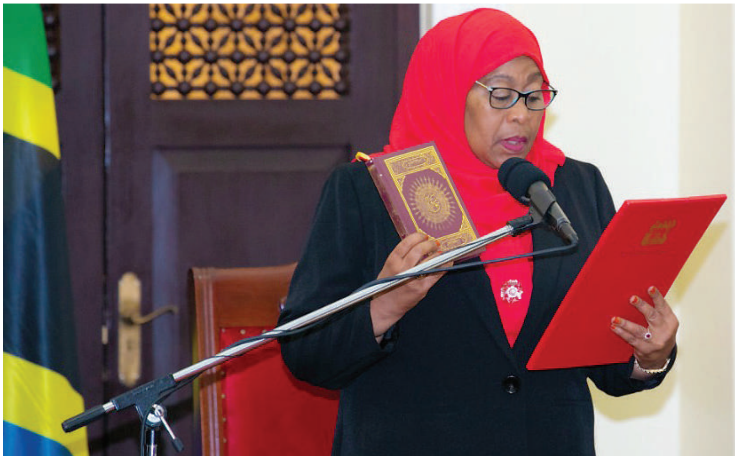
Rais Samia Suluhu Hassan akila kiapo.

Kwenye suala la umeme, Magufuli alidhibiti mgawo na alitamani kuona nchi nzima inakuwa na nishati hiyo kuanzia mijini hadi vijijini, akawa anafuatilia kwa umakini miradi yote ya umeme, ili kuhakikisha inajengwa na