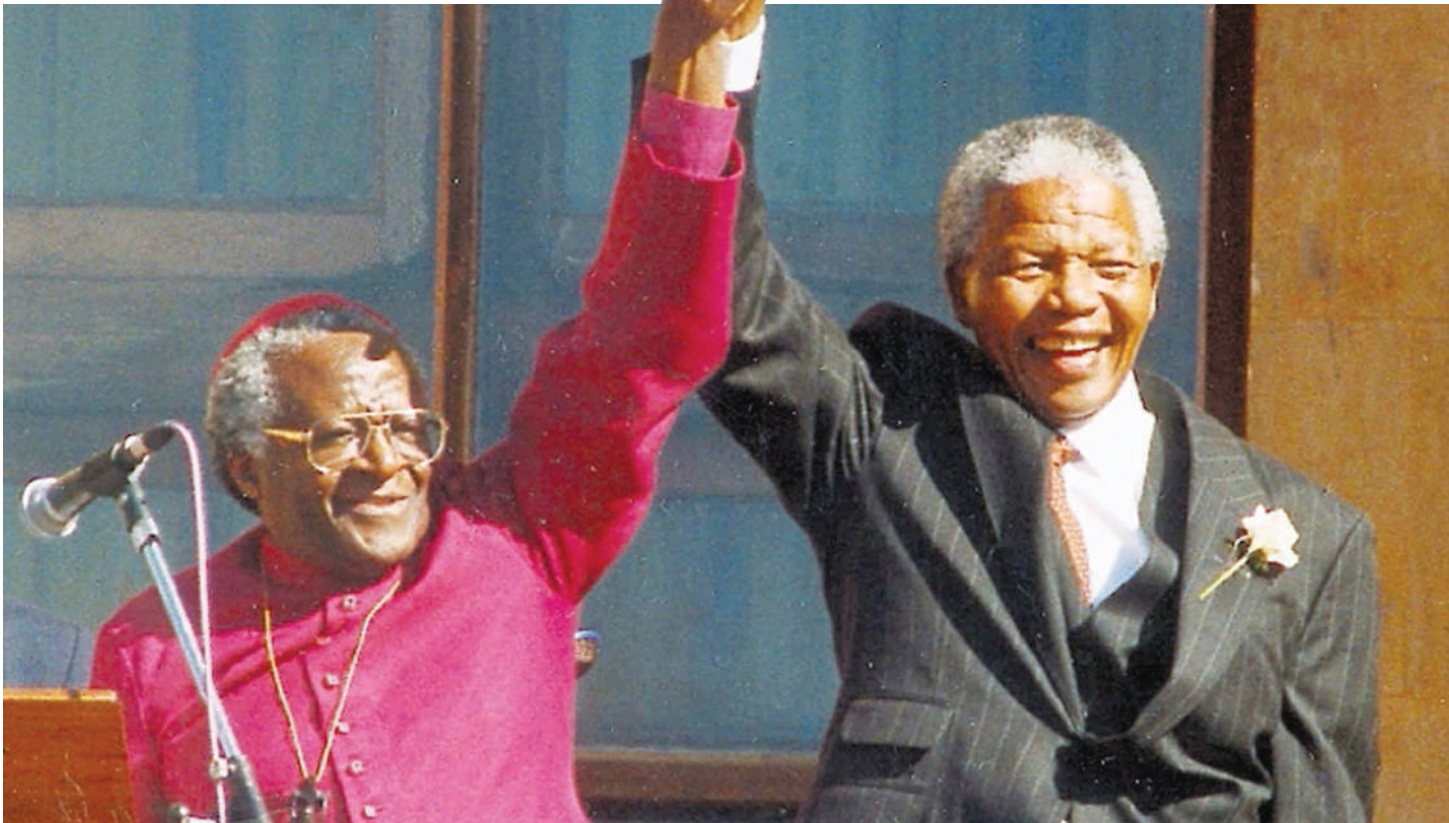
Askofu Desmond Tutu na Nelson Mandela baada ya uhuru wa Afrika ya Kusini.