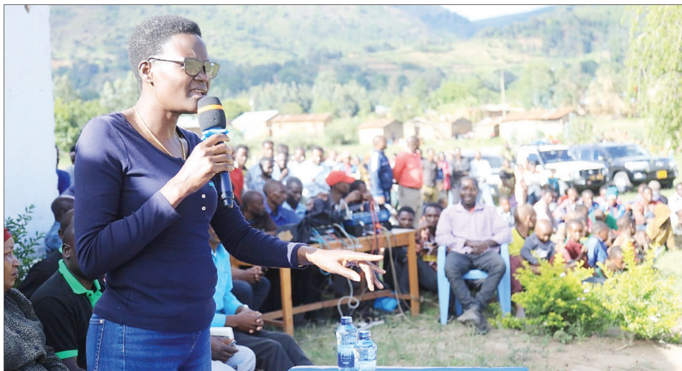
Mbunge wa Mbeya Mjini ambaye ni Naibu Spika wa Bunge, Dk. Tulia Ackson, akizungumza na wananchi wa Kata ya Iziwa alipotembelea kukagua miradi ya maendeleo ikiwamo elimu na barabara.