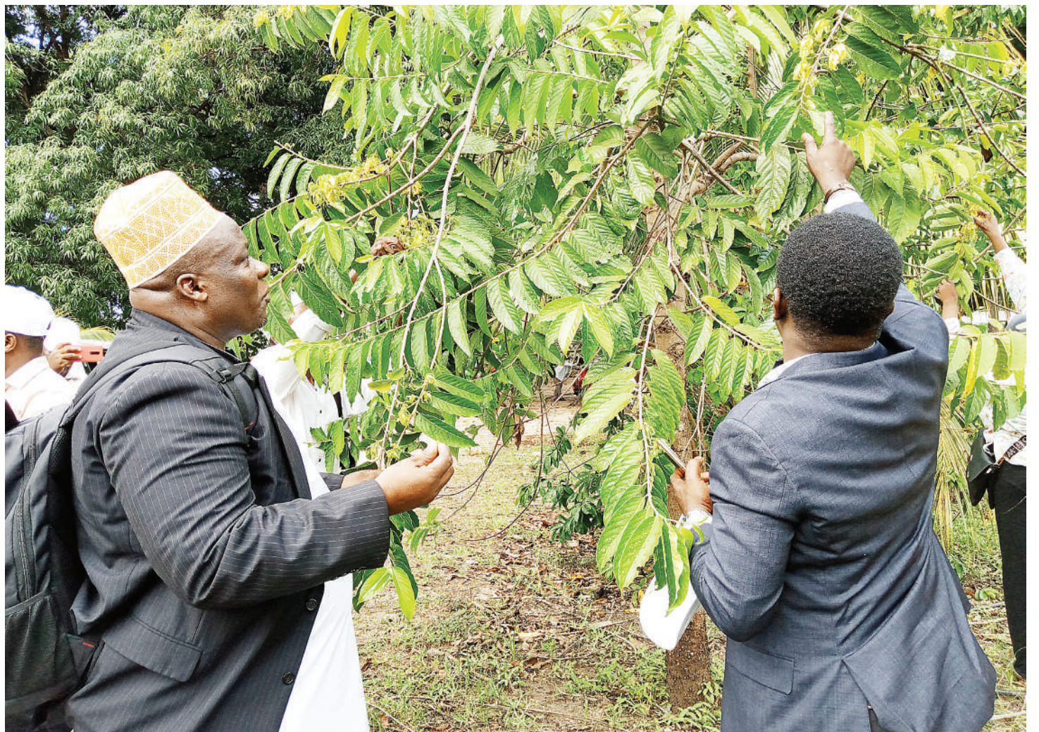
Baadhi ya wadau wa kilimo cha viungo wakiwa katika kiwanda cha Makonyo Wawi Pemba wakichuma maua ya mlangi langi ambayo hutumika kwa ajili ya kutengeneza mafuta na manukato mbalimbali.

Waziri huyo alisema tokea Mapinduzi ya mwaka 1964, Zanzibar imepiga hatua kubwa katika maendeleo ya kijamii na kiuchumi na kukuza demokrasia pamoja na kuongeza ushiriki wa wananchi katika maamuzi yanayohusu nchi yao.