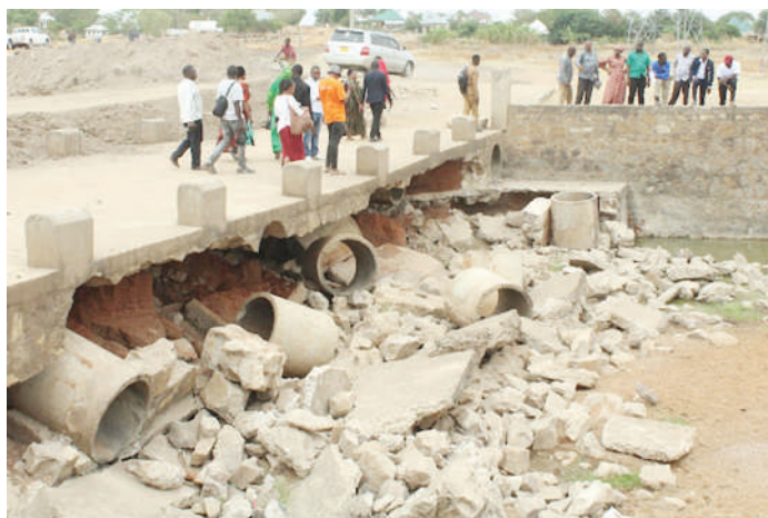
Mwonekano wa Daraja la Iwelyangula linalounganisha kata za Chamaguha na Kitangili, Manispaa ya Shinyanga, likiwa limebomoka kutokana na shughuli za kibinadamu kwenye daraja hilo.