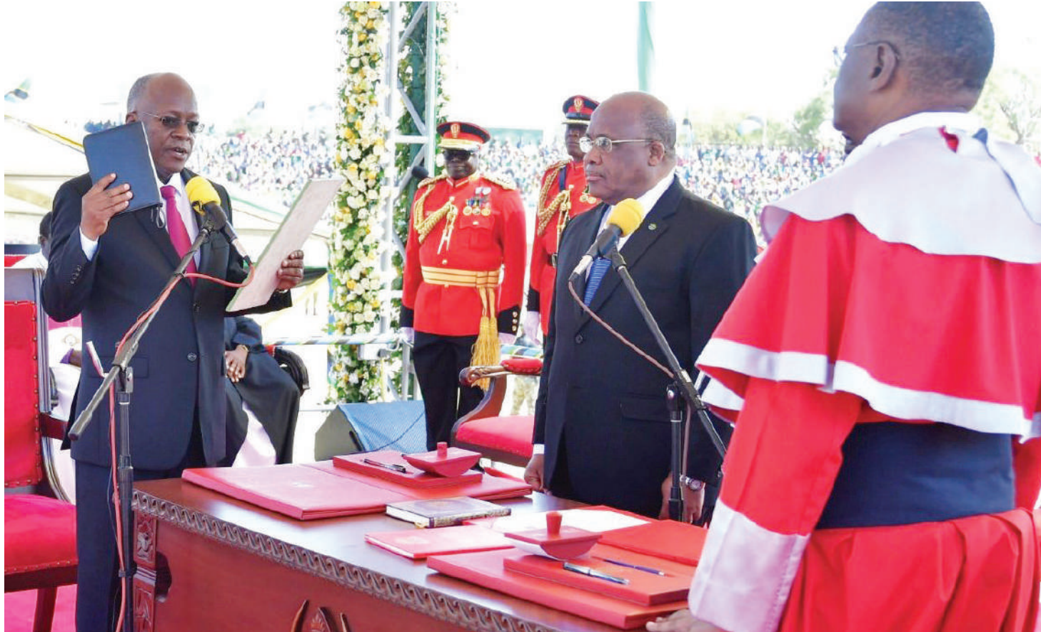
Rais John Magufuli alipokula kiapo kuiongoza Tanzania Novemba 2020, baada ya Uchaguzi Mkuu wa Oktoba.

Aidha, maamuzi ya bunge kupitisha tozo, ni eneo ambalo limeleta manung'uniko, zipo tozo za laini ya simu, miamala