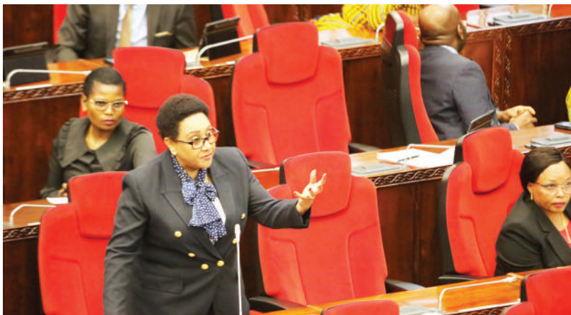
Waziri wa Mambo ya Nje na Ushirikiano wa Afrika Mashariki, Dk. Stergomena Tax aki-jibu maswali yaliyolizwa na baadhi ya wabunge, Bungeni jijini Dodoma jana.