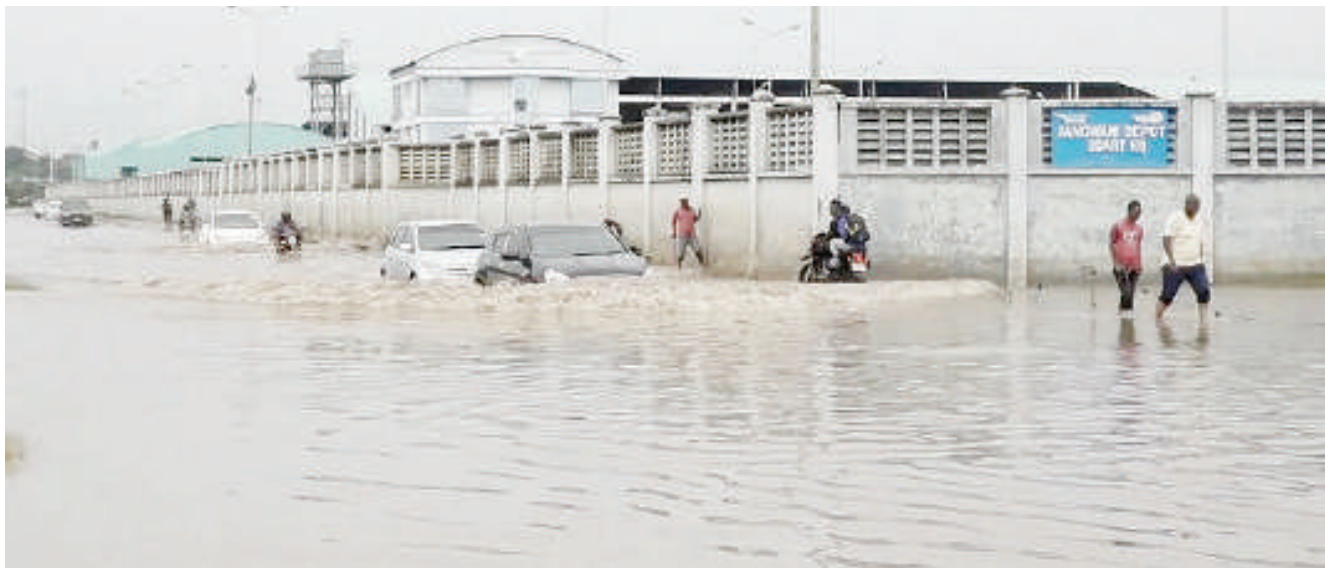
Baadhi ya magari yakipita kwa tabu katika Barabara ya Morogoro, eneo la Jangwani, kutokana na mafuriko yaliyo-sababishwa na mvua kubwa iliyonyesha mkoani Dar es Salaam jana.