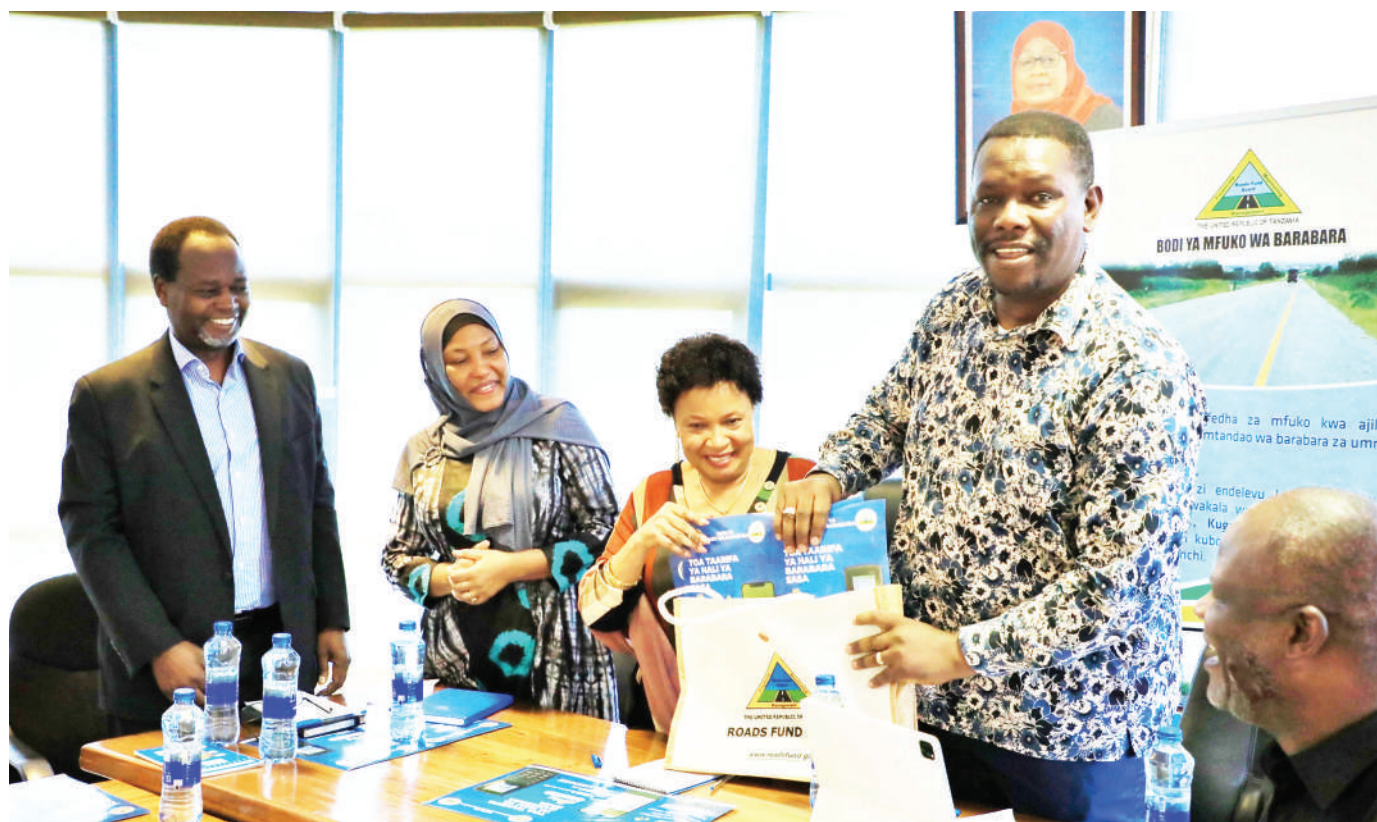
Madiwani wa Halmashauri ya Manispaa ya Shinyanga, wakiwa kwenye kikao cha kawaida cha robo tatu ya mwaka, wakijadili ajenda mbalimbali zikiwamo za miundombinu ya barabara, elimu, umeme, maji na afya kwa ajili ya mustakabali wa maendeleo ya wananchi wa manispaa hiyo, jana.