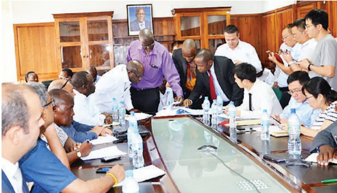
Kikao kinachohusu ufungaji wa zabuni ya umeme, kwenye mradi wa Stiegler's Gorge, kilipoendelea Dar es Salaam.