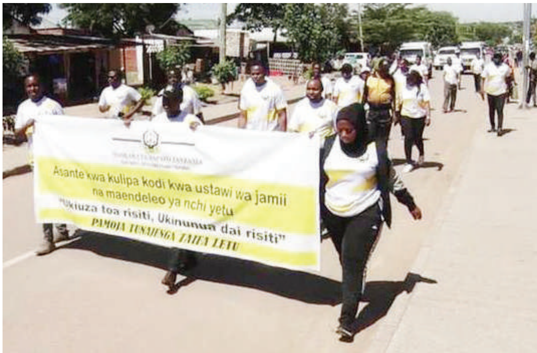
Watumishi wa Mamlaka ya Kodi Tanzania, wakihamasisha ulipaji kodi kwa hiari, mkoani Simiyu.

Hata hivyo, kuna baadhi ya miradi ya kiuchumi na maeneo ya kuhudumia taifa, seri-