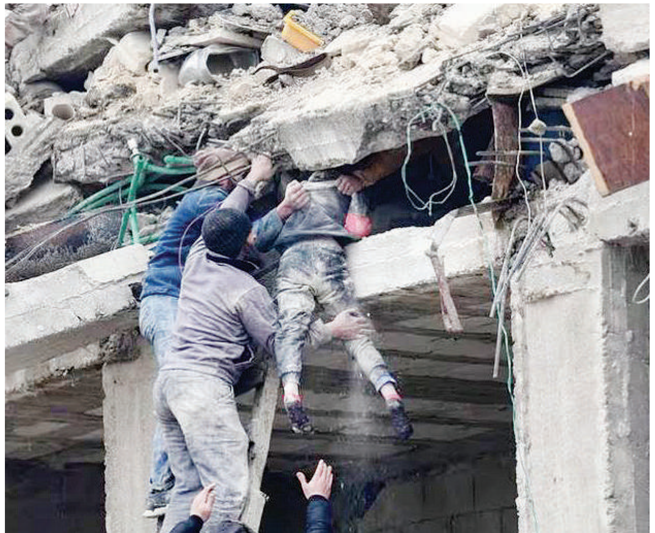
Wakaazi wakimwoko msichana aliyejeruhiwa kutoka kwenye vifusi vya jengo lililoporomoka nchini Syria.

Katika mji wa Aleppo nchini Syria, wafanyakazi katika hospitali ya Al-Razi walimhudumia mtu aliyejeruhiwa ambaye alisema ndugu zake 12 akiwemo mama yake na babaake walikufa wakati jengo walilokuwa wakiishi lilipoporomoka. BBC