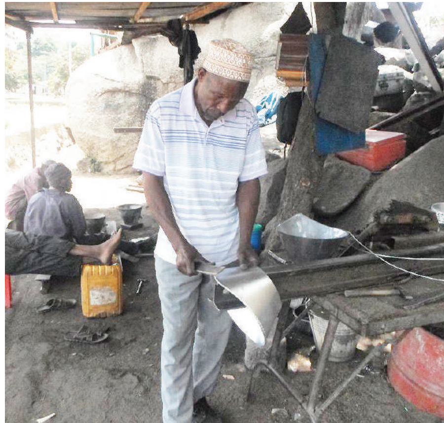
Mwenyekiti wa Mafundi katika kiwanda kidogo cha makarai, Pangoni Group, Maulid Madata, akiendelea kuunda sahani za mzani.

Fundi Madata anaitaka jamii iache tabia ya kuchagua kazi, kusubiri kuajiriwa na serikali, badala yake wajijari hasa vijana, kwani fursa za ajira ni kidogo ikilinganishwa na uhitaji wake, hivyo kujijari wenyewe inabaki kuwa njia suluhishi itakayowasaidia kujikwama kimaisha. SOKO LIKOJE?