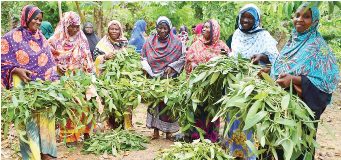
Wakulima wa kilimo mradi wa viungo kinachofadhiliwa na Jumuiya ya Ulaya (EU), wakiwa na mbegu baada ya kukabidhiwa shambani kwao kijijini Kizimbani, Mkoa wa Magharibi Unguja. Mradi unalenga kuwawezesha kinamama wa Zanzibar.

• EU yaungana nao, kinamama kicheko • Soko liko kona zote, kazi kwao ubora