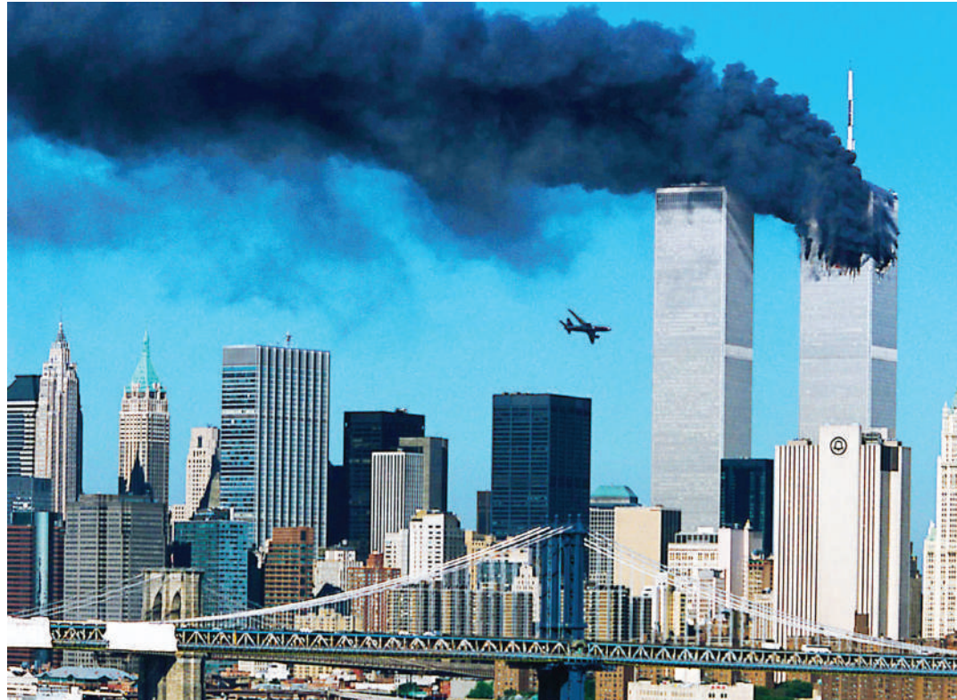
Majengo pacha iliyokuwa World Trade Center (WTC) katika mwonekano wake kabla na baada ya kushambuliwa Septemba 11, mwaka 2001.

Pamoja na umaarufu huo tukio hili lilihangaza dunia na hata nchi yenyewe. Shambulio la Septemba 11, mwaka 2001 ni tukio kubwa kuwahi kuitingisha Mare-