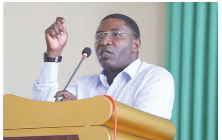
Waziri wa Nishati, Dk. Medard Kalemani

Aidha, alisema Shirika la TANESCO limeendelea kujitegemea na kuendesha shughuli zake bila kupata ruzuku ya takriban Shilingi bilioni 143 kwa mwaka kutoka