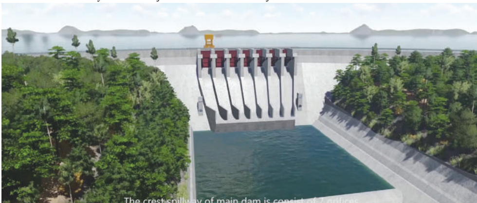
Bwawa la kuzalisha umeme la JNHPP Rufiji

Alisema, pamoja na maeneo hayo ya kisekta, Wizara pia itazingatia maeneo mengine yanayolenga kuleta tija katika utekelezaji wa majukumu ya Wizara ikiwa ni pamoja na kuwajengea uwezo watumishi wa Wizara na Taasisi zake katika kusimamia Sekta, kuboresha mazingira ya kazi kwa watumishi ili kutoa huduma bora; na kuendelea kuelimisha umma kuhusu masuala ya nishati.