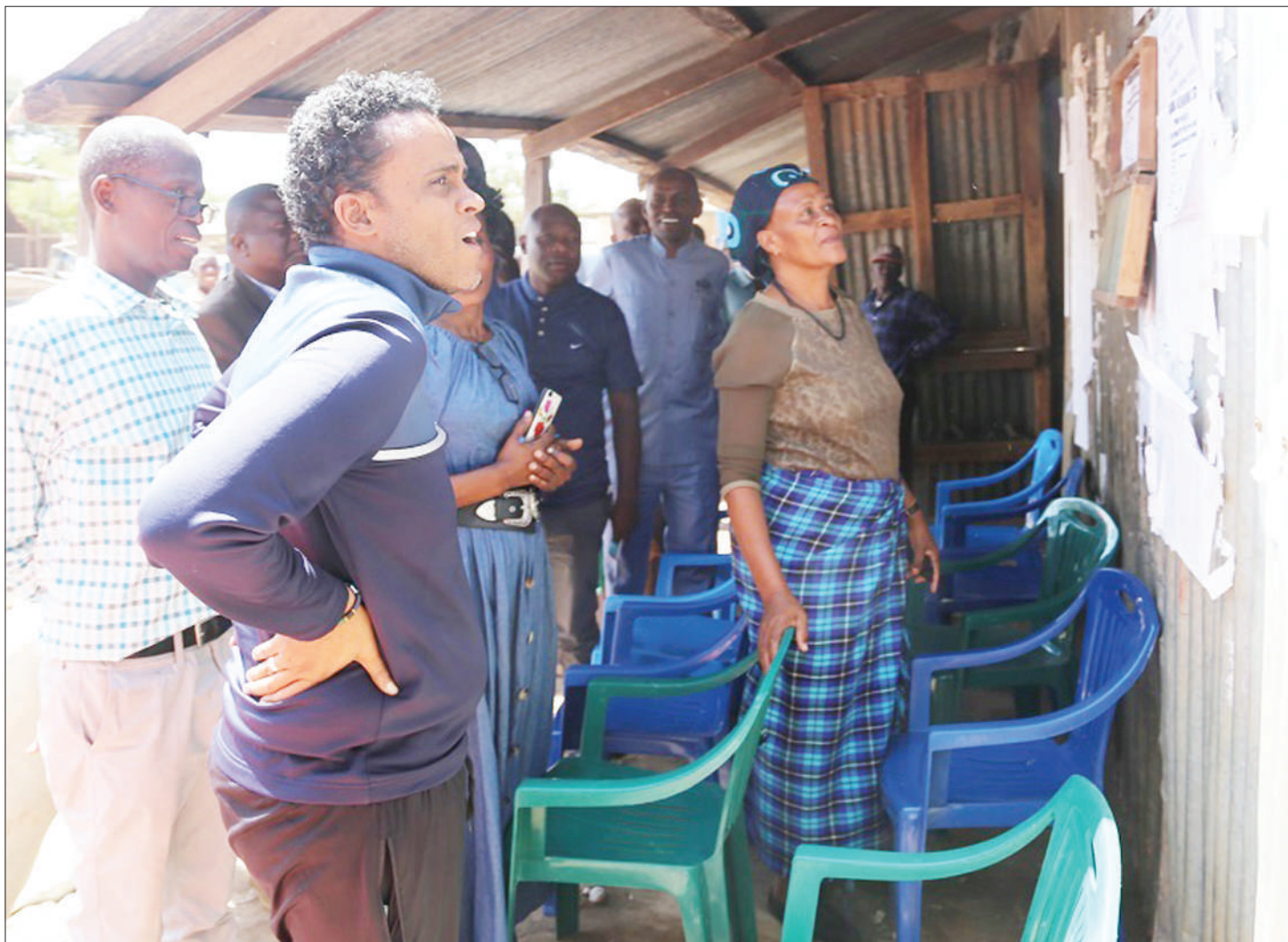
Naibu Waziri wa Kilimo, Hussein Bashe, akikagua bei ya zao la pamba jana, katika ziara yake ya kukagua maendeleo ya masoko ya pamba na kuhamasisha wakulima wa zao hilo kulima kwa wingi alizeti, choroko, dengi na pamba wilayani Igunga.

Alisema pia wana dawa mpya ya kuongeza nguvu za kiume ambayo kidonge kimoja kinauzwa kwa Sh, 4,000, pamoja na dawa ya kutibu ugonjwa moyo.