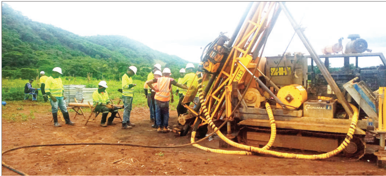
Wataalamu wa Jotoardhi kutoka kampuni ya TGDC kwa kushirikiana na STAMICO wakiendelea na uchorongaji visima katika eneo la Kyejo- Mbaka lilipo Halmashauri ya Busokelo mkoani Mbeya kwa ajili ya uzalishaji wa nishati ya umeme mwishoni kwa wiki.