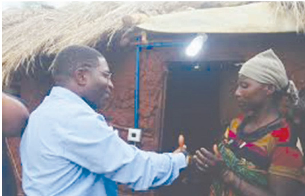
Waziri wa Nishati Medard Kalemari akizungumza na mnufaika wa umeme vijijini

Alisema wameendelea kuunganisha wananchi kwa kutumia mifumo ya nishati jadidifu katika maeneo yaliyopo mbali na Gridi