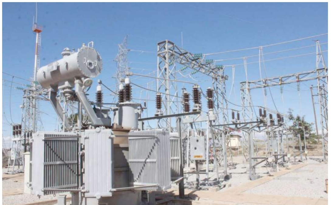
Mitambo ya kuzalisha umeme

Alisema jumla ya Shilingi trilioni 1.4 fedha za ndani zimetengwa katika mwaka 2021/22 kwa ajili ya kutekeleza kazi hizo na kwamba ujenzi wa mradi huo