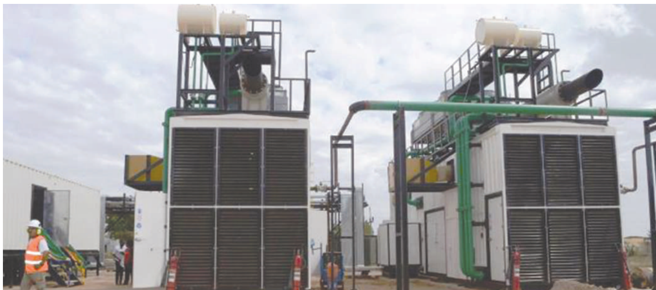
Baadhi ya mitambo ya kuzalishia umeme

Aidha, alisema majadiliano yamekamiliwa na kuridhiwa kusainiwa (intialed) kwa mikataba ya uendeshaji wa Bandari ya Chongoleani na mikataba ya ukodishaji wa ardhi kwa ajili ya