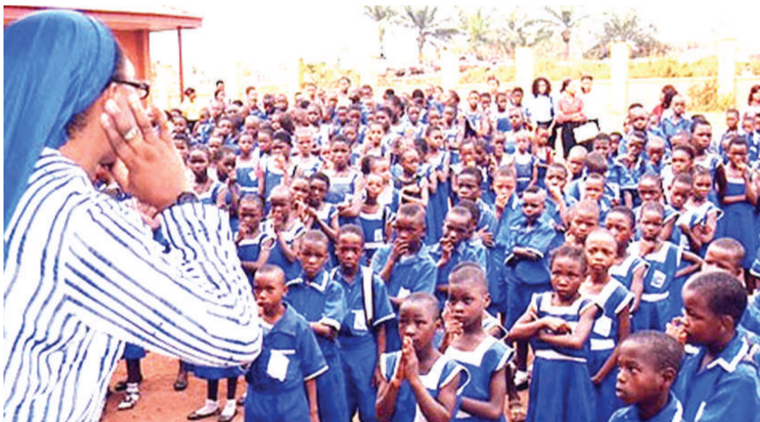
Wasichana wanastahili kuwa shuleni na kusoma siyo kuozwa utotoni na kukwamishwa kimaisha.

Huyo alikuwa akisoma Sekondari ya Mwantini, tukianza kwenye mkakati ulivyopangwa wa kumwozisha mwanafunzi huyo hadi kufikia