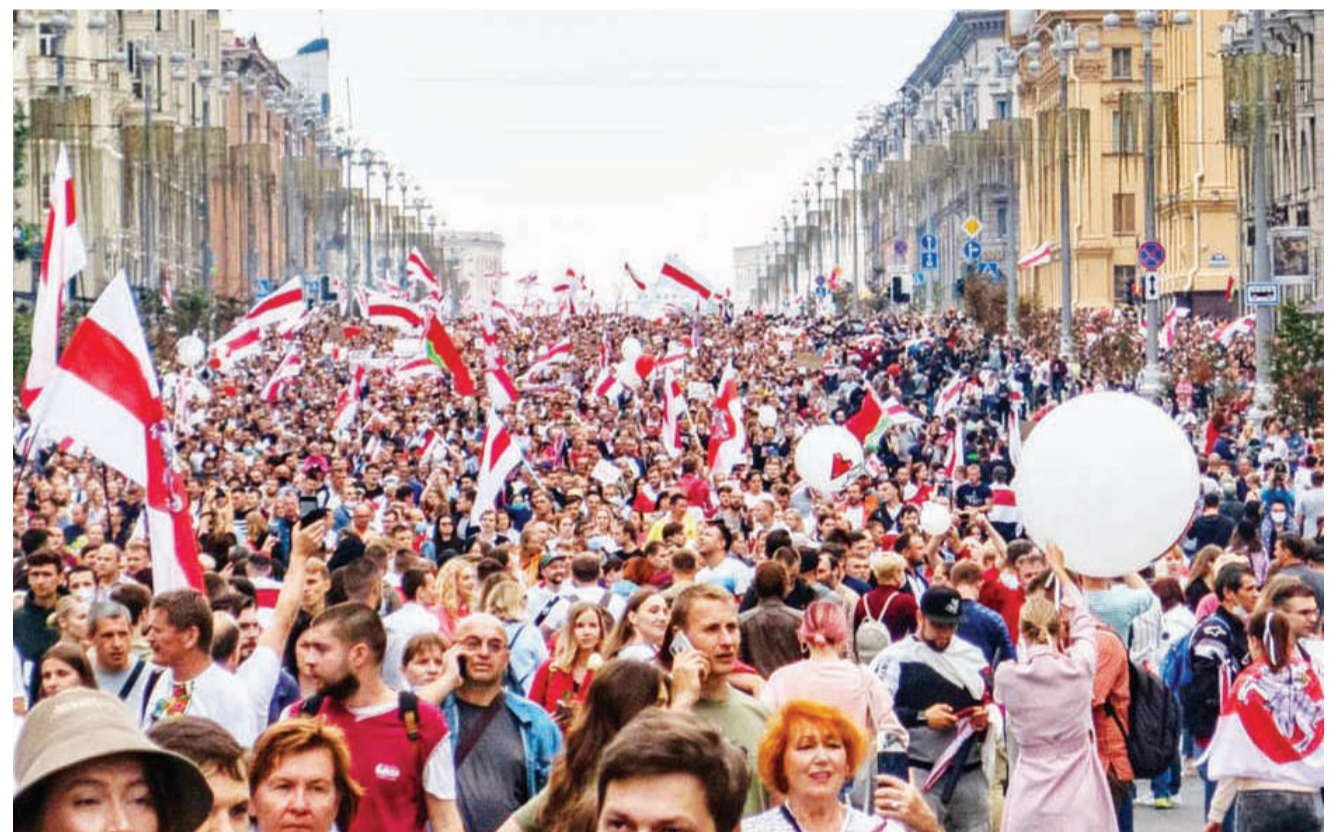
Waandamanaji wakijitosa mitaani nchini Belarus kuipinga serikali.

Israel imethibitisha zaidi ya maambukizi 153,000 na vifo 1,108 vilivyotokana na Covid-19, kwa mujibu wa takwimu ya Chuo Kikuu cha Johns Hopkins. BBC