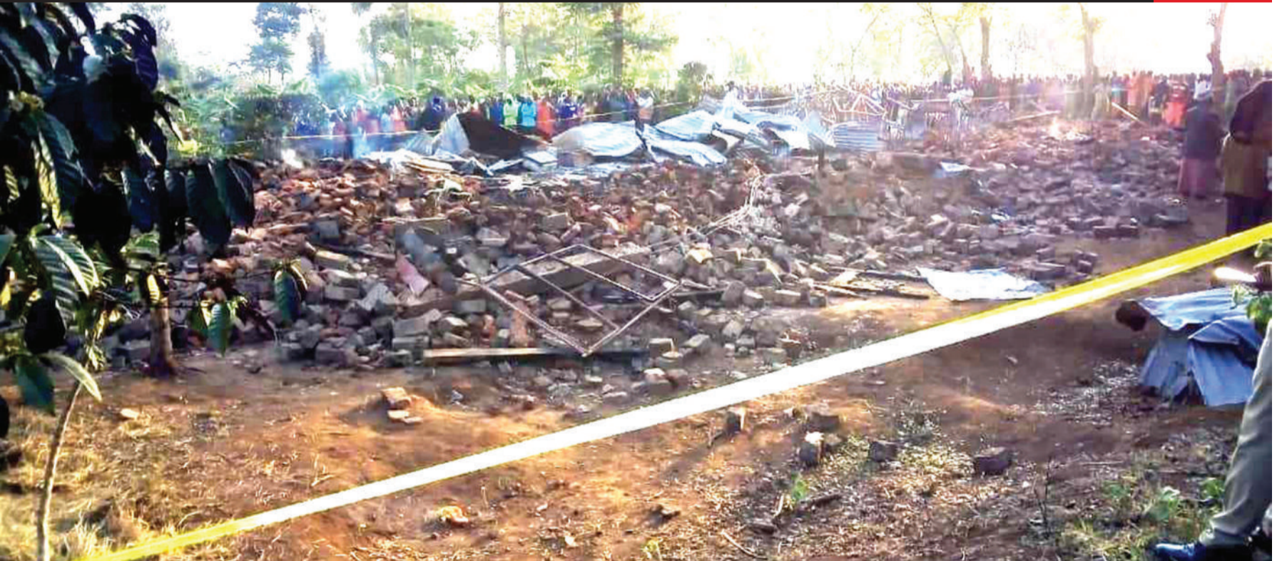
Mabaki ya bweni la wavulana katika Shule ya Msingi Byamungu Islamic, iliyoko Kata ya Itera wilayani Kyerwa, Mkoa wa Kagera, baada ya kuteketea kwa moto uliotokea usiku wa kuamkia jana na kusababisha vifo vya wanafunzi 10 na majeruhi sita.