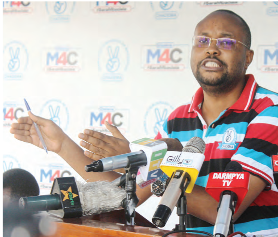
Katibu Mkuu wa Chama cha Demokrasia na Maendeleo (CHADEMA), John Mnyika, akizungumza na waandishi wa habari, jijini Dar es Salaam jana.

“Lissu amekamilisha matibabu yake. Licha ya kuandikia barua na kukumbusha Januari 7, mwaka huu, bado hutujapatiwa