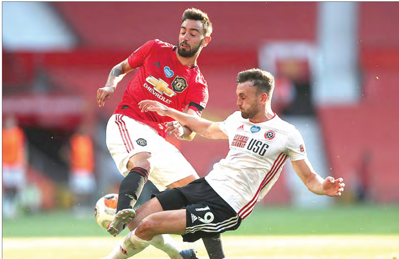
Kiungo wa Manchester United, Bruno Fernandes (kushoto), akipambana kuwania mpira dhidi ya beki wa Sheffield United, Jack Robinson katika mechi ya Ligi Kuu England iliyochezwa juzi usiku. United ilishinda mabao 3-0.