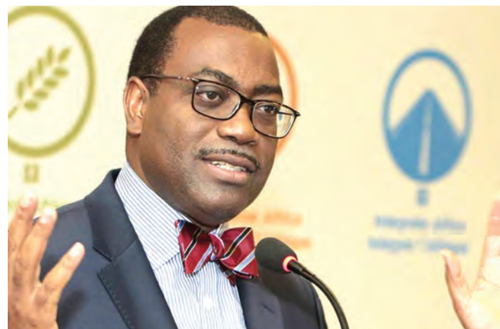
Rais wa Benki ya Maendeleo ya Afrika (AfDB), Dk. Akinwumi Adesina.

Pia, nchi kama Marekani hadi sasa haina taasisi kama hizo, ila mashirika ya kuratibu sekta tofauti. Inaeleza nguvu za kiuchumi za kampuni za China zinazopata mtaji wowote inazohitaji kutoka serikali ya China, inavuruga ushindani katika kutafuta tenda tofauti nchi nyingi duniani, kwa kutoa bei ya chini kwa kandarasi za ujenzi.