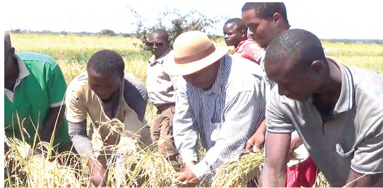
Walima mpunga katika wilaya ya Kilimo, Halmashauri ya Mji Kahama, wakiwa katika mavuno.