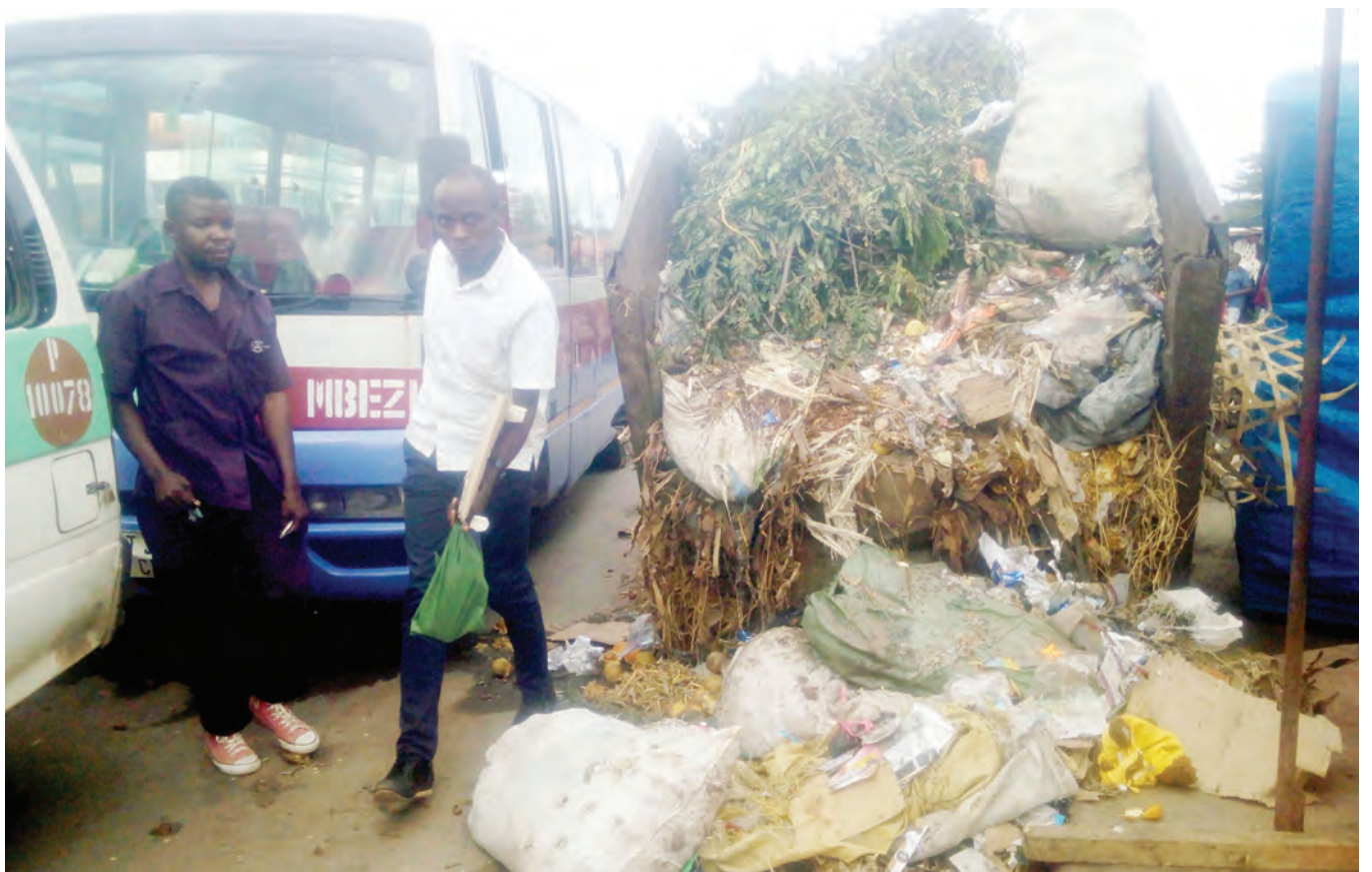
Mkazi wa Jiji la Dar es Salaam akipita jirani na rundo la takataka zilizotelekezwa kwa takribani wiki moja sasa katika kituo cha daladala cha Tabata Segerea, jana, kitendo kinachoweza kusababisha magonjwa ya mlipuko.

Aidha, Mkanjiwa alisema kwa sasa hatua waliyochukua ni kuwaelimisha watu wote wenye ulemavu juu ya umuhimu wa kujitokeza na kugombea nafasi za uongozi pamoja na kuwaelimisha wananchi wengine umuhimu wa kuchagua viongozi wenye ulemavu kuanzia ngazi ya kata hadi wilaya.