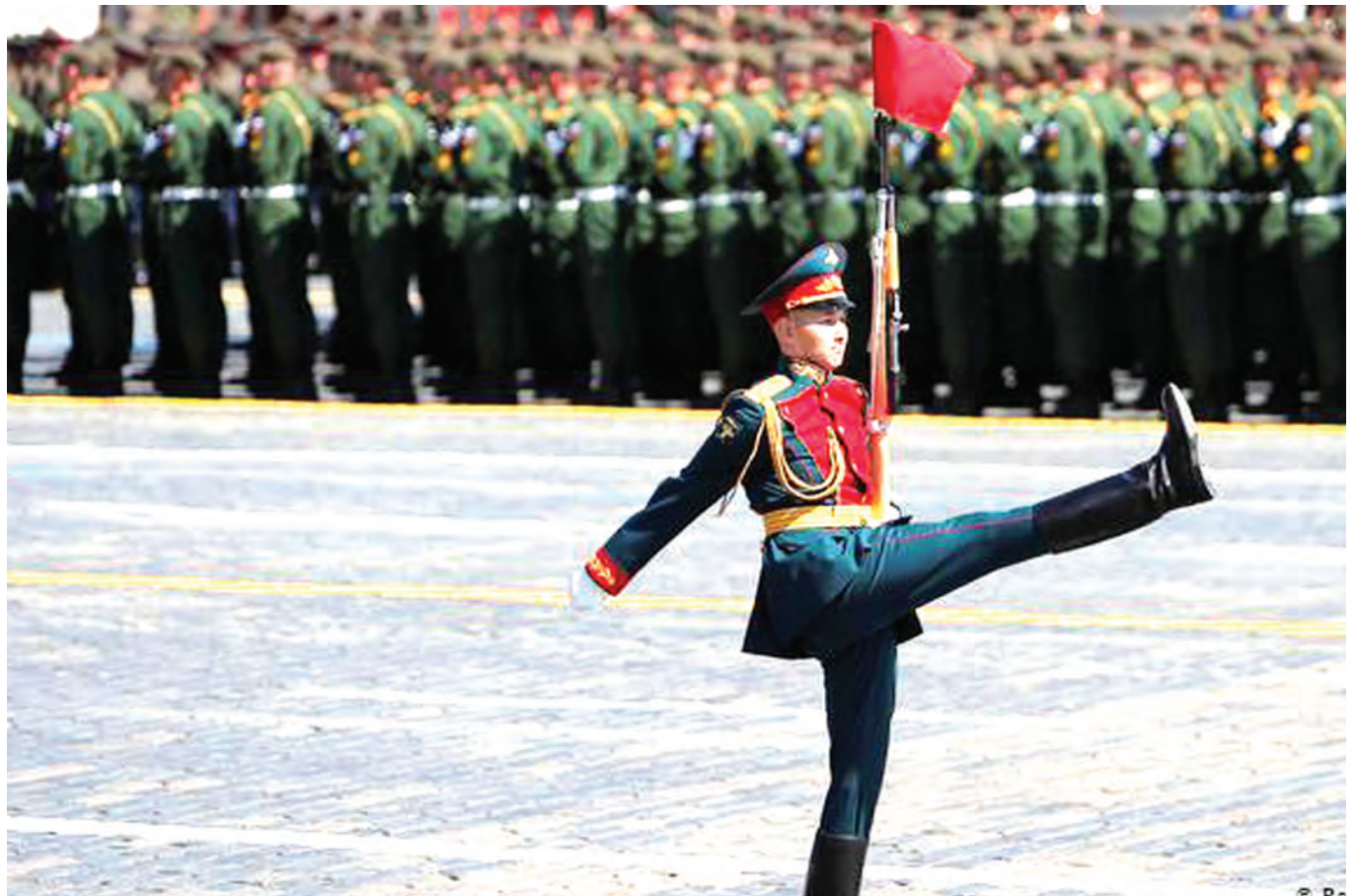
Askari wa Urusi akiwa katika gwaride kwenye Uwanja Mwekundu mjini Moscow, katika sherehe ya kuadhimisha miaka 75 tangu jeshi la Kisovietii maarufu kama "Red army" kuishinda Ujerumani.