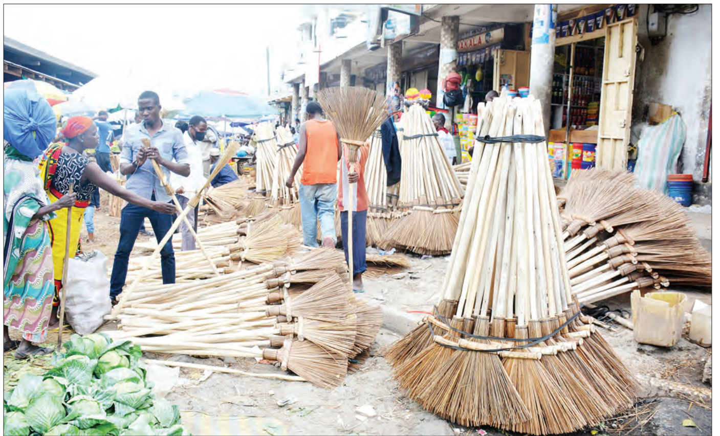
Mfanyabiashara wa mafagio, akiwauzia wateja wake katika Soko la Ilala, jijini Dar es Salaam jana. Fagio moja liliuzwa kwa bei ya 1,500/-.

Aliwashukuru wananchi wa wilaya hiyo kwa umoja na mshikamano waliompatia katika kipindi chote cha miaka mitano na kuwasisitiza waendeleo na ushirikiano huo kwa ajili ya maendeleo ya wilaya yao na taifa.