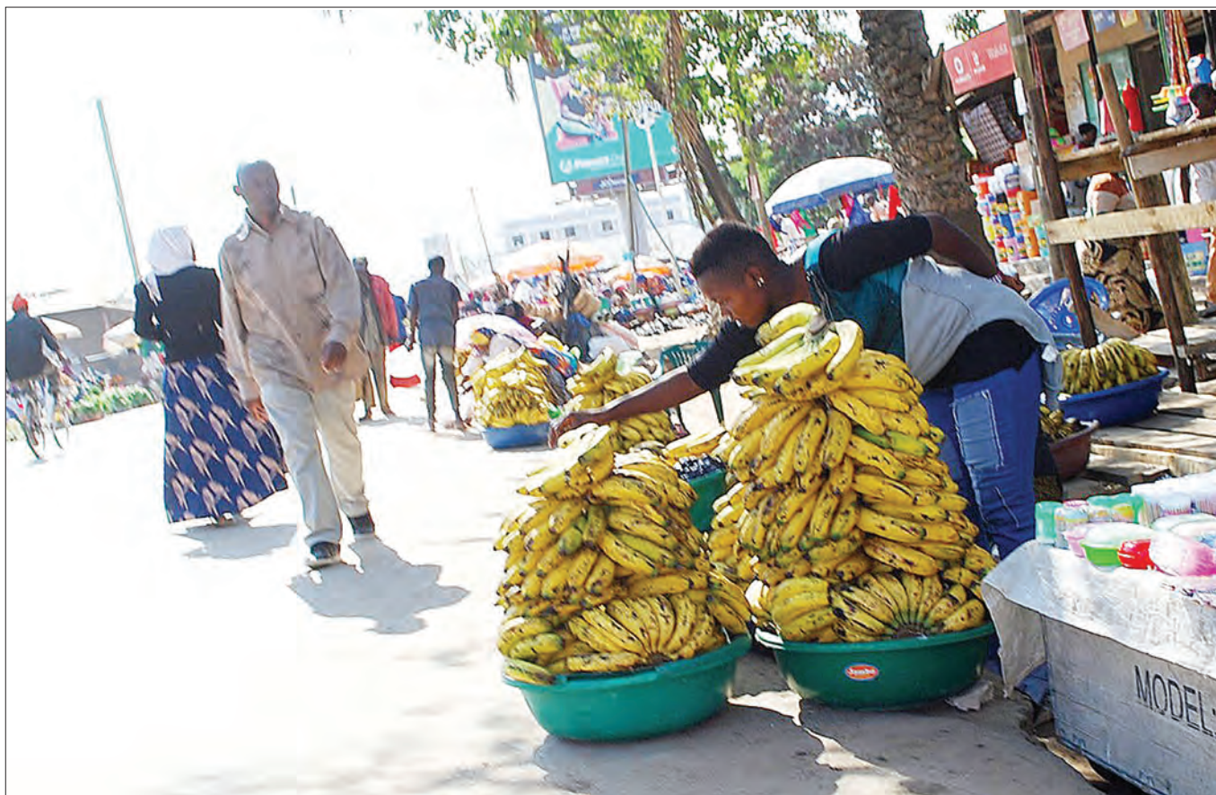
Mchuzi wa ndizi, akipanga biashara yake pembezoni mwa barabara ya Soko Kuu la Majengo, jijini Dodoma jana, kitendo ambacho ni hatari kwa usalama wake.

"Kama kiongozi baada ya kuona hali inakuwa mbaya nikaamua kuchukua hatua kwa kushirikiana na wakulima kutafuta mnunuzi nje ya mnada na ambapo tumempata na atachukua mzigo huo kwa Sh. 1,400 na wakulima wameridhisha," alisema.