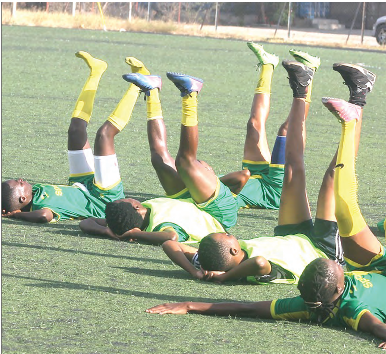
Wachezaji wa Yanga Princess wakifanya mazoezi kwenye Uwanja wa Karume jijini, Dar es Salaam ili kujiandaa na mechi za Ligi Kuu ya Wanawake Tanzania inayotarajiwa kurejea tena kuanzia keshokutwa.

Baada ya hapo ikaanza kutoa sare mfululizo ya bao 1-1 dhidi ya Mtibwa Sugar, bila kufungana dhidi ya Polisi Tanzania, sare ya bao 1-1 dhidi ya Biashara United na pia sare kama hiyo dhidi ya Yanga hiyo ikiwa ni mechi ya mzunguko wa kwanza na iliporejea baada ya mampuziko ya janga la corona ilianza kwa sare ya mabao 2-2 dhidi ya Coastal Union na kuichapa Kagera Sugar mabao 2-0.