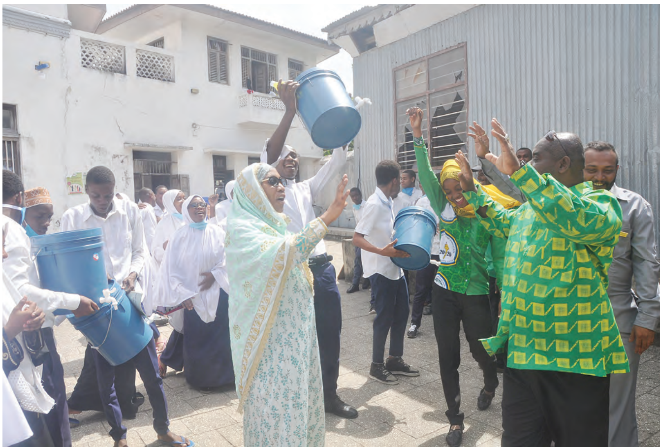
Walimu na wanafunzi wa Shule ya Sekondari ya Hamamni, Mjini Unguja, wakifurahi baada ya kukabidhiwa vifaa vya kujikinga na mambukizi ya virusi vya corona kutoka uongozi wa Chama Cha Mapinduzi (CCM) Tawi la Shangani, juzi.

"Najua vijana mmejitokeza kwa wingi kumuunga mkono Rais Magufuli kwa sababu amefanya kazi kubwa katika kuwanyanyua vijana nafasi za uongozi wa nchi," alisema.