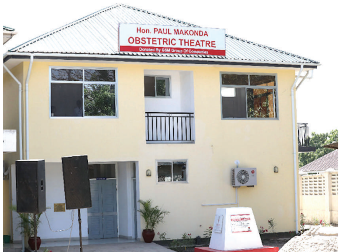
Jengo jipya la upasuaji kwa wajawazito katika Hospitali ya Rufani Mwananyamala.

“Wahalifu na watumishi wasiyo waadilifu walitumia kufanya uhalifu huo kwa sababu haiwezekani kabisa, mtoto anapotea wodini wakati mzazi akiwa chini ya uangalizi wa madaktari na manesi.