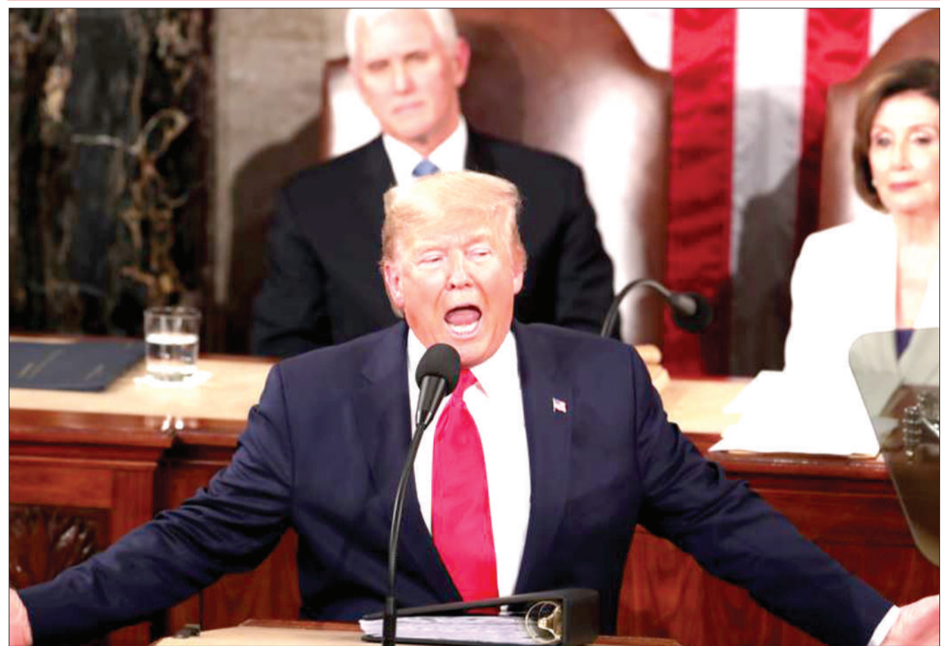
Rais wa Marekani, Donald Trump akitoa hotuba yake ya tatu ya hali ya Taifa hilo.