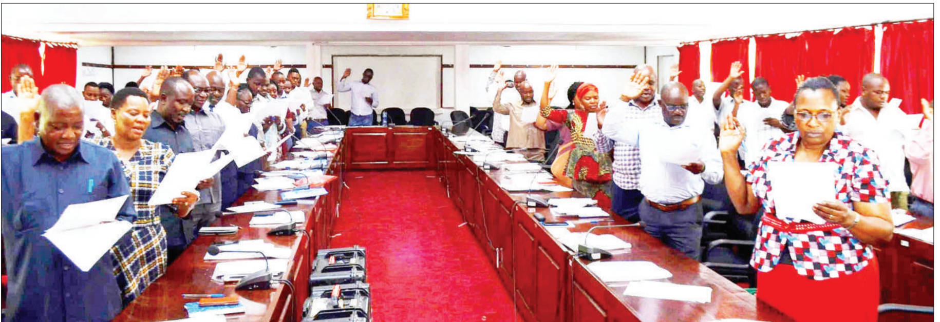
Baadhi ya wakurugenzi na maafisa wa Mkoa wa Dar es Salaam, wakila kiapo wakati wa mafunzo ya Daftari la Kudumu la Mpigakura, jijini jana.