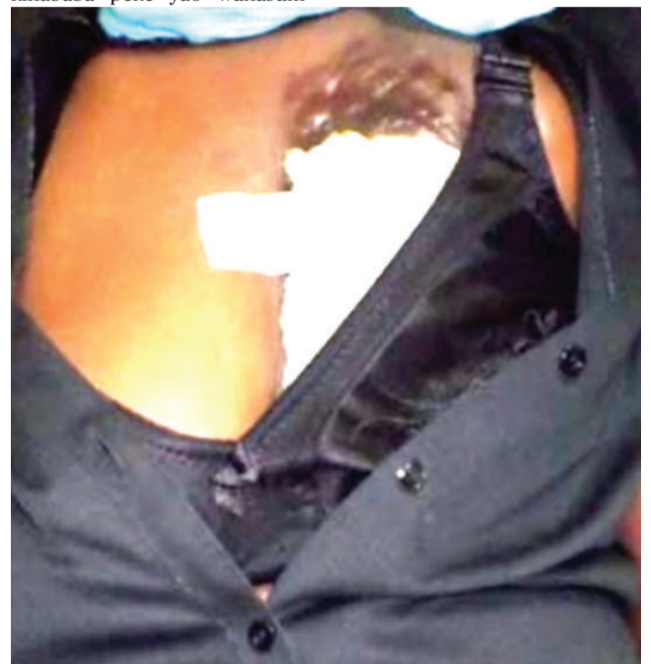
Mgonjwa wa kansa ya titi.

Inaelezwa, saratani ni ugonjwa unaochukua muda mrefu kujitokeza, hata wastani kati ya miaka 10 hadi 20, hivyo kuna wakati inakuwa vigumu kugundua chanzo chake.