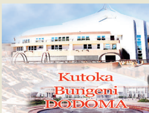
Habari zote na Augusta Njoi, DODOMA

Biteko alisema baada ya kuachiwa kwa eneo hilo, utaratibu maalum unaandaliwa wa namna bora ya kuligawa kwa kutoa leseni za uchimbaji wa kati kwa Watanzania wenye uwezo ili kuongeza mchango wa Watanzania katika uchumi wa madini.