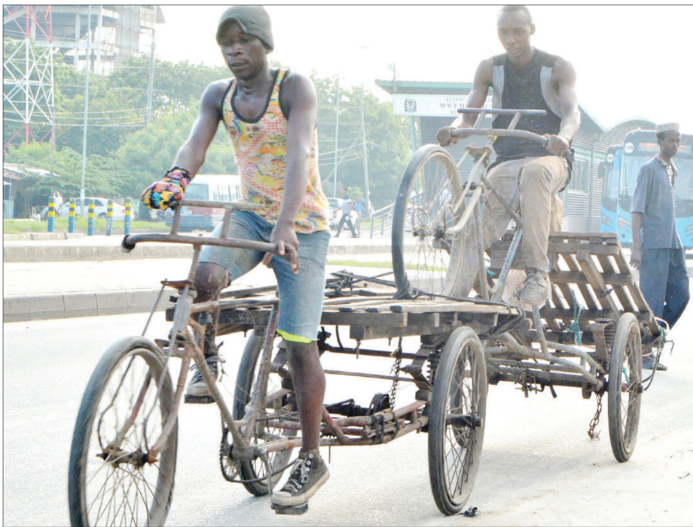
Mwendesha guta akimkokota mwenzake kwa staili ambayo ni hatari kwa usalama barabarani, baada ya kupata pancha katika eneo la Mago-meni Mwembechai, jijini Dar es Salaam jana.

"Sisi kama viongozi na wenyeviti wa hizo kamati tutahakikisha baada ya hii semina tutaenda kuwahamasisha watumishi wetu kufanya kazi kwa nidhamu na weledi mkubwa katika kuwatendea haki wananchi," alisema Sengati.