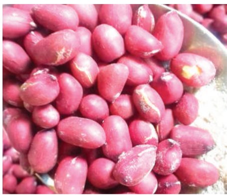
Karanga zilizokaagwa.