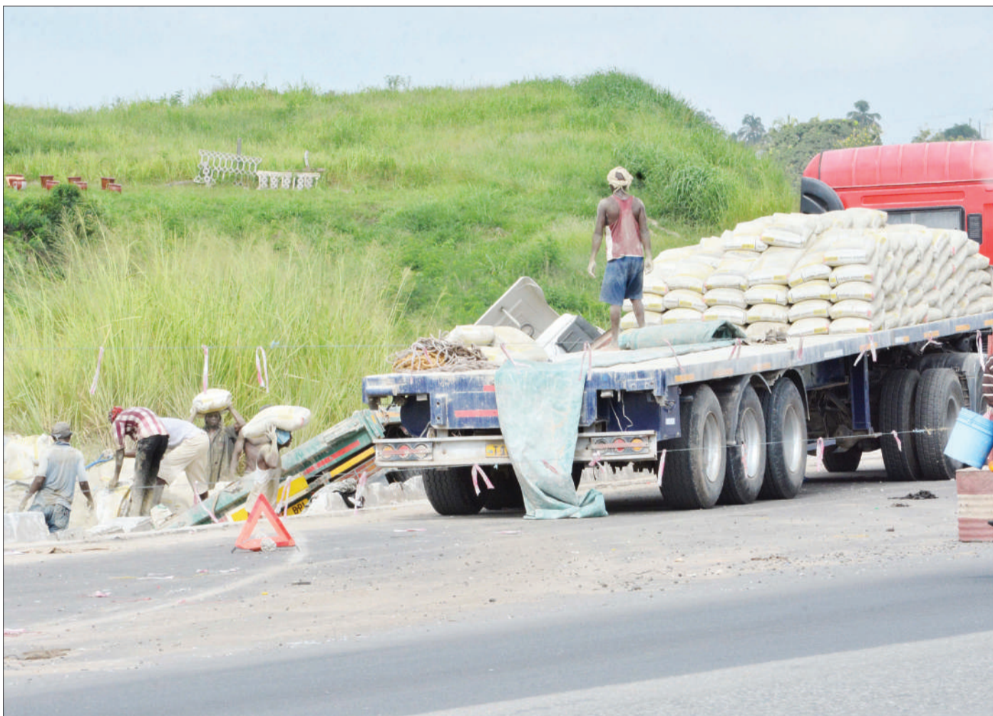
Wabeba mizigo wakihamisha saruji baada ya gari lililokuwa limebeba kupinduka katika eneo la Kibanda cha Mkaa Mbezi, jijini Dar es Salaam jana.

Rais Magufuli alimshukuru Fanti kwa juhudi zake za kuimarisha uhusiano wa Tanzania na EU na akamahakikishia kuwa Tanzania itaendelea kushirikiana na EU katika masuala mbalimbali yenye maslahi kwa pande zote mbili.