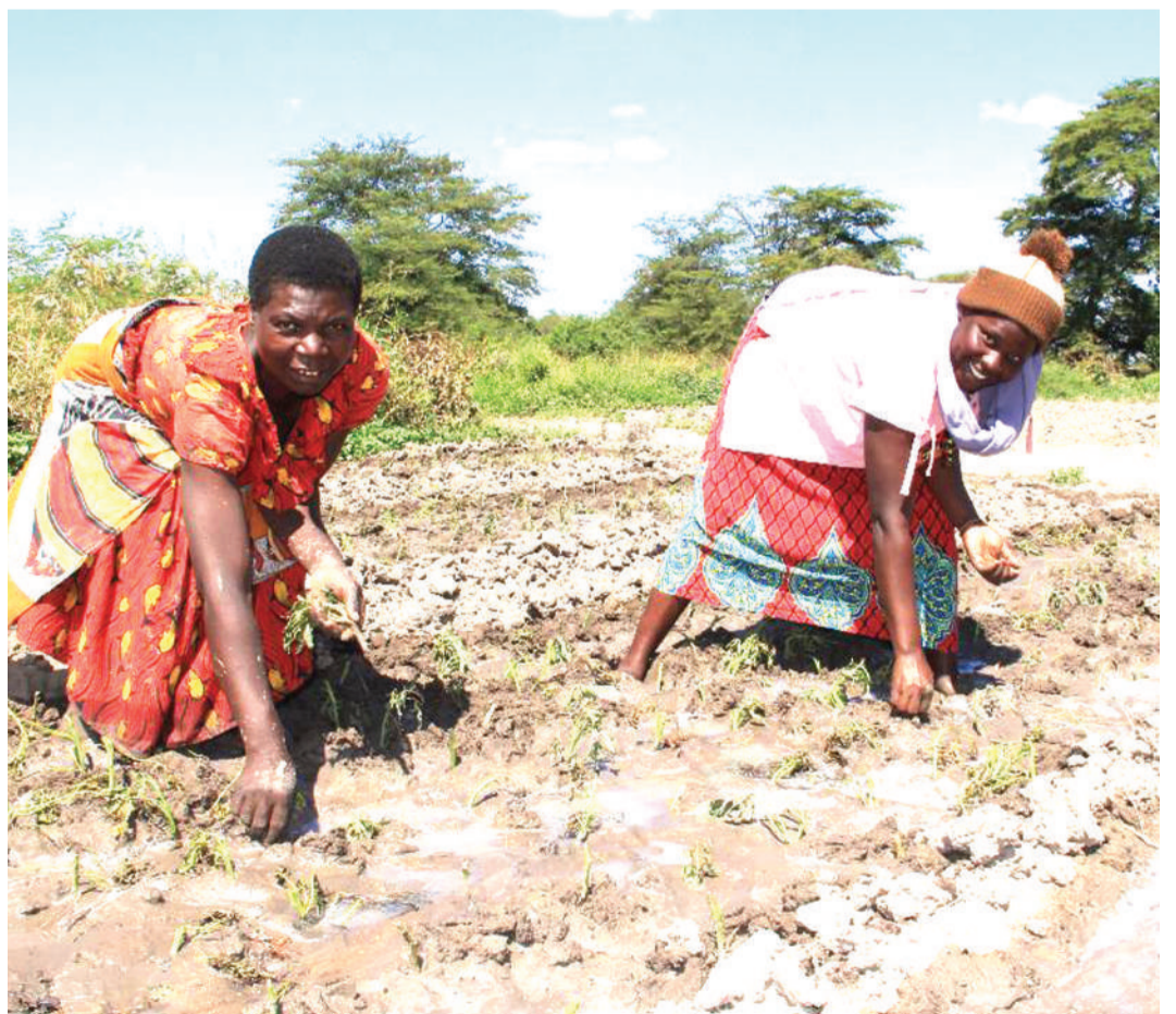
Wanawake wakiwa katika shamba la viazi vitamu, katika kijiji cha Iglansoni Singida.