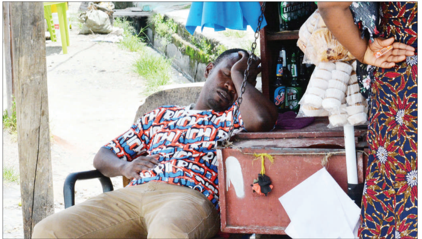
Mkazi wa Jiji la Dar es Salaam, akiwa 'ameuchapa' usingizi katika eneo lake la biashara, Tandale, jijini Dar es Salaam hivi karibuni.

Hata hivyo, jana Zitto alinukuliwa na Nipashe akidai lengo lake siyo kuzuia mkopo huo bali kukomesha alichokita ubaguzi dhidi ya wanafunzi wanaopata ujauzito shuleni.