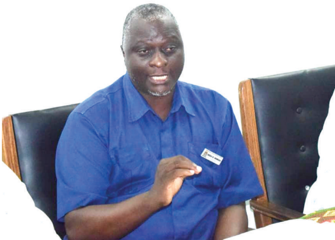
Kaimu Mganga Mkuu wa Mwananyamala, Dk. Mussa Wambura, akizungumza na waandishi wa habari.