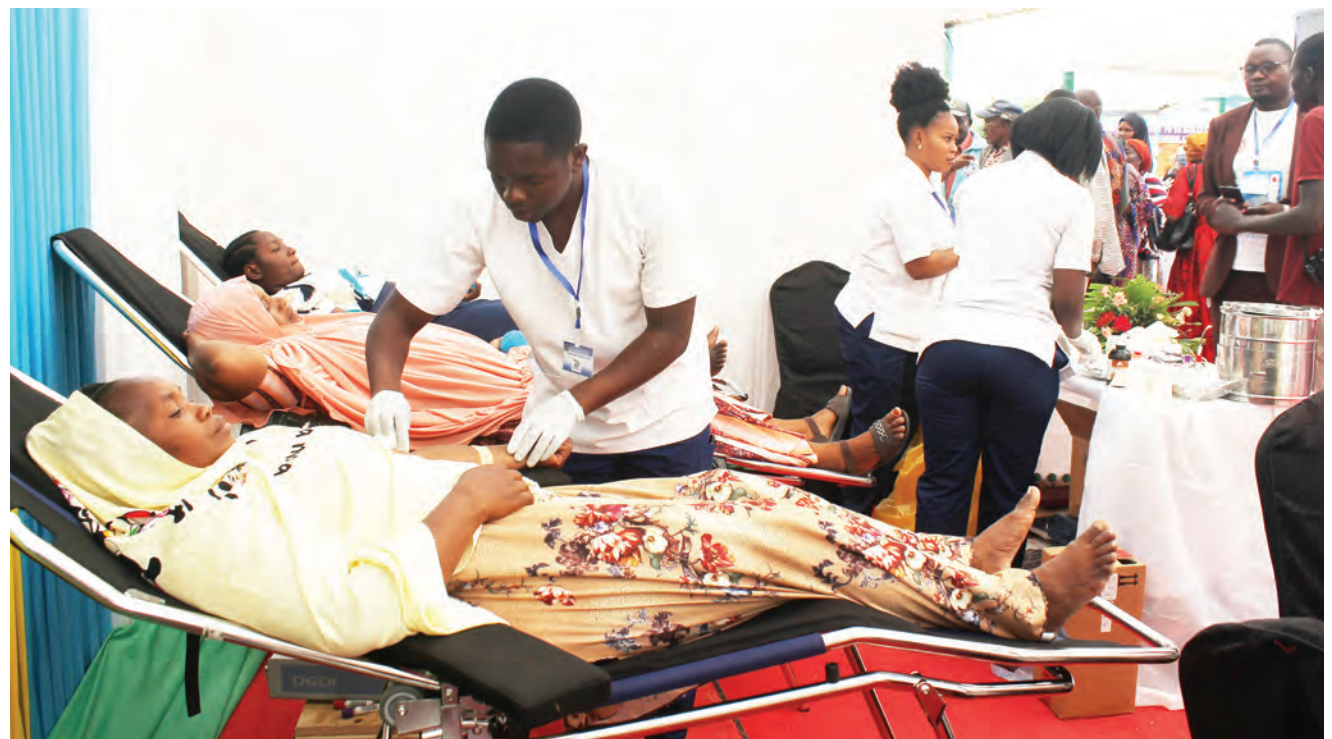
Wahudumu wa afya wa Hospitali ya Rufani ya Mkoa wa Dodoma, kitengo cha damu salama, wakiwahudumia watu walioamua kujitolea damu kwa ajili ya kuwasaidia wagonjwa, wakati wa maadhimisho ya miaka 70 ya Baraza la Uguzi na Ukunga Tanzania, jijini Dodoma jana.

Pamoja na kuhamasisha watu kutembelea hifadhi za taifa, alisema kuna haja ya Watanzania kujenga tabia ya kutembelea maeneo ya kihistoria ikiwamo michoro ya Kondo Irangi, Kongwa maeneo ya wapigania uhuru.