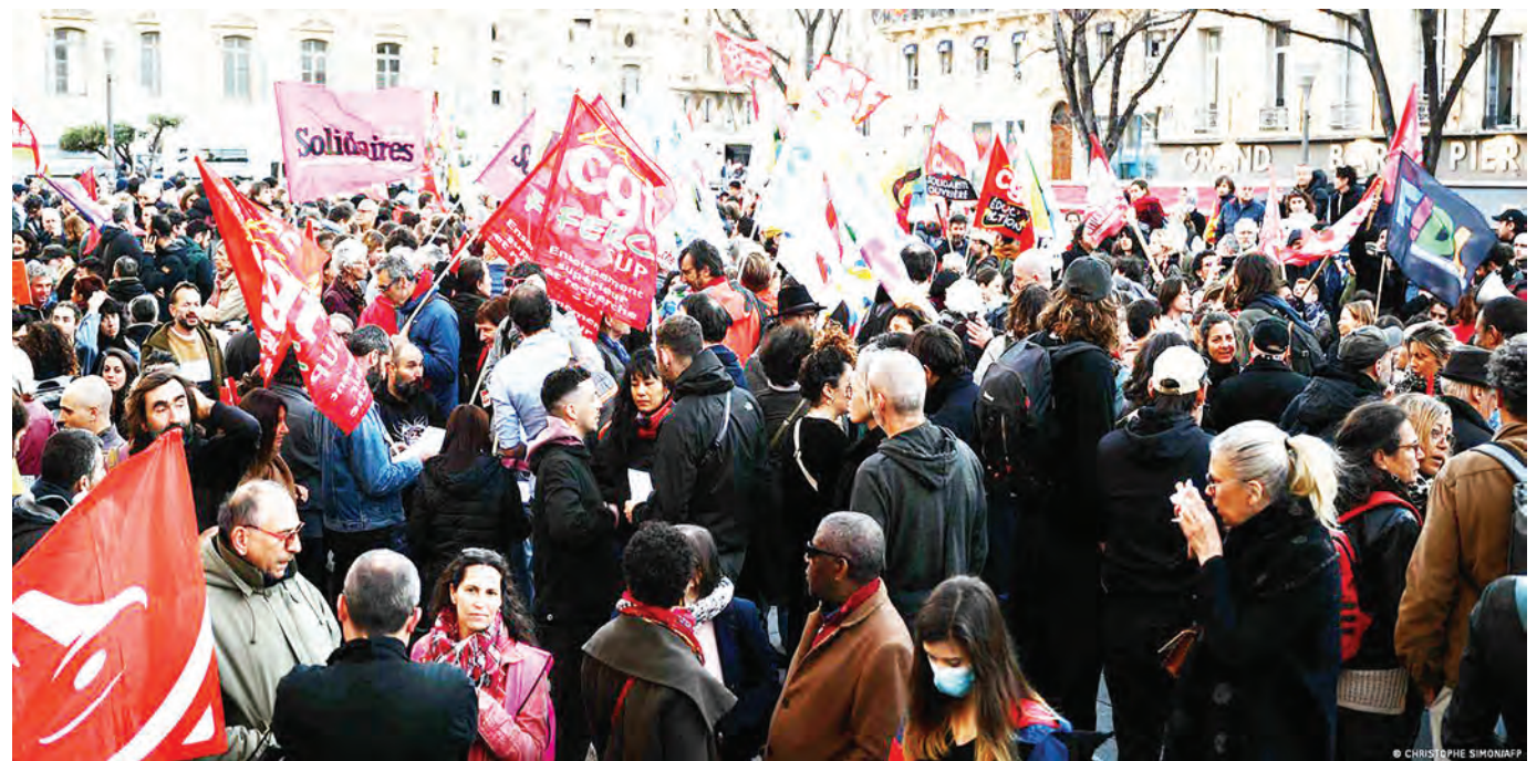
Raia wakiandamana katika mitaa ya jiji la Paris kupinga sheria ya kuongeza umri wa kustaafu nchini Ufaransa jana.