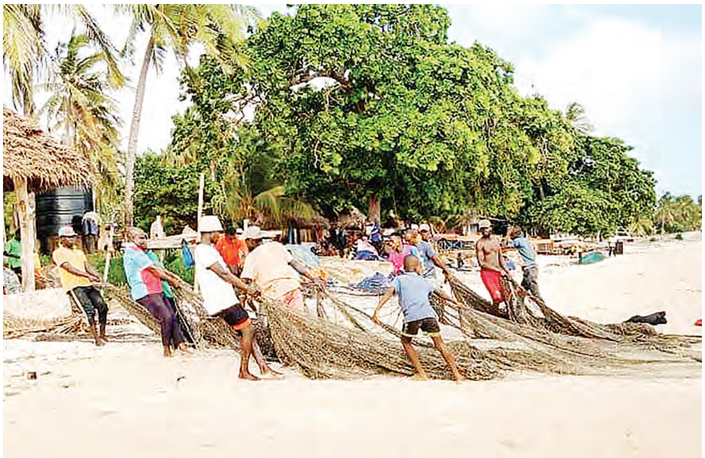
Wavuvi wa kijiji cha Kizimkazi, Mkoa wa Kusini Unguja, wakikokota nyavu katika ufukwe wa bahari ya Hindi, kijijini hapo baada ya kurudi katika shughuli zao za uvuvi jana.

Alisema wananchi hao wamewafikia kwa kufanya mikutano katika shehia zao pamoja na kuwapatia mafunzo viongozi na vyama vya kisiasa ili kuwaunga mkono wanawake katika uongozi.