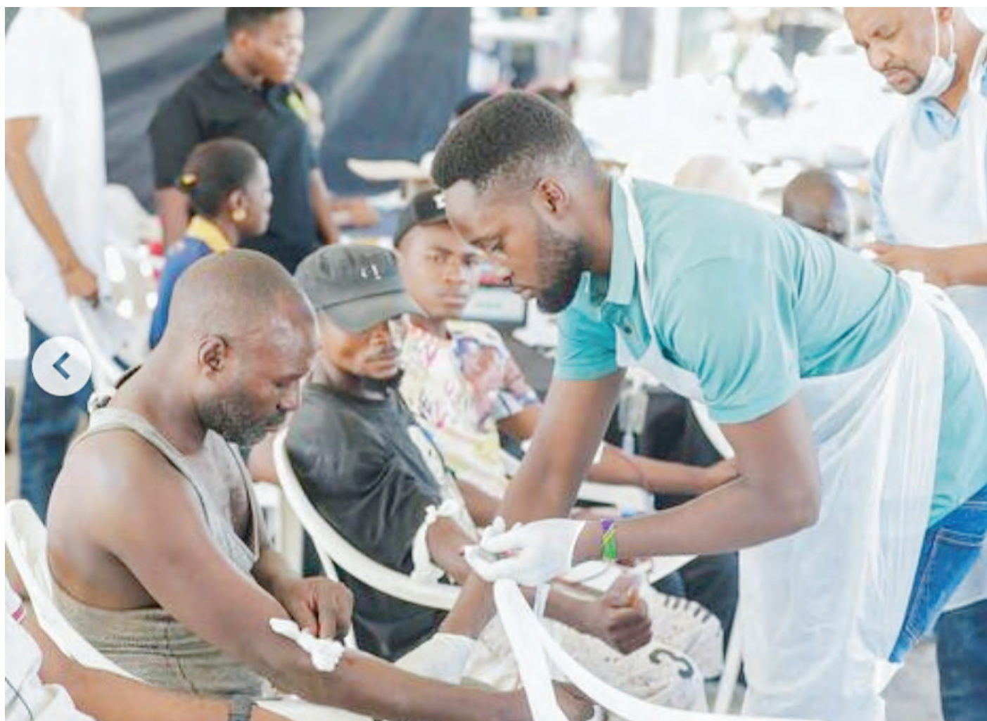
Mashabiki wa Yanga wakishiriki zoezi la kuchangia damu katika Hospitali ya Mloganzila kwa ajili ya kupata tiketi za bure ili kushuhudia mechi ya Kimataifa ya Kombe la Shirikisho Afrika dhidi ya US Monastir kutoka Tunisia itakayochezwa kesho kwenye Uwanja wa Benjamin Mkapa, Dar es Salaam.

"Tunashauri wazazi walete watoto wao hapa ili wafundishwe jinsi ya kucheza mchezo huu, tangu tumeanza kufundisha watoto wadogo tumepata idadi kubwa ya vijana ambao miaka ijayo wataunda Timu ya Taifa," Masai aliongeza.