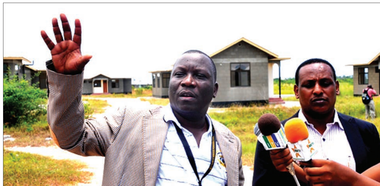
Mradi wa majengo ya kiserikali yanayouzwa eneo la Buyuni jirani na mji wa Chanika, Dar es Salaam.

"Chanika sasa ina hadhi kabisa ya kuwa wilaya. Tunaomba serikali ifikirie ombi letu hilo ambalo tayari viongozi wetu wameshalifikisha sehemu husika. Kutoka huku hadi kwenye ofisi za wilaya ni mbali sana, wananchi wanatumia zaidi ya saa mbili kwenye gari kufuata huduma wilayani," anatajka.