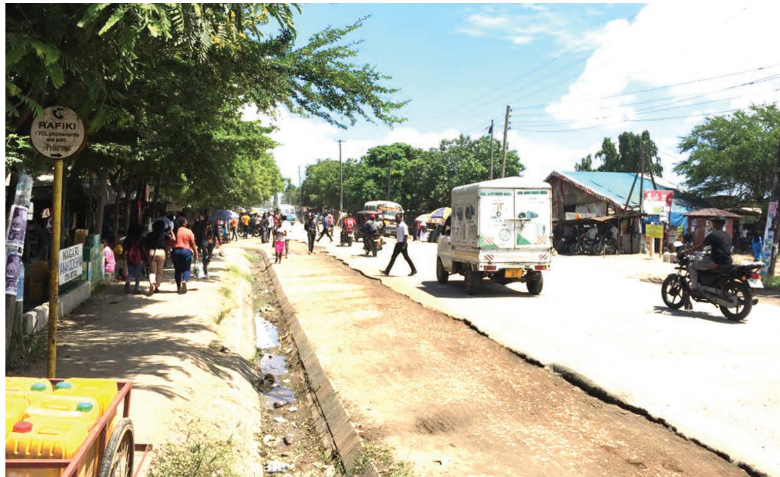
Sehemu ya barabara kuu inayopatikana Chanika, jijini Dar es Salaam.