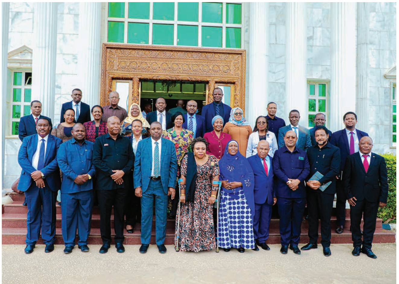
Makamu wa Pili wa Rais wa Zanzibar, Hemed Suleiman Abdullah (wanne kushoto mstari wa mbele), akiwa pamoja wajumbe wa Kamati ya Maadili na Kinga ya Baraza la Wawakilishi na wajumbe wa Kamati ya Haki, Maadili na Madaraka ya Bunge la Jamuhuri ya Muungano wa Tanzania, baada ya kufika katika ofisi za baraza hilo, mjini Zanzibar jana, kwa ajili ya kujifunza.

Waziri huyo alisema mauzo ya karafuu yaliyofanywa ni tani 7,996.61 kwa thamani ya dola za Kimarekani 57,004,854.87 sawa na Sh. bilioni 131.11.