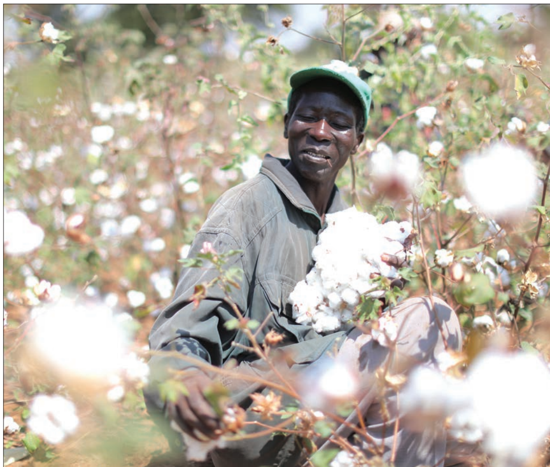
Mkulima wa pamba akiwajibika.

Wapo waliokata tamaa kuendelea na kilimo hicho, wakidai hakina tija, badala ya kukua uchumi wao bali unadidimia, ambao wameamua kuacha kulima pamba na kuhamia