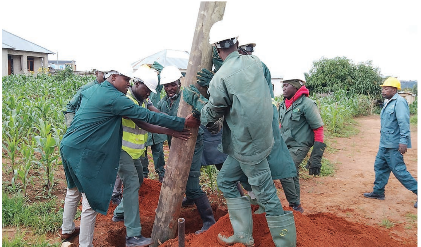
Ma fundi wa Shirika la Ugavi la Umeme Tanzania (TANESCO), mkoa wa Iringa, wakiwa katika operesheni ya kuwaingizia umeme wateja wapya zaidi ya 2,170 ambao walilipa 27,000/- katika eneo la Kitwiro, Iringa mjini jana.

Alisema mtaa wake una maeneo ya pembezoni ambayo wananchi bado hawajafikiwa na nguzo za umeme, hivyo TANESCO waangalie uwezekano wa kupeleka huduma kwa wananchi hao.