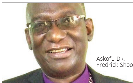
Askofu Dk. Fredrick Shoo