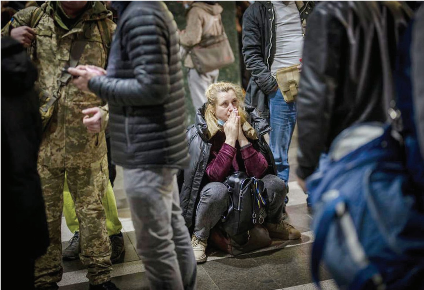
Mwanamama akisubiri usafiri wa treni kuondoka mjini Kyiv, nchini Ukraine, jana. Majeshi ya Russia yanadaiwa kuivamia Ukraine huku milio ya milipuko ikisikika miji ya Kyiv, Kharkiv na Odesa.