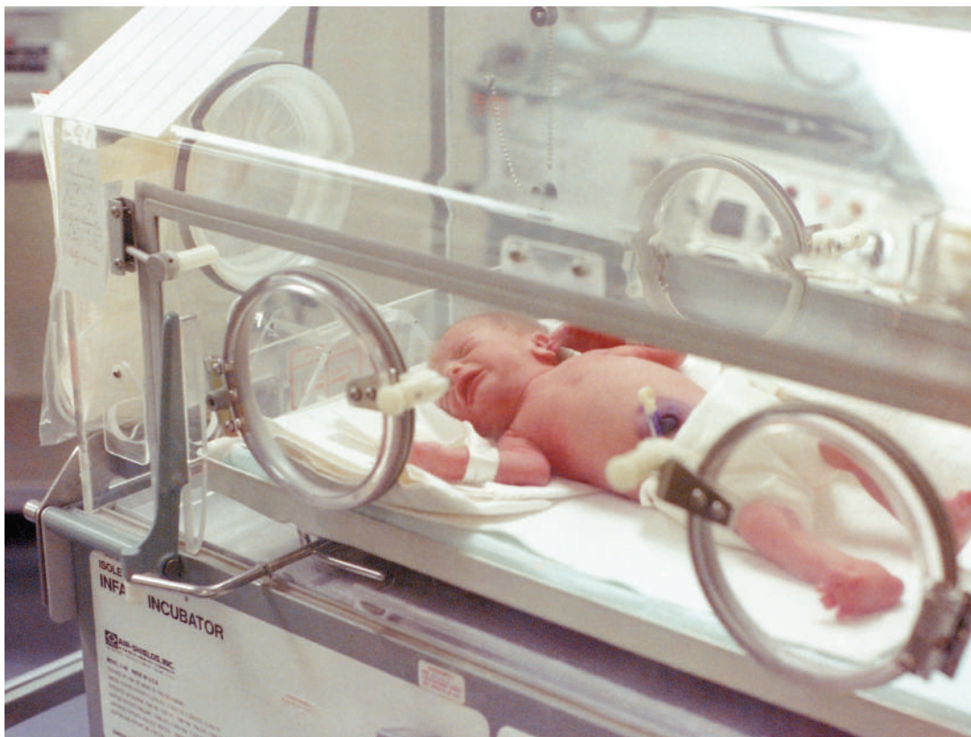
Mtoto njiti akitunzwa ndani ya mashine ya kitabibu ya 'incubator'.

Anasema taasisi hiyo ilianzishwa miaka 15 iliyopita, imekuwa ikifanya shughuli zake katika maeneo tofauti hapa nchini katika nyanja za elimu, mazingira, afya na kilimo ambapo kwa sasa