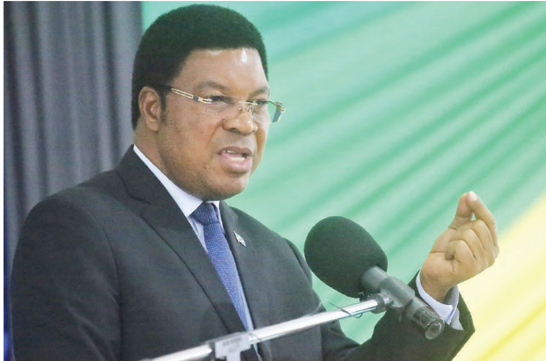
Waziri Mkuu, Kassim Majaliwa, ofisi yake inaratibu ustawi na maendeleo ya vijana.

SWALI: Elimu ya afya ya uzazi salama ndiyo yenye 'nondo' za kukabiliana na maambukizi ya VVU, kuna miongozo yoyote iliyoandaliwa ili kufanikisha ufundishaji wake?