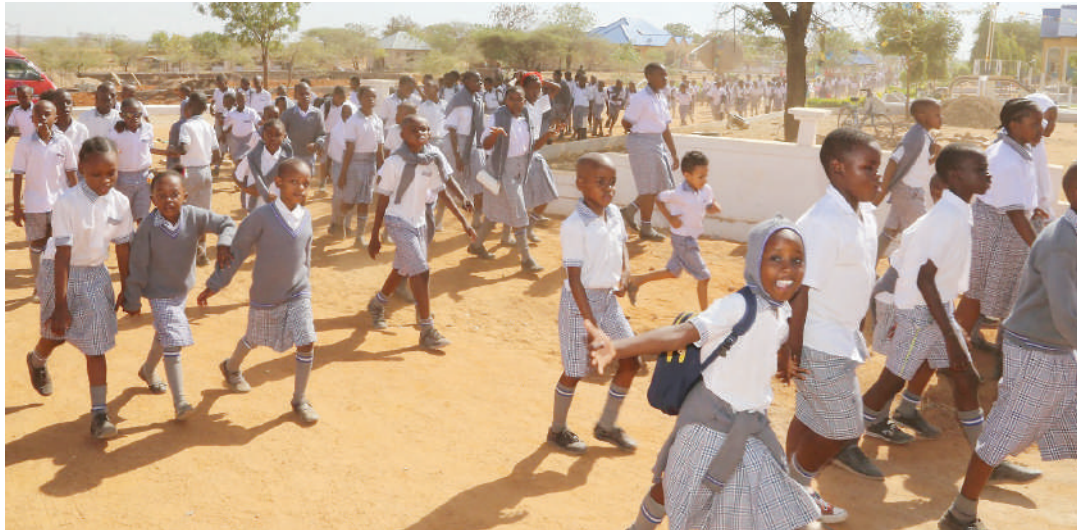
Kuhudhuria masomo, kucheza bila hofu wakati wa hedhi ni haki ya wanafunzi wasichana.