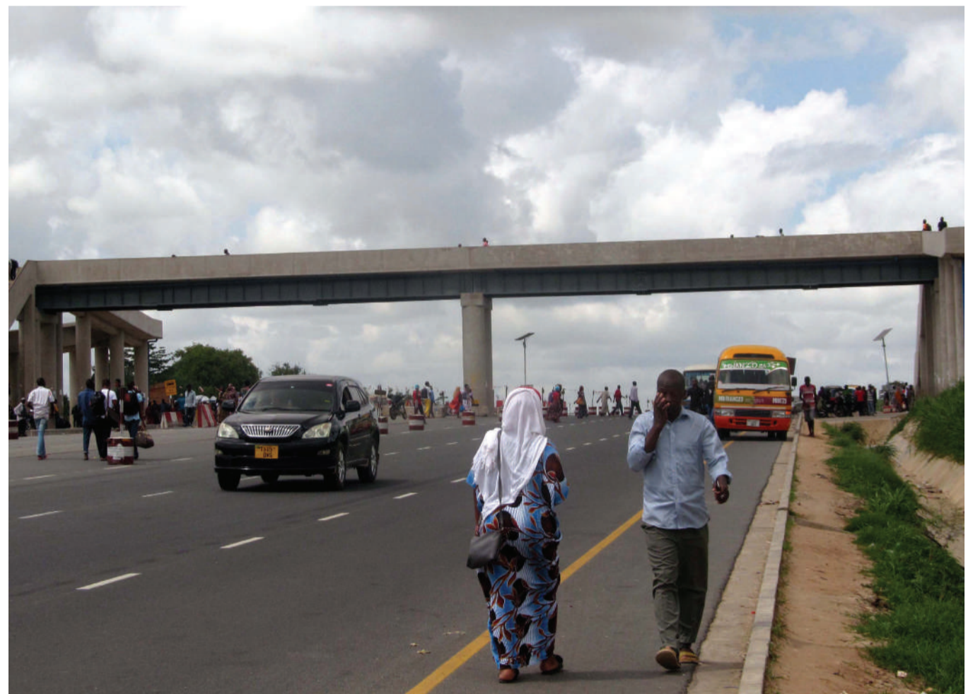
Watu wakipata chini ya daraja la waenda kwa miguu jana, badala ya kutumia daraja ambalo limejengwa ili kuwarahisishia uvukaji wa Barabara ya Morogoro kwenda na kutoka Stendi ya Magufuli iliyoko Mbezi Luis Dar es Salaam.

“Kwa hivyo eleweni viongozi wa mahakama wameamua hawataki kuheshimu uamuzi wa mahakama, hawataki kunirejeshea uwakili, uamuzi wa serikali wa kukata rufani, haubatilishi hukumu ya majaji watatu, lakini msajili kaamua yeye anaweza kudharau hukumu kwa sababu serikali imekata rufani.