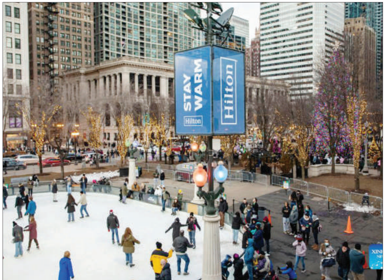
Wakazi wa Jiji la Chicago nchini Marekani wakiwa eneo la Millennium Park, kufurahia sikukuu za mwisho wa mwaka, Krismasi na Mwaka Mpya.