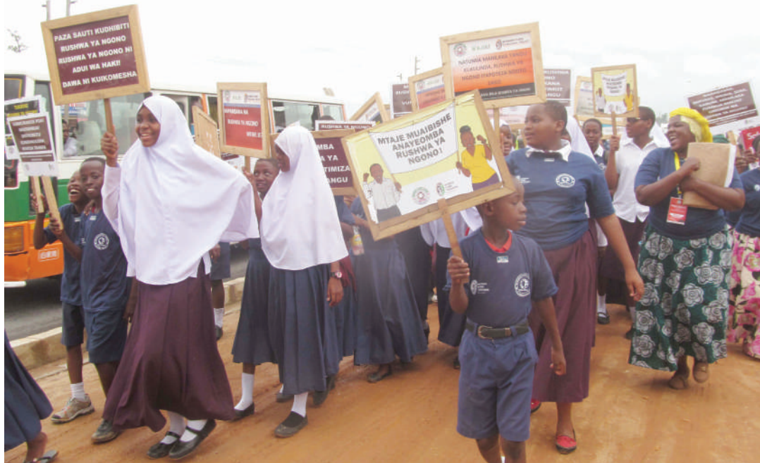
Wanafunzi wa shule za msingi na sekondari za wilaya ya Temeke na wadau wengine wakiwa katika maandamano ya uzinduzi wa kampeni hiyo wilayani humo.

ndilo linalofanikisha kampeni hiyo kwa kushirikiana na kamati zilizooundwa na madereva hao, wanachama wa shirika hilo.