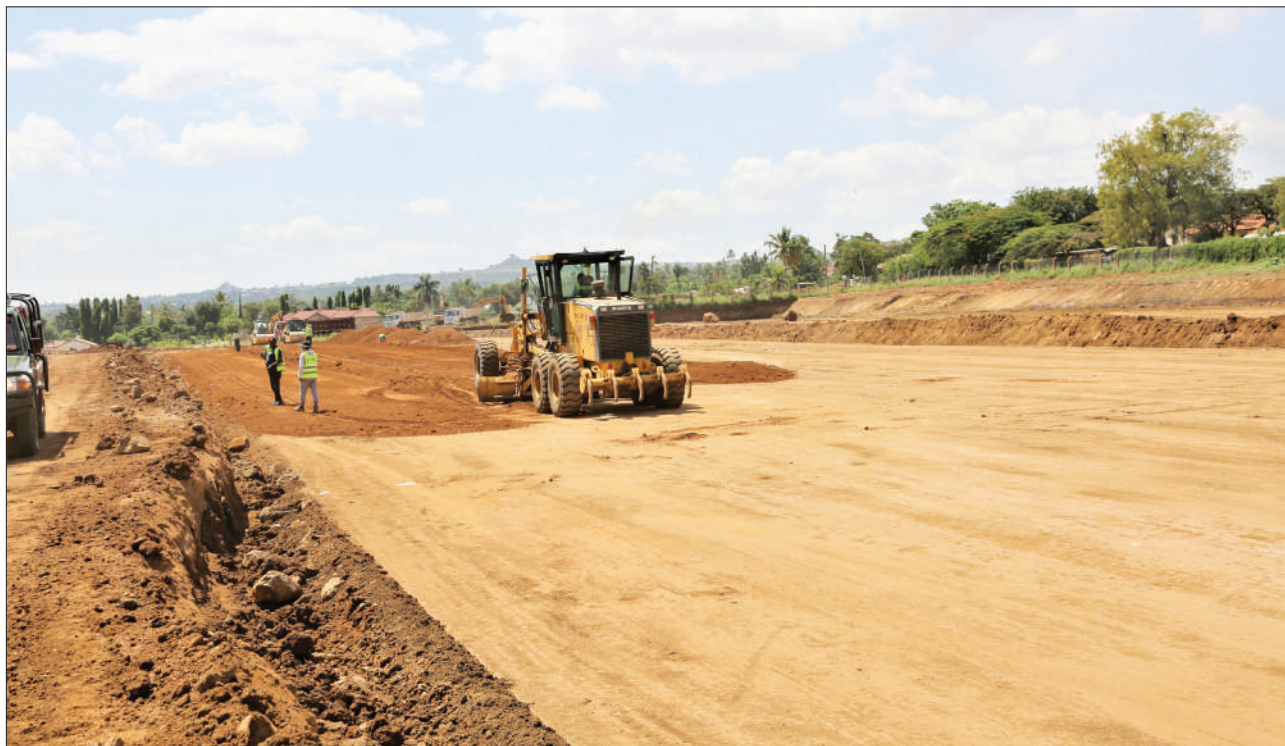
Kazi za ujenzi wa barabara ya kuruka na kutua ndege kwa kiwango cha lami katika Kiwanja cha Ndege cha Musoma zikiendelea, mkoani Mara.