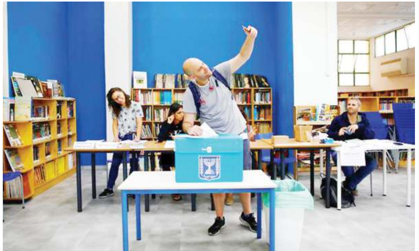
Raia wa Israel akipiga kura huku 'aki-self' kwenye uchaguzi wa kumtafuta Waziri Mkuu na wabunge.

Katika uchaguzi huo mfunamano wa vyama vinavyowawakilisha waarabu wa Israel pia vinatarajiwa kuwa muhimu kama iliyvokuwa katika uchaguzi wa mwaka wa 2015 ambapo vilishika nafasi ya tatu kwa idadi ya viti bungeni. DW