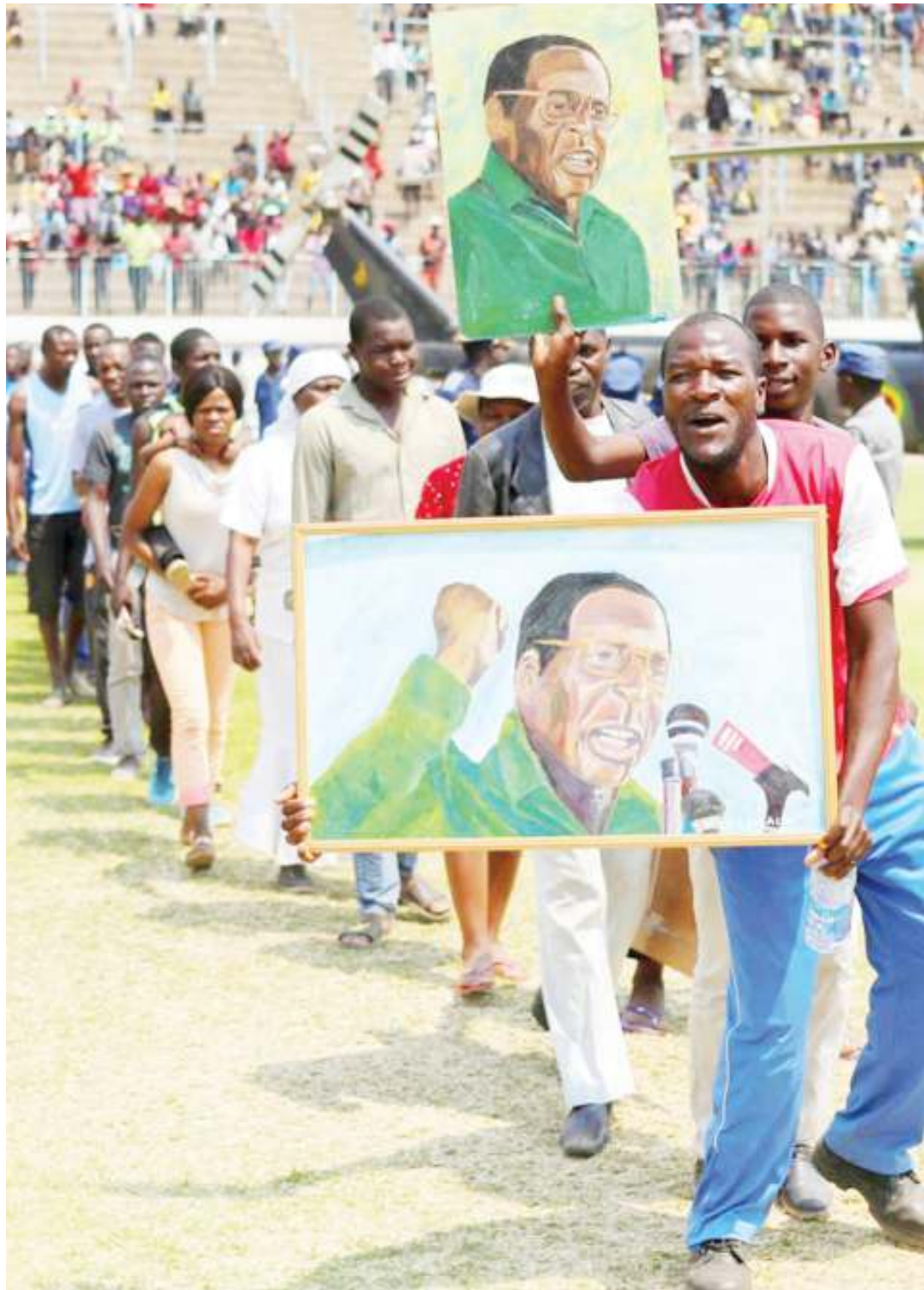
Waombolezaji wakiwa na bango lenye picha ya Robert Mugabe siku ya kuaga mwili wake jijini Harare nchini Zimbabwe.

Historia inamuangazia Mugabe hasa yanapotajwa masuala ya ardhi yaliyosababisha kuporomoka kwa uhusiano kati yake na wakuli-