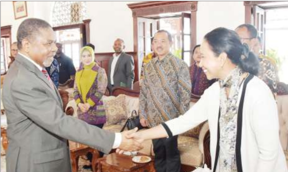
Rais wa Zanzibar na Mwenyekiti wa Baraza la Mapinduzi, Dk. Ali Mohamed Shein, akisalimiana na Waziri anayeshuhulikia mashirika yanayomilikiwa na Serikali ya Indonesia, Rini M. Soemarno, wakati alipofika Ikulu Mjini Zanzibar jana, akiwa na ujumbe wake.