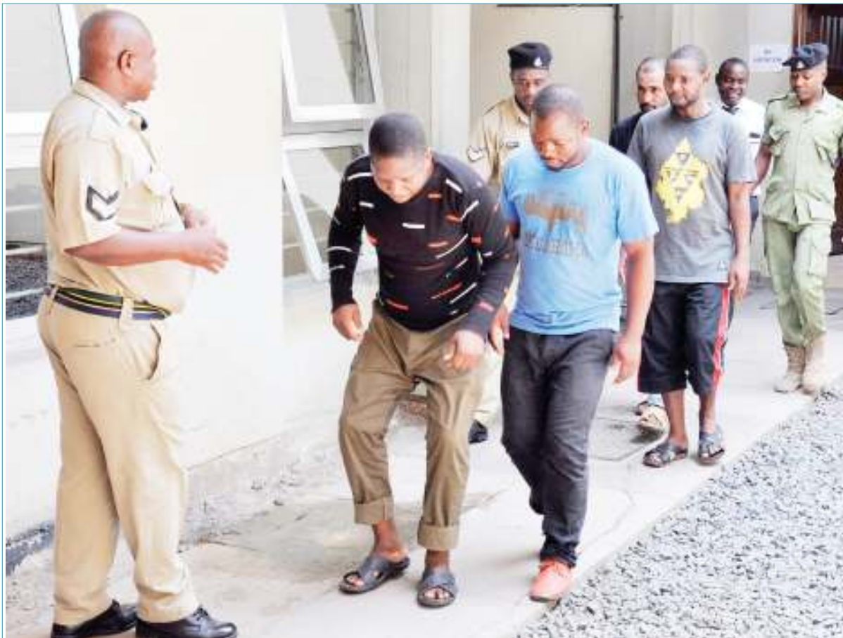
Watuhumiwa wanaokabiliwa na kesi ya uhujumu uchumi ikiwamo, kuratibu genge la ujangili, kukutwa na nyara za serikali na kutakatisha zaidi ya Sh. Bilioni 4 wakiwa chini ya ulinzi wa Askari Polisi katika Mahakama ya Hakimu Mkazi Kisutu, jijini Dar es Salaam jana, baada ya kusomewa mashtaka yao.

Mwanri alisema watatemebea nyumba za wageni na kuangalia majina yaliyoandikwa kwenye madaftari ya wageni kama yanaoana na majina ya vitambulisho vyao na maeneo wanayotoka.