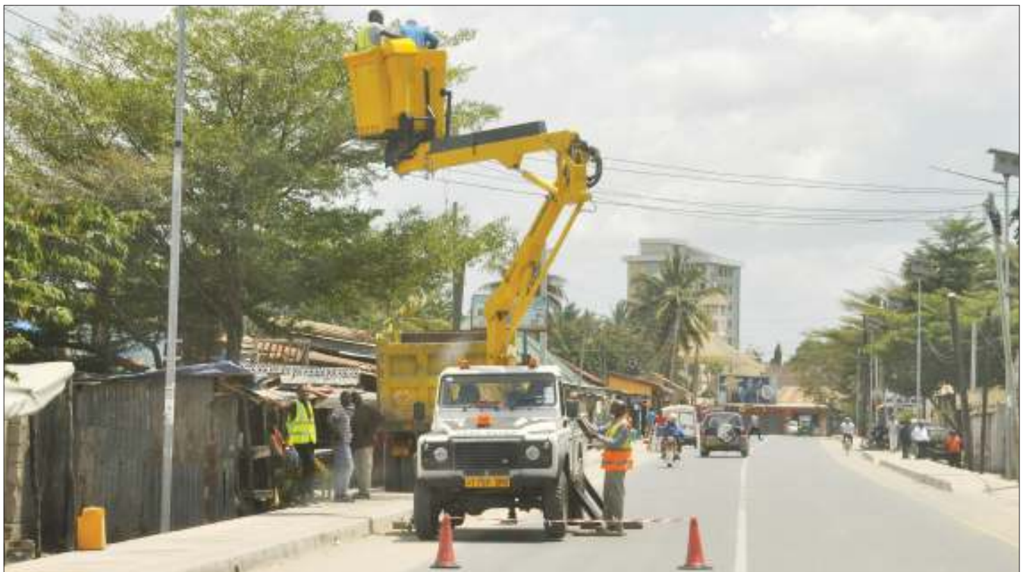
Mafundi wakijiandaa kwaajili ya kukarabati taa za barabarani zinazotumia nishati ya jua, katika Barabara ya Cameroon, eneo la Makumbusho, Kata ya Kijitonyama, jijini Dar es Salaam jana.

na kufanikiwa kumkamata,” alisema Mussa. “Baada ya kesi kuendelea kusikilizwa ndipo Mahakama ikamkuta ana hatia ya kosa la kuomba na kupokea Rushwa Sh. 50,000 kinyume na kifungu cha 15 (1)(a) na (2) cha Sheria ya Kuzuia na Kupambana na Rushwa Na 11/2007 katika kesi ya jinai namba 186 ya mwaka 2019, na kuhukumumu kufungwa jela mwaka mmoja au kutoa faini ya Sh.500,000,” aliongeza.