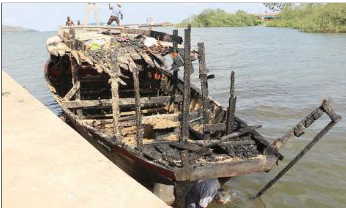
Mabaki ya boti inayojulikana kwa jina Lulimbe, ikiwa imetia nanga baada ya kupata ajali ya moto juzi, wakati ikiwa safarini kutoka Kemondo wilayani Bukoba kuelekea Rushonga Bumbire wilayani Muleba Mkoa wa Kagera juzi, ambapo abiria 56 walinusurika kifo.

“Sasa nawaambia siku zao zinahesabika, watapigwa na kupewa ulemavu kwa kuvunjwa miguu,” alisema.