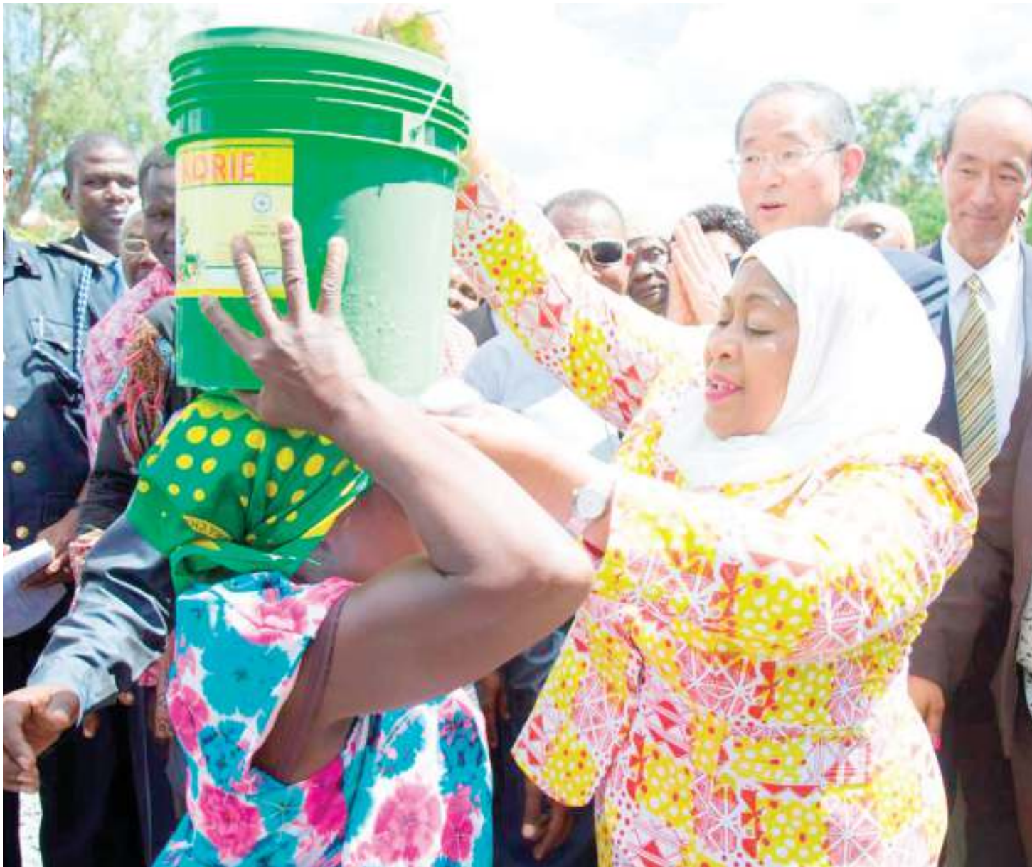
Makamu wa Rais Samia Suluhu Hassan (kulia), akizindua mradi mkubwa wa maji vijijini uliogharimu zaidi ya Sh. bilioni 28 katika wilaya saba za Mkoa wa Tabora.