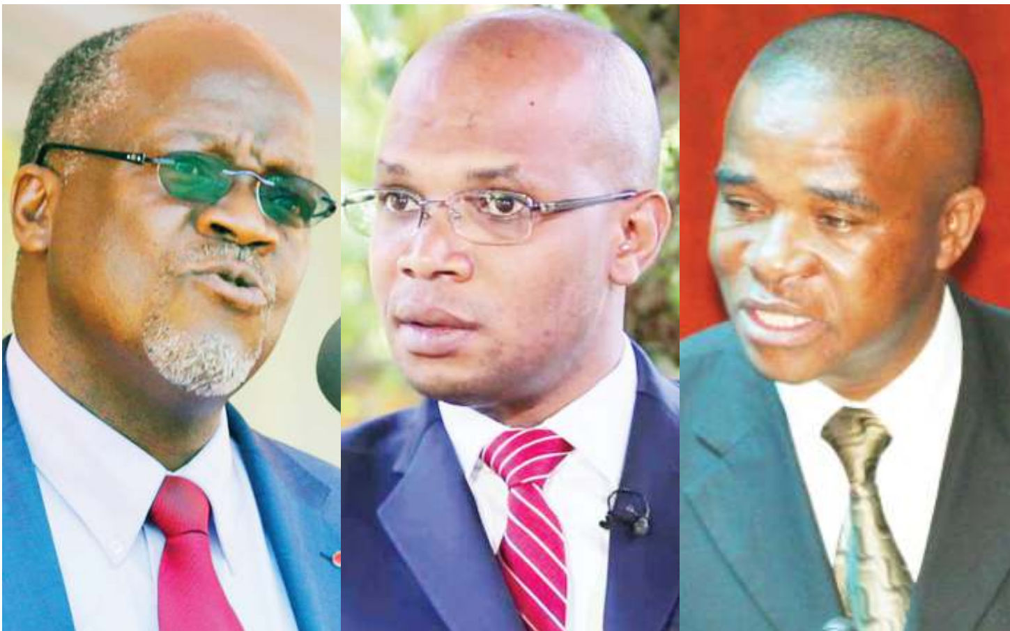
Rais John Magufuli (kushoto), January Makamba (katikati) na William Ngeleja.