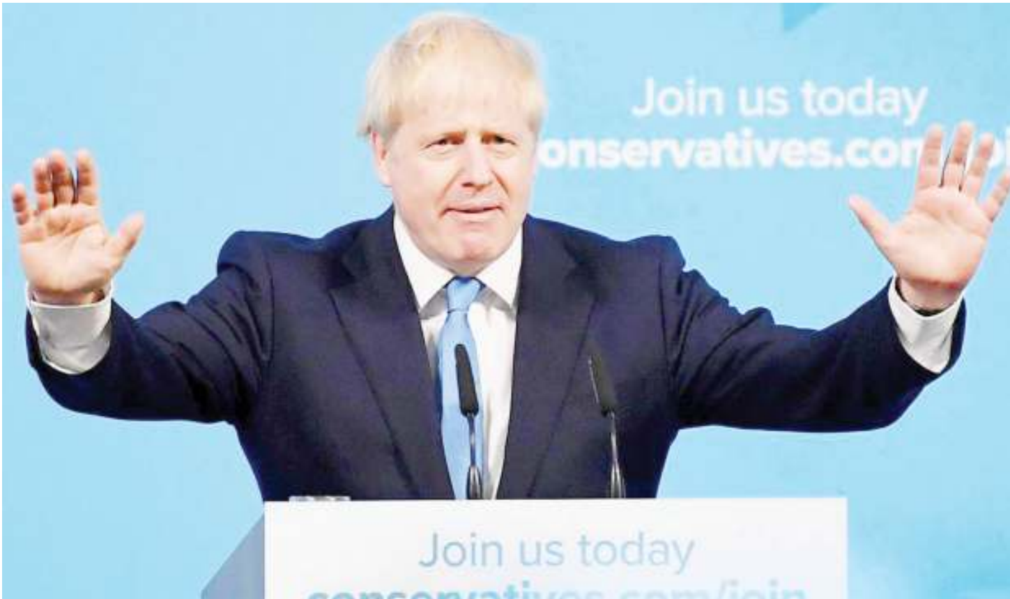
Waziri Mkuu wa Uingereza, Boris Johnson.