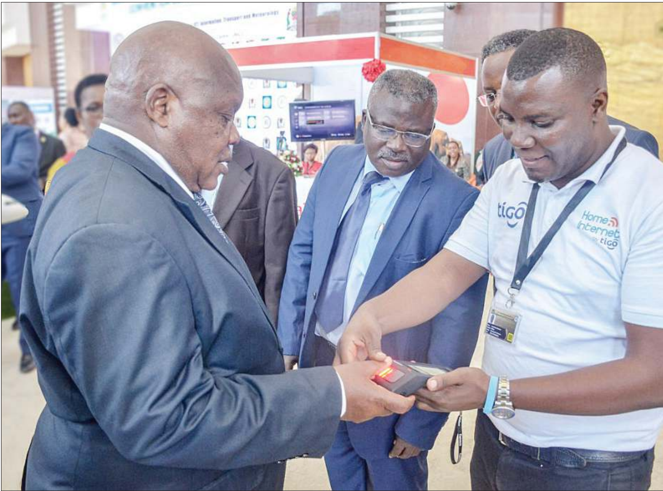
Waziri wa Ujenzi, Uchukuzi na Mawasiliano, Mhandisi Isack Kamwelwe (kushoto), akifanya usajili upya wa laini ya simu kwa mfumo wa alama za vidole wakati alipotembelea banda la Tigo, wakati wa mkutano wa mawaziri (Tehama) wa nchi wanachama wa SADC, unaoendelea jijini Dar es Salaam juzi. Kampuni ya simu ya Tigo ni mtoa huduma ya WI-FI ya Bure katika wa mkutano huo.