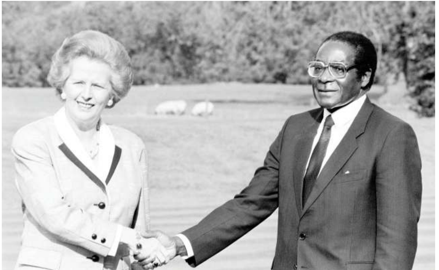
Mzee Robert Mugabe akiwa na aliyekuwa Waziri Mkuu wa Uingereza, Margaret Thatcher.

Mmoja ni Teodoro Obiang Nguema Mbasago, dikteta wa Equatorial Guinea anayeendesha utawala wa mafisadi tangu 1979, alikuwa wa kwanza kutoa heshima kwa