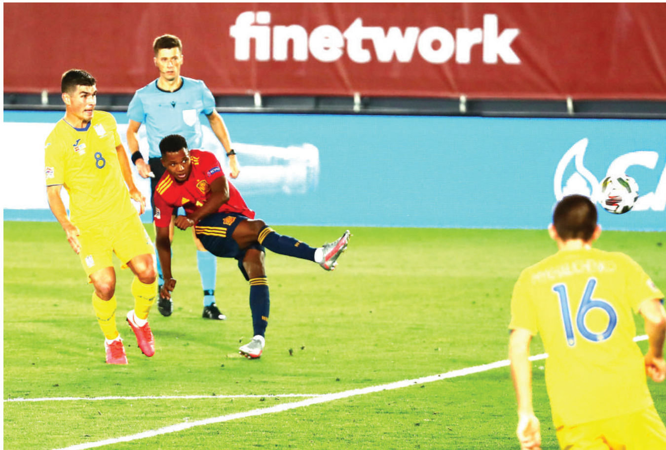
Ansu Fati akiifungua bao Hispania kwenye mchezo wa Ligi ya Mataifa ya UEFA dhidi ya Ukraine mjini Madrid. Hispania ilishinda mabao 4-0.