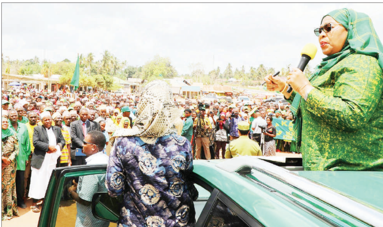
Mgombea mwenza wa urais wa Jamhuri ya Muungano wa Tanzania kwa tiketi ya CCM, Samia Suluhu Hassan, akizungumza na wananchi katika mkutano wa kampeni Kijiji cha Kibiti, mkoani Pwani jana.

Alisema Dola milioni sita katika kila mwaka kwenye kila kilo moja ya dhahabu itakayouzwa kupitia makinikia zitawekwa katika mfuko wa maendeleo kwa manufaa ya jamii zinazozunguka migodi.