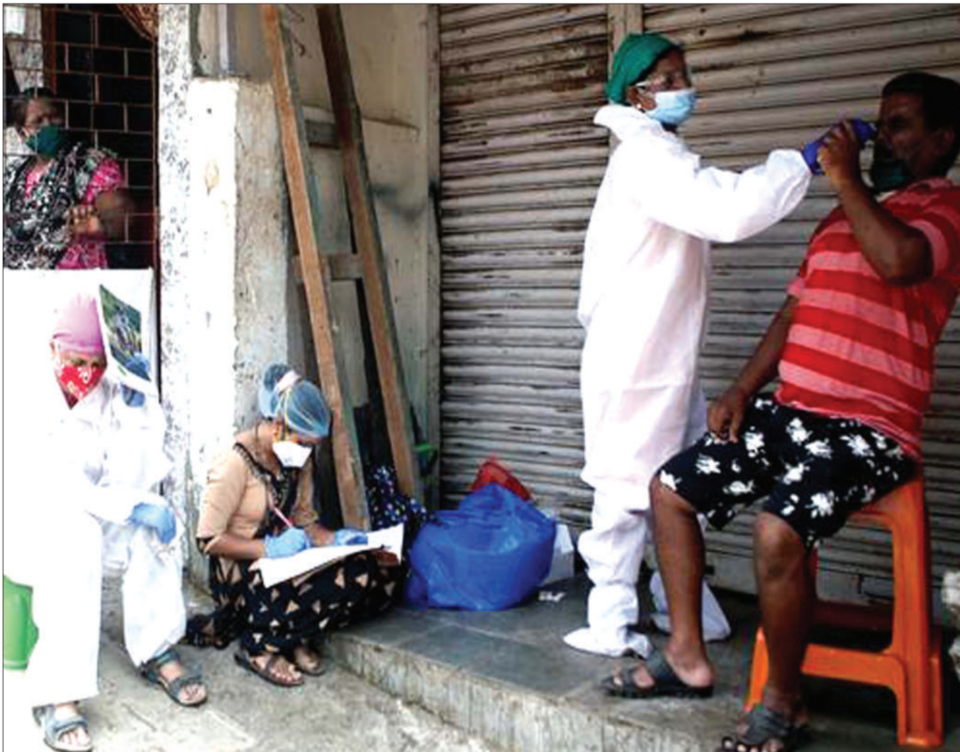
Maofisa wa afya wakiendelea kutoa huduma dhidi ya corona kwa wananchi nchini India.