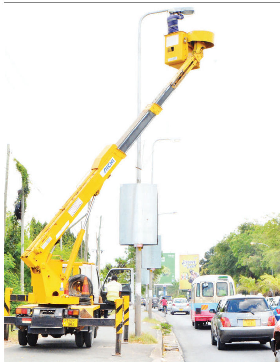
Mafundi wakikarabati taa za barabarani katika eneo la daraja la Selander, jijini Dar es Salaam mwishoni mwa wiki.

"Kuna kijana ametengeneza kifaa ambacho kinamwezesha mtumiaji wa jiko la gesi kujua kiwango cha ujazo uliopo na iki-karibia kuisha mfumo utampigia simu kumjulisha kiasi kilichobaki," alisema.