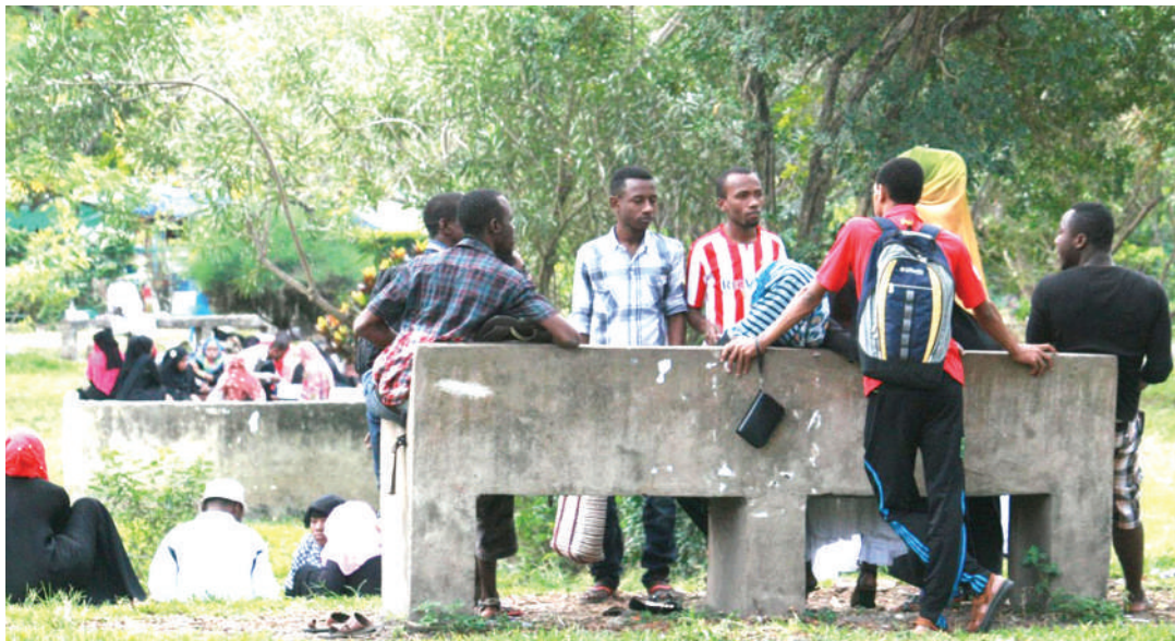
Wanafunzi wa Chuo Kikuu cha Dar es Salaam wakijisomea kwenye vimbweta au viti vya zege.

Ni muhimu kuwa elimu kwenye kampeni kwani ni eneo ambalo lilitutia wapiga kura mwaka 2015 na kufanyiwa kazi. Licha ya kuwa na umuhimu zaidi mfumo wa elimu ni ngazi ya elimu ya msingi, inaelekea kuwa kuanzia sekondari hadi vyaoni ndiyo sehemu inayoleta hamasa katika majadiliano, na ndiyo ilivyo