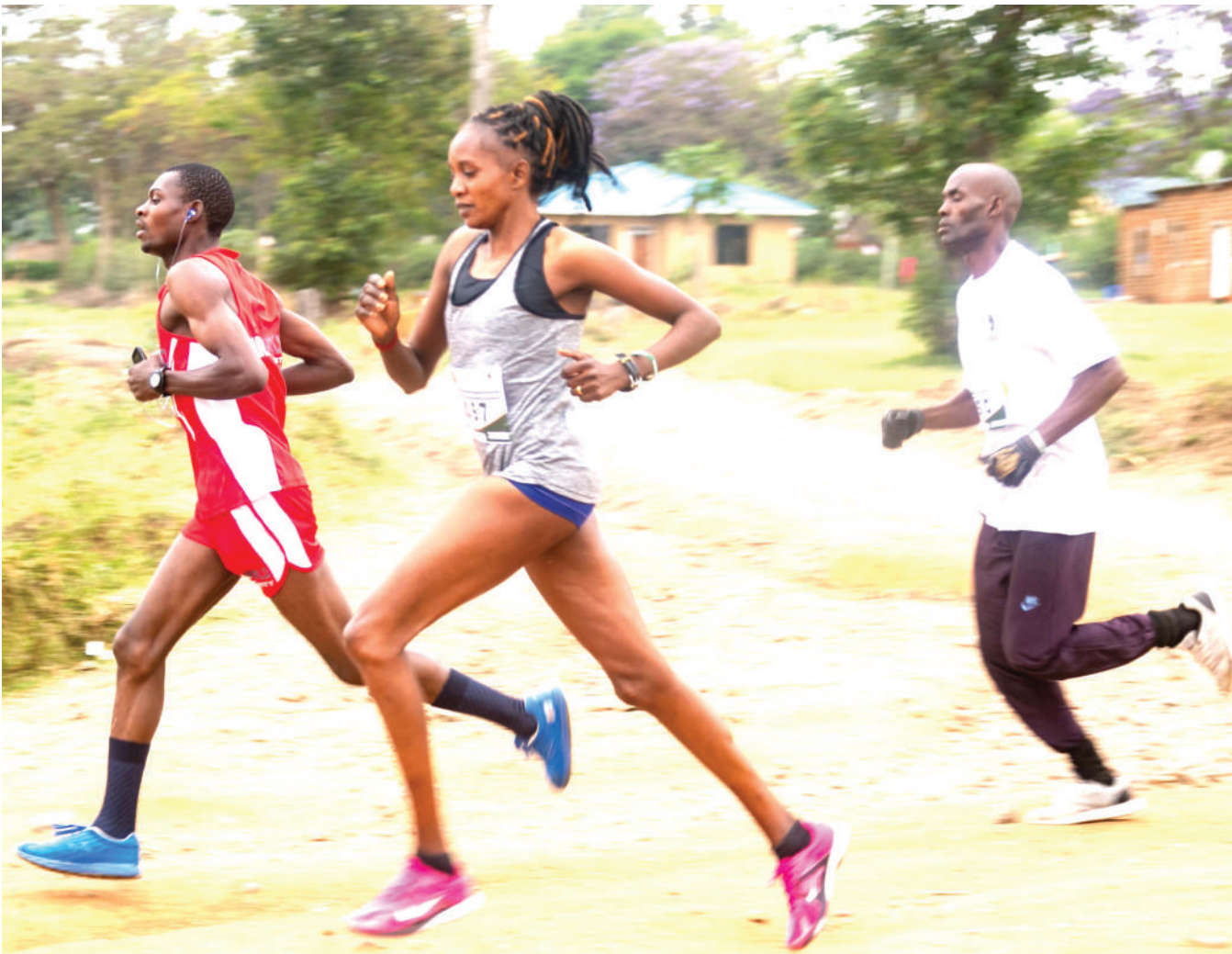
Baadhi ya wanariadha wa mbio za Serengeti Migration Marathon, wakishiriki mbio hizo, zilizodhaminiwa na kampuni ya Bia ya Serengeti (SBL), pamoja na kampuni nyingine kwa ajili ya uhamasishaji wa utunzaji wa mazingira, zilizofanyika wilayani Serengeti, mkoani Mara juji.

Iliipa kipigo cha mabao 7-0 Ruvu Shooting msimu wa 2017/18, ikaifunga Prisons bao 1-0 msimu wa 2018/19, ikaiaadhibu JKT Tanzania mabao 3-1, 2019/20, na Jumapili iliyopita msimu wa 2020/21 ilianza pia kwa ushindi wa mabao 2-1.