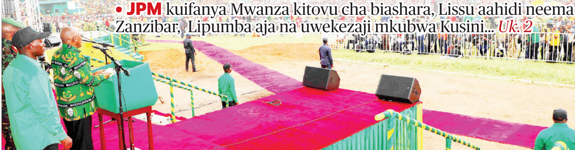
Mgombea urais wa Chama Cha Mapinduzi (CCM), Dk. John Magufuli, akihutubia maelfu ya wananchi katika mkutano wake wa hadhara wa kampeni za uchaguzi mkuu katika uwanja wa CCM Kirumba, jijini Mwanza jana.

• JPM kuifanya Mwanza kitovu cha biashara, Lissu ahadi neema Zanzibar, Lipumba aja na uwekezaji mkubwa Kusini... Uk. 2