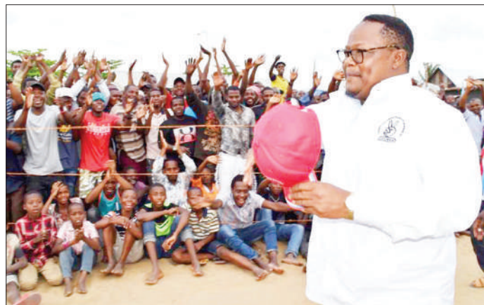
Mgombea urais kwa tiketi ya Chama cha Demokrasia na Maendeleo (CHADEMA), Tundu Lissu, akiwasili katika viwanja vya Kibandamaiti, Unguja jana, kwa ajili ya kuhutubia katika mkutano wa hadhara wa kampeni za uchaguzi mkuu.