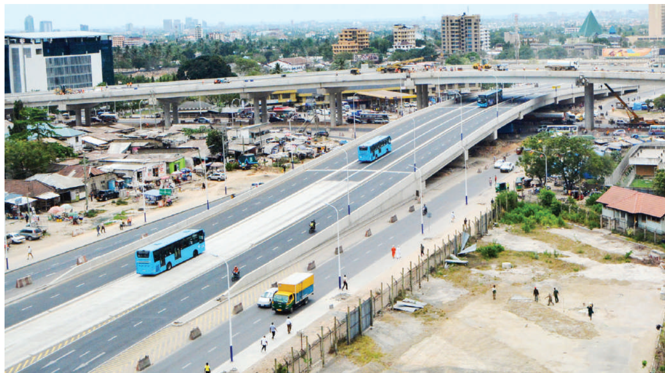
Ujenzi wa barabara za juu (Ubungo Interchange) katika makutano ya Barabara za Mandela, Morogoro na Sam Nujoma eneo la Ubungo, jijini Dar es Salaam, ukiendelea kwa kasi. Mradi huo, unatarajiwa kuondoa adha ya msongamano mkubwa wa magari katika makutano hayo, pindi utakapokamilika.

Alisema katika kuhakikisha huduma ya maji na salama inawafikia wakazi wote wa Wilaya ya Rombo kikamilifu, Julai mwaka huu serikali ilivunja Kampuni ya Maji ya Kill Water na kuanzisha Mamlaka ya Maji (ROWASA).