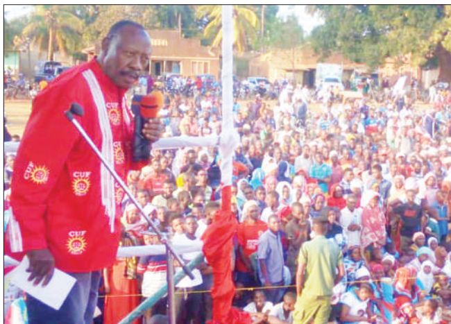
Mgombea urais kupitia Chama cha Wananchi (CUF), Prof. Ibrahim Lipumba, akihutubia wakati wa ufunguzi wa kampeni za urais kwa chama hicho, katika viwanja vya Sabasaba, mjini Mtwara jana.