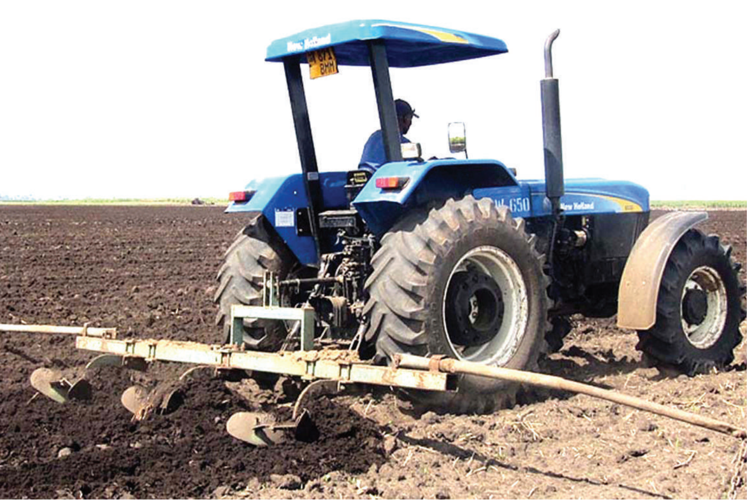
Wahitimu wa vyuo vya kilimo wanaweza kunufaika wakijikita vijijini na kujishughulisha na kilimo kama hiki.

Aidha, anasema, kuna mkakati wa taifa wa miaka mitano kwa vijana kushiriki katika sekta ya kilimo wa