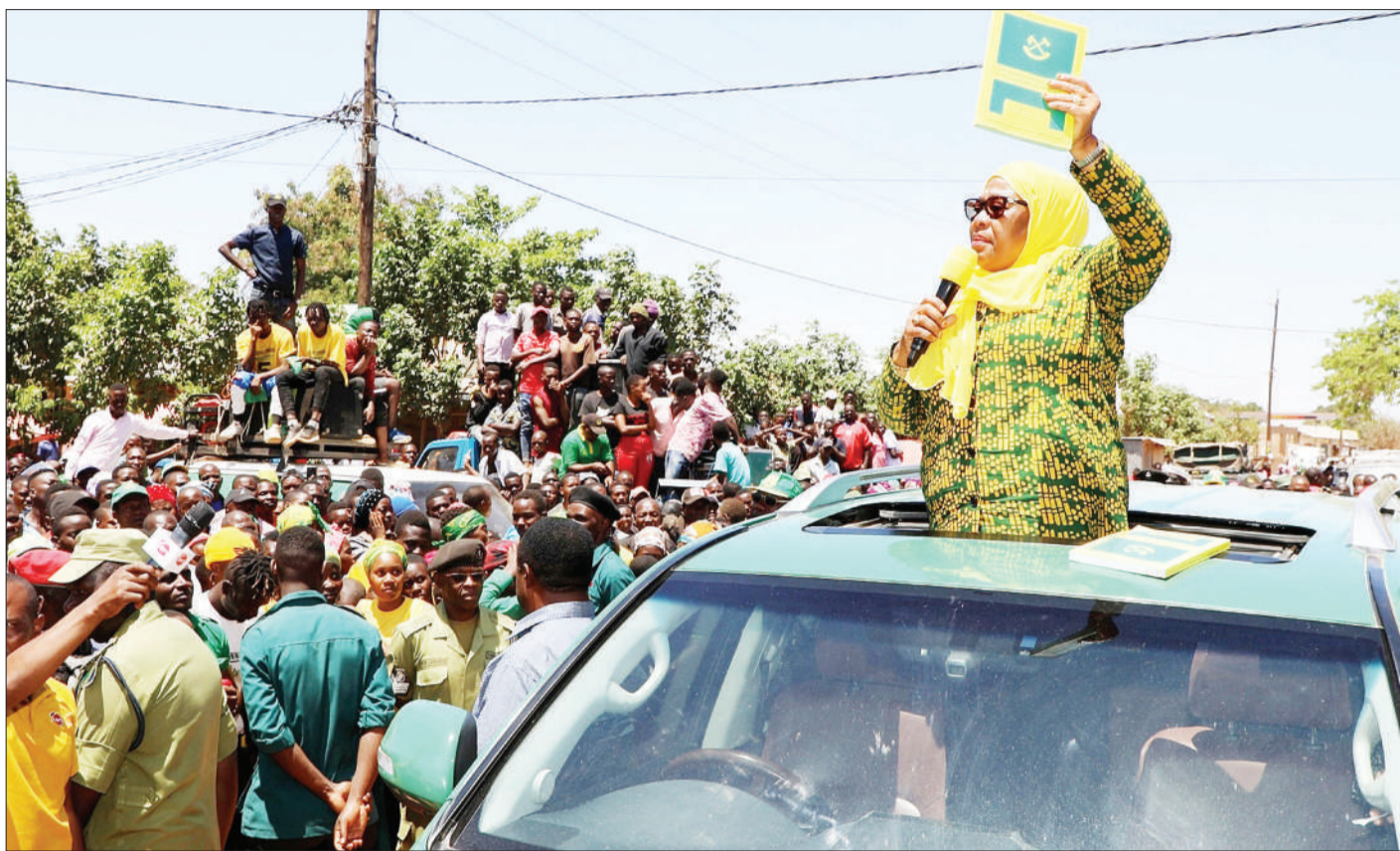
Mgombea mwenza wa kiti cha urais kwa tiketi ya CCM, Makamu wa Rais Samia Suluhu Hassan, akiinadi Ilani ya Uchaguzi ya chama ya 2020/25 kwa wanachama wa chama hicho na wananchi wa Nzega, mkoani Tabora jana.

Alisema kutokana na wanachama wengi kutaka kujitoa kuendelea na SACCOS walianza kuwarejeshea fedha wanachama wanaojitoa na kuwa kuna mikopo zaidi ya milioni 100 wamekopesha nje na haijarejeshwa.