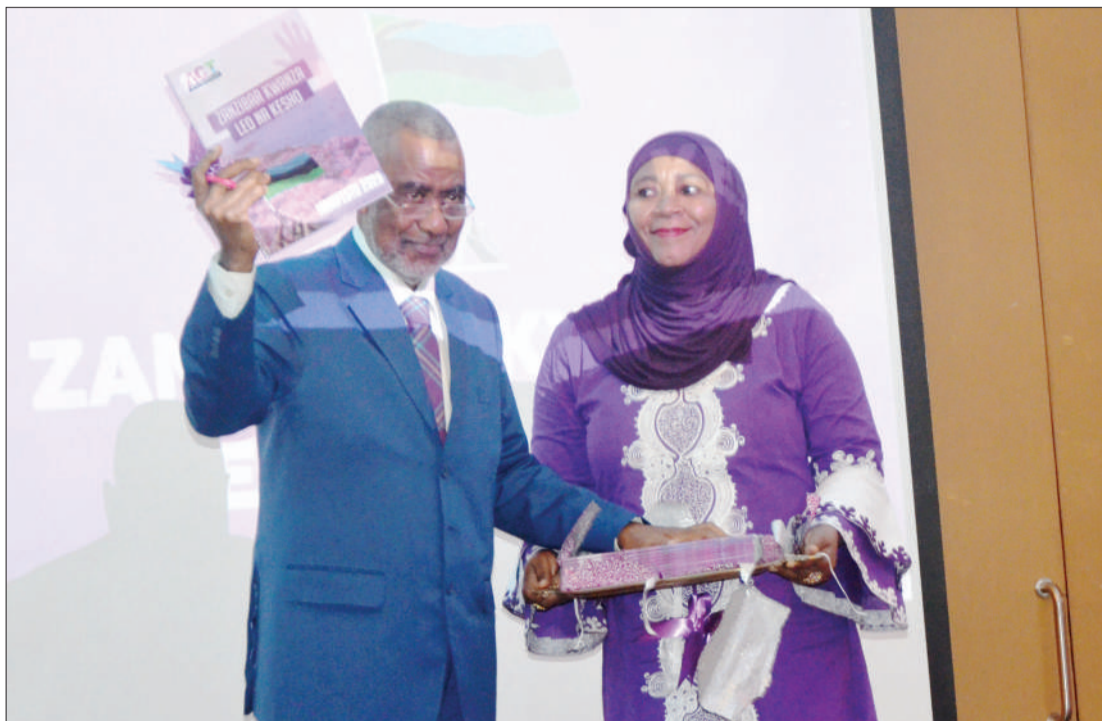
Mgombea urais wa Zanzibar kwa tiketi ya Chama cha ACT-Wazalendo, Maalim Seif Sharif Hamad, akizindua ilani ya uchaguzi wa Zanzibar ya Mwaka 2020-2025 mjini Unguja jana.

Pia kutaimarisha miundombinu wezeshi kwa uchumi wa visiwa hivyo, kutaifanya Zanzibar kuwa kituo cha biashara, fedha na uwekezaji katika eneo la maziwa makuu, kutaendeleza sekta za utalii, mafuta na gesi asilia na kuchochea kilimo cha mapinduzi, uvuvi na ufugaji.