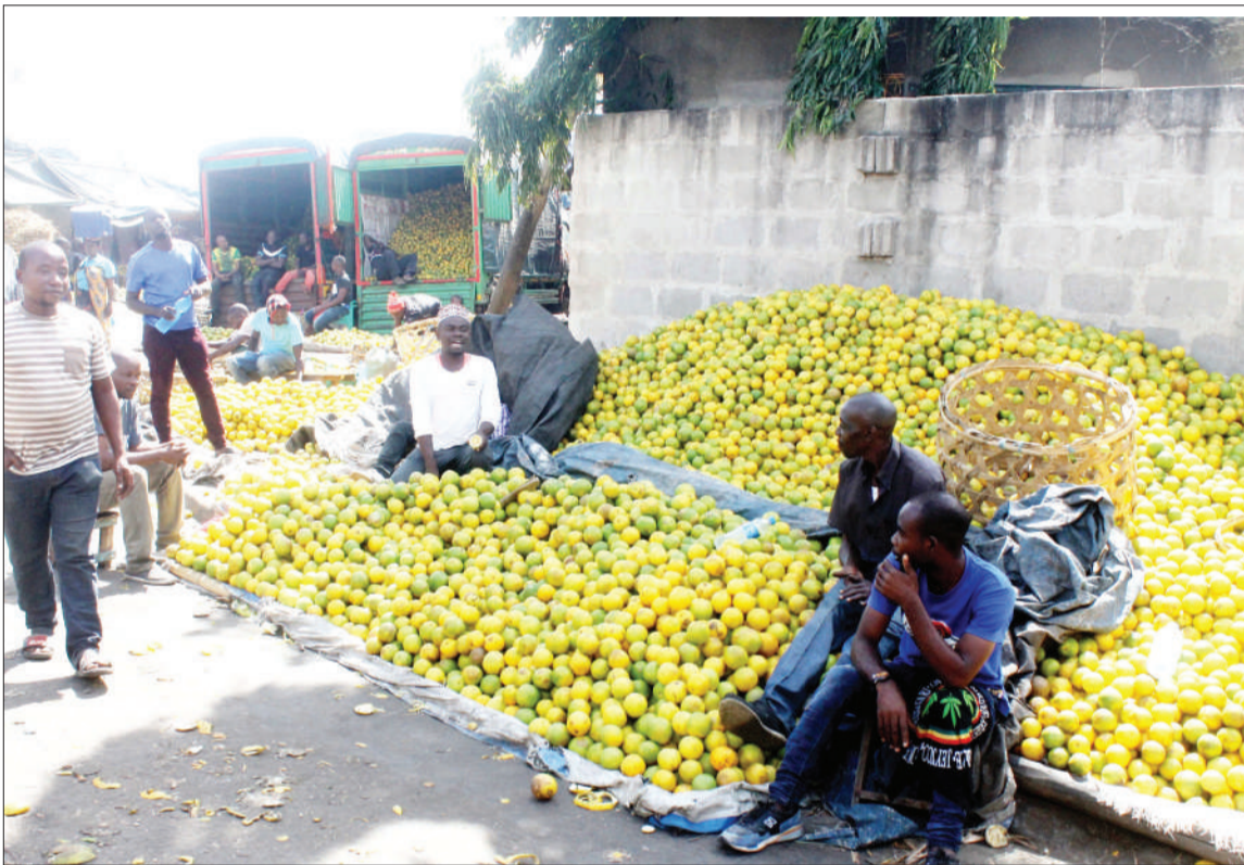
Wachuuzi wa machungwa wakisubiri wateja katika Soko la Buguruni, jijini Dar es Salaam jana. Chungwa moja linauzwa 130/-, kwa bei ya jumla.

"Mafanikio haya na mengine mengi yanaadhimisha hatua kubwa ambayo imefanywa na serikali katika kuhakikisha kuwa kero ya rushwa na ufasadi nchini inadhibitiwa katika taifa letu, lakini wananchi pia wameshiriki katika kutoa ushirikiano kwa serikali yao...sisi TAKUKURU tutaeendelea kuwa wakali kwa wala rushwa," alisema Jenerali Mbungu.