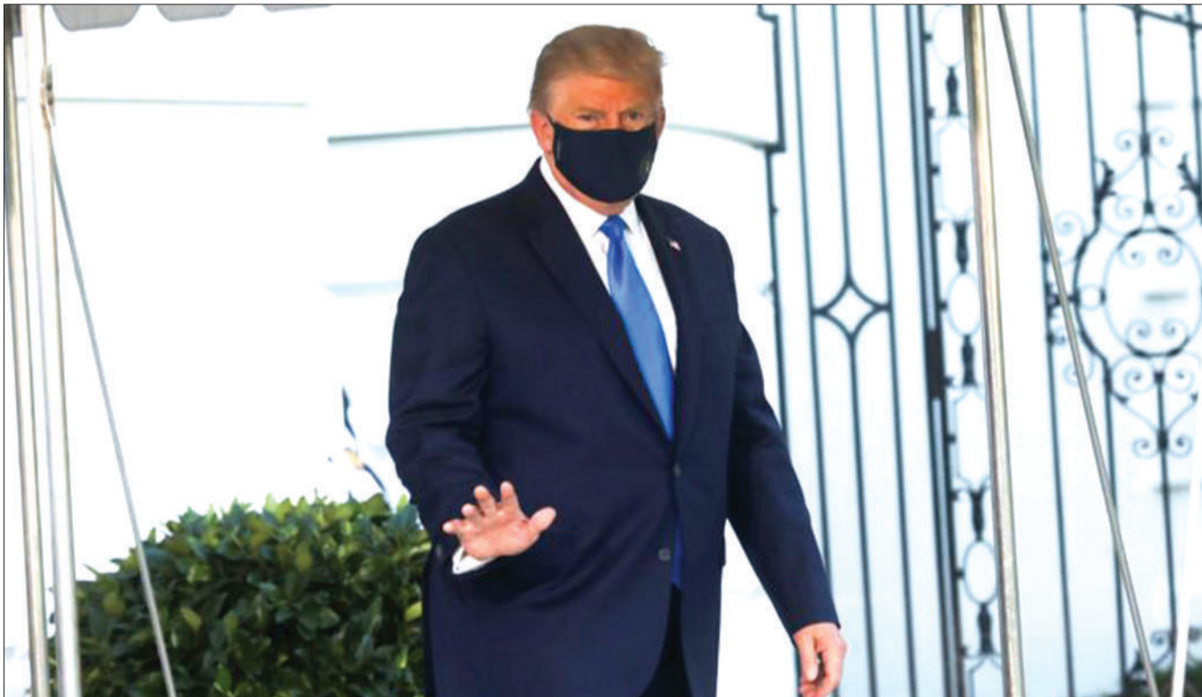
Rais Donald Trump akinyoosha mkono kuonyesha ishara ya kuwa sawa kwa wanahabari (hawapo pichani) wakati anaelekea kuingia kwenye helikopta iliyompeleka hospitali.