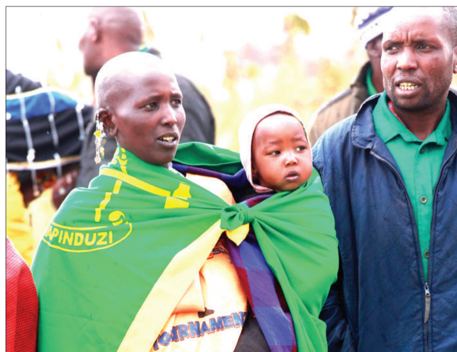
Mama na mwanawe wakiwa wamejifunika bendera ya CCM, wakati wa uzinduzi wa kampeni za mgombea ubunge wa Jimbo la Ngorongoro kupitia chama hicho, katika Kijiji cha Misigyo hivi karibuni.