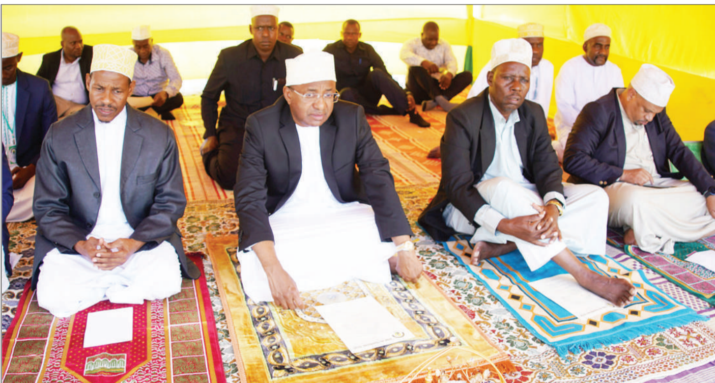
Mgombea urais wa Zanzibar kwa tiketi ya CCM, Dk. Hussein Ali Mwinyi (wa pili kushoto), pamoja na viongozi wa dini na serikali wakiwa katika dua maalum ya kuliomba Taifa kuelekea kwenye uchaguzi mkuu wa amani katika uwanja wa kufurahishia Watoto Kariakoo, mjini Zanzibar jana.

Vifaa vilivyokabidhiwa ni pamoja na viti vya watu wenye ulemavu, magongo ya kutembelea, miwani ya jua, fimbo nyeupe, mabati na baiskeli za miguu mitatu.