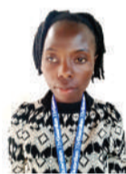
Na Tuntule Swebe