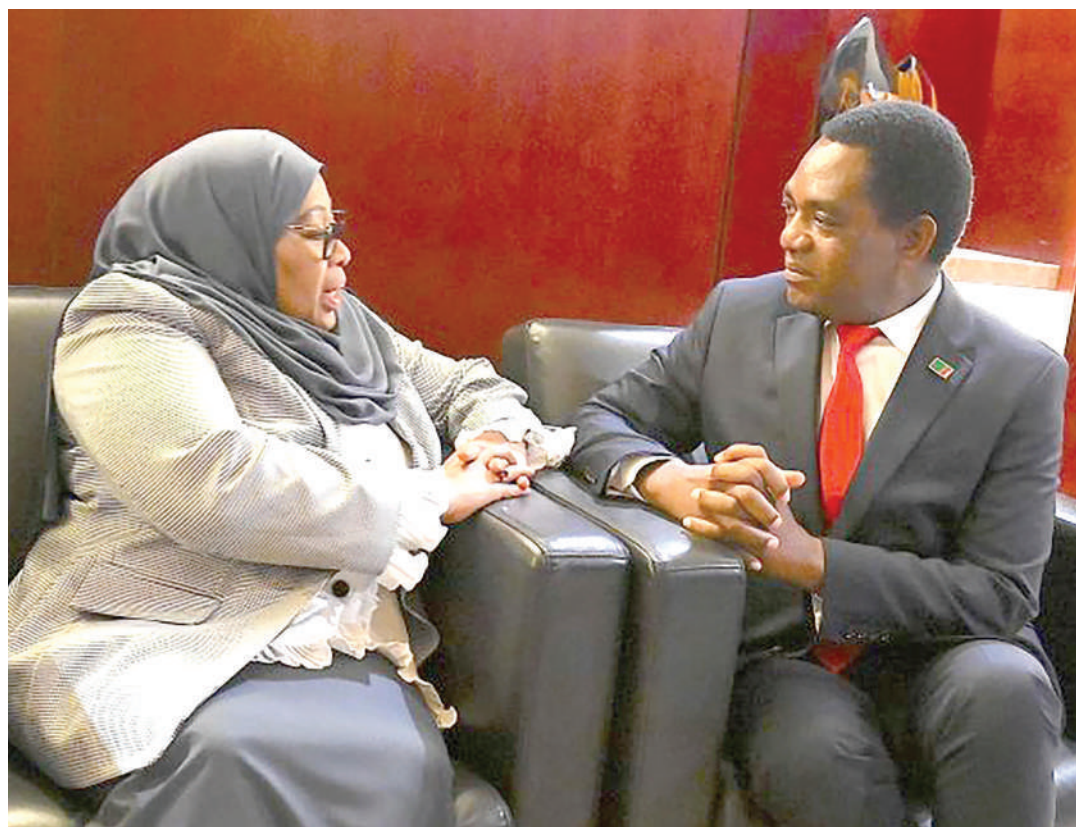
Rais Samia Suluhu Hassan, alipokuwa kwenye mazungumzo na Rais wa Zambia, Hakainde Hichilema katika ofisi za Makao Makuu ya Umoja wa Afrika (AU) Addis Ababa nchini Ethiopia, mwaka jana.

Lakini katika namna ya kipekee, Tanzania na jirani yake Zambia zimeonekana kuwa zimetupa karata zao mapema, wakiwa katika hatua ya kutiwa saini makubaliano ya awali ikihusu ukarabati wa reli yao ya TAZARA, ambayo imehar-