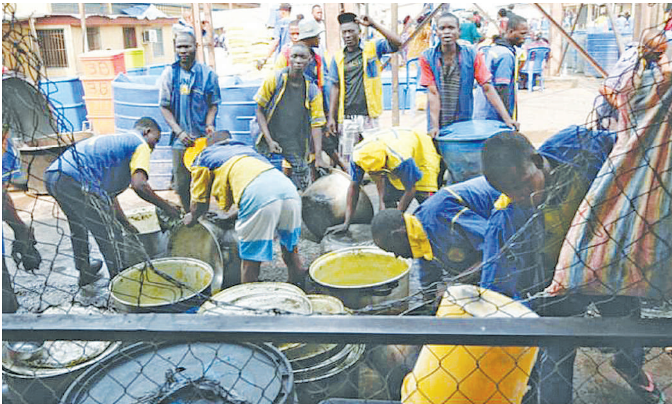
Wafungwa wakisafisha sufuria na sahani katika gereza kuu la Makala, nchini DRC katika picha iliyochukuliwa Julai 27, mwaka huu. Jumla ya wafungwa 131 waliuawa wakati wakajaribu kutoroka kwa kupambana na askari hivi karibuni.