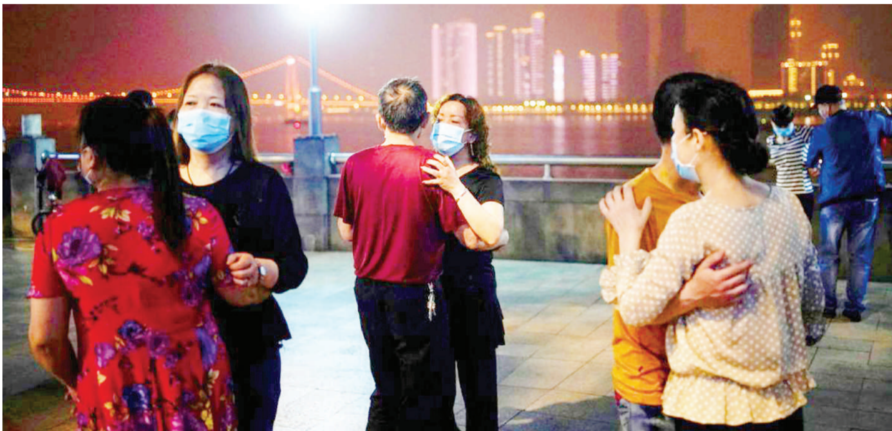
Raia wa China wakiwa wamevaa barakoa huku wakicheza muziki juu ya daraja la mto Yangtze, mjini Wuhan kabla mamlaka ya Jimbo la Hubei, kuwazuia watu kutoka nje kutokana na maambukizo mapya ya Covid-19.

Pesa hizo zililenga kupata suluhu za kisayansi, badala ya dawa, chanjo au teknolojia nyingine ambazo hazijathibitishwa kitaalamu. BBC