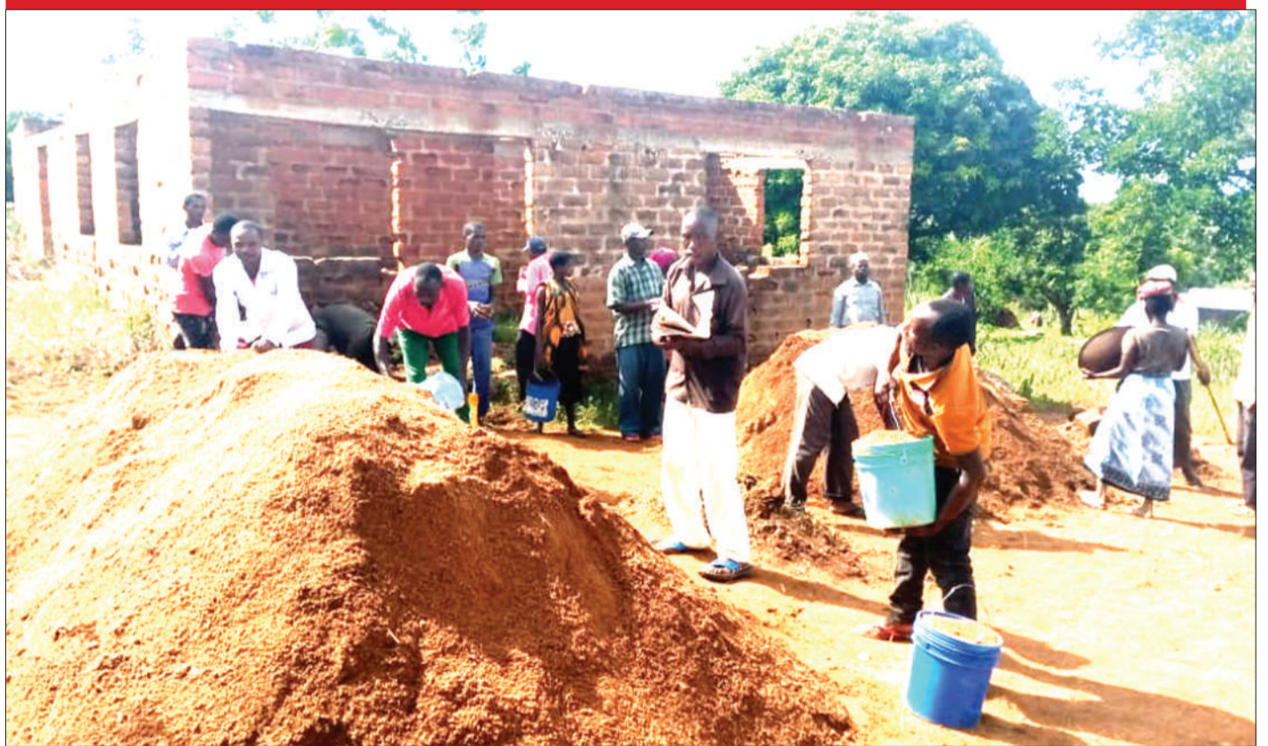
Baadhi ya wakazi wa kijiji cha Buiru, Wilaya ya Musoma, mkoani Mara, wakikusanya mchanga juzi, kwa ajili ya ujenzi wa nyumba za walimu wa Shule ya Msingi Buiru, ili kuwaondolea changamoto ya kuishi katika nyumba za kupanga.

Katika maombi yao, asasi hizo zilipinga marekebisha ya sheria husika kwa msingi kuwa yalikuwa ibara za 13(1), (2), (6) (a),(b); 20(1) na 29(1) na (2) za Katiba ya Jamhuri ya Muungano wa Tanzania kwa kile kilichodaiwa kuwa marekebisha hayo yanakinzana na haki ya usawa mbele ya sheria, uhuru wa kujumuika na haki ya kufaidi haki za msingi za binadamu.