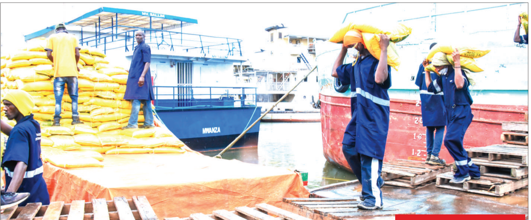
Wafanyakazi wa Bandari ya Mwanza Kusini, wakiendelea kushusha tani 20,000 za sukari na kuzipakia kwenye magari ili kusambazwa mikoa mbalimbali, baada ya kuwasili na meli bandarini hapo juzi, kutoka nchini Uganda.

SPIKA asema hawakufukuzwa walitakiwa warudishe fedha walizochukua... Endelea ukurasa 2