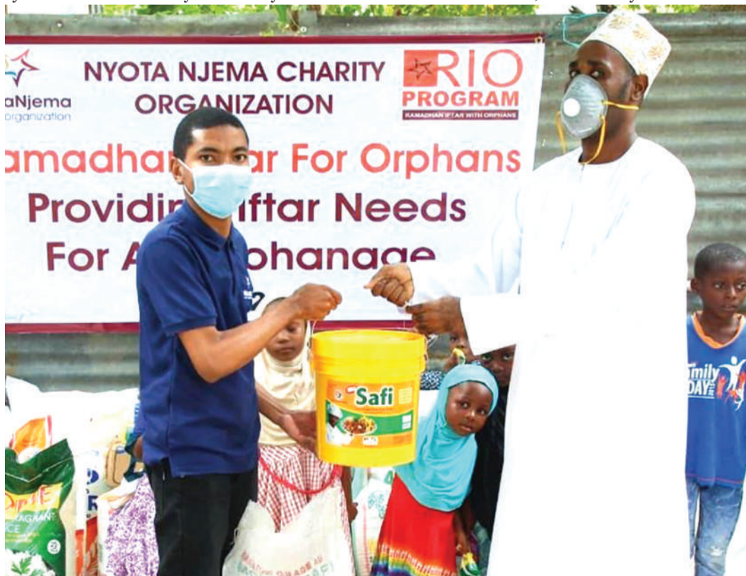
Mtoto akipokea msaada wa chakula kutoka kwa kiongozi wa Jumuiya ya Nyota Njema.