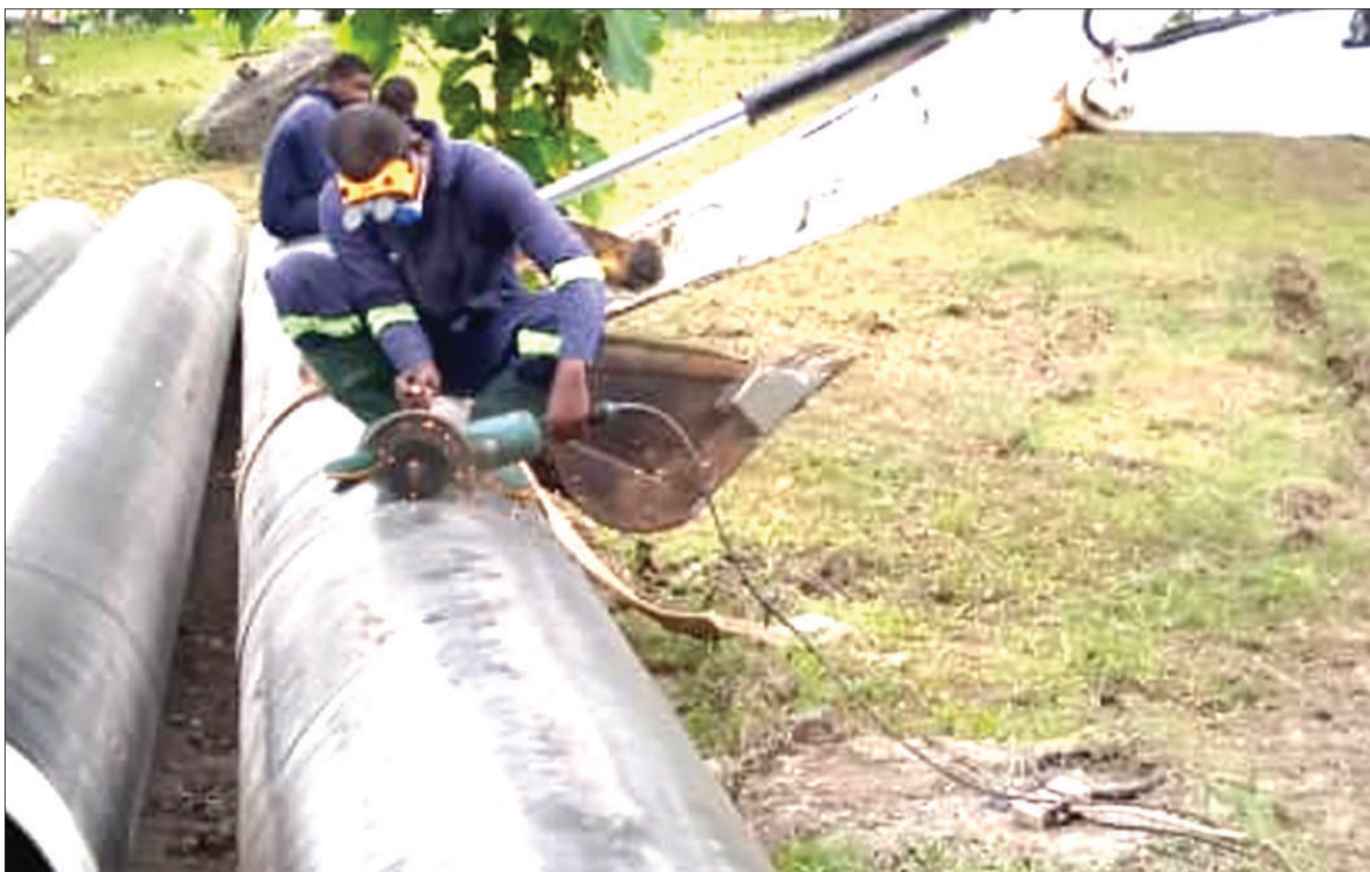
Mafundi wa Mamlaka ya Majisafi na Usafi wa Mazingira Dar es Salaam (DAWASA), wakikata bomba la inchi 30, kwa ajili ya kubadili kipande kilichochakaa katika eneo la Kiluvya Gogoni, jijini Dar es Salaam juzi.

Vile vile, alisema wilaya hiyo imeanza vizuri msimu huo kwa kuuza mazao ya wakulima kwa bei nzuri ambayo itawawezesha kumudu gharama za uendeshaji na kupata faida.