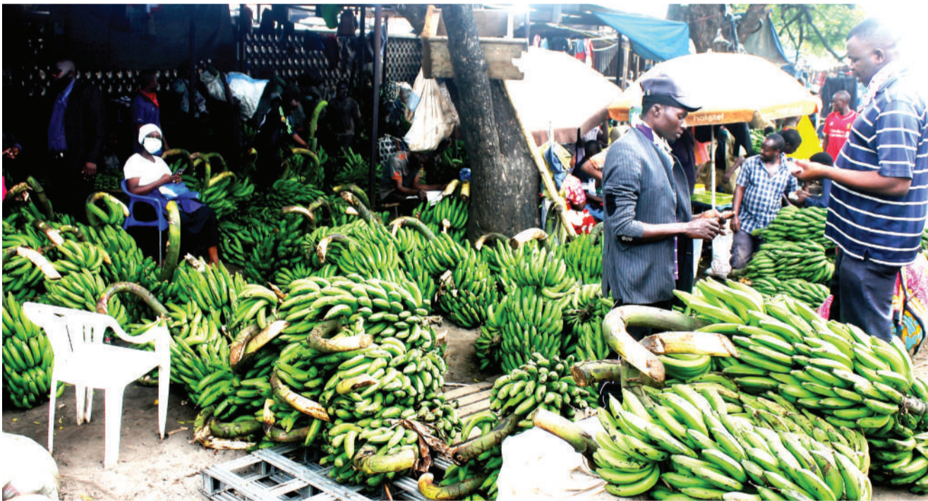
Mchuzi wa ndizi akimhudumia mteja wake katika Soko la Temeke, jijini Dar es Salaam jana. Mkungu mmoja wa ndizi uliuzwa kwa bei ya 9,000/- hadi 11,000/- kulingana na ukubwa wake.