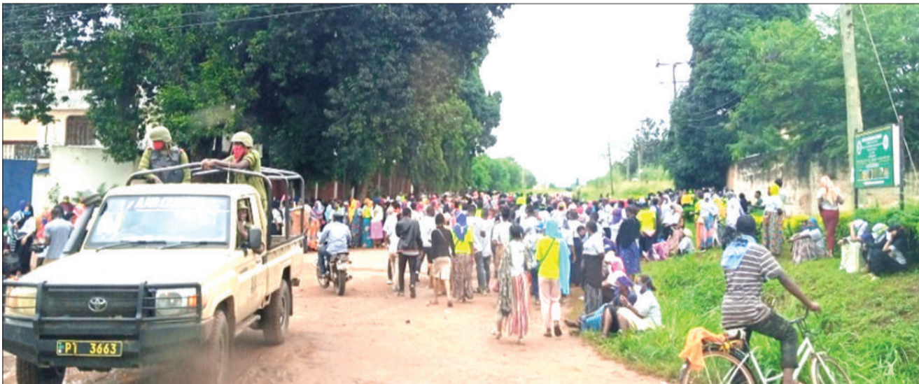
Askari wa Jeshi la Polisi, wakiwa wameimarisha ulinzi baada ya wafanyakazi wa kiwanda cha kutengeneza nguo za michezo cha Mazava Fabric & Production East Africa LTD kilichopo Manispaa ya Morogoro, kujikusanya umbali wa mita zaidi 200 kutoka kiwandani hapo jana, kutokana na kuzuiwa kuingiza ndani kufanya shughuli za uzalishaji na viongozi wao, wakidai kupewa likizo ya miezi mitatu bila malipo kutokana na kinachodaiwa kuwa ni ukosefu wa soko la nje ya nchi.

*Imeandikwa na Idda Mushi na Ashton Balaigwa