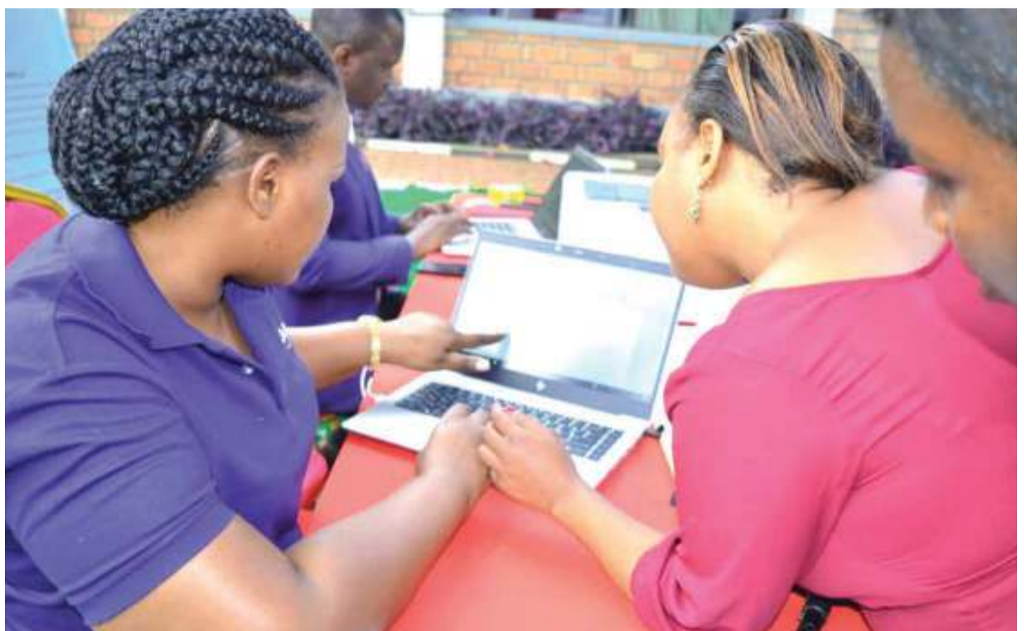
Elimu inatumika katika kuhamasisha watu kusajili jina la biashara kwa kutumia mtandao

“Wahenga walisema “mtoto umleavyo ndivyo akuavyo” kwa muktadha huu biashara ni kama mtoto, njia ambazo zinatumika kuilea biashara ndizo zitakazo ifanya ikue, idumae au ifilisike.” anasema.