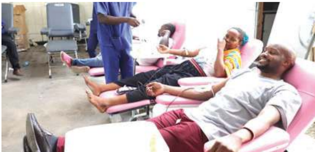
Uchangiaji wa damu ni sehemu ya kampeni inayofanywa na FFWP katika kuboresha afya ya wananchi nchini

“Kwa mfano tunapoambiwa FFWP, wamechimba visima katika maeneo ambako huduma ya maji safi na salama ilikuwa tatizo, wamesaidia sio tu kuwapatia wananchi huduma hiyo, lakini pia kuokoa muda ambao wananchi hao walikuwa wanautumia kutafuta maji, ili kufanya shughuli nyingine za uzalishaji mali. Hawa ni marafiki wa kweli katika mapambano dhidi ya adui umasikini”.