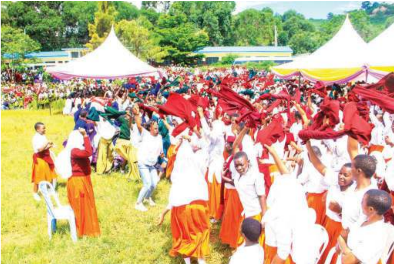
Baadhi ya wanafunzi shule za mkoa wa Dodoma, wakifurahia wakati wa Jukwaa la Kipepeo, lililofanyika jijini huo, mapema wiki hii, lenye dhumuni ya kutoa elimu ya mimba za utotoni na maambukizo ya Ukimwi. Kampeni hiyo, ipo chini ya Wizara ya Afya, Maendeleo ya Jamii, Jinsia, Wazee na Watoto na kudhaminiwa na Global Fund, NACP, Taasisi ya Benjamin William Mkapa na kuratibiwa na Clouds Media Group.

Watu wa Marekani wametoa zaidi ya Dola bilioni 10 zitakazosaidia jitihada za kimataifa zakukabiliana na Covid-19. "Tutaendelea kuhakikisha kuwa mchango mkubwa wa kifedha na wa kisayansi wa Marekani katika mapambano haya unabaki kuwa kitovu na sehemu ya jitihada za pamoja na zilizoratibiwa vyema za jumuiya ya kimataifa dhidi ya Covid-19. Ikiwa ni miezi kadhaa sasa tukipambana na janga hili nchini kwetu na nje ya nchi yetu, Marekani inaendelea kuongoza jitihada za kimataifa dhidi ya mlipuko huu, ikijenga katika uzoefu wa miongo kadhaa ya uongozi katika utoaji misaada ya kiafya inayooko maisha na misaada ya kibinadamu."