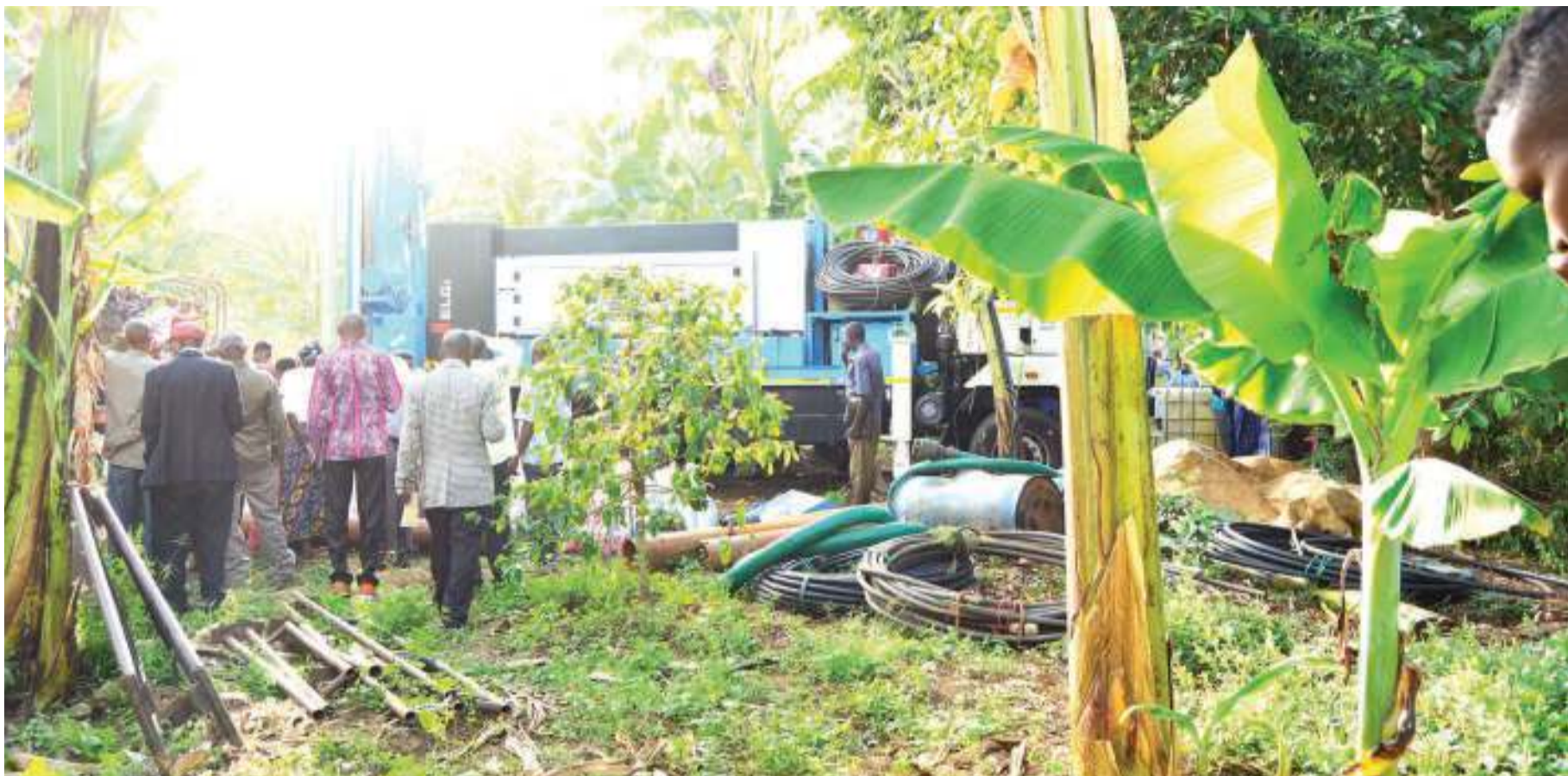
Miradi ya uchimbaji wa kisima inayotekelezwa na FFWP vijijini