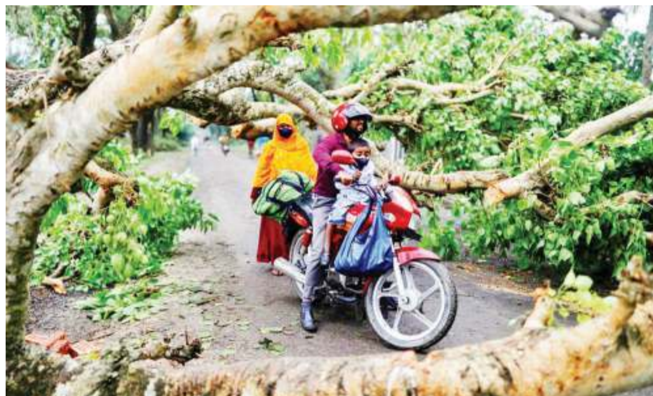
Mwendesha pikipiki katika mji wa Satkhira, Bangladesh, akiangalia sehemu ya kupita baada ya kimbunga Amphan kuangusha mti na kuzuia barabara.

Kwa upande mwingine, Umoja wa Mataifa umetoa tahadhari kuhusu hatari ya kuanguka kwa mfumo wa afya wa nchi hiyo ambayo ina uwezo mdogo wa kiuchumi baada ya kuathirika na vita kwa muda mrefu. BBC