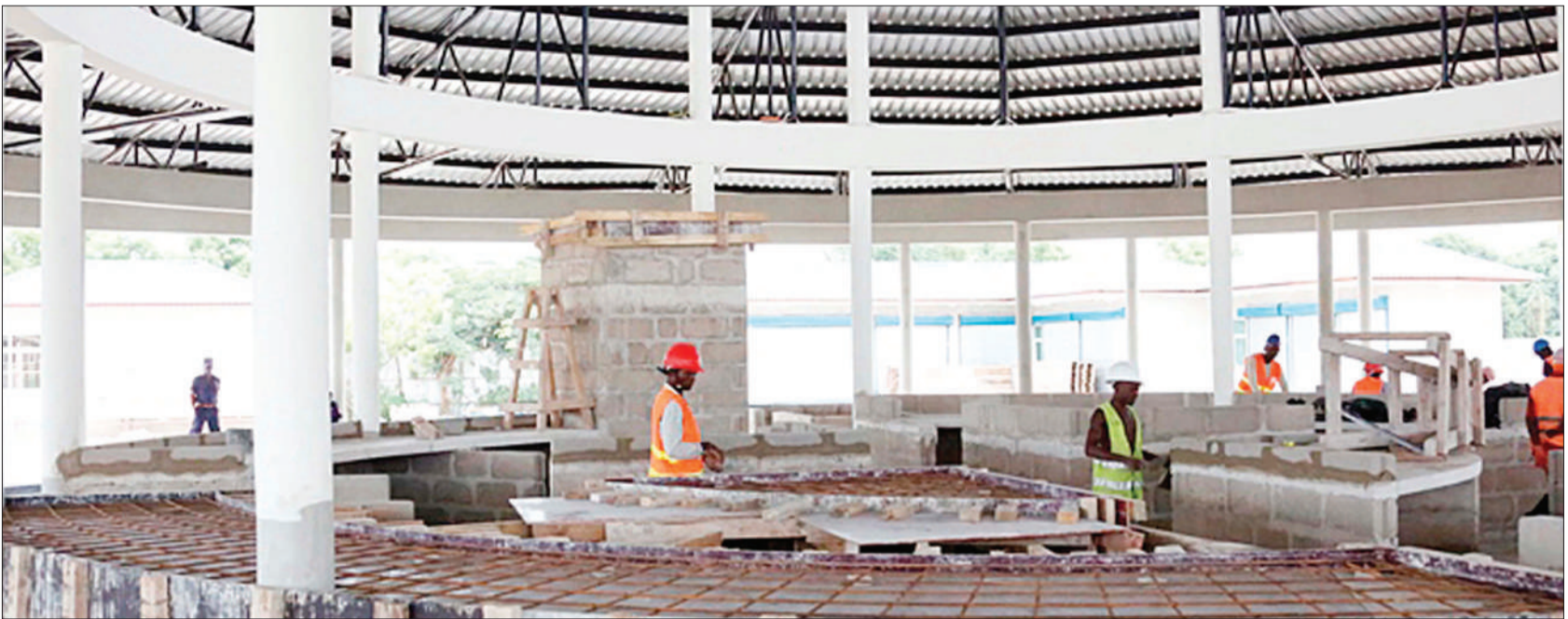
Soko la kisasa linalojengwa chini ya mradi wa Dar es Salaam Metropolitan Development Project (DMDP), jijini Dar es Salaam.