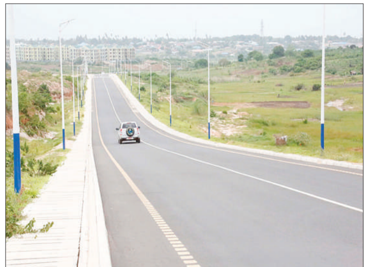
Barabara iliyojengwa wilayani Temeke, kupitia mradi wa Metropolitan Development Project (DMDP).

“Fedha zilizotumika hadi sasa ni Sh. bilioni 66. 6 kati ya Sh. bilioni 115 zilizotengwa na miradi hii yote ipo mbioni kukamilika,” anahitimisha Mhandisi Rwegasira.