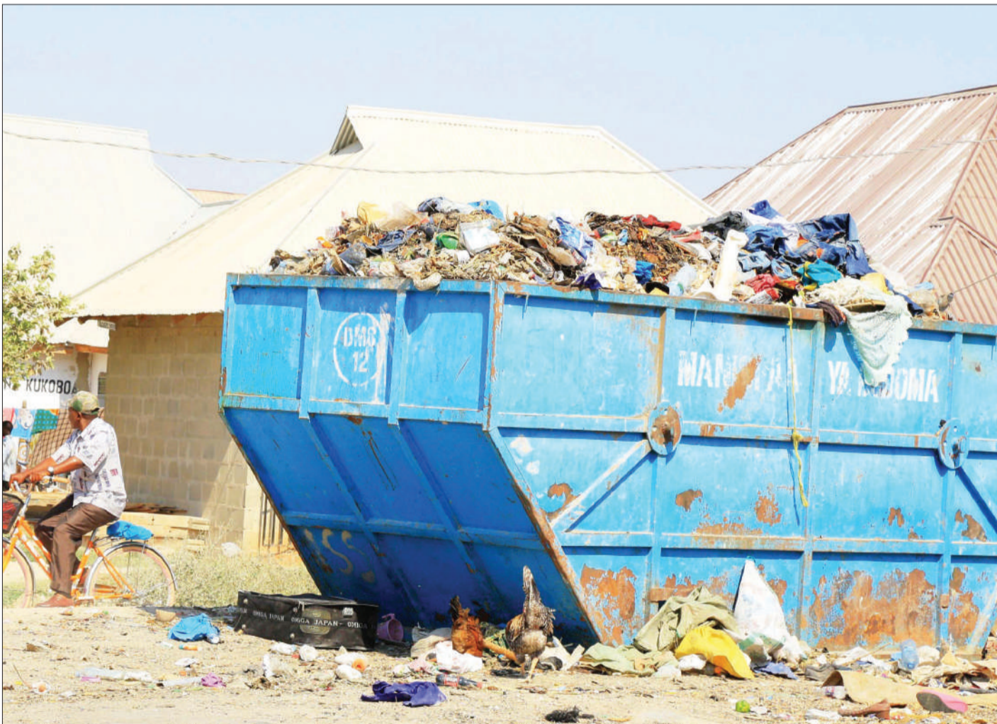
Kontena la kuhifadhi takataka likiwa limejaa na zingine kutapakaa chini karibu na makazi ya watu eneo la Chang'ombe, jijini Dodoma jana, kitendo ambacho ni hatari kwa afya za wakazi wa eneo hilo.

“Huu mfumo utasaidia kutambua akiba ya mafuta kwa aina na wingi katika miliki ya wauzaji, mauzo na matumizi pamoja na mambo mengine,” alisema.