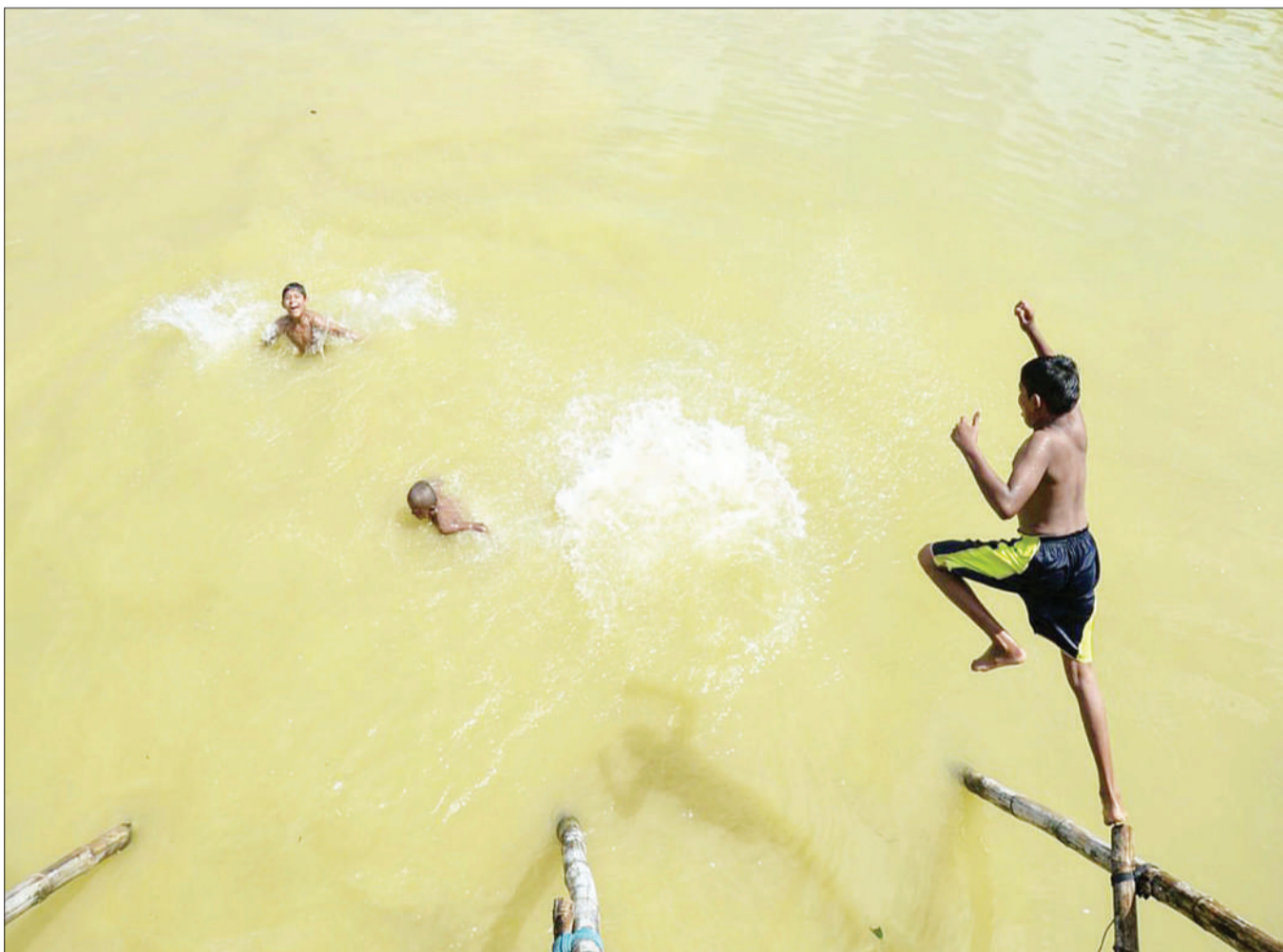
Watoto kutoka jamii ya Rohingya, wakioga maji ya mto kambi ya wakimbizi ya Kutupalong, Ukhia nchini Bangladesh.