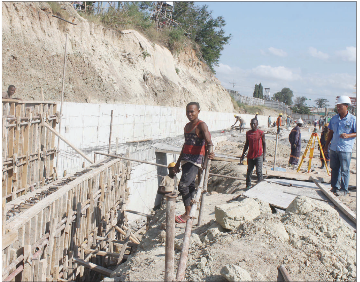
Mafundi wakiendelea na ujenzi wa ukuta wa uzio wa kituo kipya cha mabasi yaendayo mikoani na nchi jirani kilichopo Mbezi Luis, jijini Dar es Salaam hivi karibuni.

Mussa alisema sekta ya kilimo ina nafasi kubwa katika kuzalisha ajira kwa vijana huku likiwapo eneo kubwa la ardhi kwa ajili ya kuzalisha bidhaa mbalimbali za chakula. Alisema Umoja wa Vijana umefurahishwa na kazi kubwa iliyofanywa na mgombea huyo alipowatembelea wakulima wa mwani, zao ambalo hulimwa kwa asilimia 90 na wanawake.