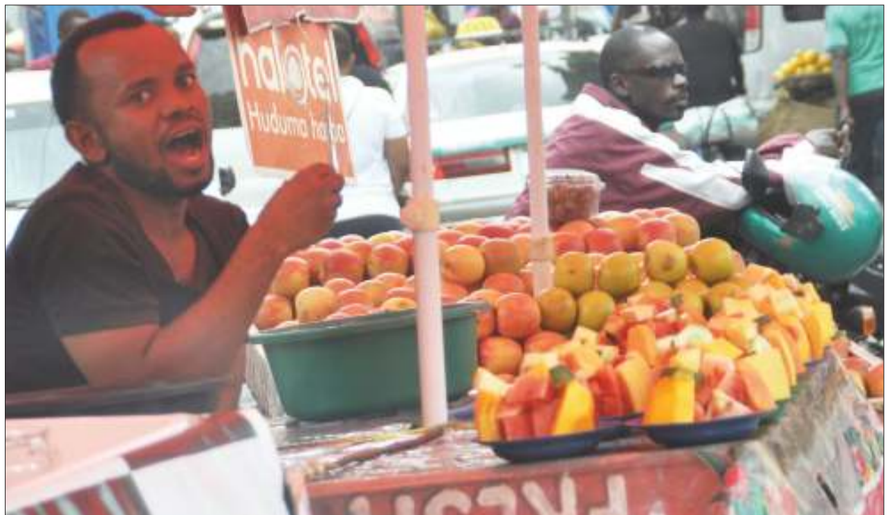
Mchuzi wa matunda akisubiri wateja katika kona ya Barabara ya Uhuru na Mtaa wa Sikukuu, jijini Dar es Salaam jana, bila ya kuyafunika kitendo ambacho ni hatari kwa afya ya walaji.