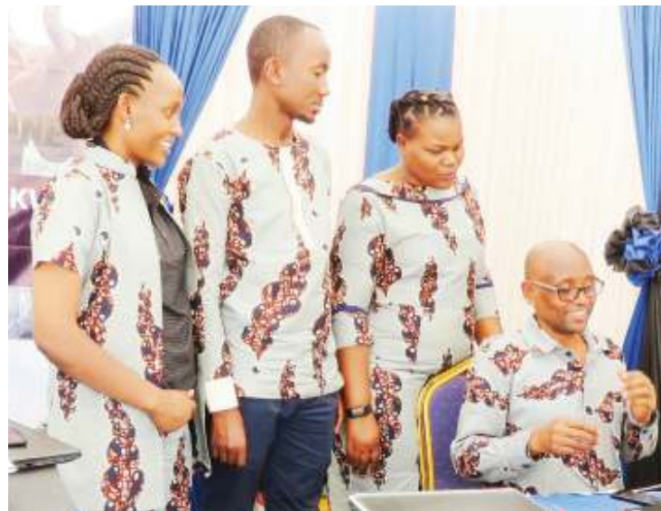
Watumishi wa Brela wakiwahudumia wateja wao kwenye banda lao jana, katika maonyesho ya Nanenane.

“Hayo ni masharti ya muhimu kwa mtu binafsi anayekata leseni ya kufanya biashara ya kununua na kusafirisha mifugo kitaifa na kusafirisha nje ya nchi, ambayo kimsingi ni muhimu kuyazingatia,” anasema.