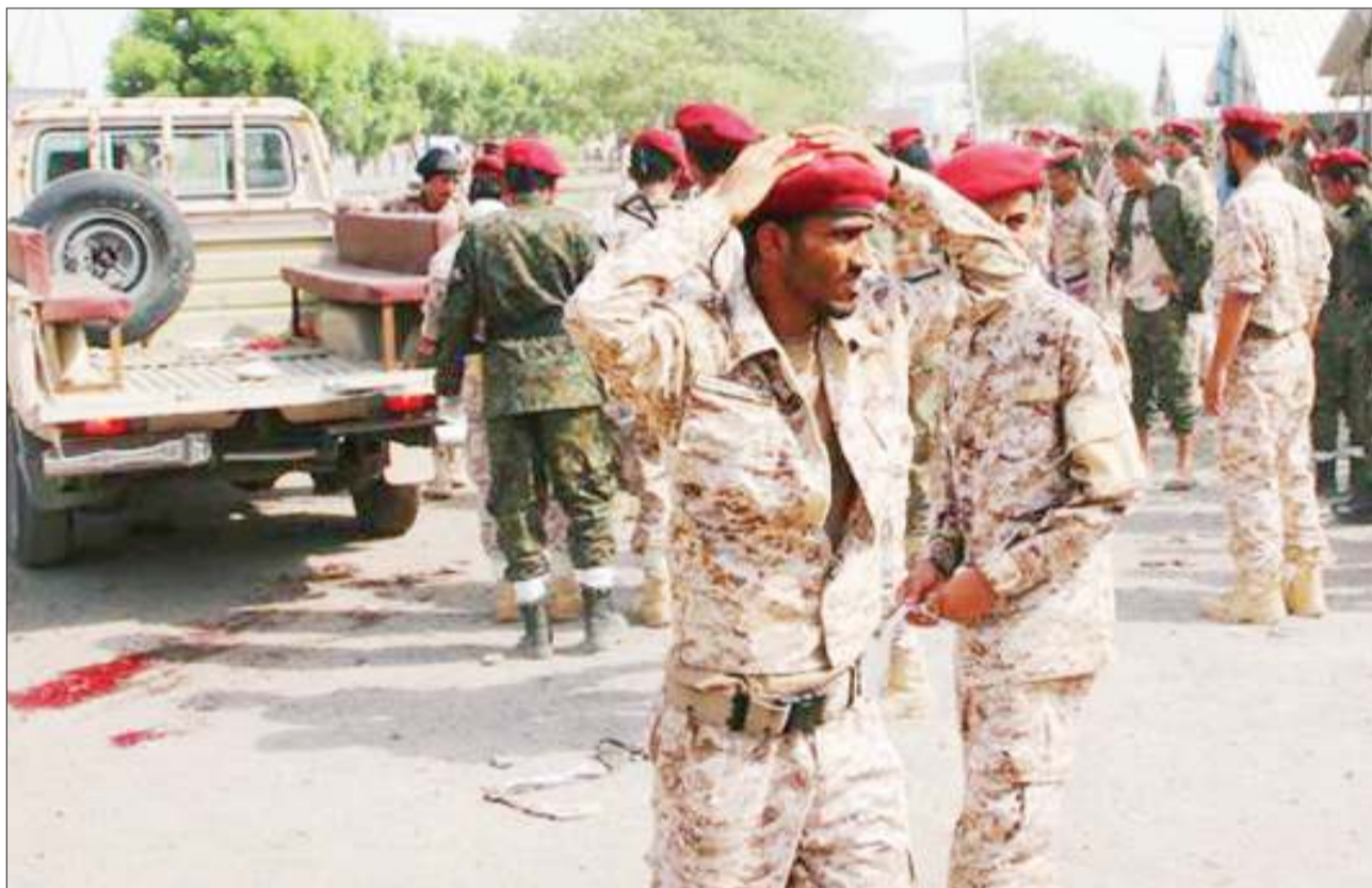
Wanajeshi wa Yemen wakiokoa wenzao katika kambi ya Al Jalaa baada ya kujeruhiwa na makombora yaliyorushwa na waasi wa Kihouthi na kuuwa watu zaidi ya 60.

Majaribio hayo yalikuwa ni onyo kwa Korea Kusini kuhusu zoezi la kijeshi la pamoja na Marekani linalotarajiwa kufanyika muda wowote. BBC