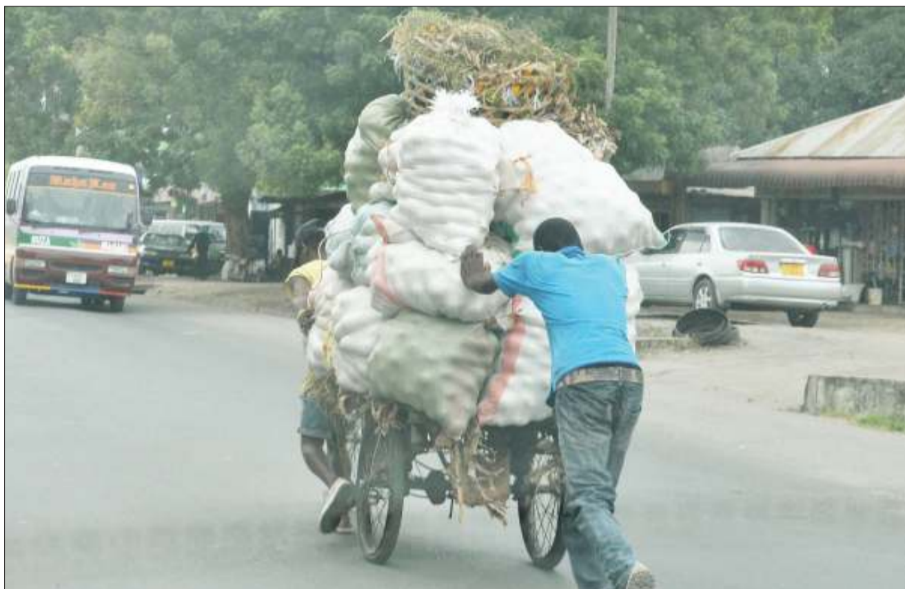
Mkazi wa jiji akimsaidia mwendesha guta kulikusukuma, huku likiwa limesheheni mzigo katika Barabara ya Uhuru, eneo la Ilala Sharif Shamba, jijini Dar es Salaam jana.