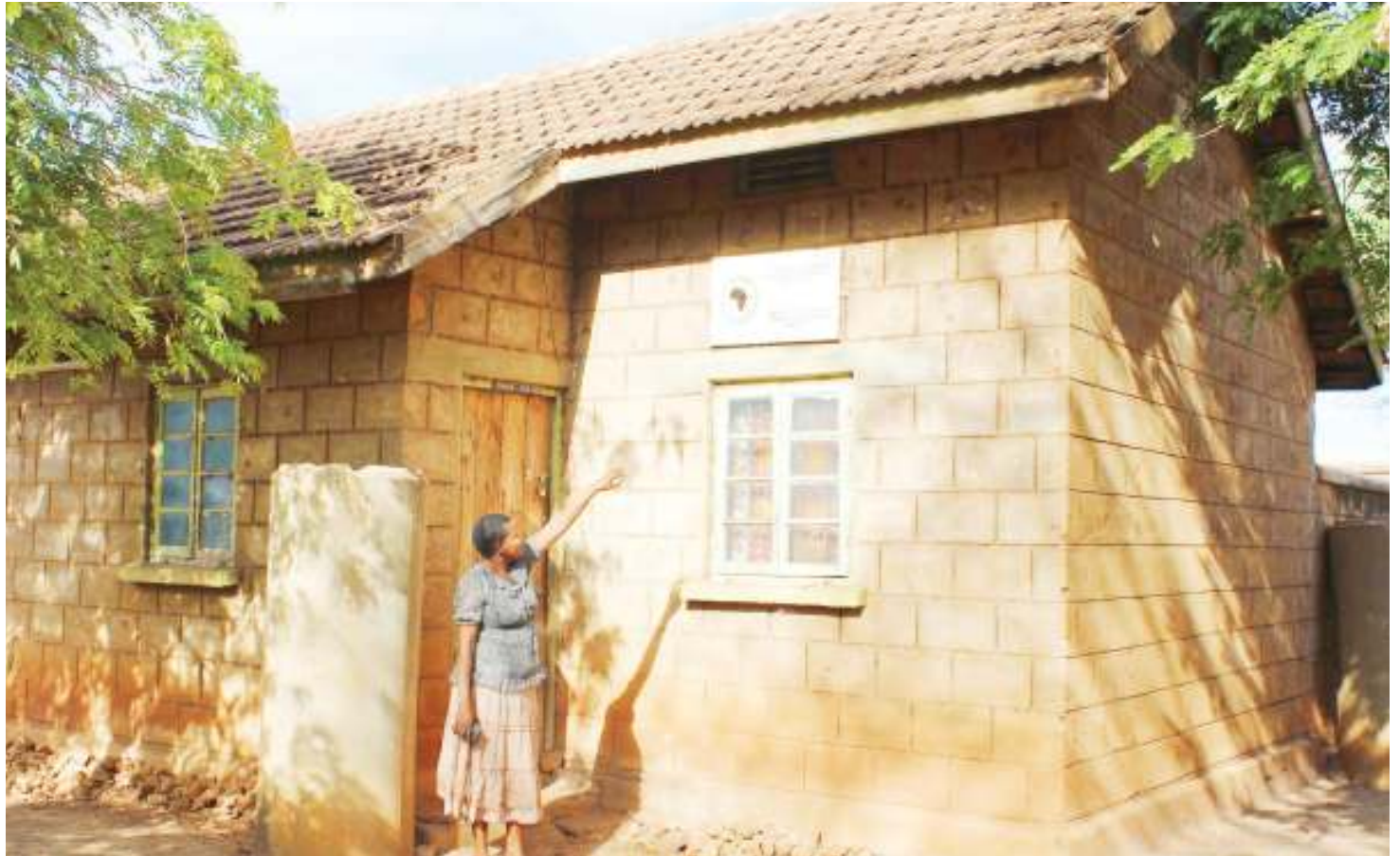
Makazi aliyotumia Samora Machel, katika kambi ya Kongwa.

Tanzania na nchi nyingine nane, zilitia saini tamko la kuanzishwa rasmi SADC, ambayo juku-