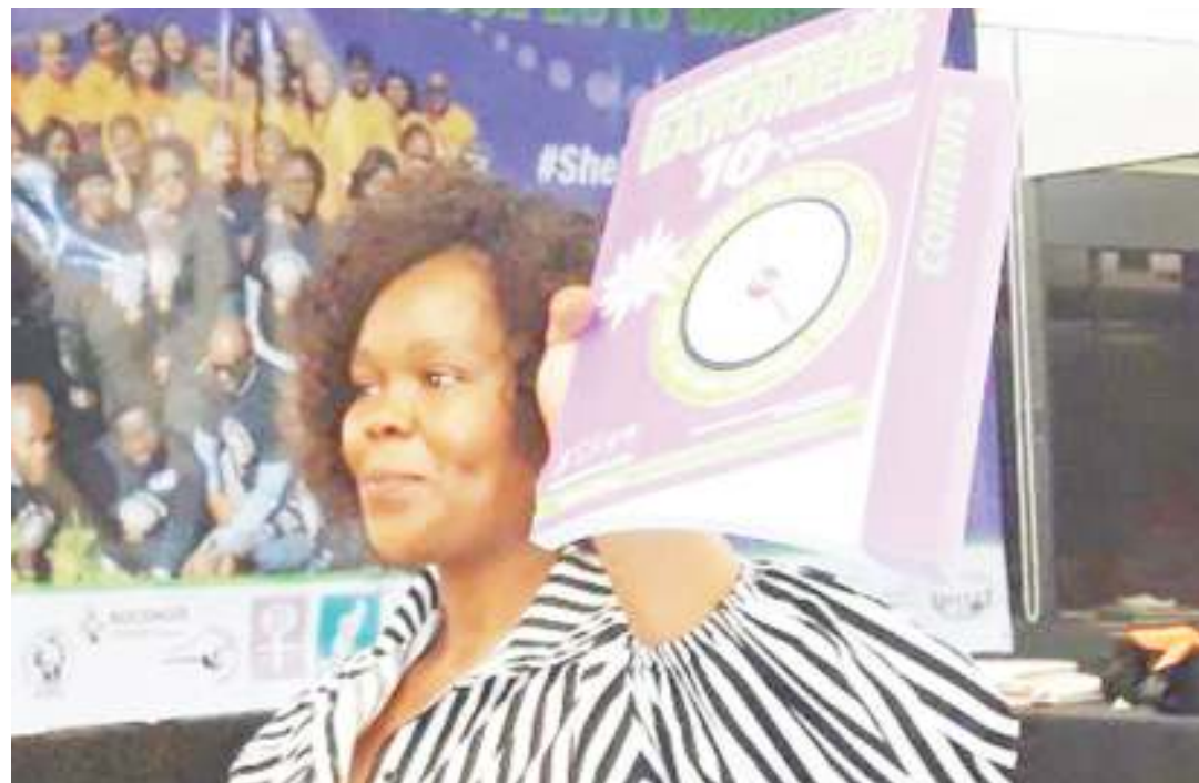
Mshiriki wa masuala ya jinsia wa SADC, akiwasilisha jambo.