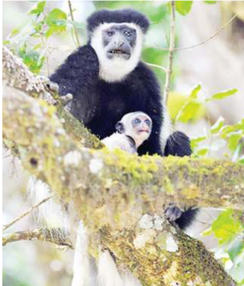
Mbega weupe na weusi wakiwa katika Hifadhi ya Magamba.

Anafanua kuwa, ametembelea misitu na kuangalia aina ya mimea, wanyama wadogo wanaovutia na kuangalia ma-