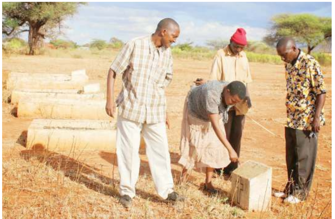
Makaburi ya wapigania uhuru wa Msumbiji, Zimbabwe na Afrika Kusini, yaliyoko Kongwa, mkoani Dordoma.

Kulikuwapo bomba la mafuta la Tanzania na Zambia (TAZAMA Pipeline) na Bomba la Mafuta la Tanzania na Uganda, ambalo halikufanikiwa, kwa kuwa Rais Milton Obote alipinduliwa na Iddi Amin.