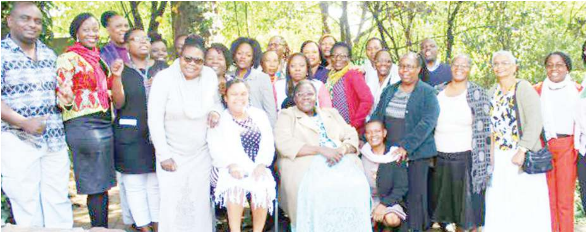
Wajumbe wa baadhi ya matukio ya kijinsia, ndani ya Jumuiya ya SADC.

• Wanaokeketewa wahamishiwa ujasiriamali • Shindano maalumu mshindi 'kukwea pipa' • Ajenda ya serikali ukatili kuondoka 50