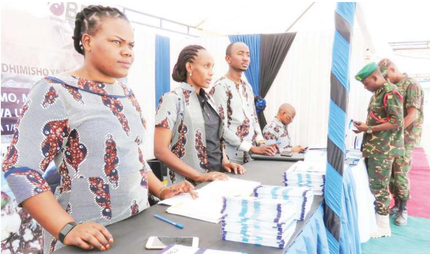
Watumishi wa Brela wakiwa kwenye banda lao la kutolea elimu kwenye maonyesho ya Nanenane, huku askari wa Jeshi la Wananchi wakisoma vipeperushi vyao, mjini Bariadi.

“Ninaweza kusema kwamba hii ni habari njema kwa wakazi wa mikoa