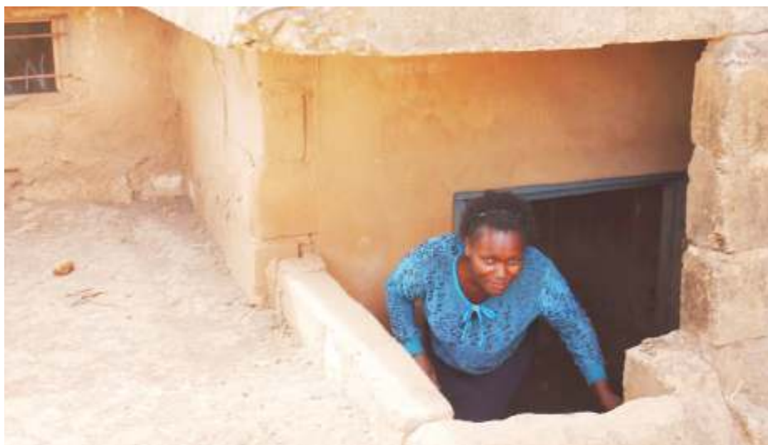
Baadhi ya makazi mengine ya wapigania uhuru, yaliyokuwapo Kongwa, Dodoma.

“ Tanzania, pia ina historia ya kuwa na ofisi za ukombozi Afrika na wanaharakati wake.