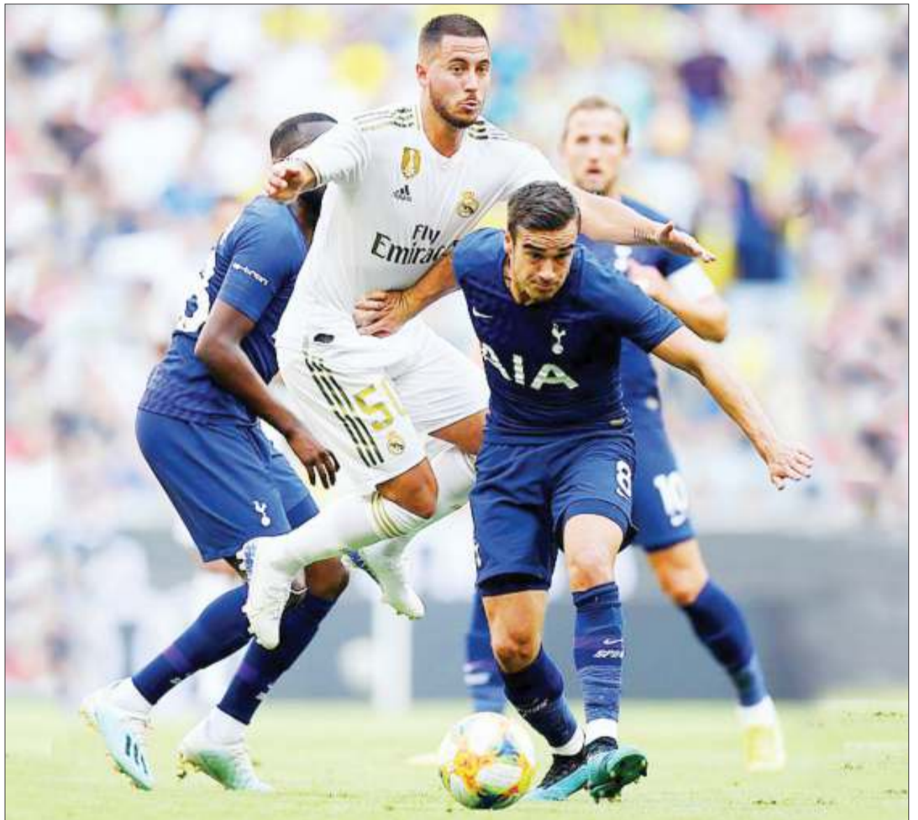
Mshambuliaji mpya wa Real Madrid, Eden Hazard (katikati), akiwa katika harakati za kuwania kumiliki mpira dhidi ya kiungo wa Tottenham Hotspur, Harry Winks kwenye mchezo wa Kombe la Audi uliopigwa Uwanja wa Allianz Arena mjini Munich, Ujerumani Jumatatu wiki hii. Spurs ilishinda 1-0 kupitia kwa Harry Kane.