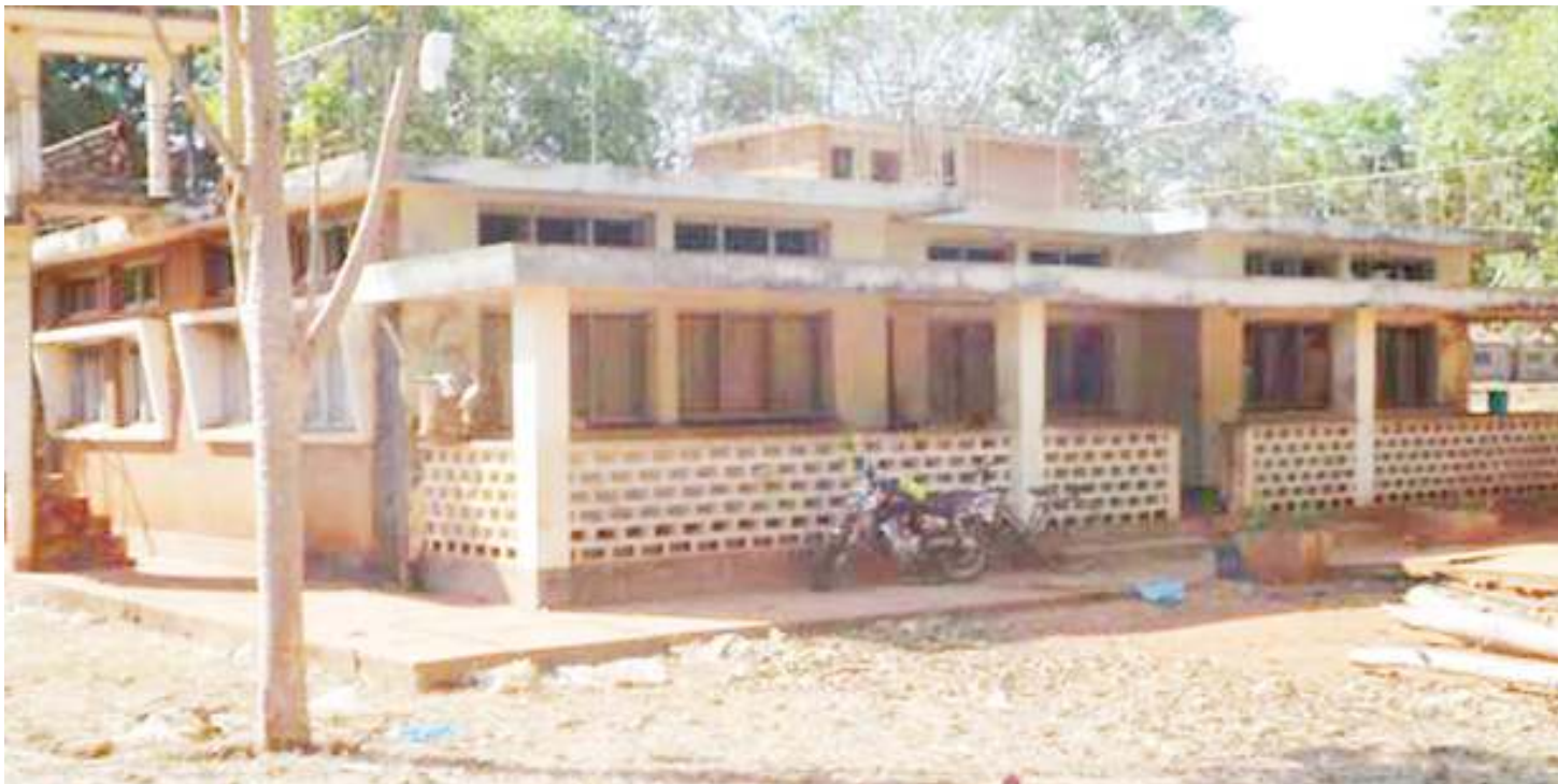
Nyumba aliyotumia Samora Machel, iliyoko katika kambi ya Nachingwea.

• Simulizi ndefu tangu jumuiya hiyo kuzaliwa