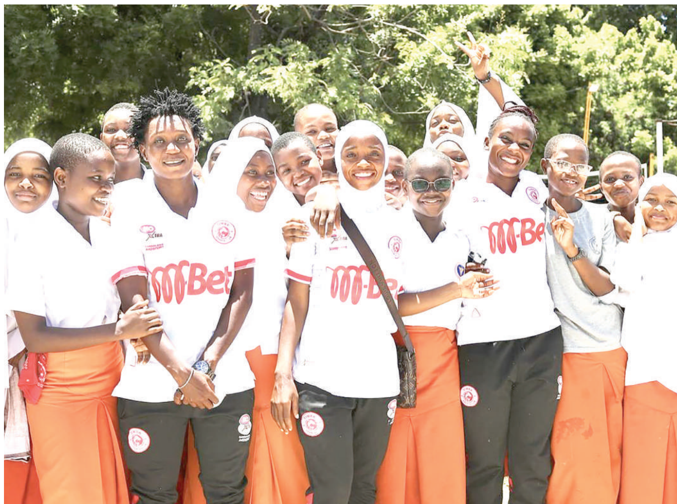
Wachezaji wa Simba Queens wakiwa na wanafunzi wa Shule ya Sekondari Jangwani, Dar es Salaam walipoenda kuwatembelea katika kilele cha Siku ya Wanawake Duniani kilichofanyika Machi 8, mwaka huu.

Hata hivyo, kama timu Bingwa wa Kombe la FA itakuwa moja kati ya timu mbili za juu kwenye Ligi Kuu, basi moja kwa moja, timu itakayoshika nafasi ya nne itapata nafasi ya kucheza michuano Kombe la Shirikisho Afrika.