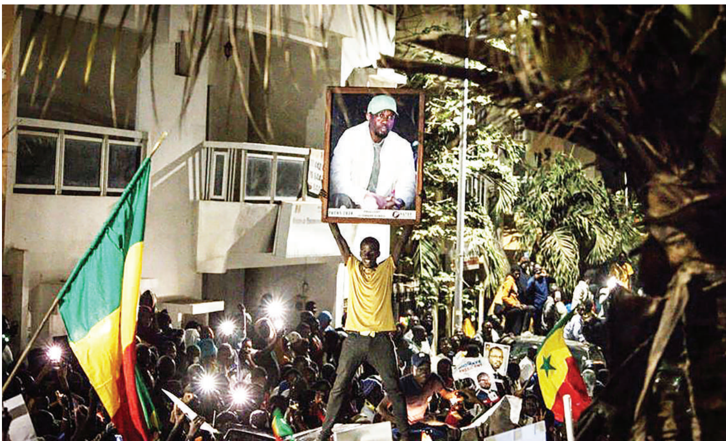
Wafuasi wa kiongozi wa upinzani nchini Senegal, Ousmane Sonko wakishangilia kuachiwa kwake katika jiji la Dakar jana.