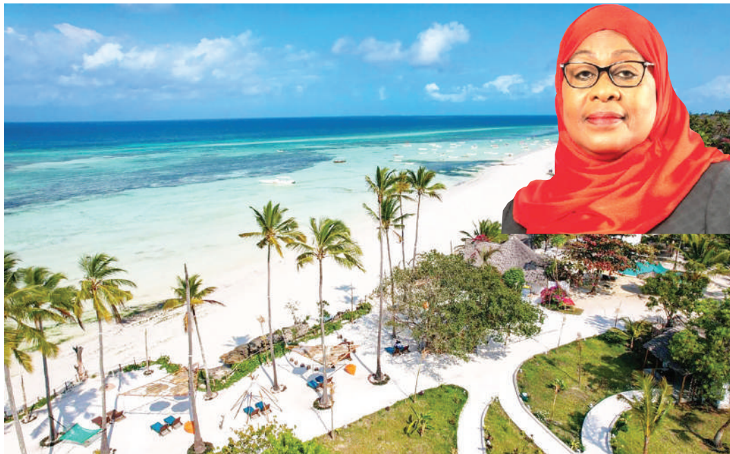
Moja ya fukwe za Kizimkazi

Kuhusu elimu, anasema Kizimkazi imepata shule ya kisasa ya ghorofa na kubainisha kwamba kabla ya uongozi wa Rais Samia, hakukuwa na shule ya ghorofa bali shule za kawaida zilizojeng-