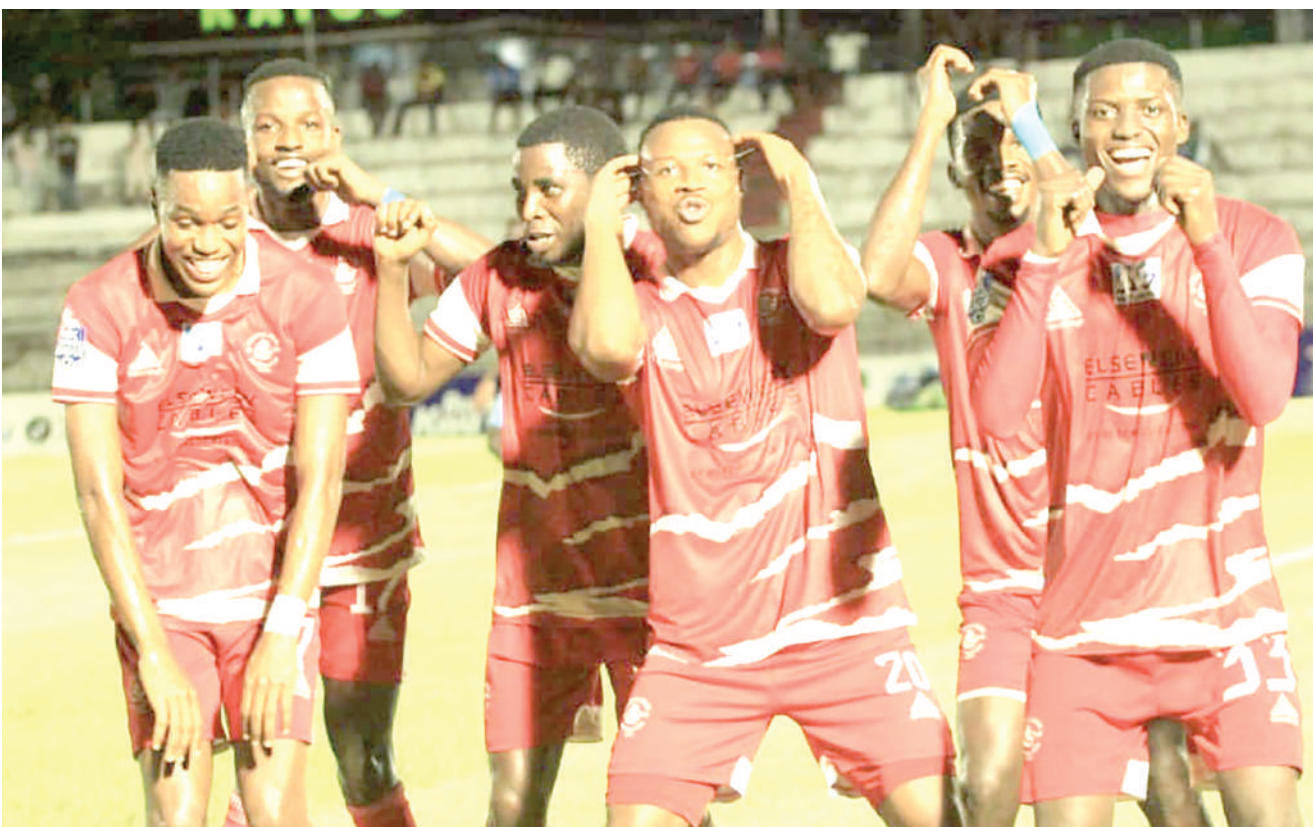
Wachezaji wa Coastal Union wakishangilia baada ya kupata bao katika mechi ya Ligi Kuu Tanzania Bara dhidi ya Ihefu SC iliyochezwa kwenye Uwanja wa CCM Mkwakwani jijini, Tanga juzi. Coastal ilishinda bao 1-0.