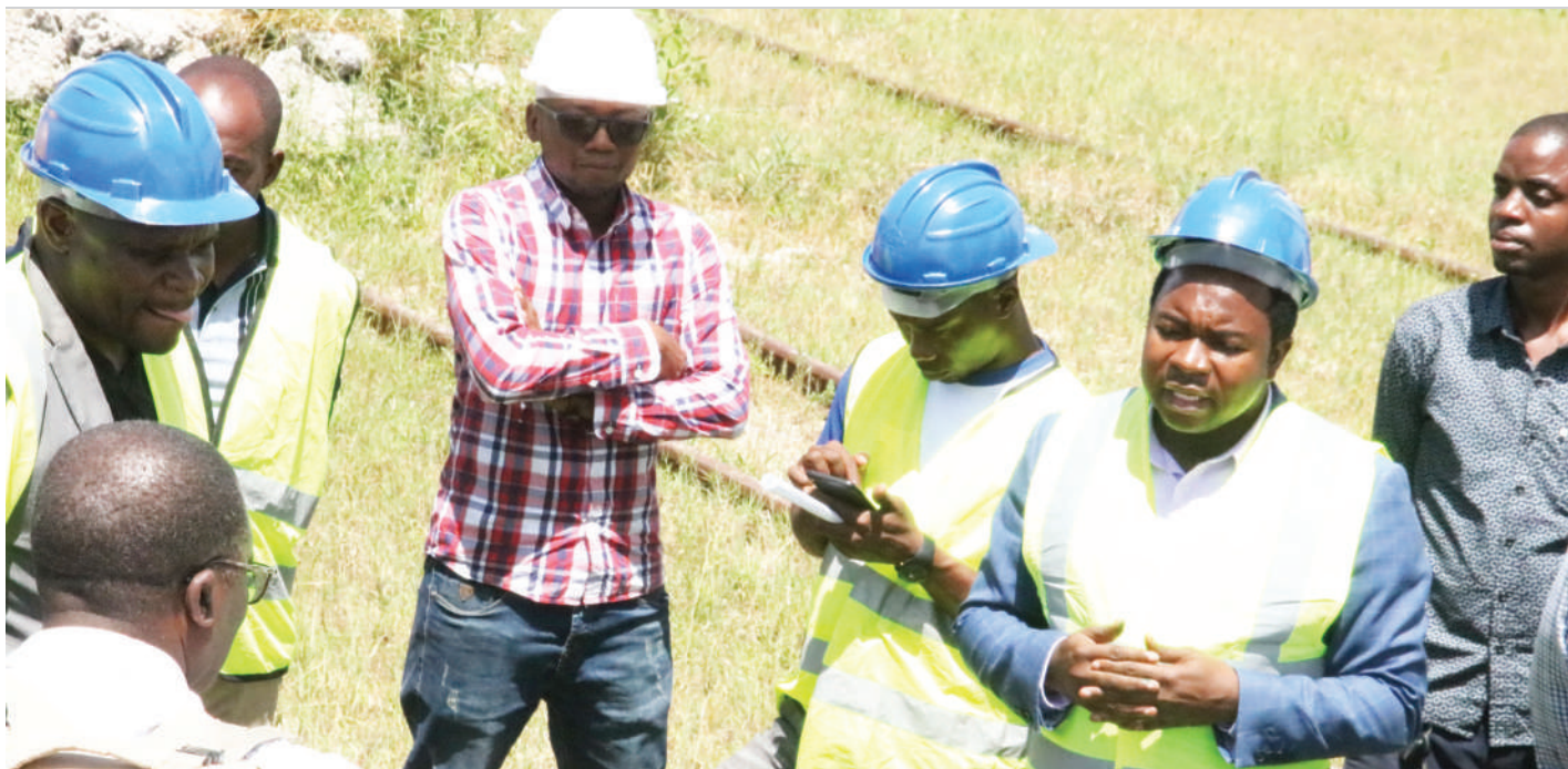
Naibu Waziri wa Ujenzi na Uchukuzi, Atupele Mwakibete (wa pili kulia) akisikiliza maelezo ya utengenezaji wa mataluma kutoka kwa maafisa wa Shirika la Reli ya Tanzania na Zambia (TAZARA) alipofanya ziara kwenye Kiwanda cha Shirika hilo cha Kongolo Mswiswi katika Wilaya ya Mbarali mkoani Mbeya juzi.

Vilevile alibaini kuwa hakuna uhusiano mzuri kati ya kiwanda hicho na wananchi wa vijiji vina-vyozunguka ambapo Mwenyekiti wa Kijiji, Ofisa mtendaji na Diwani walidai kuwa kiwanda hicho hakivasaidii kwenye shughuli za maendeleo.