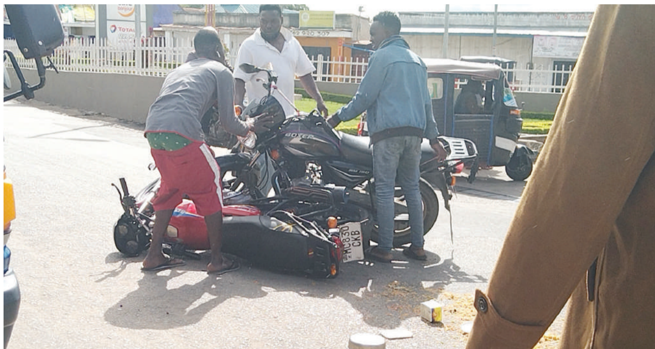
Wasamaria wema mjini Iringa wakisaidia kutenganisha bodaboda zilizogongana jana eneo la Eso Miyonboni, mjini Iringa wakati mmoja akiingia barabara kuu ya Iringa-Dodoma bila tahadhari na kugongana na nyingine iliyokuwa ikikimbiza pilau la Pasaka kwa mteja.

Hata hivyo, CAG anasema baada ya muda wa bodi ya wakurugenzi ya mamlaka kuisha mnamo Novemba 2020, na baada ya NCAA kubadilishwa kuwa taasisi ya kijeshi, alibaini kuwa muundo wa usimamizi wa mamlaka bado haujafafanuliwa na haupo wazi.