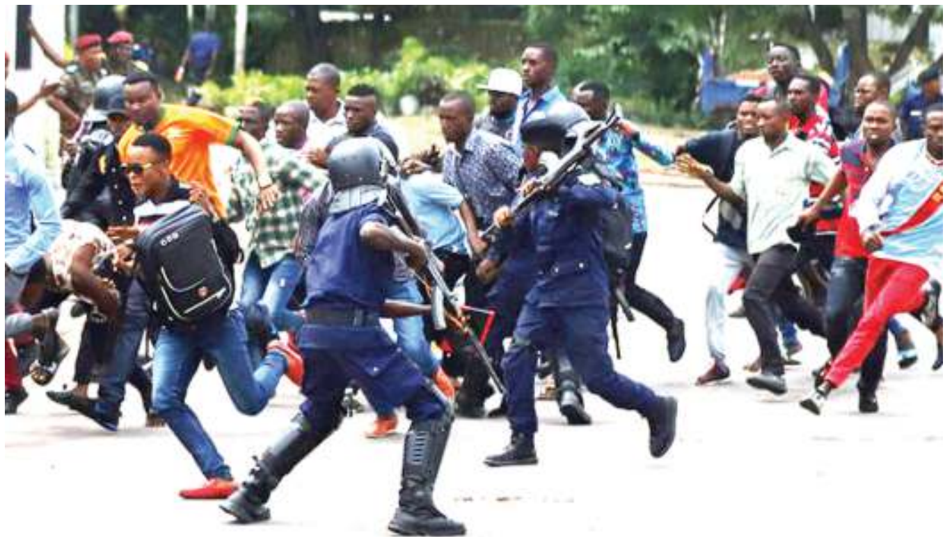
Polisi katika Mji Mkuu wa Kinshasa nchini Jamuhuri ya Kidemokrasia ya Congo wakiwatawanya wanachama wa upinzani waliokuwa wakifanya maandamano.