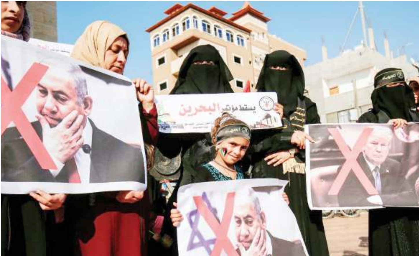
Baadhi ya waandamanaji waliokuwa wakipinga mkutano wa kiuchumi kuhusu Palestina ulioratibiwa na Mshauri wa Rais Donald Trump aliye pia ni mkwewe ambao ulifanyika Bahrain.