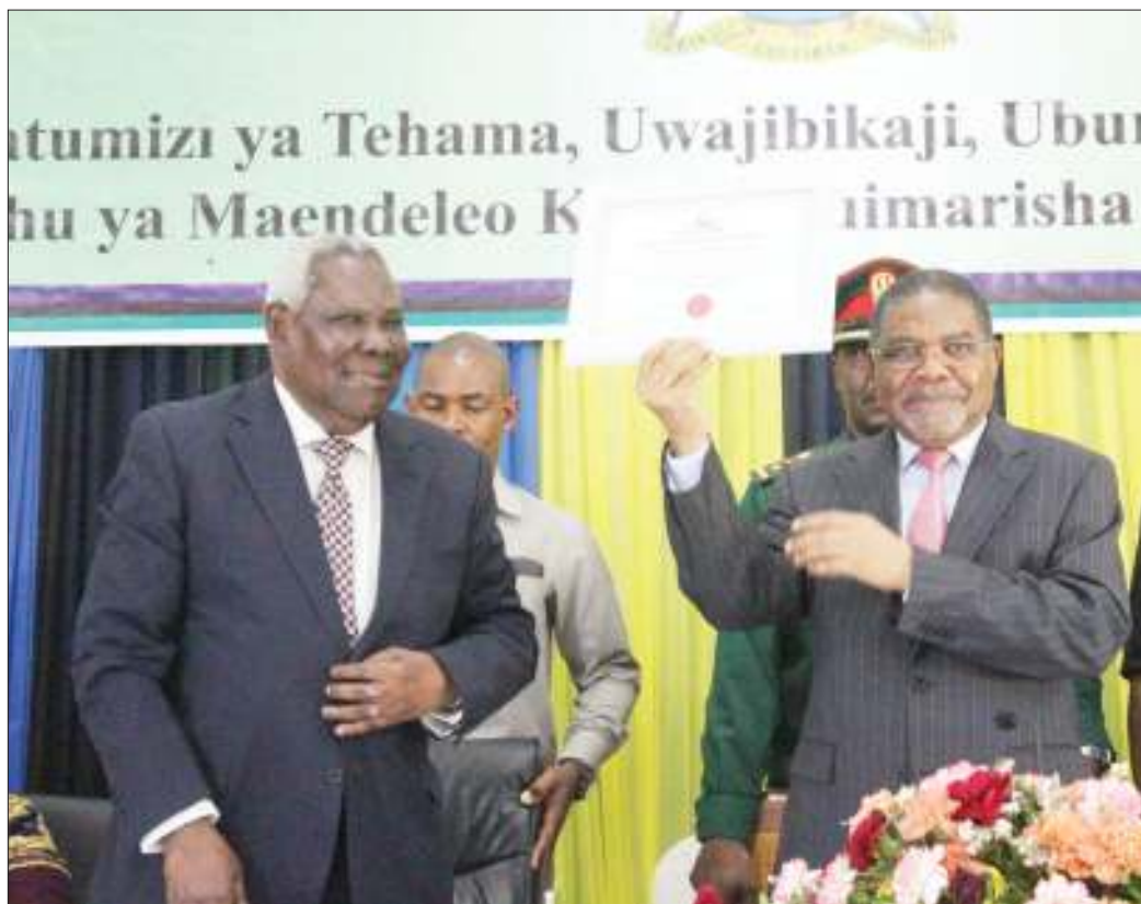
Rais wa Zanzibar na Mwenyekiti wa Baraza la Mapinduzi, Dk. Ali Mohamed Shein, akionyesha cheti baada ya kukabidhiwa na Makamu wa Pili wa Rais wa Zanzibar Balozi Seif Ali Iddi, wakati wa hafla ya maadhimisho ya Siku ya Utumishi wa Umma iliyofanyika Kikwajuni Zanzibar jana.