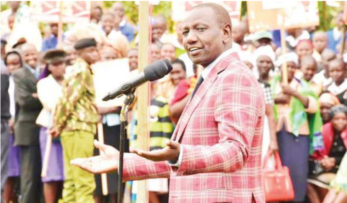
Naibu Rais wa Kenya, William Ruto.