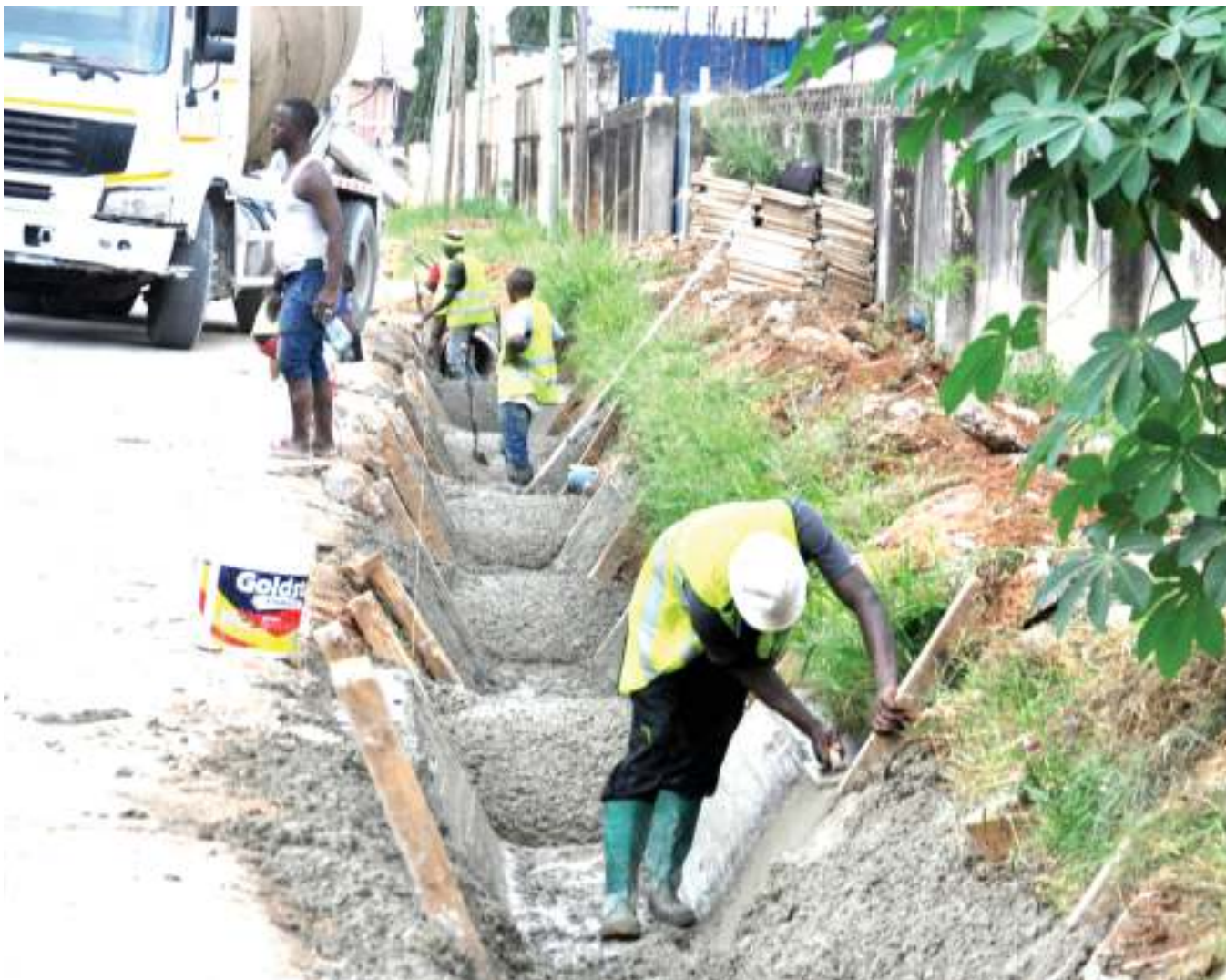
Mafundi wakiendelea na ujenzi wa mifereji ya maji ya mvua kama sehemu ya ukarabati wa Barabara ya Siwa, eneo la Viwandani, Mikocheni, jijini Dar es Salaam jana.

Kwa sasa tenga moja la nyanya huuzwa kwa Sh. 50,000, lakini bado changamoto ya mitaji na ugonjwa wa Kantangaze ambao hushambulia zaidi nyanya, imeonekana kukwamisha juhudi za wakulima wengi.