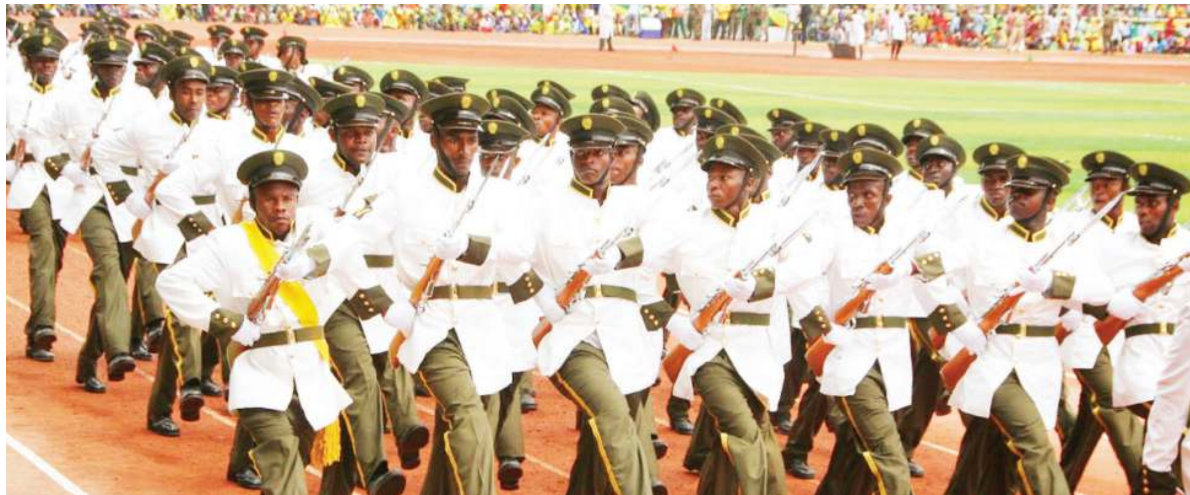
Sehemu ya Gwaride la kusherehekea kumbukumbu ya Siku ya Muungano wa Tanganyika na Zanzibar.