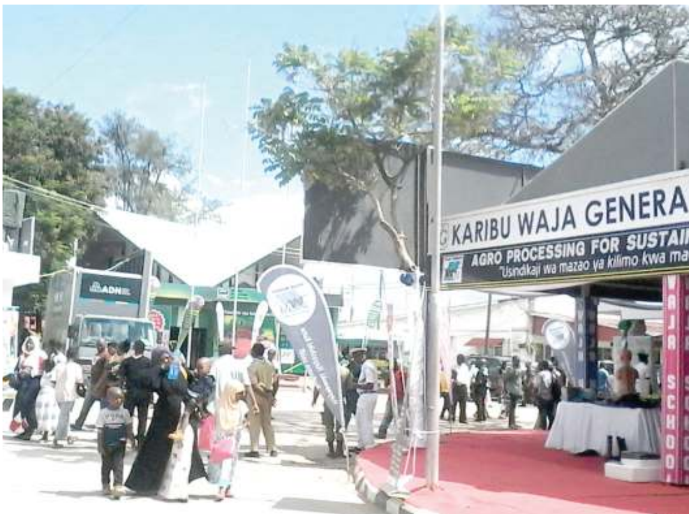
Wananchi wakiingia katika Maonyesho ya 43 ya Biashara ya Kimataifa kwenye Uwanja wa Mwalimu Nyerere, Barabara ya Kilwa, jijini Dar es Salaam jana.

Pia, alisema kuna aina mbili za wosia ambazo ni wosia wa maandishi na matamshi.