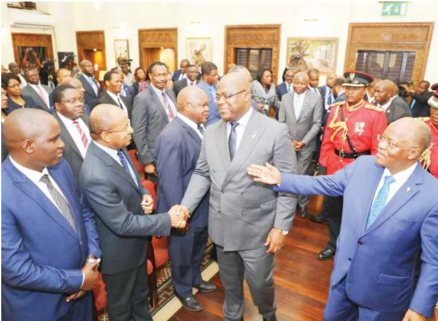
Rais John Magufuli (kulia), akimtambulisha Rais Felix Tshisekedi wa DRC kwa maafisa waandamizi wa Serikali alipofanya ziara nchini.