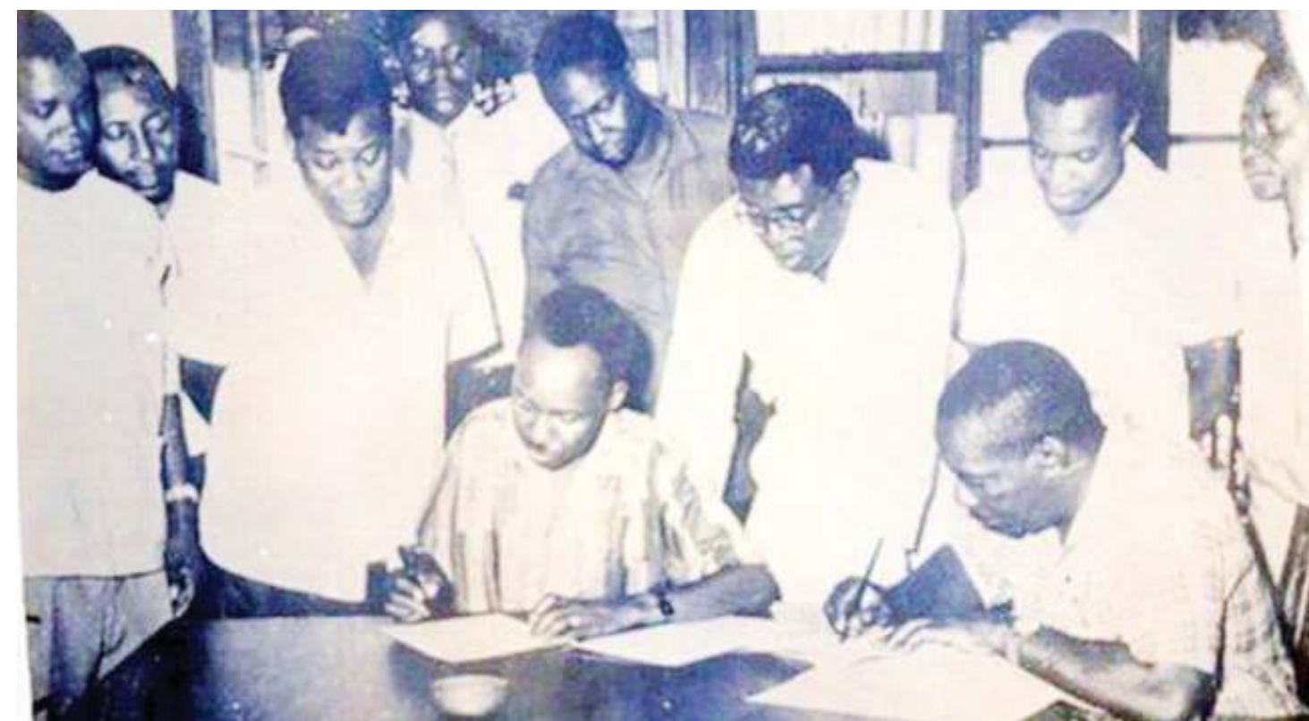
Baba wa Taifa, Mwalimu Julius Nyerere (aliyekaa kushoto), akitia saina Makubaliano ya Mkataba wa Muungano wa Tanganyika na Zanzibar na Rais wa kwanza wa Zanzibar, Abeid Amani Karume (aliyekaa kulia).