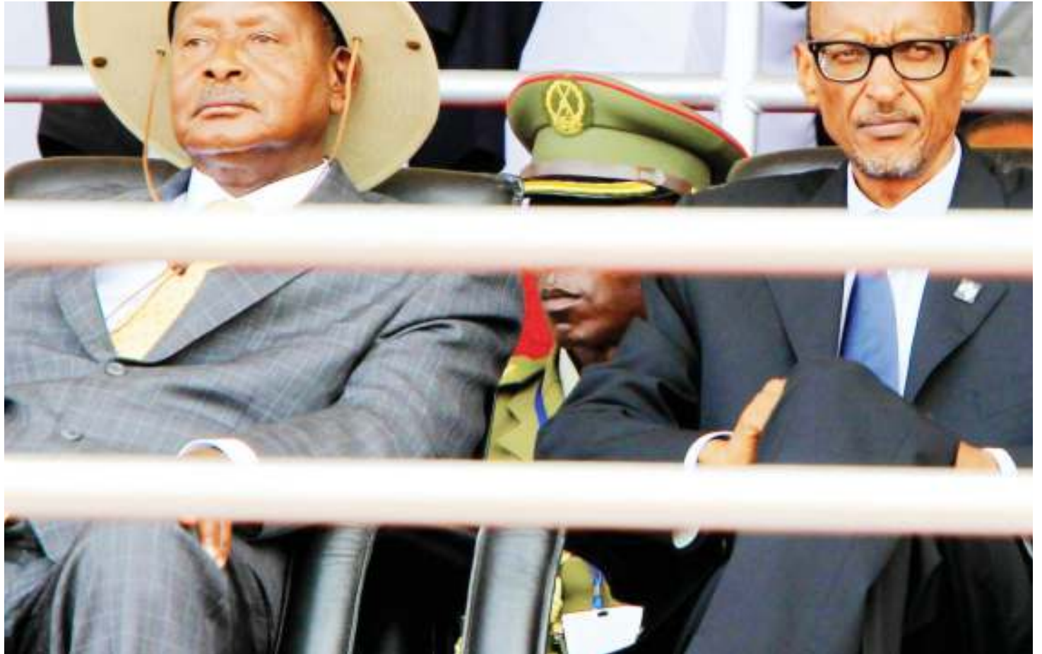
Rais Yoweri Museveni wa Uganda (kushoto) akiwa na Rais Paul Kagame wa Rwanda.