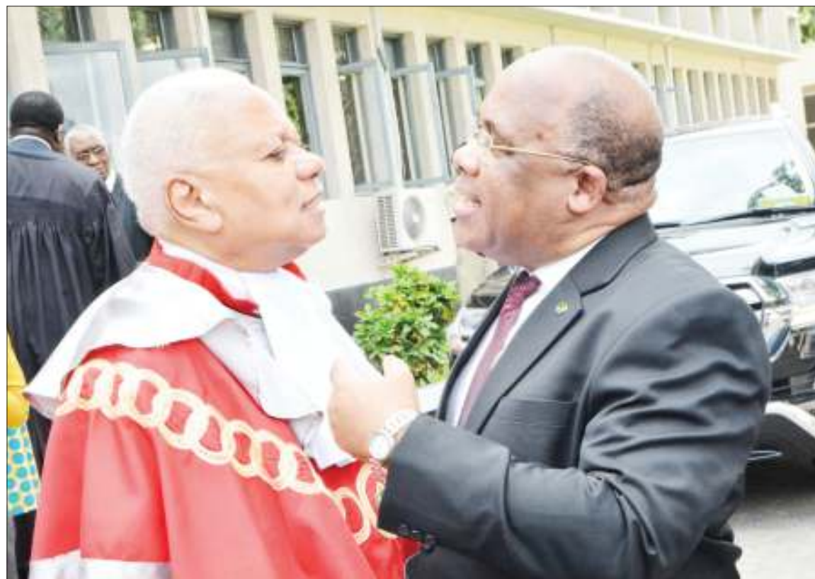
Katibu Mkuu Kiongozi, Balozzi John Kijazi (kulia), akiagana na Jaji Mkuu mstaafu Mohamed Chande Othman, baada ya hafla fupi ya kumuaga, iliyo-fanyika katika Mahakama Kuu ya Tanzania Kanda ya Dar es Salaam jana.