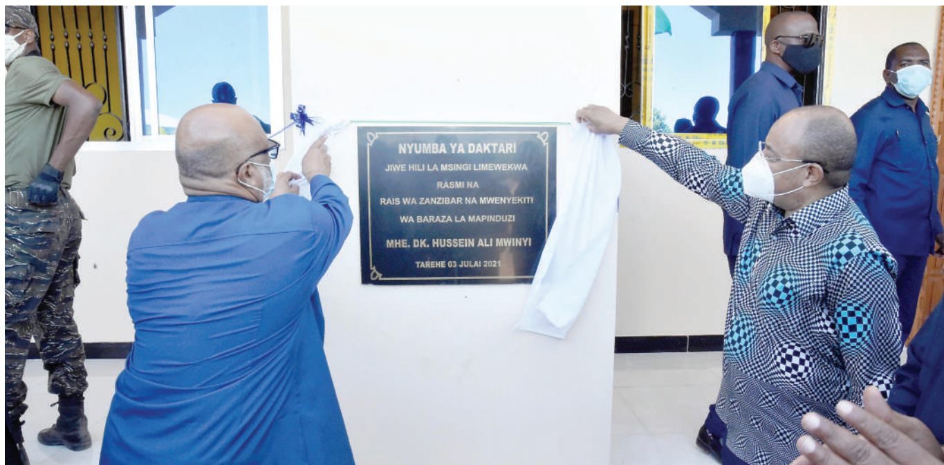
Rais wa Zanzibar, Dk. Hussein Ali Mwinyi, akifunua kitambaa na Waziri wa Afya Ustawi wa Jamii, Wazee, Jinsia na Watoto Zanzibar, Nassor Ahmed Mazrui, kuashiria uwekaji wa jiwe la msingi la ufunguzi wa nyumba ya daktari Kizimkazi Mkoa wa Kusini Unguja katika ziara yake.