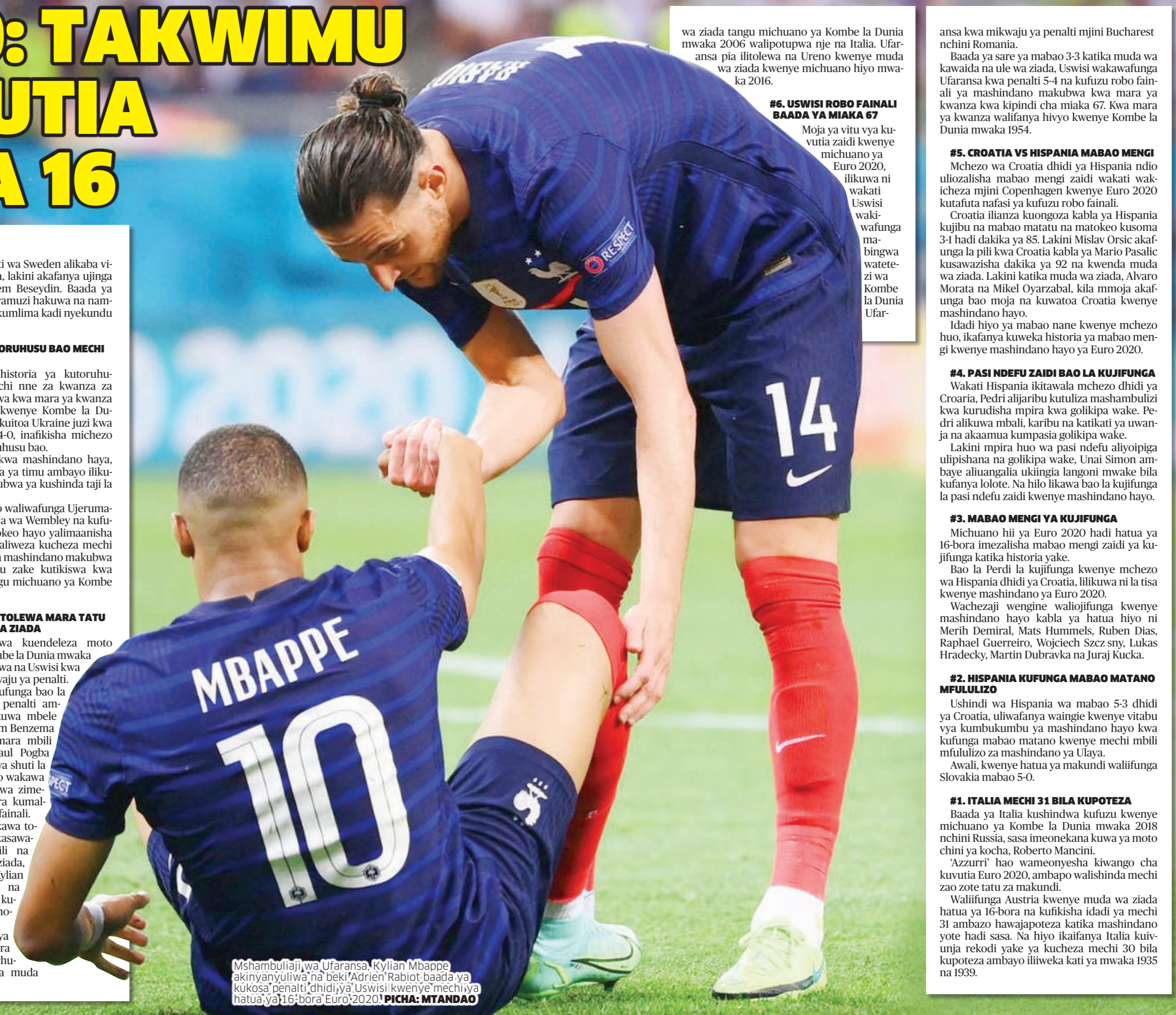
Mshambuliaji wa Ufaransa, Kylian Mbappe akinyanyuliwa na beki Adrien Rabiot baada ya kukosa penalti dhidi ya Uswisi kwenye mechi ya hatua ya 16-bora Euro 2020!

Hiyo ikawafanya kutolewa kwa mara ya tatu kwenye michuano mikubwa katika muda