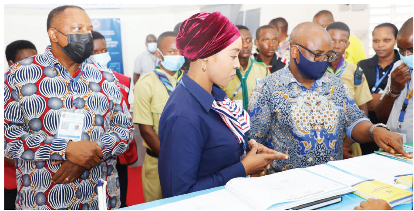
Waziri wa Viwanda na Biashara, Prof. Kitila Mkumbo (katikati), akiangalia vipeperushi mbalimbali kuhusu huduma zinazotolewa na Bodi ya Wataalamu wa Ununuzi na Ugavi (PSPTB) katika Maonyesho ya 45 ya Biashara ya Kimataifa (Sabasaba), jijini Dar es Salaam.

"Kwa hiyo tunapofunga mishipa ya damu inarahisisha upasuaji kwa njia ya usalama zaidi."