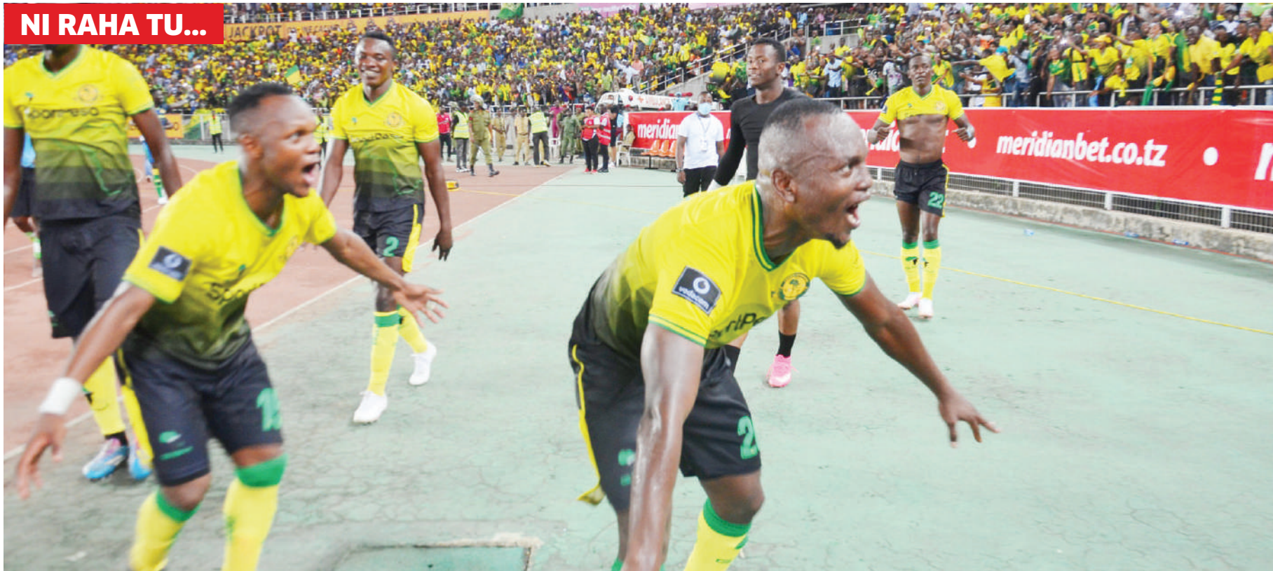
Wachezaji wa Yanga wakishangilia baada ya kumalizika mechi ya Ligi Kuu Bara dhidi ya Simba na timu yao kuibuka na ushindi wa bao 1-0 katika Uwanja wa Benjamin Mkapa juzi.