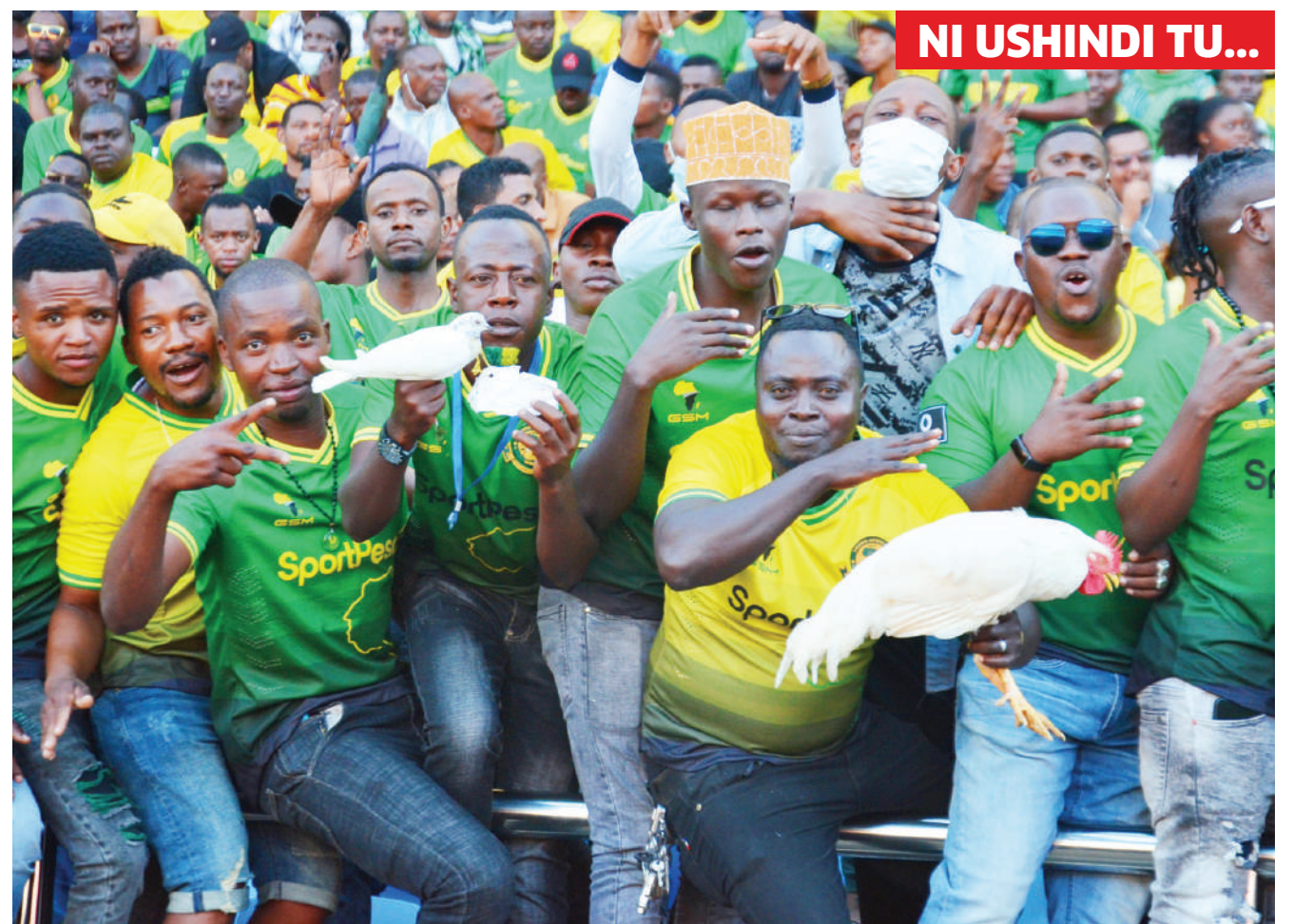
NI USHINDI TU...