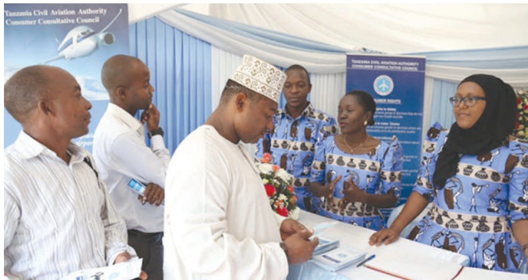
Watumishi wa Baraza la Ushauri la Watumiaji Huduma za Usafiri wa Anga (TCAA-CCC) wakitoa huduma kwa wageni mbalimbali waliotembelea banda lao.

Tunawakaribisha sana katika Ofisi za Baraza zilizo katika majengo ya Wakala wa Ujenzi Tanzania (TBA) mkabala na Ubalozzi wa Ufaransa, Barabara ya Ali Hassan Mwinyi, Kinondoni, Dar es Salaam.