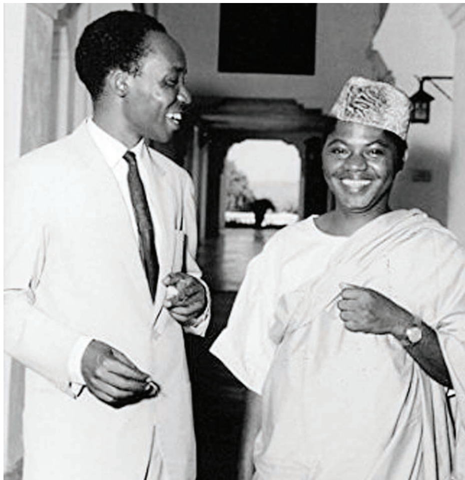
Rais Julius Nyerere, alipokuwa na Rashid Kawawa.