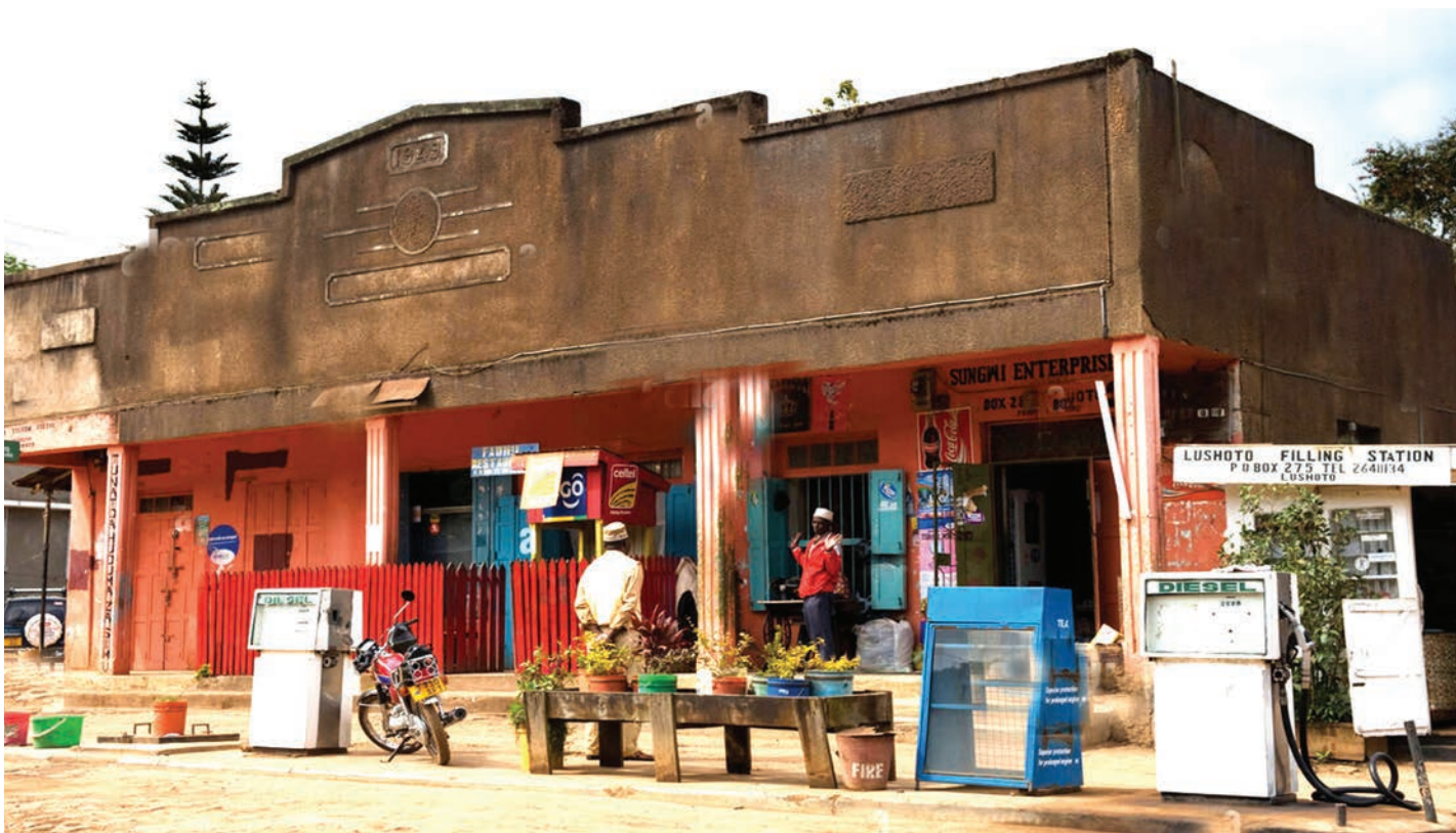
Baadhi ya vituo vya mafuta katika miji midogo, jirani na vijijini.