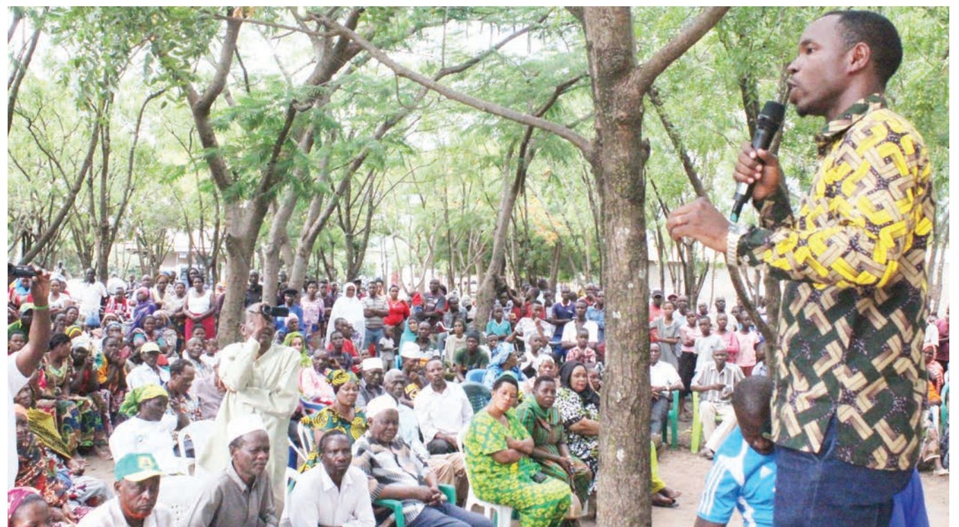
Mbunge wa Jimbo la Shinyanga Mjini, Patrobas Katambi, ambaye ni Naibu Waziri Ofisi ya Waziri Mkuu, Kazi, Vijana na Ajira, akizungumza na wananchi wa jimbo hilo, kwenye mkutano wa hadhara kueleza mambo ambayo ameyafanya ndani ya mwaka mmoja wa ubunge wake, ikiwamo katika sekta ya afya, elimu, ujenzi miundombinu ya barabara, madaraja, makalavati, pamoja na kusikiliza kero zao na kuzitafutia ufumbuzi, juzi.

Alisema taasisi hiyo inaundwa na vijana kutoka nchi nzima na kuwa kazi yao kubwa ni kufanya uchambuzi kitaifa na kimataifa, kuisaidia nchi kusonga mbele kimaendeleo na kufanya tathmini ya mambo mbalimbali kwa kuhusisha wataalamu tofauti.