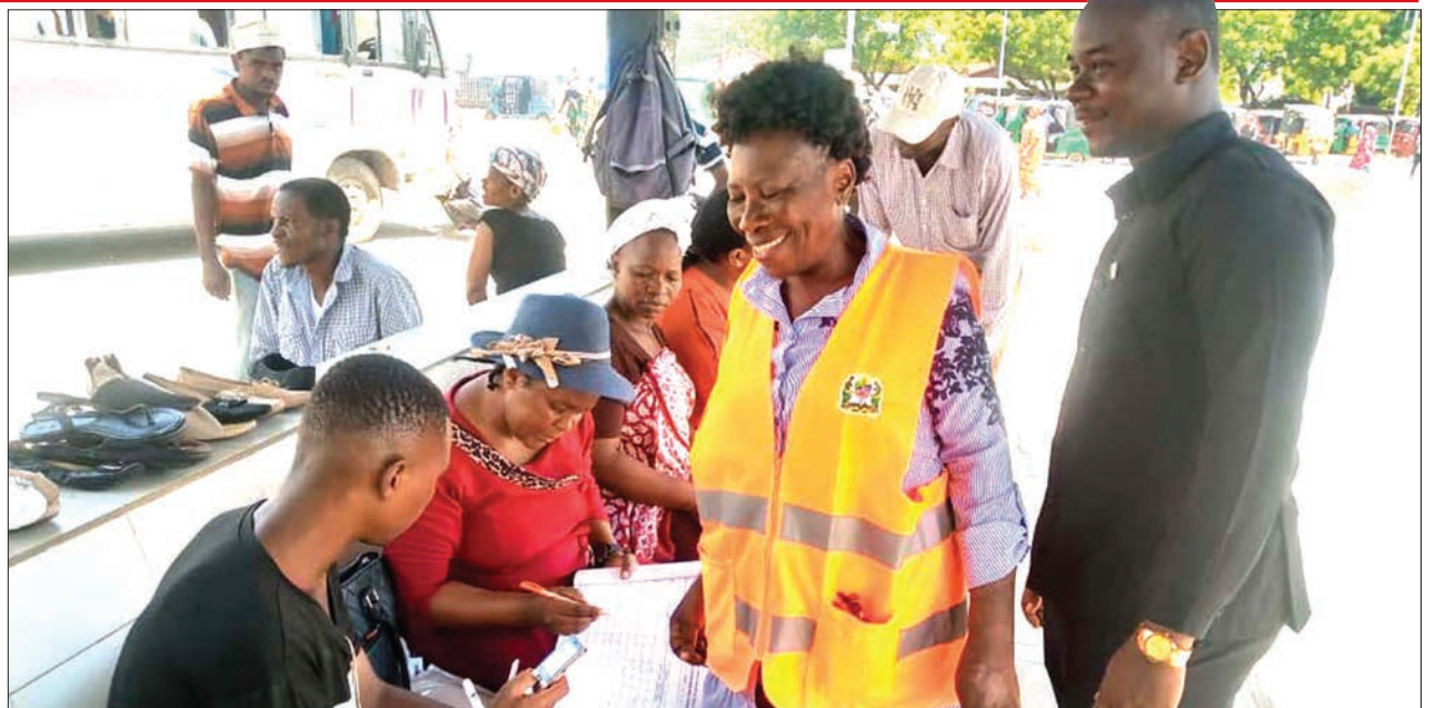
Wakazi wa jijini Dar es Salaam wakijiandikisha ili kupata chanjo ya corona, katika kituo cha daladala cha Feri jana, kwenye kampeni inayohamishwa na Chama cha Kutetea Abiria (CHAKUA), kwa kushirikiana na Idara ya Afya Wilaya ya Ilala.