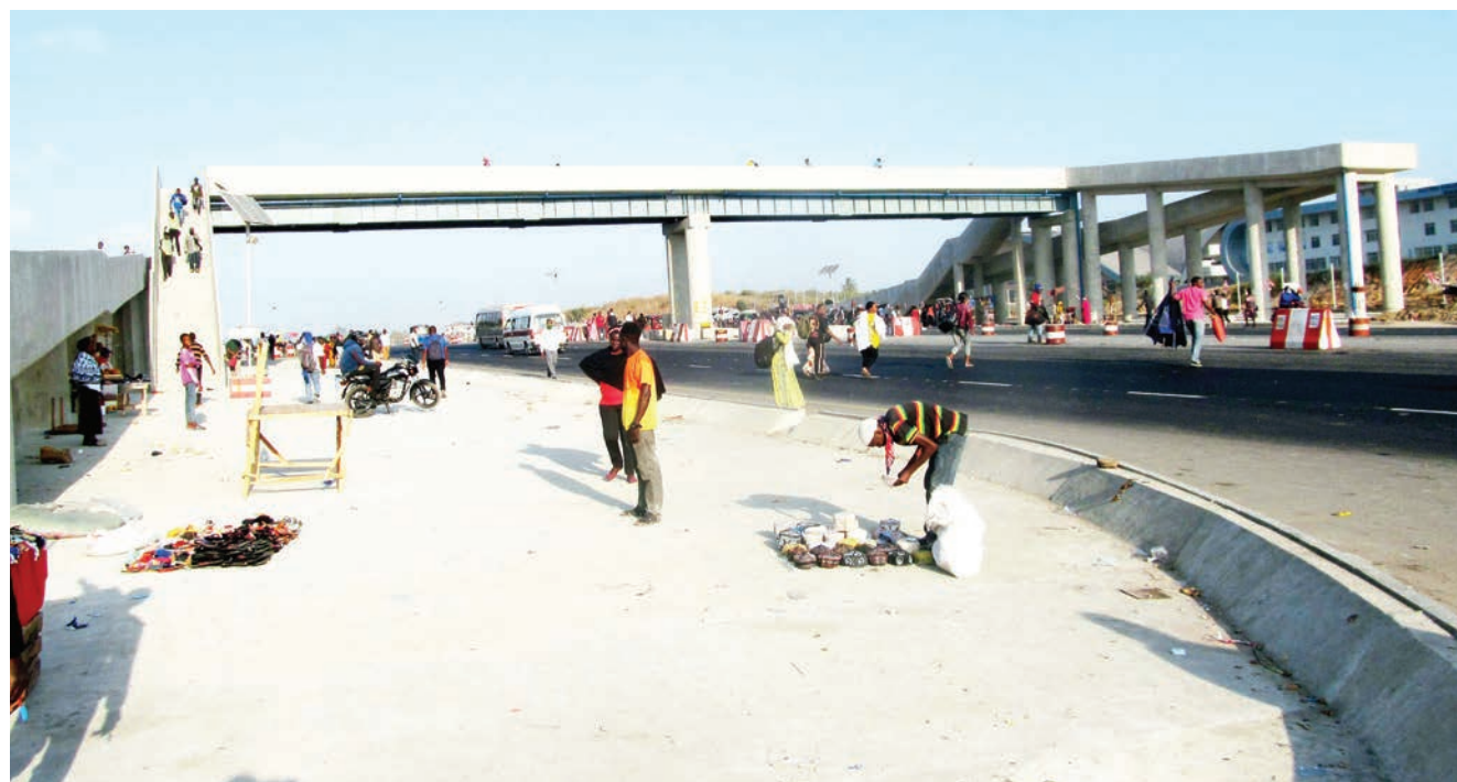
Wafanyabiashara wadogo wakipanga viatu pembeni mwa barabara ya Morogoro, Mbezi Mwisho, Manispaa ya Ubungo Dar es Salaam. Hata hivyo, hawatakiwi kuwapo eneo hilo.