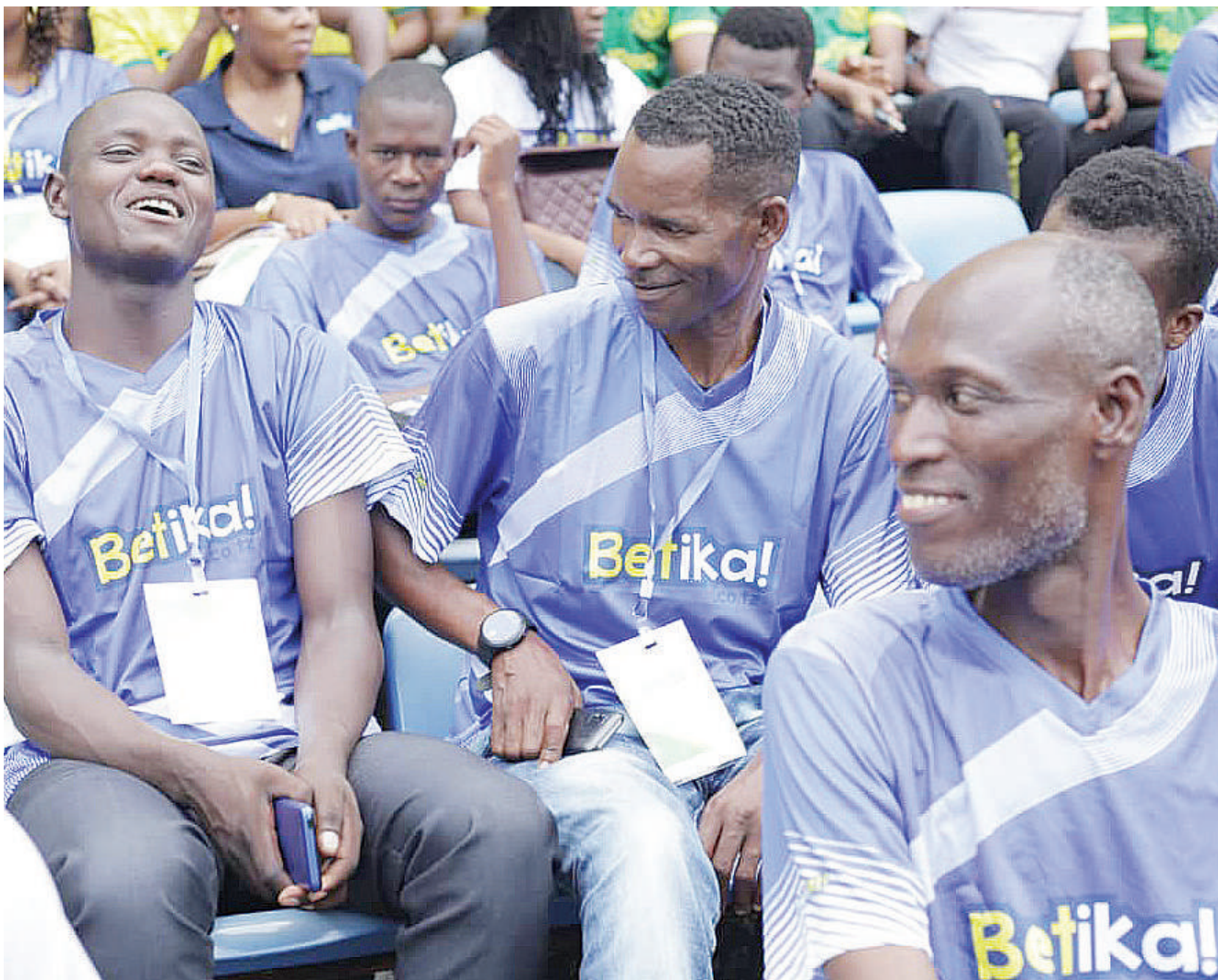
Washindi wa 'Betika Mtoko wa Kibingwa' wakifurahia moja ya matukio kwenye mchezo wa watani wa jadi, Simba na Yanga uliopigwa Uwanja wa Benjamin Mkapa, Dar es Salaam juzi.

Michuano hiyo ambayo itafanyika kwa mara ya kwanza barani Asia, itaanza kutimua vumbi nchini Qatar kuanzia Novemba 21 na kumalizika Desemba 18, mwaka huu ikizishirikisha jumla ya timu 32, ikiyashirikisha mabara sita ambayo yataumana kulisaka kombe hilo ambalo kwa sasa linashikiliwa na Ufaransa ambayo ililitwaa mwaka 2018 nchini Russia.