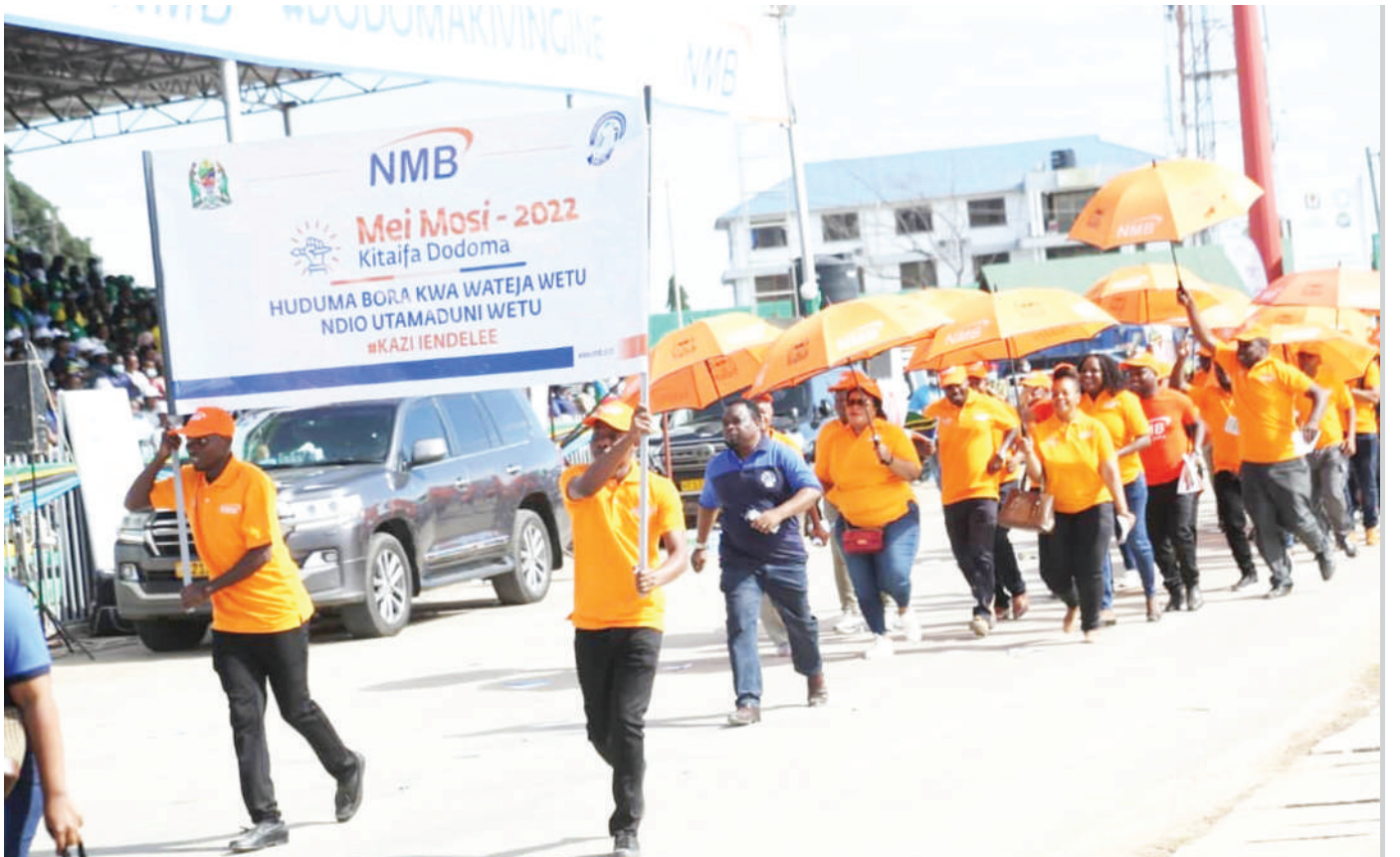
Wafanyakazi wa Benki ya NMB wakipita mbele ya Rais Samia Suluhu na bango lao wakati wa kuadhimisha Siku ya Wafanyakazi Duniani, iliyofanyika kitaifa jijini Dodoma.