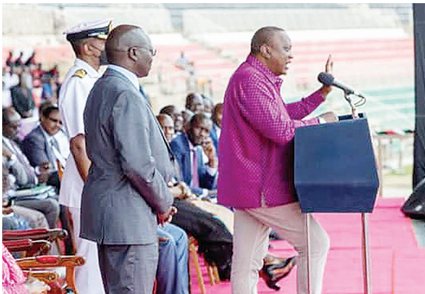
Rais Uhuru Kenyatta akihutubia wakati wa maadhimisho ya sherehe za Siku ya Wafanyakazi Duniani, katika uwanja wa Nyayo, nchini humo, jana.

Filamu ya Hollywood, Hotel Rwanda, ilitengenezwa mwaka wa 2004, na kumshirikisha Don Cheadle kama Rusesabagina.