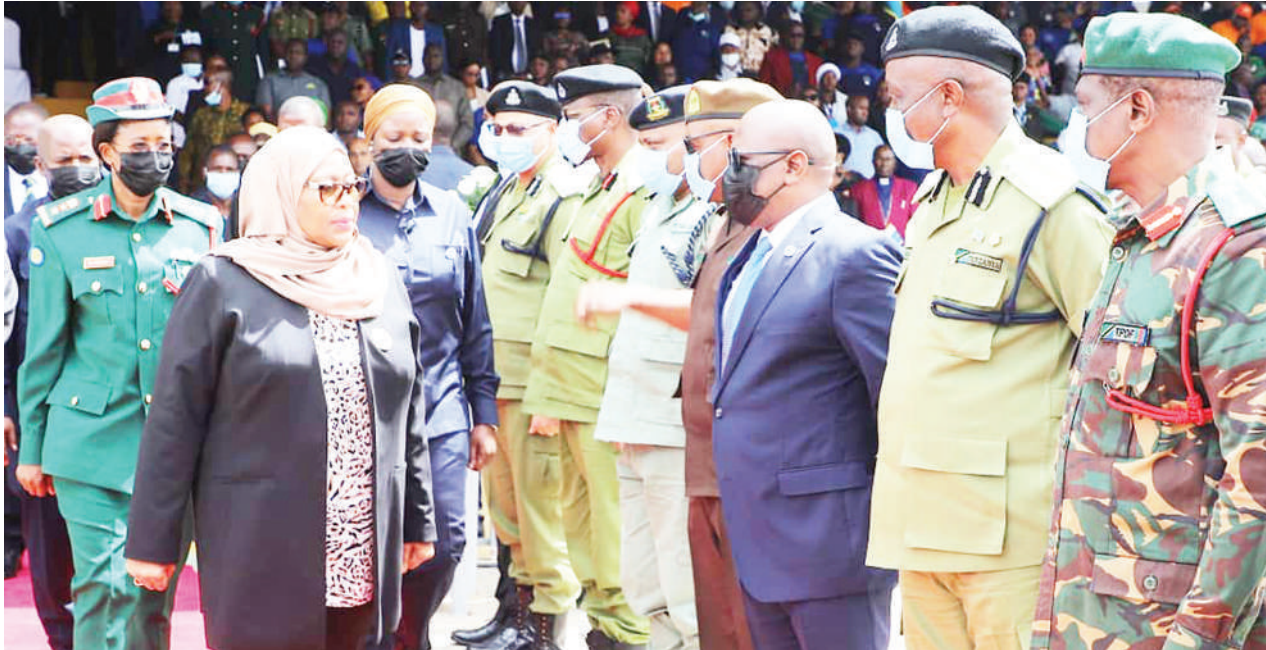
Rais Samia Suluhu Hassan, akisalimiana na vikosi mbalimbali vya ulinzi katika sherehe za Mei Mosi, jana Dodoma.