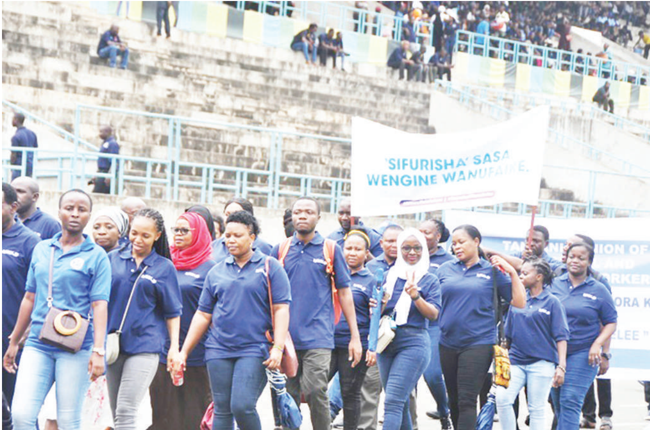
Watumishi wa Bodi ya Mikopo ya Wanafunzi wa Elimu ya Juu (HESLB) katika shamrashamra za Sikukuu ya Wafanyakazi Duniani, Mkoa wa Dar es Salaam, zilifanyika Uwanja wa Uhuru.