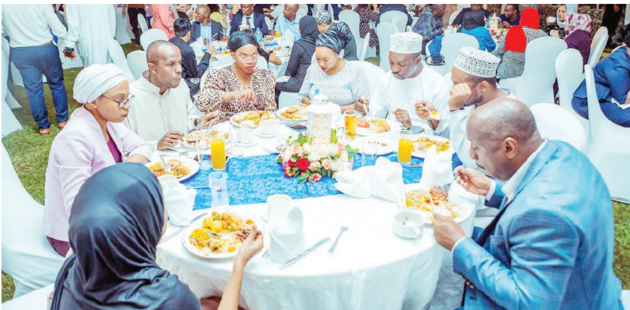
Sehemu ya wageni waalikwa pamoja na wafanyakazi wa Benki ya Exim waliohudhuria hafla ya futari iliyoandaliwa na benki hiyo kwa ajili ya wateja wake jijini Dar es Salaam juzi.