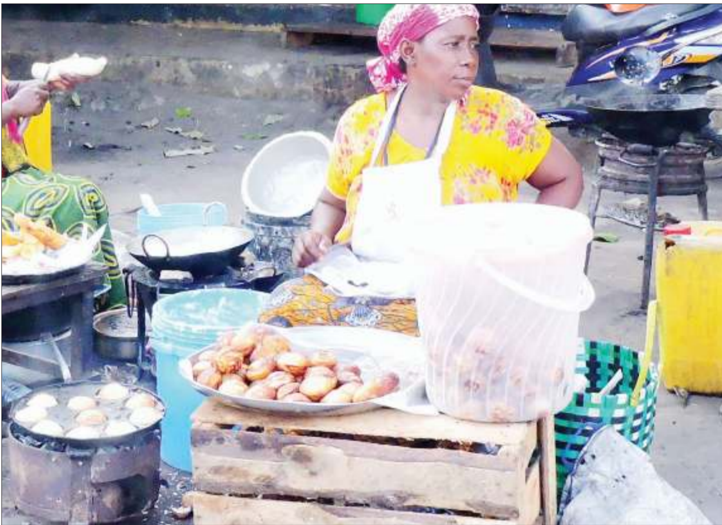
Mjasiriamali akipika vitumbua kwa ajili ya kuuza ili ajipatie riziki, katika eneo la Kigogo Luhanga, jijini Dar es Salaam jana. Hata hivyo, aina hii ya biashara si rafiki kwa afya kwa kuwa inaweza kusababisha magonjwa ya mlipuko kutokana na kutofunika chakula chake.