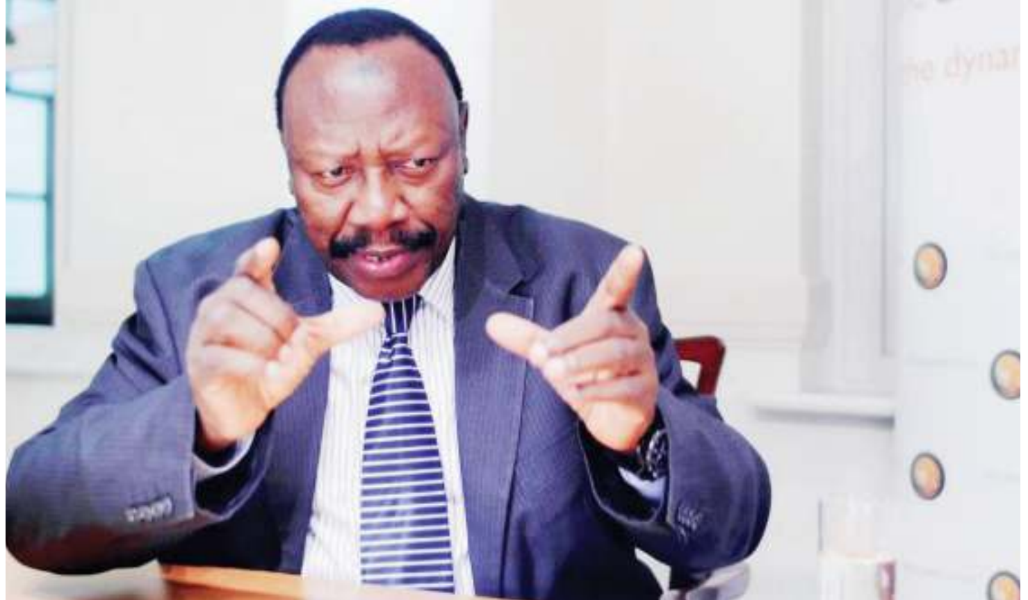
Profesa Ibrahim Lipumba.

Si rahisi kusema kama iliwahi kuelezewa vizuri kujaza watu mapesa hasa ni nini, lakini kimsingi usemi huo ulibakia kichekesho kwa wasiokuwa wafuasi wa UDP aliyoiyasi. Ila katika mazingira ya