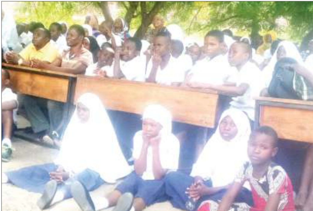
Baadhi ya wanafunzi wa shule ya msingi jijini Dar es Salaam wakiwa kwenye mkutano. Majukwaa kama hayo yatumike kujadili changamoto za wanafunzi.