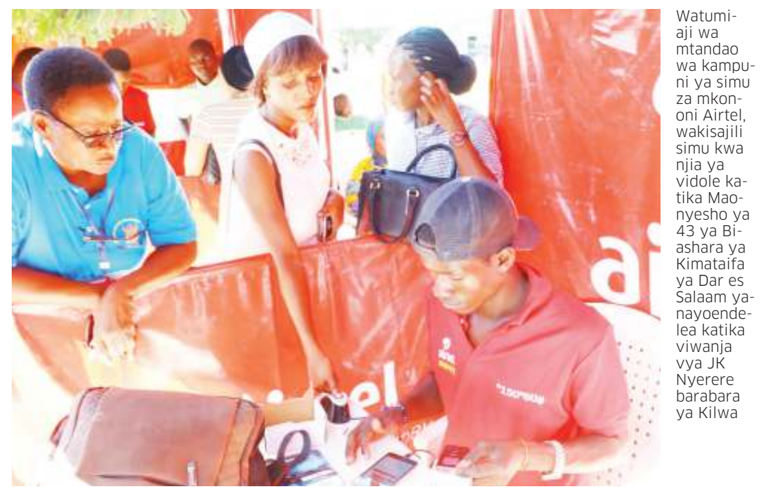
Watumi- aji wa mtandao wa kampu- ni ya simu za mkon- oni Airtel, wakisajili simu kwa njia ya vidole katika Maon- yesho ya 43 ya Bi- ashara ya Kimataifa ya Dar es Salaam ya- nayoende- lea katika viwanja vya JK Nyerere barabara ya Kilwa