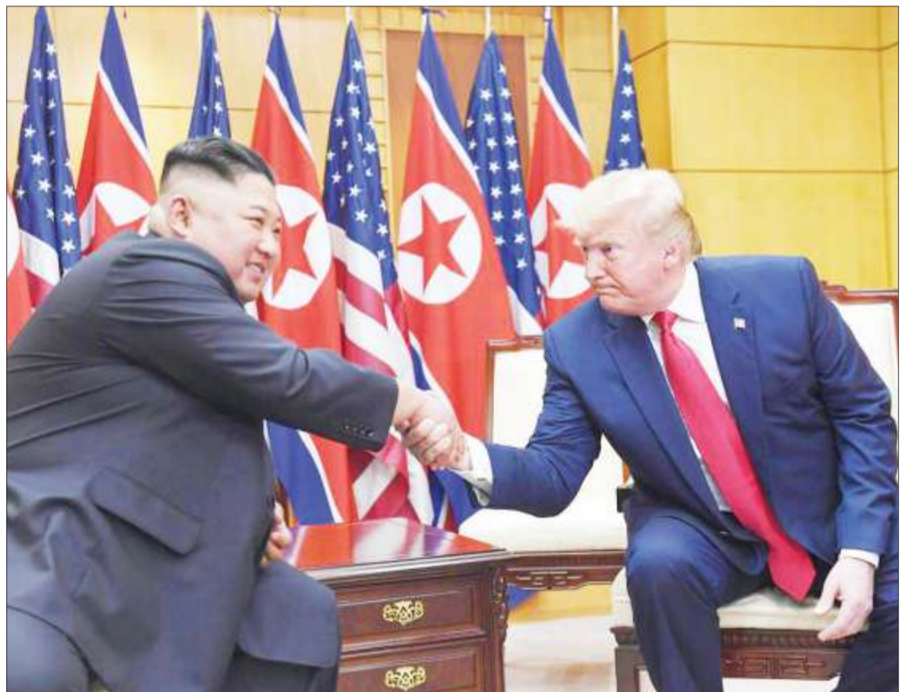
Rais wa Marekani, Donald Trump (kushoto), akipeana mkono na Kiongozi wa Korea Kaskazini, Kim Jong-Un, wakishirika ishara ya amani baina ya nchi zao.

Kwa jumla, watu 346 walipoteza maisha yao kwenye ajali hizo mbili. VOA