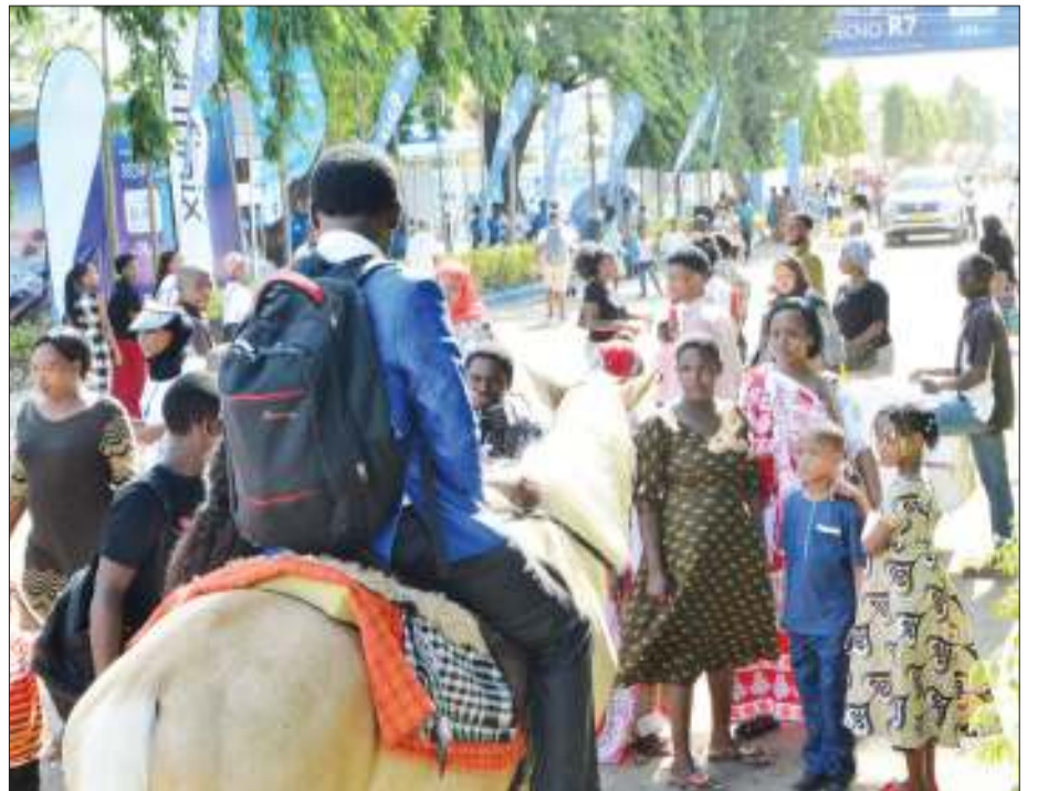
Baadhi ya wakazi wa Jiji la Dar es Salaam wakiangalia farasi kwenye maonyesho hayo.