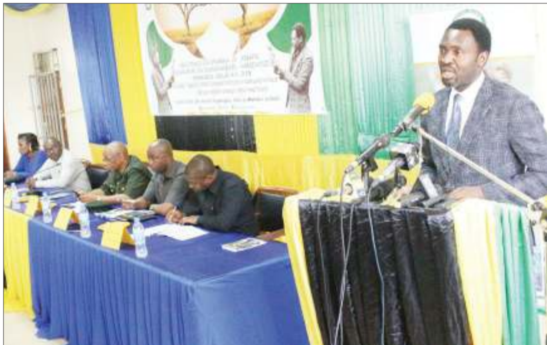
Waziri wa Maliasili na Utalii, Dk. Hamisi Kigwangala, akifungua mkutano wa mwaka wa wahariri na wanahabari waandamizi, ulioandaliwa na Shirika la Hifadhi za Taifa Tanzania (Tanapa), jijini Mwanza jana.

Mwaka 2016, NHC iliondoa vifaa vyote vilivyokuwa vina-vyotumiwa na Kampuni ya Free Media na kufungua vifaa vyote vya muziki kwenye klabu ya Bilicanas kwa maelezo kuwa anadaiwa pango zaidi ya Sh. bilioni 1.7.