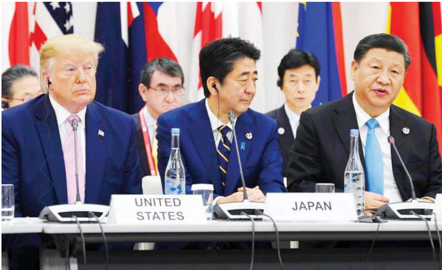
Baadhi ya vigogo wa mataifa yenye uchumi mkubwa duniani Rais Trump wa Marekani, Waziri Mkuu wa Japan Shinzo Abe na Rais wa China Xi Jinping, wakiwa Osaka wiliyopita.

Mkutano wa Osaka ulifanyika wakati Iran ikimaliza muda wa tahadhari kwa Umoja wa Ulaya wa siku 10 kubadili mazingira kuhusu mkataba wa kimataifa wa udhibiti wa nguvu za nuklia nchini Iran, ikiwa ni pamoja na kuondolewa vikwazo vya Marekani iliyojitoka ka-