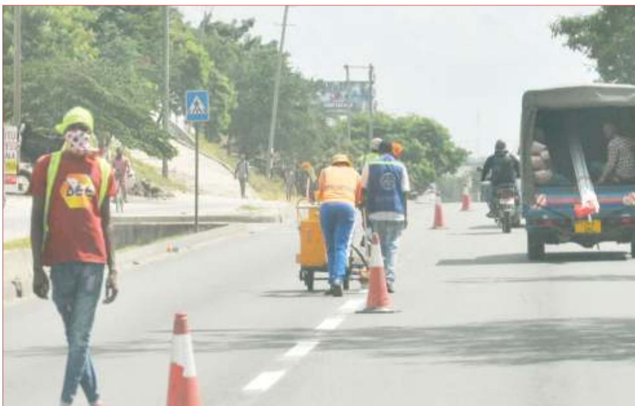
Mafundi wakichora alama ya kutenganisha Barabara ya Mandela, katika eneo la Tabata Matumbi, jijini Dar es Salaam jana.