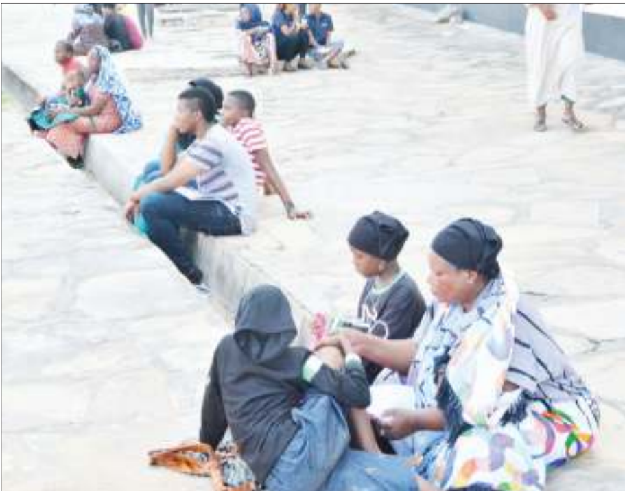
Wakazi wa Jiji la Dar es Salaam wakipumzika baada ya kutembelea maonyesho hayo.