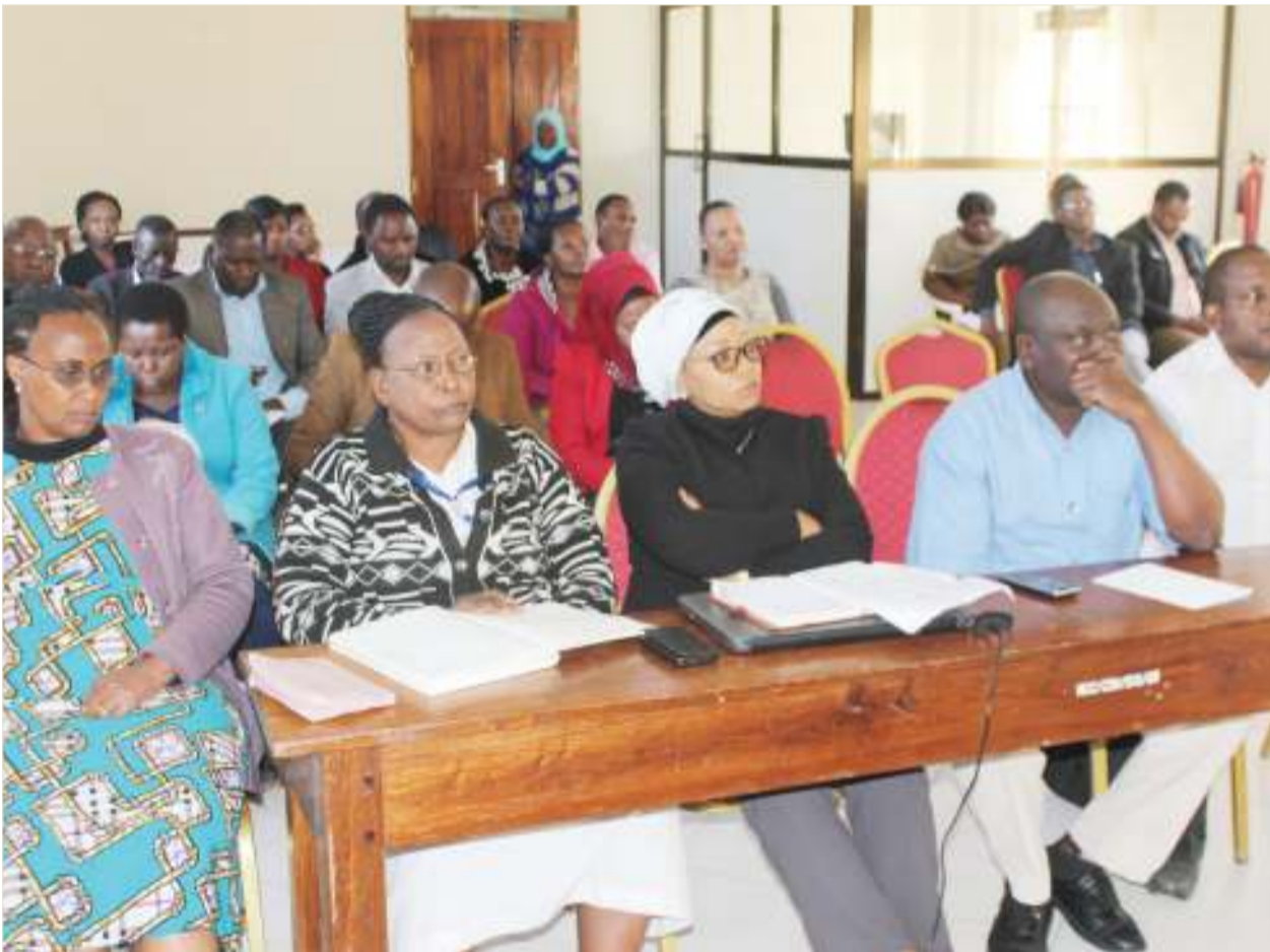
Watumishi wa Halmashauri ya Jiji la Mbeya, kutoka idara mbalimbali wakiwa katika mafunzo ya namna ya kukabiliana na magonjwa ya mlipuko, yaliyotolewa na wataalamu kutoka Hospitali ya Rufani ya Kanda ya Mbeya jana.