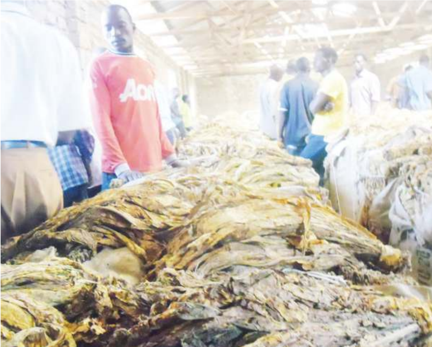
Wakulima wakiuza tumbaku yao kwenye Chama cha Msingi cha Ushirika (AMCOS) wilayani Kahama.