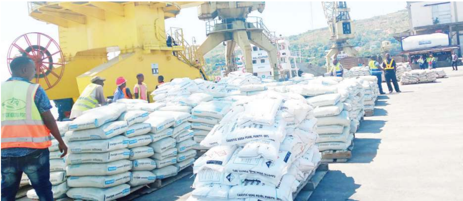
Wafanyakazi wa TPA wakihudumia shehena katika bandari ya Kigoma.