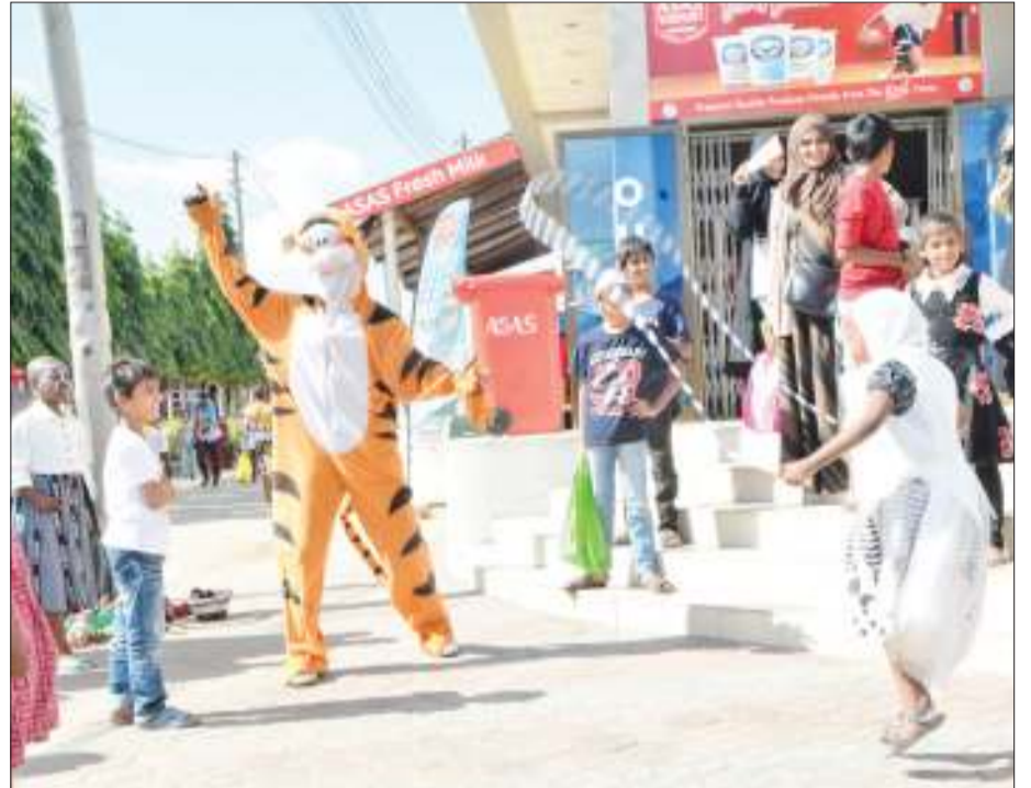
Watoto wakicheza nje ya mabanda ya biashara.