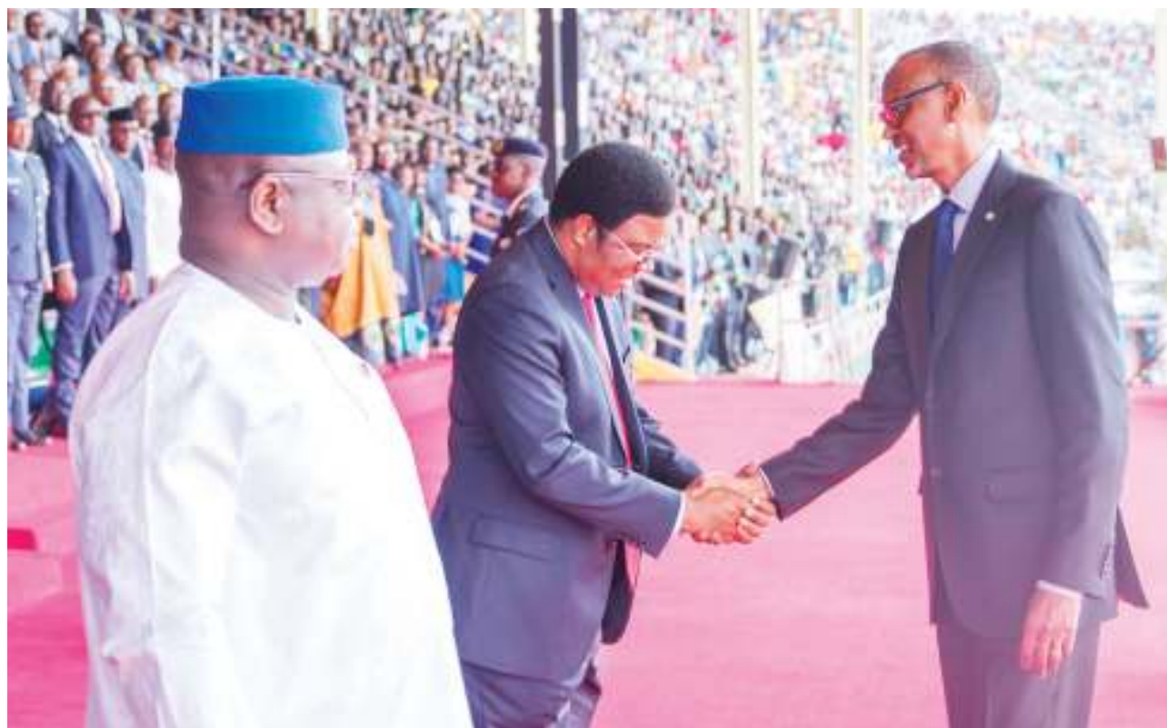
Waziri Mkuu Kassim Majaliwa, akisalimiana na Rais wa Rwanda, Paul Kagame, alipomwakilisha Rais John Magufuli katika sherehe za miaka 25 ya Ukombozi wa nchi hiyo, jijini Kigali jana. Kushoto ni Rais wa Sierra Leone, Julius Maada Bio.

• Mali zake kunadiwa saa 24 zijazo kulipia deni la mamilioni... Uk. 2