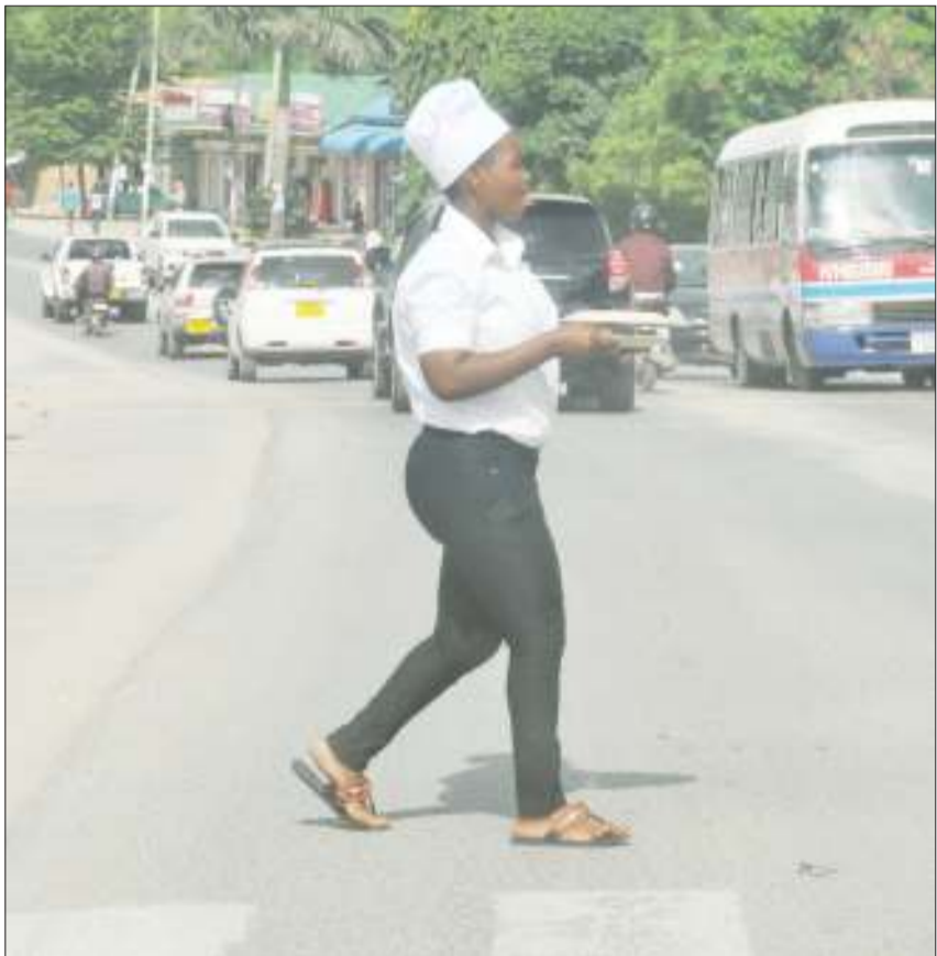
Mamal-ishe akivuka barabara ya Shekilango, wakati akienda kuhudumia wateja wake katika eneo la Sinza Mugabe, jijini Dar es Salaam jana.

Kwa mujibu wa Murilo, Jeshi hilo la Polisi linaendelea kuwahoji watuhumiwa, na mahojiano yatakapokamilika watafikisha mahakamani.