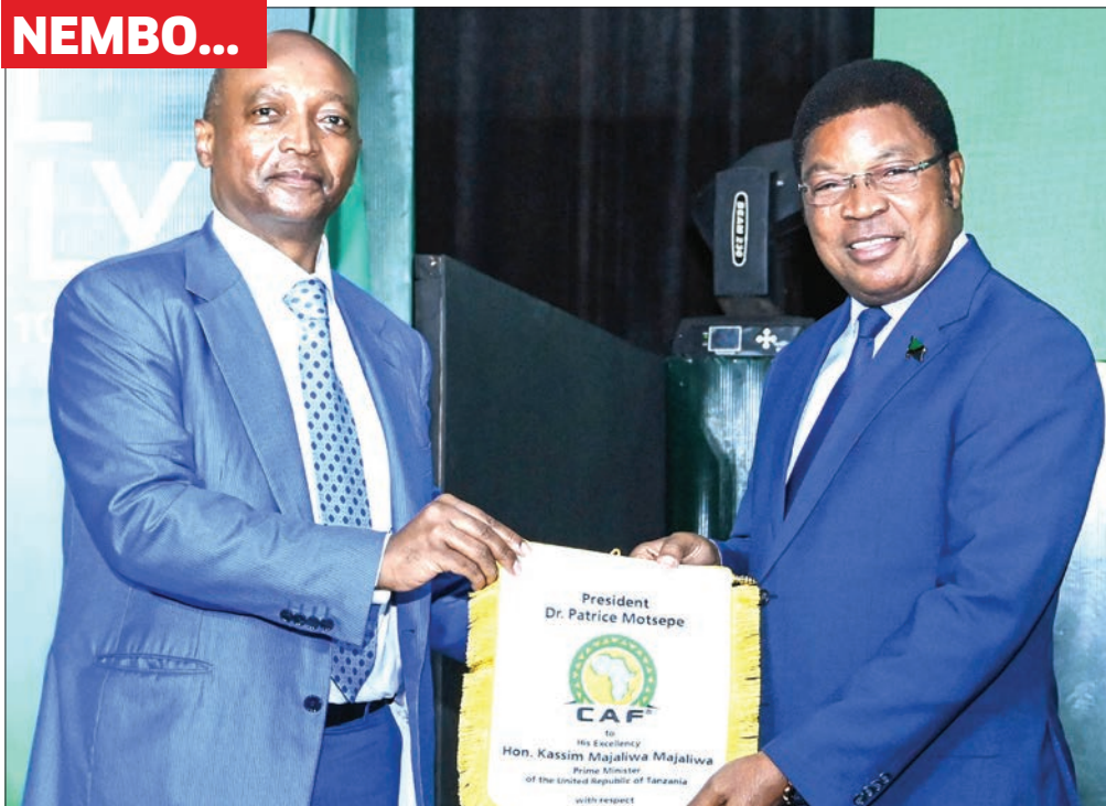
Waziri Mkuu, Kassim Majaliwa, akipokea zawadi ya nembo ya Shirikisho la Mpira wa Miguu barani Afrika (CAF), kutoka kwa Rais wa Shirikisho hilo, Dk. Patrice Motsepe, baada ya kufungua Mkutano Mkuu wa 44 wa CAF kwenye Kituo cha Mikutano cha Kimataifa cha Arusha (AICC) jana.