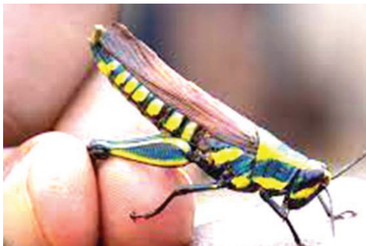
Panzi wa taifa hapatikani kwingine ila Tanzania pekee. bayoanua za kuvutia.

Anawataka watalii kutoka ndani na nje ya kutembelea maeneo yenye misitu na kujionea na kujiburudisha na vivutio vingi zikiwamo