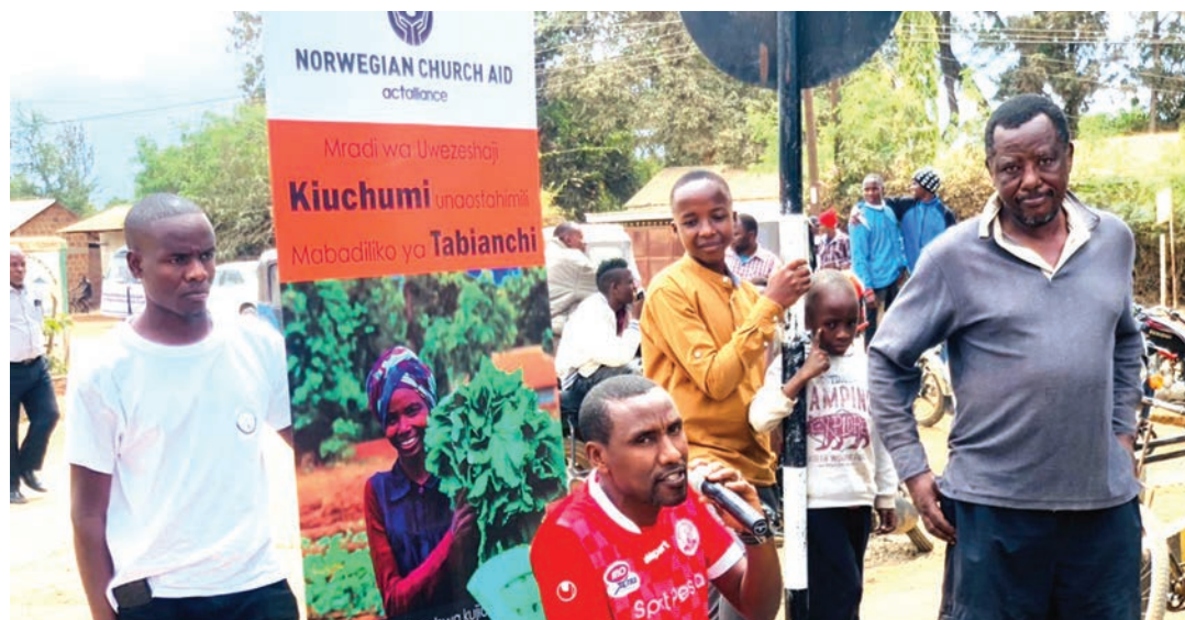
Vijana wa Chekereni wakieleza mambo yanayowakwamisha kilimo biashara.