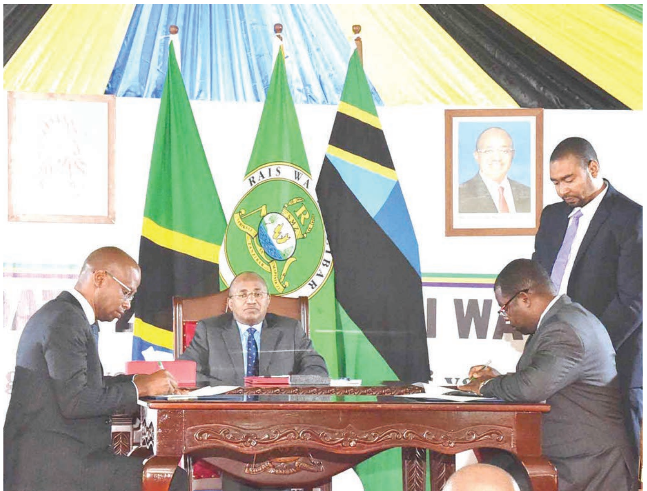
Rais wa Zanzibar, Dk. Hussein Ali Mwinyi (katikati), akishuhudia Waziri wa Uchumi wa Buluu na Uvuvi Zanzibar, Suleiman Masoud Makame (kulia) na Waziri wa Nishati wa Serikali ya Jamhuri ya Muungano wa Tanzania, Januari Makamba, wakitiliana saina na makabidhiano ya data za utafutaji wa mafuta na gesi asilia kwenye vitalu vya Zanzibar, Ikulu Uguja jana.

Alisema miongoni mwa faida za kilimo hicho ni kuwa na uhakika wa soko la bidhaa zinazozalishwa ambapo mbolea za asili zinasaidia kuimarisha ardhi.