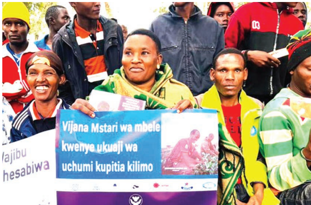
Wana Babati wakishuhudia uzinduzi wa msafara wa vijana uliolenga kuhamasisha kushiriki katika kilimo na kilimo biashara.

“Vijana tupo tayari kujihusisha na kilimo ili tujikwamue kiuchumi lakini changamoto ni nyingi na zipo juu ya uwezo wetu, tunahitaji msaada wa serikali na wadau ili kunufaika na fursa zilizomo kwenye kilimo biashara.”