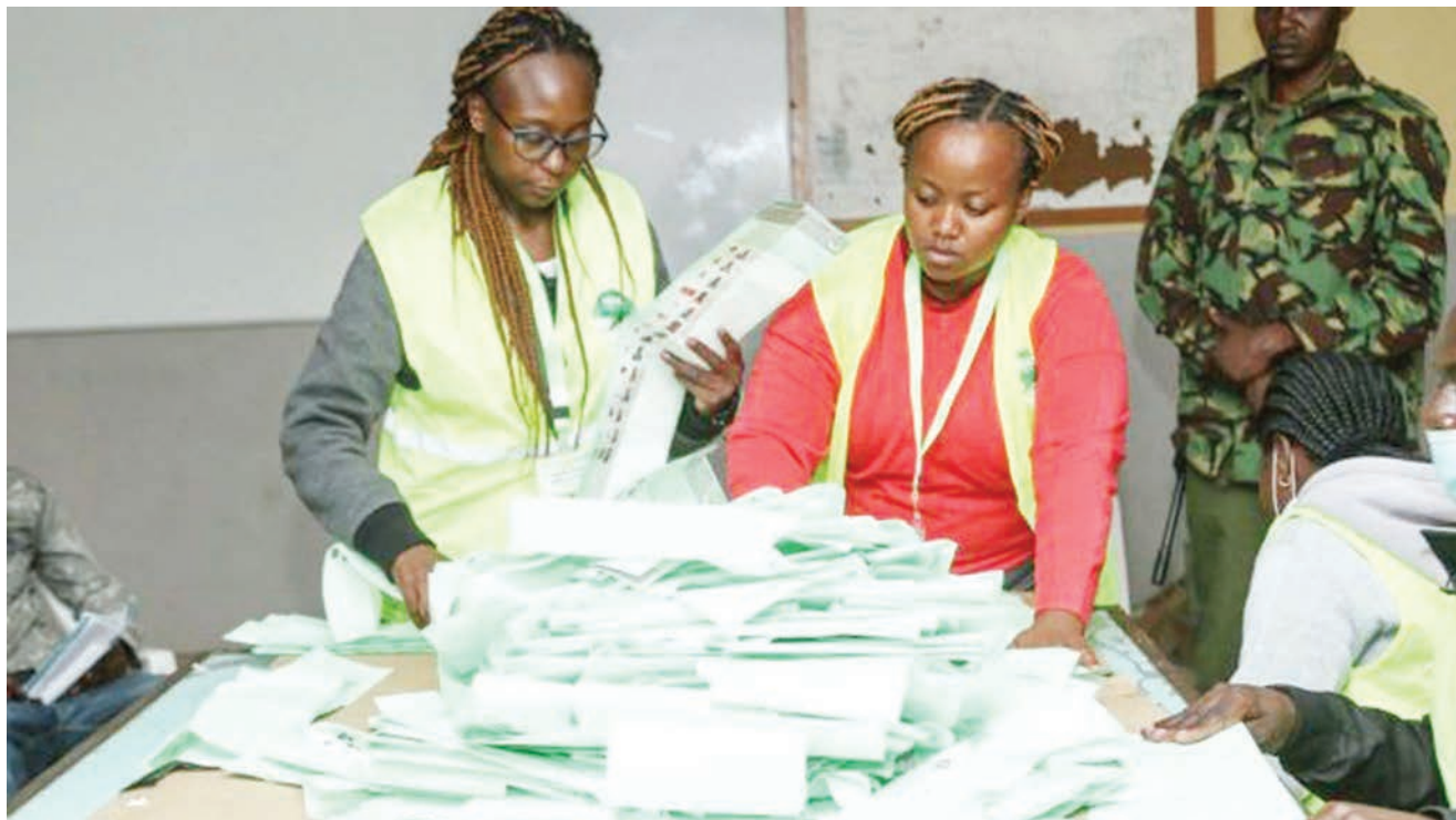
Wafanyakazi wa Tume ya Uchaguzi Kenya wakiendelea na uhesabuji wa kura.

Polisi wa Israel, ilisema katika taarifa yake kuwa maafisa wa usalama waliyazingira makazi ya Ibrahim al-Nabulsi, ambaye wanao alikuwa akitafutwa kwa mfululizo wa mashambulizi ya risasi mapema mwaka huu.