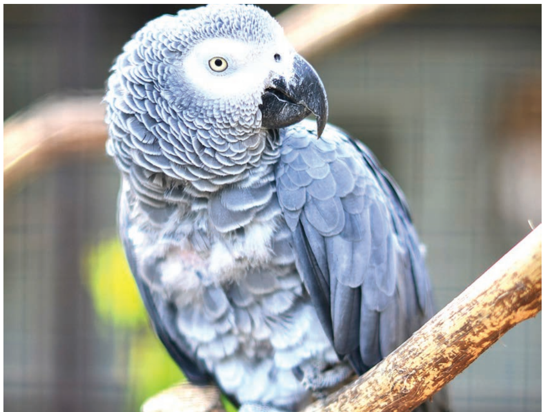
Kasuku hatarini kutoweka.

aina 430 za mialoni (oak) duniani ziko hatarini kutoweka, kulingana na orodha yenye alama nyekundu inayoandaliwa na Muungano wa Kimataifa wa Uhifadhi wa Mazingira (IUCN) wa spishi zilizo hatarini. Na asilimia 41 iko kwenye "wasiwasi wa uhifadhi", hasa kutokana na ukataji miti kwa ajili ya kilimo na