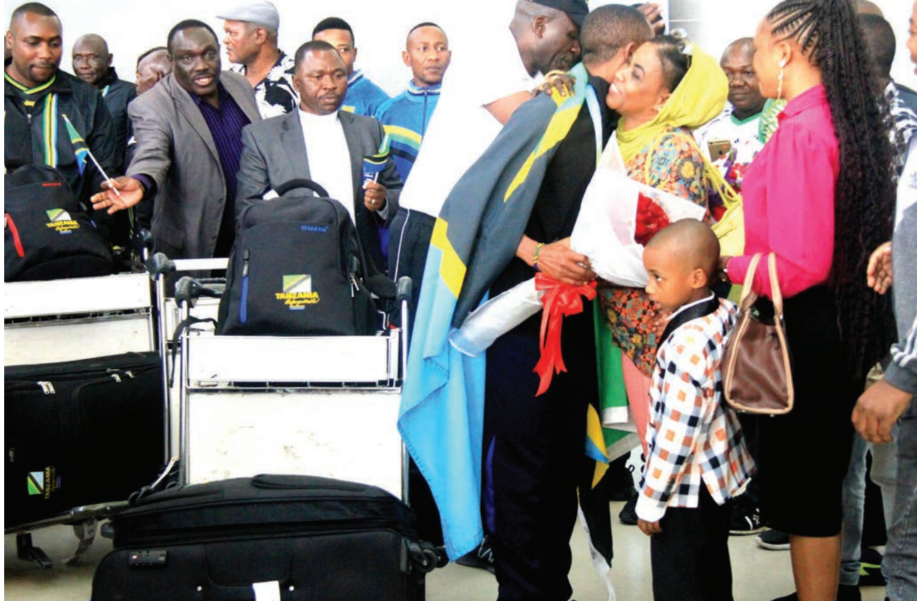
Wachezaji wa Timu ya Tanzania iliyoshiriki mashindano ya Jumuiya ya Madola nchini Uingereza, wakiwasili Uwanja wa Ndege wa Kimataifa wa Julius Nyerere jijini Dar es Salaam jana, huku wakipokelewa kwa bashasha na wenza wao, watoto, ndugu, jamaa na marafiki pamoja na wadau mbalimbali wa michezo nchini.