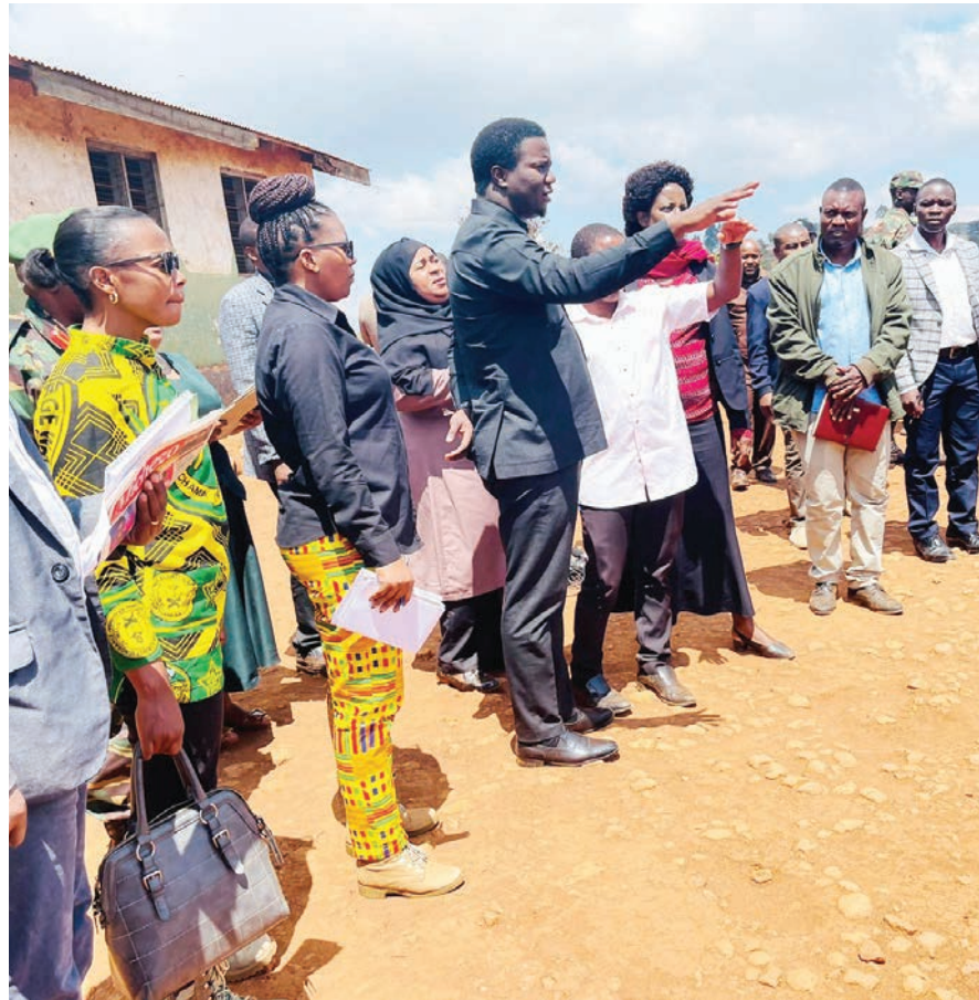
Naibu Waziri Ofisi ya Rais - TAMISEMI, David Silinde (aliyenyoosha mkono), alipozuru katika Shule ya Msingi Kiboriani juzi.

Alisema kuna mradi mwingine wa kuboresha elimu ya sekondari (Sequip) ambao una