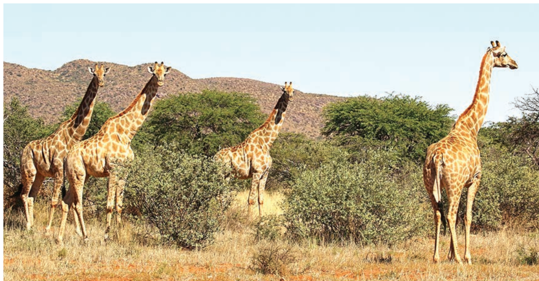
Twigia wa Afrika Magharibi wamebakia 600 pekee.

Wana madoa au mabaka tofauti na hao wa Afrika Magharibi yapo yanayofanana na nyota ambayo huanzia kwenye kwato hadi kichwani.