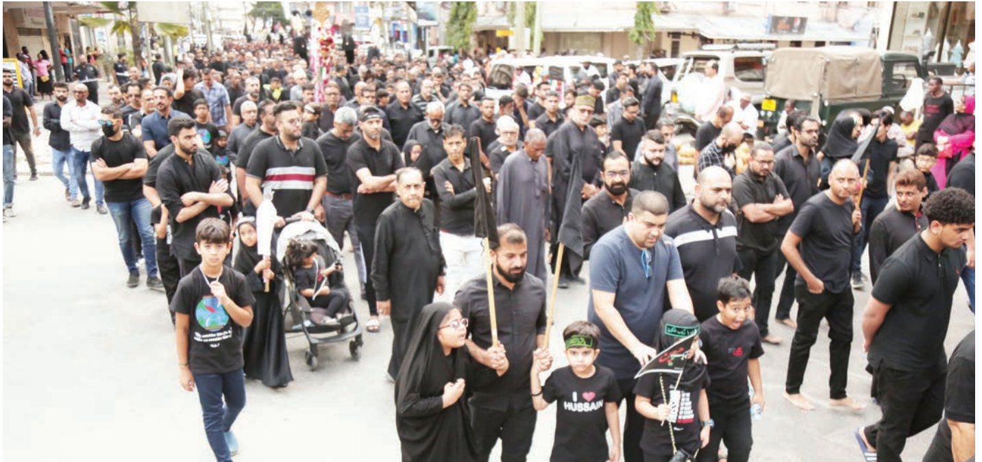
Waumini wa dhehebu la Shia, wakiwa katika maandamano ya Siku ya Ashura, jijini Dar es Salaam juzi, ikiwa ni kumbukizi ya kifo cha mjukuu wa Mtume Muhammad (SAW) Imam Hussein kilichotokea huko Karbalaa Iraq katika karne ya 7.