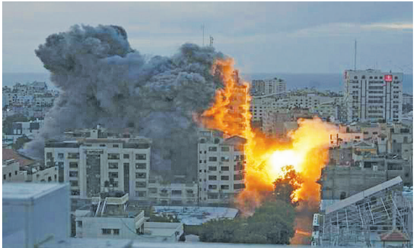
Wingu la moshi ulioambatana na moto uliotokana na bomu lililorushwa na ndege ya Israel katika eneo la Gaza jana asubuhi.