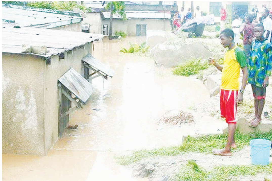
Wananchi wakiangalia makazi yao yaliyojaa maji, baada ya mafuriko katika eneo la Kigogo, Dar es Salaam.