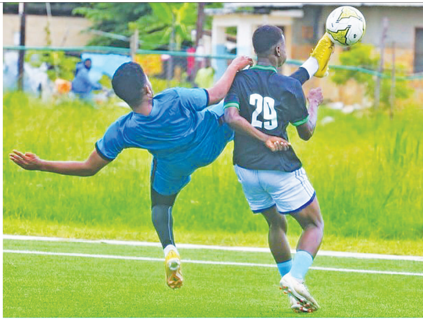
Wachezaji wa Timu ya Taifa ya Vijana ya Wanaume ya umri chini ya miaka 18 wakifanya mazoezi kujiandaa na michuano ya Afrika Mashariki na Kati (CECAFA U-18), itakayofanyika kuanzia Novemba 25 hadi Desemba 9, mwaka huu katika vituo viwili vya Kisumu na Kakamega, Kenya.