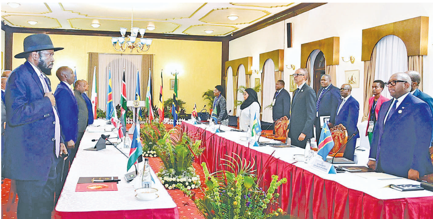
Viongozi wa Jumuiya ya Afrika Mashariki wakiwa katika moja ya mikutano yao hivi karibuni