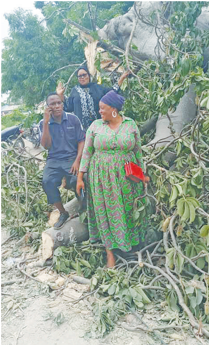
Viongozi wa Mtaa wa Machicha, Tabata, Dar es Salaam, wakikagua mti wa mbuyu ulioanguka na kuziba barabara.

Hapo Kelvina anasimulia, ghafla wakatokea vijana waendesha bodaboda wakishangilia, huku wakipiga honi kuzunguka maeneo ya makazi yao.