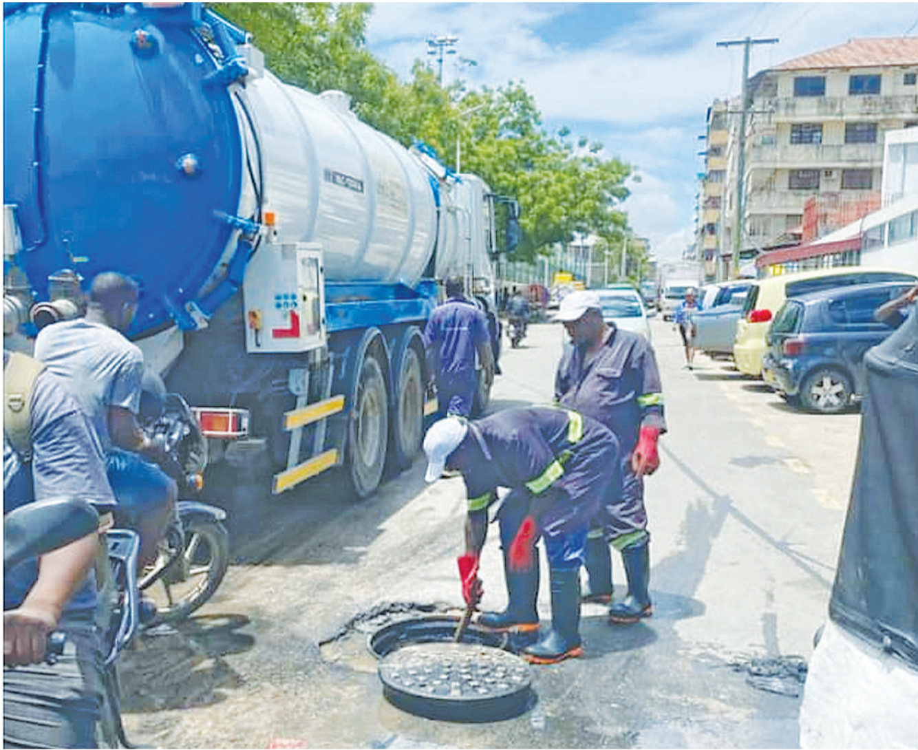
Mafundi wa Mamlaka ya Majisafi na Usafi wa Mazingira (DAWASA), wakisafisha miundombinu ya majitaka katika mitaa jijini Dar es Salaam jana, ili kuhakikisha inafanya kazi kwa ufanisi na kuepuka kuziba mara kwa mara kunakosababisha uchafuzi wa mazingira.

Kuanza kwa matumizi ya mita za maji za kulipia kabla ni sehemu ya mapinduzi makubwa ya teknolojia yaliyotekelezwa na DAWASA na yatakayasaidia katika kupunguza upotevu wa maji mitaani, kupunguza gharama za ufuatiliaji madeni kwa sehemu za mbali.