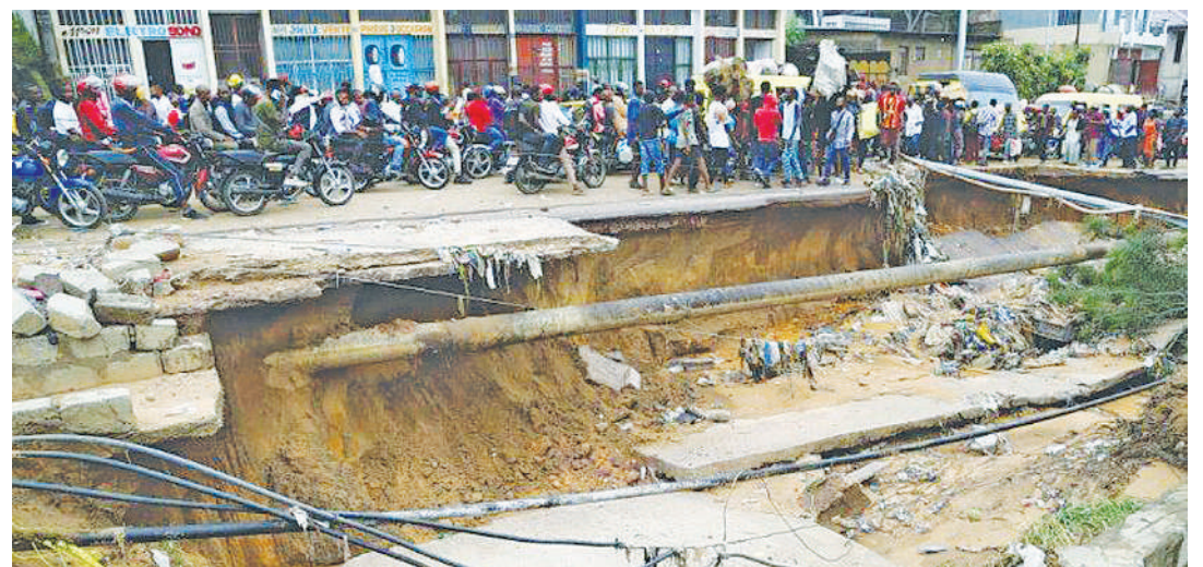
Barabara iliyoharibika vibaya kutokana na mafuriko nchini Jamhuri ya Kidemokrasia ya Kongo (DRC). PICHA ZOTE MTANDAO.

Inaelezwa, kingo za mito mikuba mitatu nchini humo zimepasuka na baadhi ya vijiji, barabara na njia za reli zimefunikwa na maji.