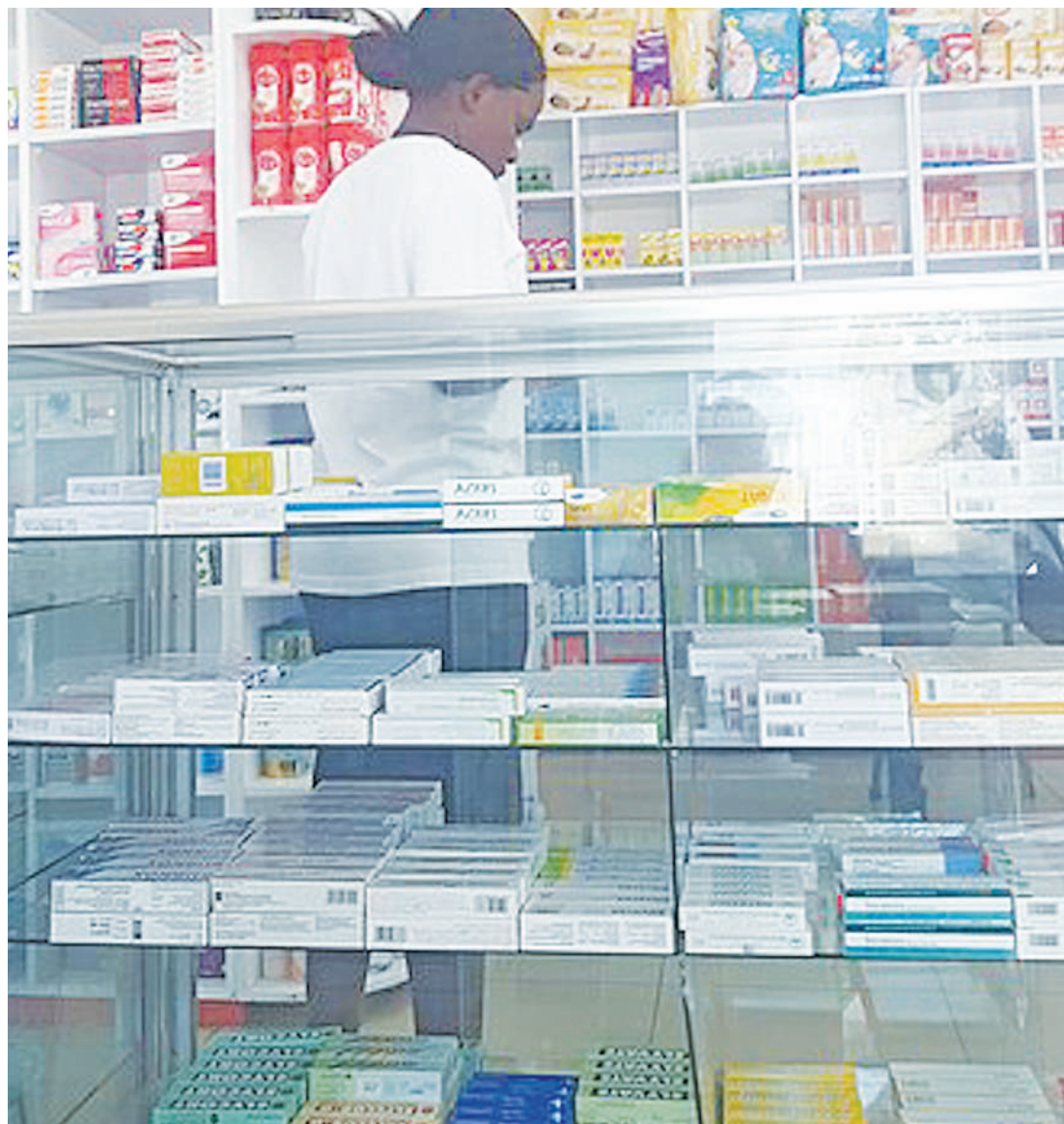
Shughuli zikiendelea ndani ya duka la dawa, Waziri Ummu Mwalimu, akisisitiza vigezo na masharti ni muhimu katika utendaji wa maeneo hayo.

Anatamka hilo katika tukio la kufunga Kongamano la Tatu la Usugu wa Vimelea dhidi ya Dawa na ku-