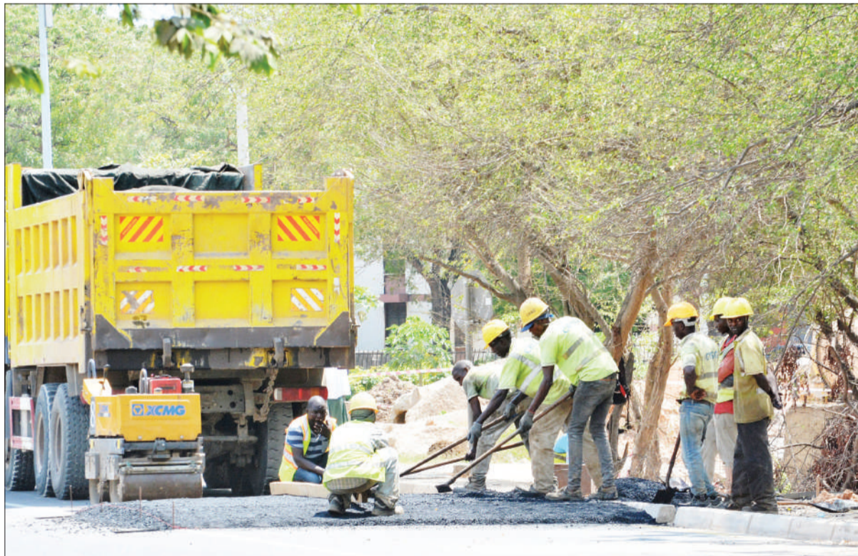
Mafundi wa kampuni ya ujenzi China Railway Seventh Group (CRSG), wakiweka matuta katika eneo la Shule ya Mama Salma Kikwete, eneo la Kijitonyama, jijini Dar es Salaam mwishoni mwa wiki, ili kuyafanya magari yapunguze mwendo.

Alisema halmashauri kwa kushirikiana na Shirika la Hifadhi za Taifa (TANAPA) walifanikiwa kupeleka wataalamu wanaohusiana na masuala mbalimbali ya sekta hiyo na kutoa elimu kwa wananchi wanaozunguka maeneo ya hifadhi.