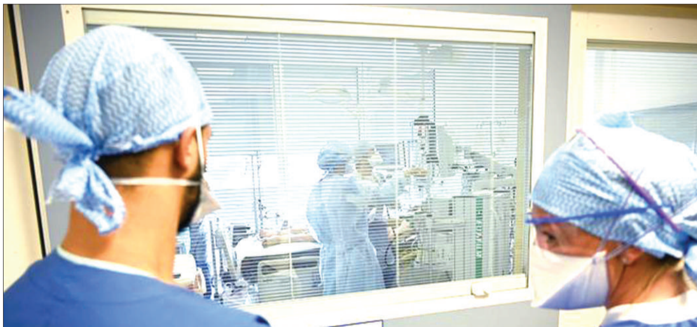
Madaktari wakiwa kwenye chumba cha wagonjwa mahututi wanaogua COVID-19 nchini Ufaransa. Idadi ya watu wanaoambukizwa virusi vya corona imeendelea kuongezeka barani Ulaya.