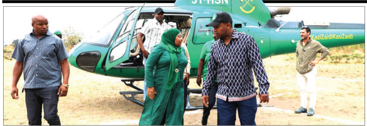
Mgombea mwenza wa urais kupitia CCM, Samia Suluhu Hassan, akiteremka kutoka kwenye helikopta 5Y-HSN ya chama hicho, alipowasili katika kijiji cha Kalakala Jimbo la Kwela, Sumbawanga Vijijini mkoani Rukwa jana, kwa ajili ya kampeni.