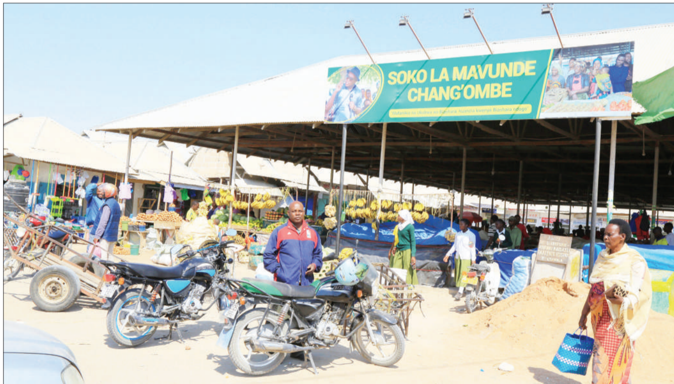
Baadhi ya wananchi wakitoka kununua mahitaji kwenye soko la Mavunde Chang'ombe, jijini Dodoma jana. Soko hilo, limeboreshwa na kuwa la kisasa baada ya ile la zamani lililokuwa na mapaa ya magunia kuondolewa.

“Kwa kushirikiana na nyinyi maaskofu, mashehe na wachungaji ni tumaini letu sisi kama wizara ya afya tunaamini elimu mtakayopewa hapa mtakuwa mabalozi kwa waumini wenu, ili na wao waone umuhimu wa kupata chanjo ili kujikinga na maambukizi ya magonjwa mbalimbali,” alisema.