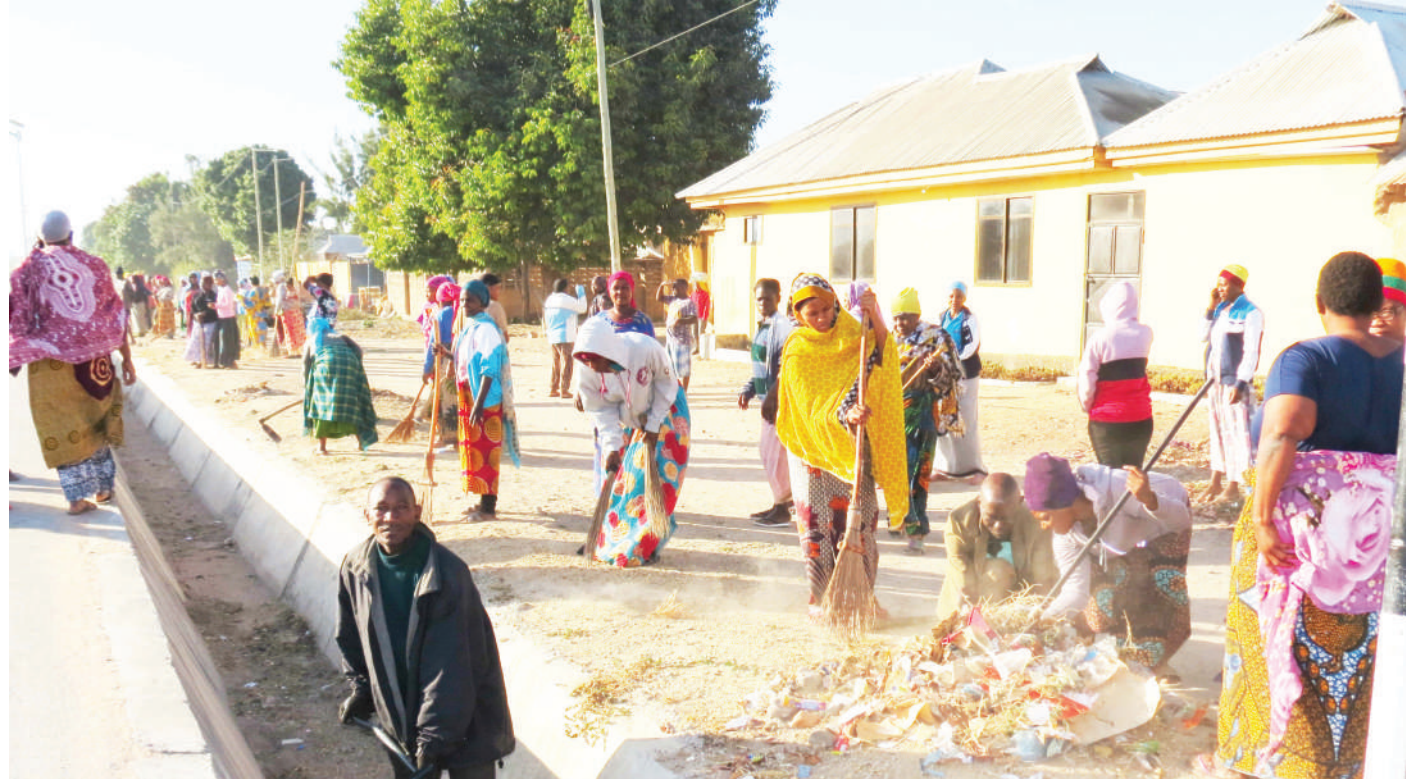
Wakazi wa Mtaa wa Mwaja Kata ya Chamwino katika Jiji la Dodoma wakifanya usafi kwenye mtaro ulioko kandokando ya barabara ya Wajenzi hadi Nkuhangu juzi.

“Tunaomba mwendelee kuwa mabalozi wazuri wa masuala ya rushwa, mmeanza mkiwa shule tunaomba mwendelee kuwa mabalozi hadi maeneo mnayoishi,” alisema Kibwengo.