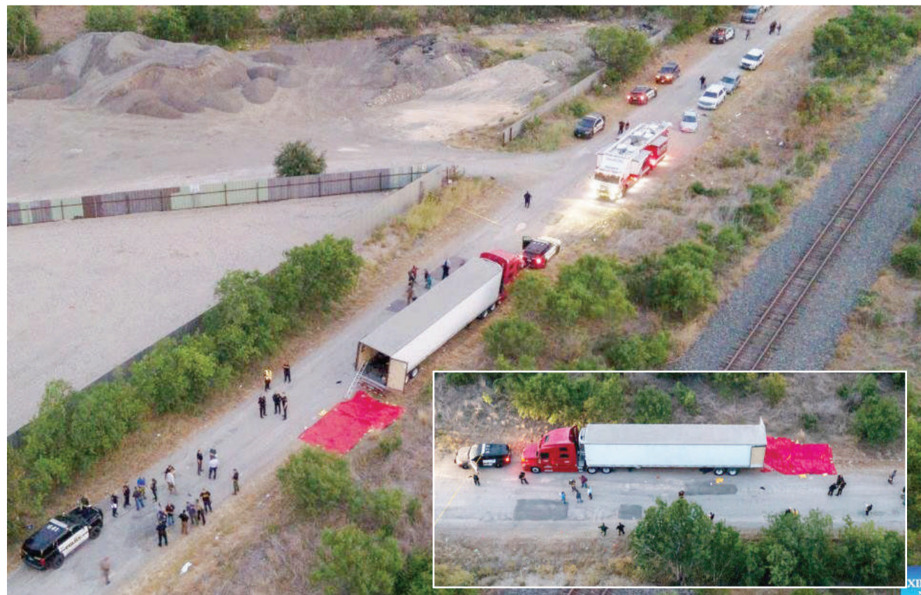
Mwonekano wa lori lililokuwa limebeba wahamiaji waliofariki dunia kutokana na joto huko Texas.

Nyingine ilitokea Uingereza Oktoba 23, 2019 ambapo jumla ya wahamiaji 39 wa Kivietnam walipatikana wamekufa kwenye trela la lori huko Essex. Na wanaume wanne walifungwa jela kwa kua bila kukusudia Januari 2021. BBC