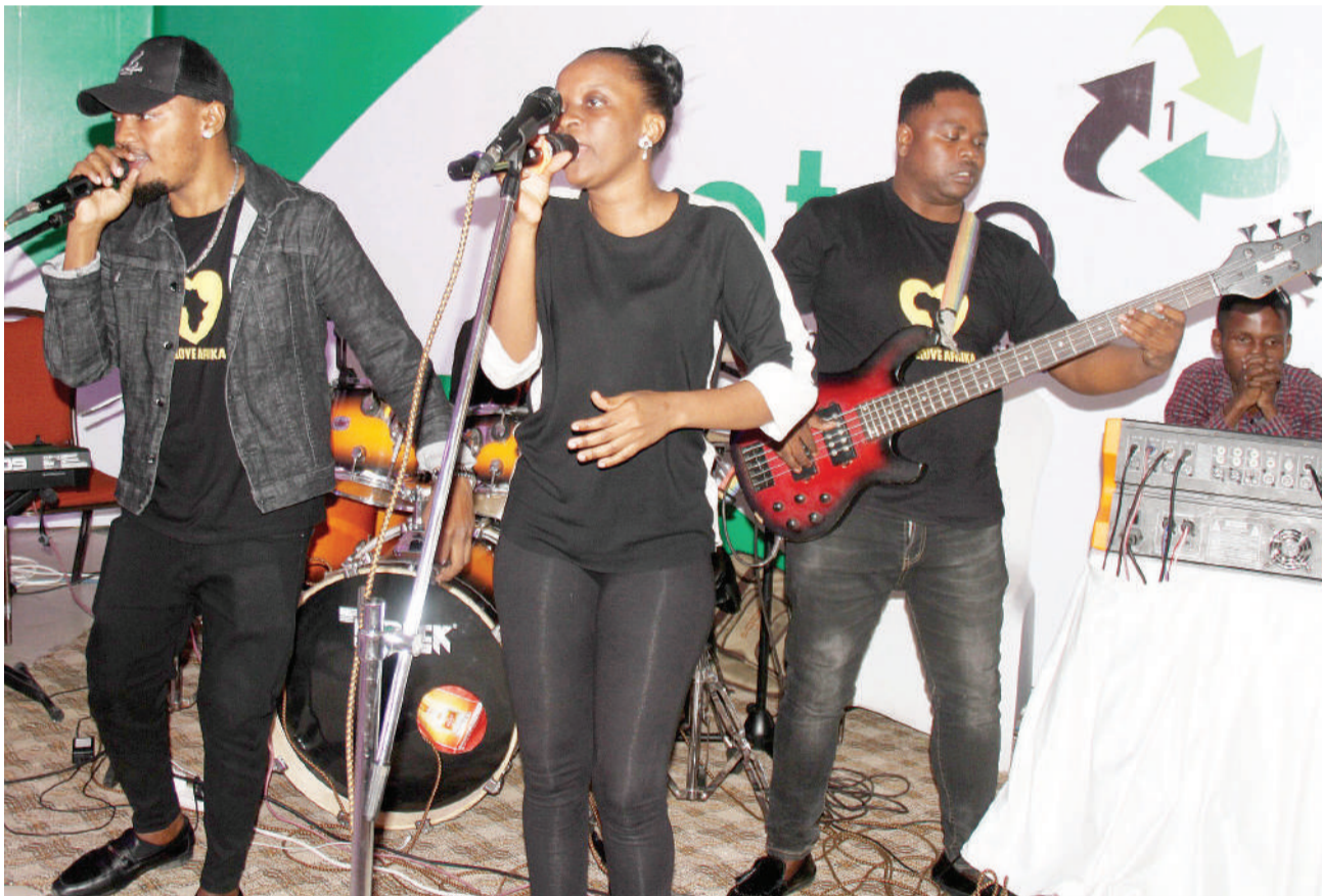
Wasanii wa Bendi ya Mwalimu wakitumbuza katika uzinduzi wa kampuni ya kutunza mazingira ya PETCO jijini Dar es Salaam jana.

Alisema kuhusu kupoteza fainali dhidi ya Yanga alisema imewaumiza wachezaji wote kwa sababu walipambana hadi dakika za mwisho na hatimaye kutolewa katika hatua ya penalti.