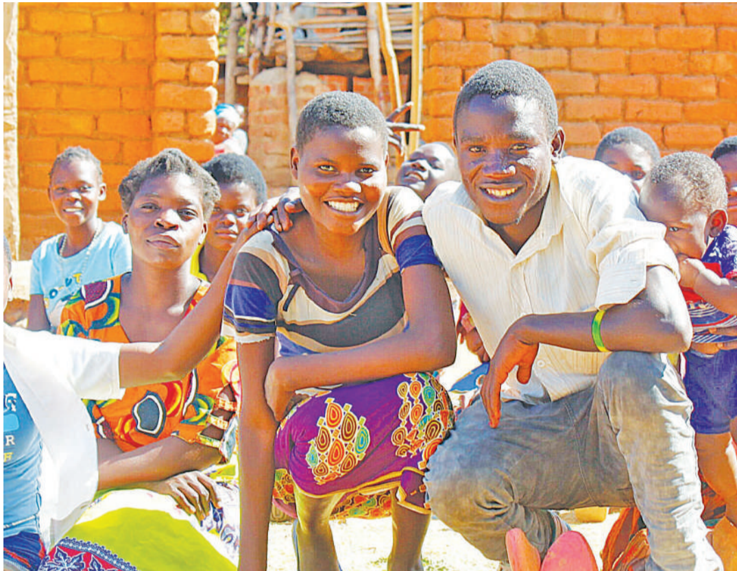
Vijana katika mjumuiiko wao. Ni mahali sahihi pa kupatiwa elimu ya afya yao na ngono.

Msomi huyo wa afya ya akili, mwenye umri ulioko 'mitaa ya ujana' na uzoefu wa kutumika katika Hospitali ya Afya ya Akili Mirembe, jijini Dodoma, ana ushauri kwa watoa huduma za afya, watumie idhaa zinazopendwa na vijana za redioni, kuwafikisha elimu hiyo