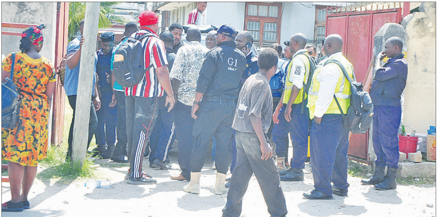
Mabaansa wa Kampuni ya Bilo Star Debt Collection Co. Ltd, wakiwatoa nje wapangaji waliokuwa wakiishi katika nyumba kitalu namba 266, Barabara ya Ally Khan, eneo la Upanga Magharibi, jijini Dar es Salaam jana inayosemekana kuwa na mgogoro. Habari Uk. 3.