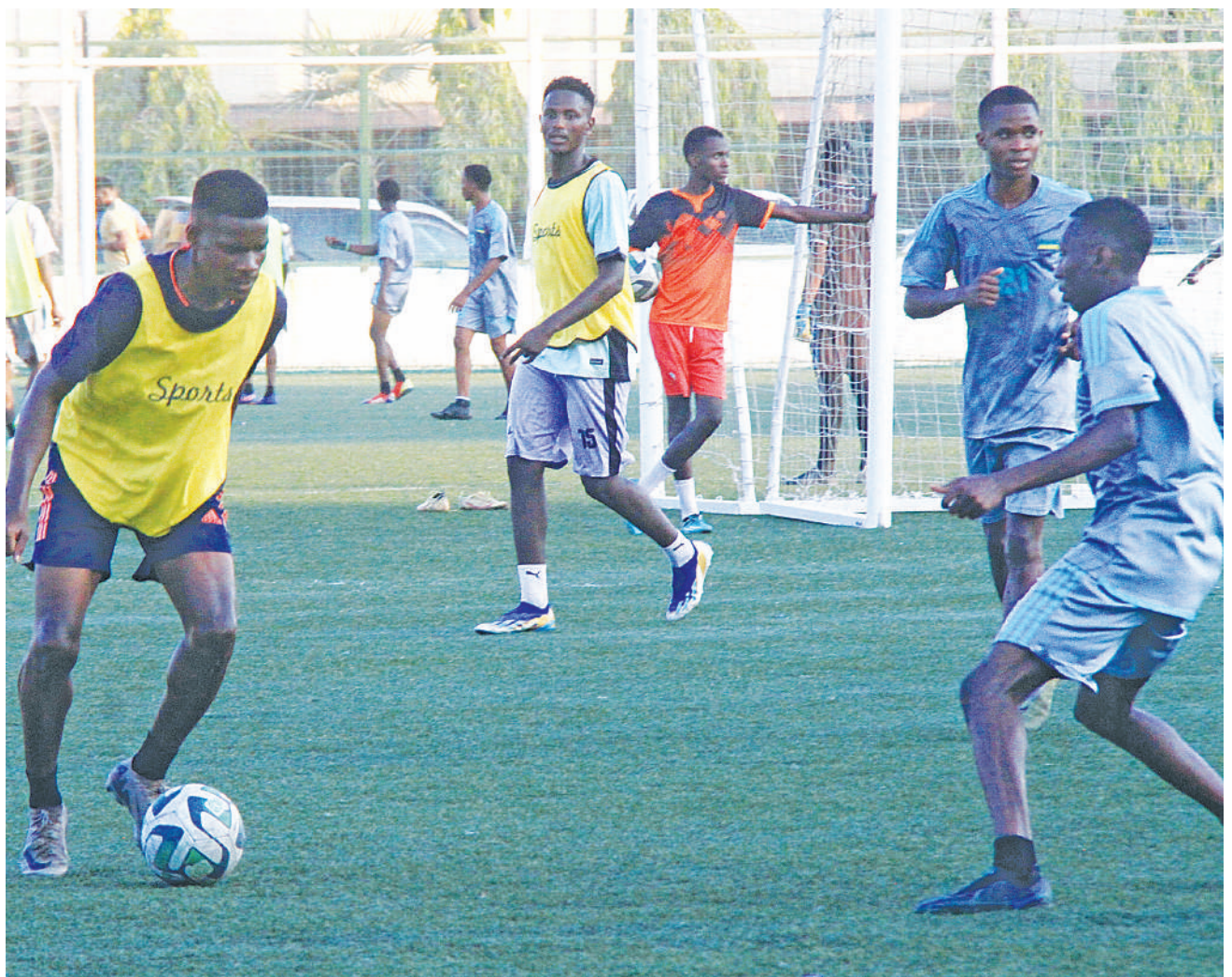
Vijana wa Kituo cha Michezo cha Jakaya Kikwete cha jijini Dar es Salaam wakiwania mpira wakati wa mazoezi yaliyofanyika kwenye viwanja vya kituo hicho juzi.

Mchezo unaofuata Taifa Stars watacheza dhidi ya vinara Congo kabla ya kuanza mzunguko wa pili kusaka nafasi ya kushiriki fainali hizo za Morocco.