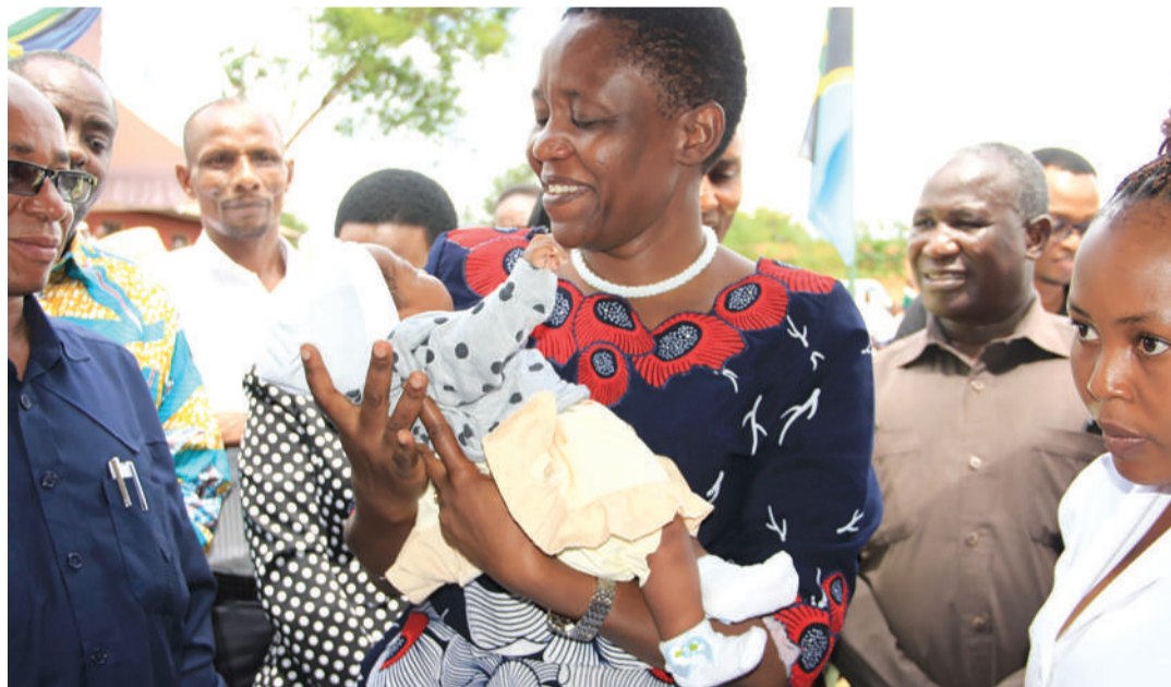
Dorothy Gwajima, alipokuwa Waziri wa Afya, akiwa amembeba mtoto katika Siku ya Chanjo kwa Watoto Kitaifa.

Kwa mujibu wa WHO, 'Huduma ya Afya ya Kimsingi' unatajwa "Utaratibu unaoangazia afya na