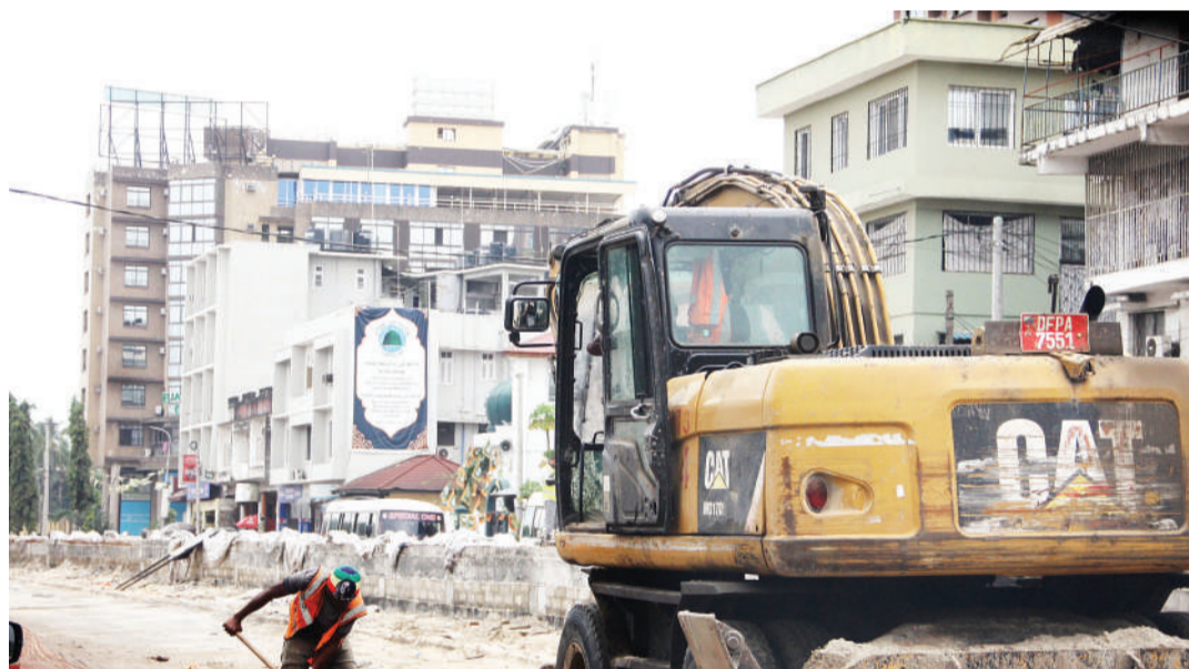
Fundi wa Kampuni ya Sinohydro, akiendelea na maandalizi ya ujenzi wa miundombinu ya mabasi yaendayo haraka (BRT), katika Barabara ya Bibi Titi Mohamed, jijini Dar es Salaam, mwishoni mwa wiki.

"Mpango huo uliowezeshwa na Rais umesaidia kuwapatia wagonjwa wenye matatizo na hapa JKCI tunafanya operesh- eni nne hadi tano kwa siku. Kwa wagonjwa wa nje (OPD), tunaya- ona takribani wagonjwa 500 kwa siku," alisema Dk. Kisenge.