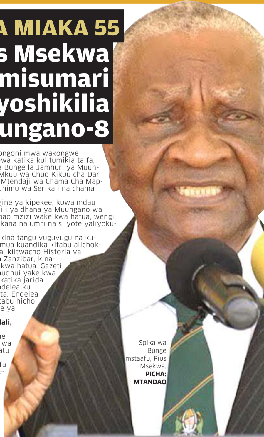
Spika wa Bunge mstaafu, Pius Msekwa.

SADC inapofungua fursa za maendeleo Tanzania