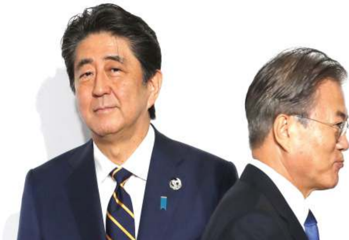
Rais wa Korea Kusini, Moon Jae-in (kulia) na Waziri Mkuu wa Japan, Shinzo Abe, kwenye Mkutano wa G-20 jijini Osaka, Japan, Juni 28, 2019.

Licha ya kuwa Korea Kusini haina wingi wa watu kama mataifa yanayoizunguka, uwezo wake wa kununua ni wa hali ya juu.