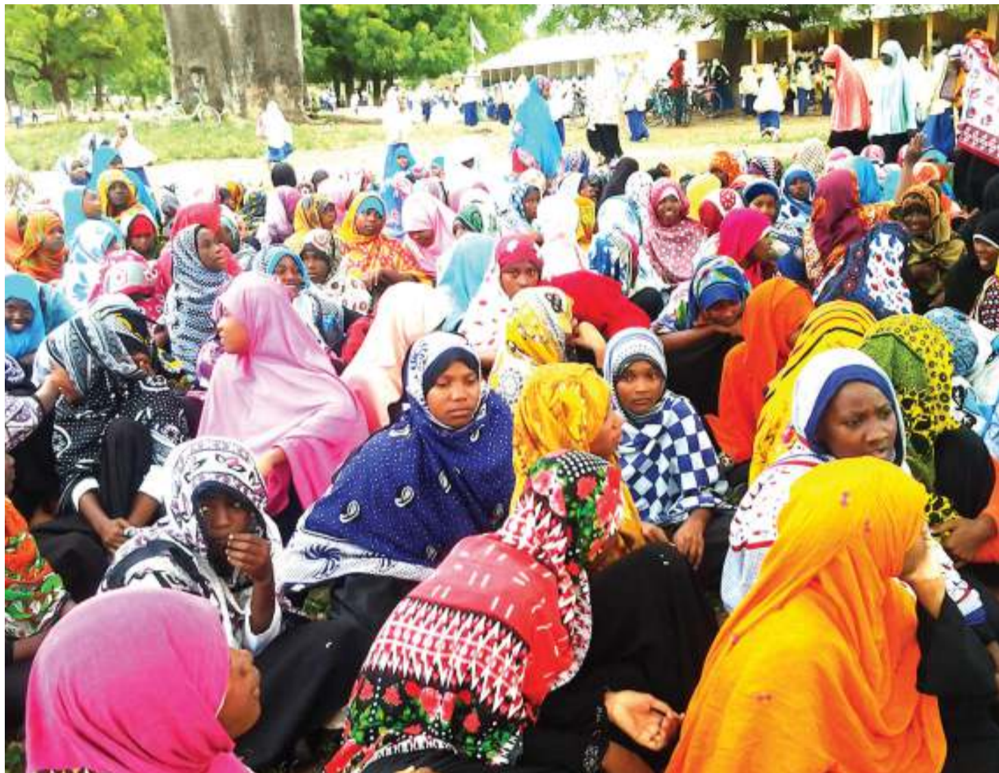
Wanawake wa shehia za Majenzi na Shumba Mjini Wilaya ya Micheweni, wakiwa katika mkutano wa kuhamasishwa kugombea uongozi katika Shule ya Sekondari Micheweni wiki iliyopita.