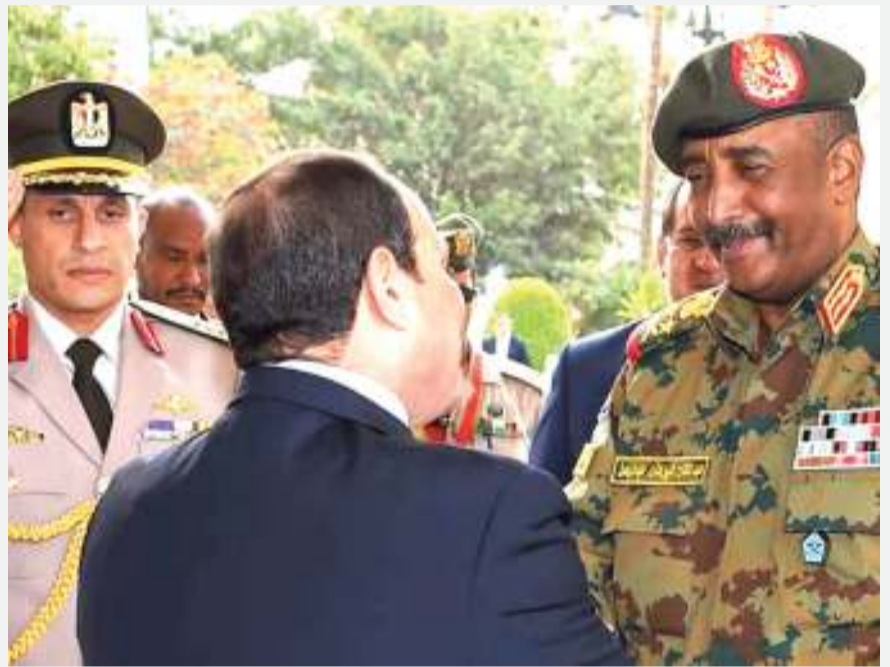
Rais Abdel Fattah al-sisi wa Misri (kushoto), akiwa na Kiongozi wa Baraza la Mpito la Kijeshi la Sudan, Jenerali Abdel Fattah al-Burhan (kulia), walipokutana jijini Cairo nchini Misri.

Ndiyo hali ya Misri ikazorota tena, jeshi likaingilia kati kurudisha