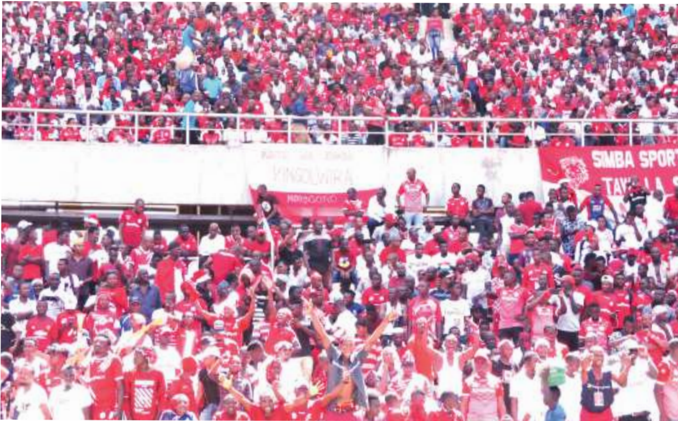
Baadhi ya mashabiki wa Simba waliohudhuria tamasha la kilele cha SportPesa Simba Wiki Uwanja wa Taifa jana.