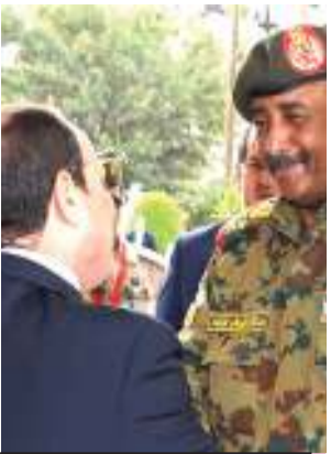
Majenerali Sudan wawazidi raia kete mzunguko wa kidiplomasia

Wanawake Dar waungana kuwania nafasi za uongozi