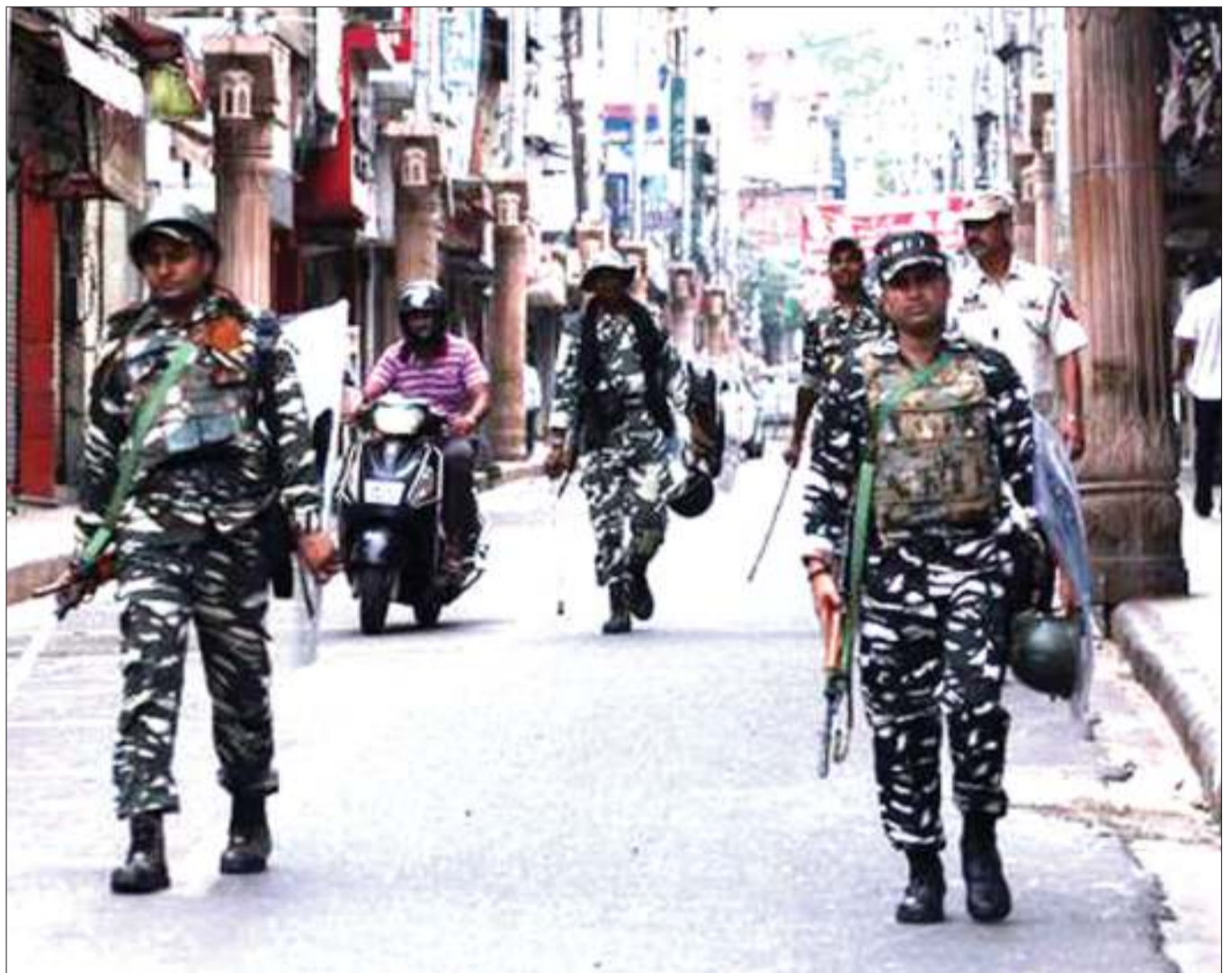
Wanajeshi wa India wakifanya doria kwenye mitaa ya Jimbo la Kashmir.