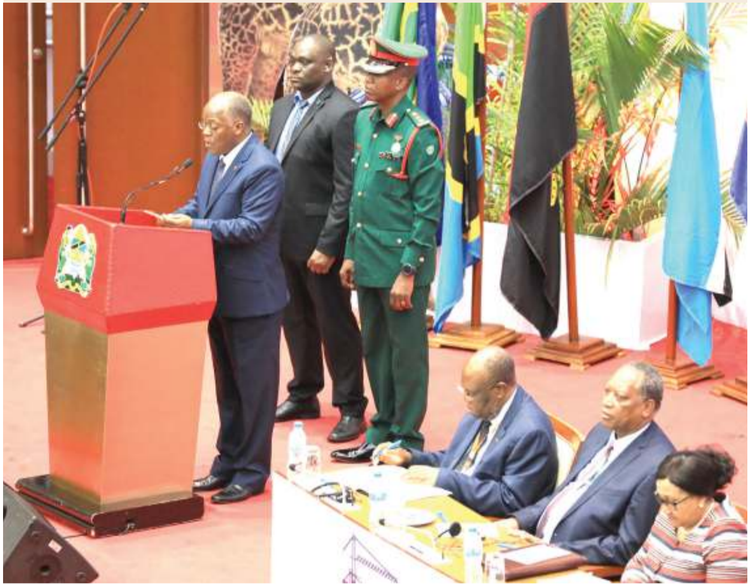
Rais John Magufuli (mbele ya jukwaa), akifungua Maonyesho ya SADC juzi jijini Dar es Salaam.

mitaji na biashara zao kulifikia soko la SADC.