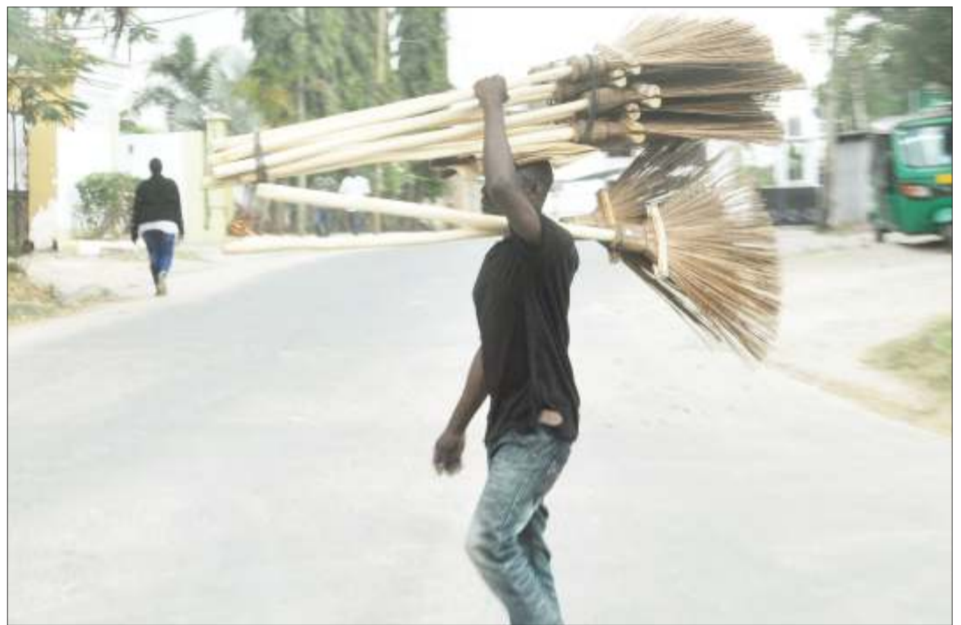
Mchuzi wa mifagio akisaka wateja kando ya Barabara ya Mwai Kibaki, katika eneo la Mikocheni A, jijini Dar es Salaam jana. Fagio moja linauzwa kwa bei ya 2,500/-

Kufanya hivyo ni kosa kisheria kinyume cha kifungu cha 139 (1) (a) na (2) (a) cha sheria namba 6 ya mwaka 2018 Sheria ya Serikali ya Mapinduzi Zanzibar.